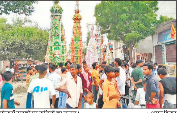
गोला में सड़कों पर ताजियों का जुलूस।

की भीड़ देखकर दुकानदार ने 300 से 350 रुपये प्रति बोरी खाद बिक्री शुरू कर दी। सोशल मीडिया पर मामला वायरल होते