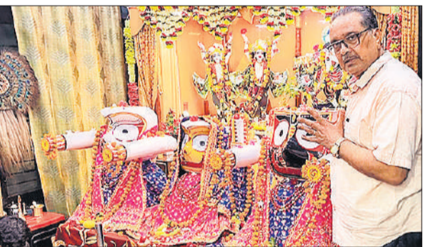
इस्कॉन मंदिर में दर्शनाई रखे भगवान जगन्नाथ, बहन सुभद्रा और भाई बलभद्र के विग्रह।

के लिए कुछ प्रपत्रों में हेराफेरी की गई है। इस संबंध में जब सूचना का अधिकार के तहत सूचनाएं मांगने पर पंचायत सचिव ने सूचनाएं नहीं दीं। डीएम और सीडीओ के निर्देश पर भी सूचनाएं नहीं दीं। राज्य सूचना आयोग में अपील की। आयोग के बार-बार निर्देश देने के बाद भी पंचायत सचिव वहां उपस्थित नहीं हुए।