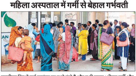
एमसीएच विंग में पर्चा काउंटर पर न तो पंखे हैं और न ही कूलर। भीषण गर्मी और हीटवेव के बावजूद यहां व्यवस्था का घोर अभाव है। गर्भवती महिलाएं नवजातों को गोद में लिए गर्मी में पसीने से तरबतर होकर कतार में पर्चा बनवाने को मजबूर हैं, जबकि उपमुख्यमंत्री बृजेश पाठक पहले ही काउंटरों पर कूलर-पंखे लगाने का आदेश दे चुके हैं, जिसे मेडिकल कॉलेज प्रशासन ने नजरअंदाज कर दिया है।

अमृत विचार : भले ही स्वास्थ्य सेवाओं में सुधार को लेकर सख्त निर्देश दिए जाएं, लेकिन जमीनी हकीकत नहीं बदल सकती है। जिला अस्पताल को मेडिकल कॉलेज का दर्जा तो मिला, लेकिन सुविधाएं अभी भी मंशा के मुताबिक नहीं मिल पा रही हैं। स्वशासी राज्य चिकित्सा महाविद्यालय संबद्ध अस्पतालों में हालात अभी भी बदतर हैं। यहां न मरीजों की सुनवाई है, न ही व्यवस्था सुधारने को लेकर जिम्मेदारों की कोई फिक्र। महिला अस्पताल से लेकर पुरुष ओपीडी तक अव्यवस्था की लंबी फेहरिस्त है, जिसमें मरीजों की तकलीफें, गर्मी में बेहाल इंतजार और दवा वितरण में खेल शामिल है। सोमवार को जब पड़ताल की गई तो व्यवस्थाएं बदहाल मिलीं। लाइन में परेशान मरीज, नहीं बड़े पर्चा काउंटर: कई बार