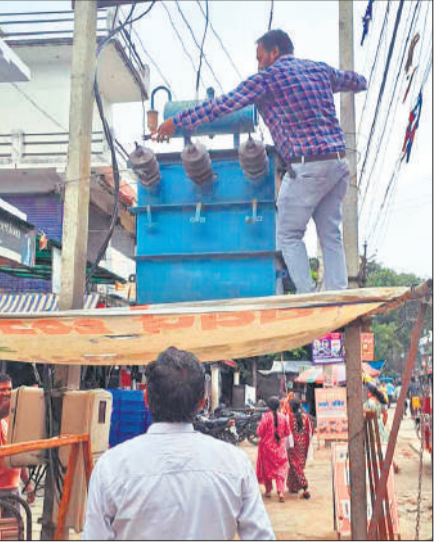
इनकार मार्केट के पास ट्रांसफार्मर ठीक करता कर्मचारी।

चौराहा, अग्रवाल सभा, बेनी चौधरी, डालचंद, आसफजान, साहूकारा आदि इलाकों में बिजली गुल हो गई। बल्लभगनर कॉलोनी में बंच केबिल टूट गई। इसका सुधार करने के लिए देर रात 12 बजे टीम भेजी गई। एकता नगर कॉलोनी में पूरी रात बिजली नहीं आई, जिससे लोग परेशान होते रहे। शहर की एकता नगर कॉलोनी में पूरी रात बिजली नहीं आई। कॉलोनीवासियों का कहना है कि उन्होंने पावर कॉरपोरेशन के अधिकारियों से शिकायत की। मगर, आशवासन के सिवाय कुछ नहीं मिला। रात भर कॉलोनी के लोग भीषण गर्मी में परेशान होते रहे। विद्युत विभाग की लापरवाही का आलम इस कदर रहा कि लोगों ने बिजली विभाग के गुप्तों पर भी समस्या के समाधान के