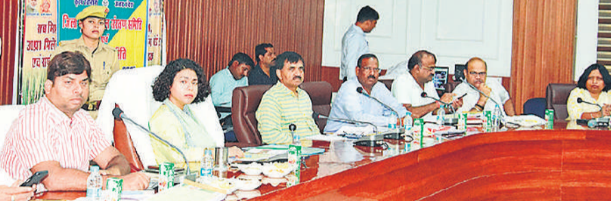
कलेक्ट्रेट सभागार में बैठक करतीं डीएम दुर्गा शक्ति नागपाल।