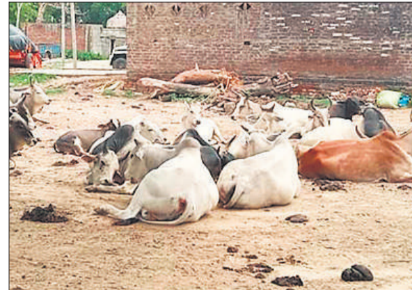
बिलसंडा के गांव पंडरी मरौरी में डेरा डाले छुट्टा गोवंश।

अमृत विचार: छुट्टा पशुओं की समस्या से जूझ रहे किसानों को आखिर कब निजात मिलेगी। छुट्टा पशुओं से किसानों को अपनी फसलों को बचाने के लिए पूरी रात खेतों में रहकर रखवाली करनी पड़ती है। वहीं छुट्टा पशुओं से आए दिन बाइक सवार लोगों के टकराने से हादसे भी हो रहे हैं गांव पंडरी मरौरी में गोशाला संचालित है। इसके बावजूद बड़ी संख्या में गोवंश गांव की सड़कों पर छुट्टा घूम रहे हैं, जिसको लेकर किसान परेशान है, क्योंकि मौजूदा वक्त में खेतों में साठा धान और गन्ने की फसल खड़ी है, जिस कारण किसानों को अपनी फसलों को बचाने के लिए खेतों में ही समय बिताना पड़ रहा है। आलम यह है कि जिन गांवों में गोशालाएं बनी हुई हैं, वहां पर भी भारी तादाद में छुट्टा पशुओं का झुंड घूमता दिखाई दे रहा है। किसानों को जहां फसलों की रखवाली करनी पड़ रही है। वहीं छुट्टा पशु पूरे दिन सड़कों