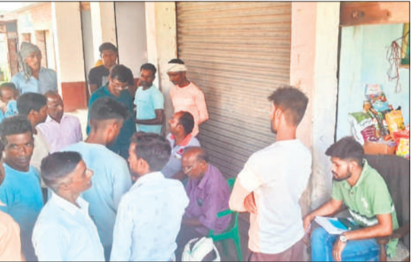
खाद की दुकान पर यूरिया लेने के लिए मौजूद किसान।

अमृत विचार: जिले में रैक पहुंचते ही यूरिया की फिर से कालाबाजारी शुरू हो गई। किसानों ने कस्बा स्थित एक खाद की दुकान पर 300 से 350 रुपये में यूरिया बेचे जाने की शिकायत की। इस पर तहसील प्रशासन ने कृषि विभाग के सीएमएस को बैठकर 266 रुपये में यूरिया बिकवाई। सीडीओ की तमाम कवायदों के बावजूद जिले में खाद की कालाबाजारी पर अंकुश नहीं लग रहा है। इसकी वजह कालाबाजारी करने वालों के खिलाफ सख्त कार्रवाही न होना है। यही कारण है कि यूरिया मिलते ही दुकानदारों ने 300 से 350 रुपये में बिक्री करनी शुरू कर दी। बेलघांम रोड स्थित बालाजी फर्टिलाइजर किसान समृद्धि केंद्र पर सोमवार को खाद लेने के लिए किसानों की लाइन लग गई। किसानों