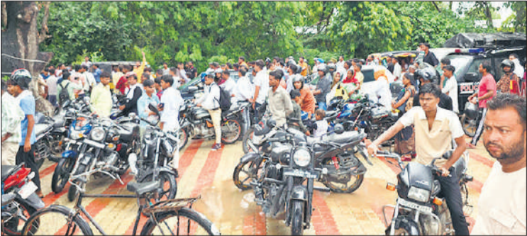
● अमृत विचार टनकपुर हाईवे पर लगी वाहनों की कतार