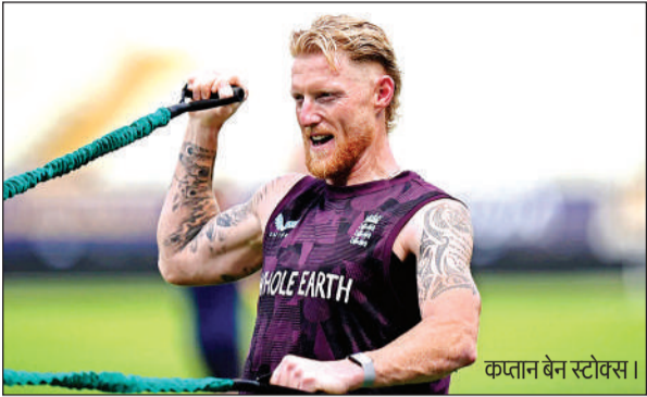
कप्तान बेन स्टोक्स।