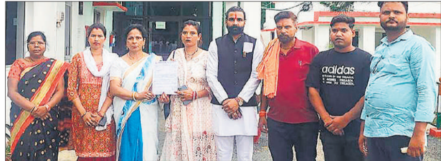
एसपी को ज्ञापन देने पुलिस लाइन पहुंचे अखिल भारत हिंदू महासभा कार्यकर्ता।