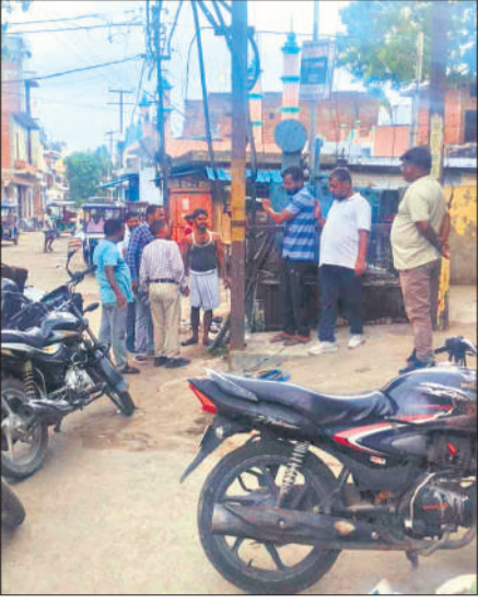
शहर के एक स्थान पर सुधार करने पहुंची टीम।

शहर की बिजली व्यवस्था को बेहतर बनाने का सिर्फ दावा हो सका है। धरातल पर बंच केबिल पड़ने के बाद भी हालात सुधर नहीं सके हैं। रविवार का शहर में ताजियों का जुलूस निकाला जाना था। ऐसे में दिन में सप्लाई बंद रही थी। इसके बाद रात करीब 8 बजे सप्लाई चालू करते ही फाल्ट होना शुरू हो गए। अशोक कॉलोनी में बंच लाइन में आग लग गई, जिससे अफसरा तफरी मच गई। मार्ग से गुजर रहे राहगीर भागने लगे। नीचे खड़े वाहनों पर चिंगारी गिरी तो आग लगने का खतरा सताने लगा। इसकी सूचना देकर सप्लाई बंद कराई गई, जिसके बाद टीम पहुंची और सुधार किया। इसके बाद एकता सरोवर से नौगांव पकड़िया जाने वाले मार्ग पर फाल्ट हो गया और बत्ती गुल हो गई। रात करीब 10 बजे इसका सुधार हो सका। शरीफ खां