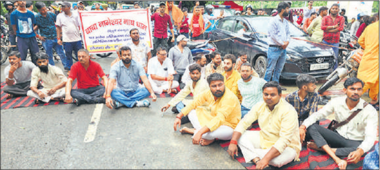
टनकपुर हाईवे पर धरना प्रदर्शन करते पुरोहित विहिप के पदाधिकारी व अन्य लोग।

टनकपुर हाईवे पर कचहरी से आगे की तरफ डायमंड सिटी कॉलोनी बनाई जा रही है। इसके प्लाट की बिक्री भी तेजी से चल रही है। अभी कुछ दिन पहले ही कॉलोनी की एक शिकायत हुई थी, जिसमें कॉलोनाइजर पर मजरा शरीफ को हटाने का आरोप लगाया गया था। इसके बाद परिसर में ही स्थित बाबा नागेश्वर नाथ धाम मंदिर के रास्ते को लेकर चला आ रहा विवाद सोमवार को गहरा