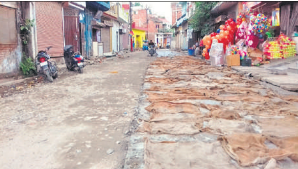
रेलवे स्टेशन रोड पर किया जा रहा सड़क निर्माण।