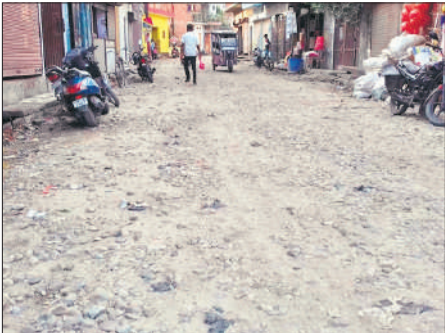
गोला में उखड़ी पड़ी स्टेशन रोड।