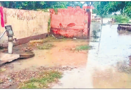
बिलसंडा के गांव पंडरी मरौरी में दलित बस्ती की गली में हुआ जलभराव।