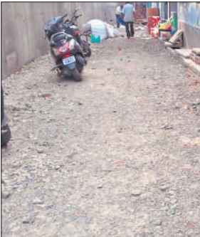
पौराणिक शिव मंदिर जाने वाले रास्ते पर बिछे पत्थर।