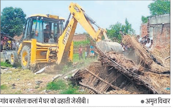
गांव बरसोला कलां में घर को ढहाती जेसीबी।