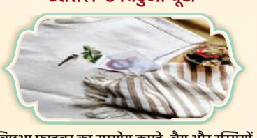
उत्तराखण्ड बिछुआ बूटी

उत्तराखण्ड अपनी बेहतरीन लकड़ी की नक्काशी के लिए प्रसिद्ध है, कुशल कारीगर लकड़ी को जटिल तरीके से तराश कर सुंदर डिजाइन और रूपांकन बनाते हैं।