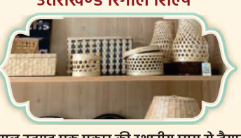
उत्तराखण्ड रिंगल शिल्प

रावण मुखौटे लकड़ी से उकेरे जाते हैं और पारंपरिक लोक नृत्यों और सांस्कृतिक प्रदर्शनों में उपयोग किए जाते हैं।