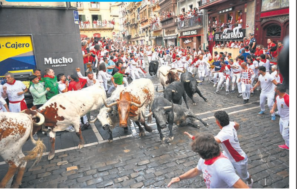
स्पेन के पैम्पलोना में सैन फर्माना उत्सव में बैल दौड़ के दूसरे दिन सेबाडा गागो खेत से बैलों के साथ दौड़ते लोग। स्पेन में यह एक लोकप्रिय उत्सव है जो पैम्पलोना शहर में होता है। इस उत्सव में लोग बैलों के एक समूह के सामने दौड़ते हैं जो उन्हें बुलरिंग तक ले जाने के लिए शहर की संकरी गलियों से होकर गुजरते हैं। इस खतरनाक खेल में हर साल कई लोग घायल हो जाते हैं, कुछ की जान भी चली जाती है।