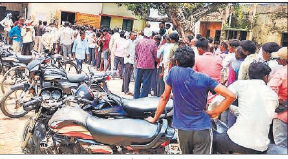
रोशननगर समिति पर खाद लेने वालों की लगी लाइन।

सैकड़ों की संख्या में महिलाएं और पुरुष लाइन में लगाकर अपनी बारी की प्रतीक्षा करने लगे। एक-दो