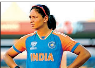
कप्तान हरमनप्रीत कौर।

● पांच मैचों की श्रृंखला में भारत 2-1 से आगे चल रहा, चौथा मैच रात 11 बजे से