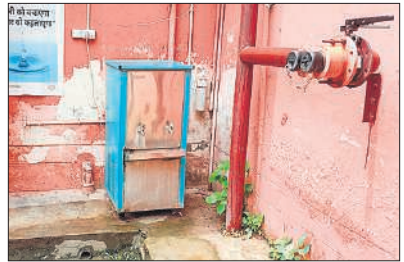
सीएचसी जहानाबाद में बंद पड़ा वाटर कूलर।