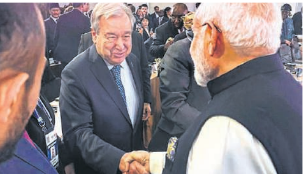
ब्राजील में प्रधानमंत्री नरेंद्र मोदी संयुक्त राष्ट्र महासचिव एंटोनियो गुटेरेस के साथ।