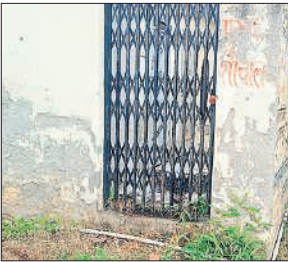
सीएचसी जहानाबाद में शौचालय की हालत जर्जर।

ललौरीखेड़ा ब्लॉक के तहत जहानाबाद कस्बे में सीएचसी का संचालन किया जा रहा है। जहां जिम्मेदार मूलभूत सुविधाओं से लैस होने का दावा कर रहे हैं। मगर स्थिति यह है कि यहां पर डॉक्टरों की कमी के साथ मरीजों को कैंपस में मिलने पर सुविधाएं तक नहीं मिल पा रही हैं। डेढ़