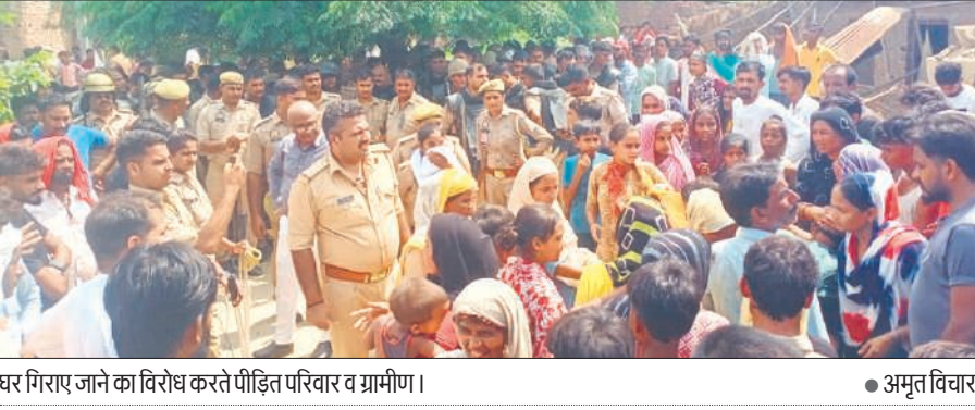
घर गिराए जाने का विरोध करते पीड़ित परिवार व ग्रामीण।