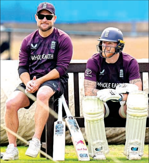
इंग्लैंड के कोच ब्रेंडन मैकुलम व कप्तान बेन स्टोक्स।

उन्होंने कहा यह मैच शानदार होगा, लेकिन अगर पिच में जान रही तो यह और भी जरूरदस्त होगा। 2018 में लॉर्ड्स की हरियाली भरी पिच पर भारत बुरी तरह फंस गया था, लेकिन चार साल पहले टीम ने यहां पर एक रोमांचक टेस्ट मैच भी जीता था। भारत बर्मिंघम में आराम