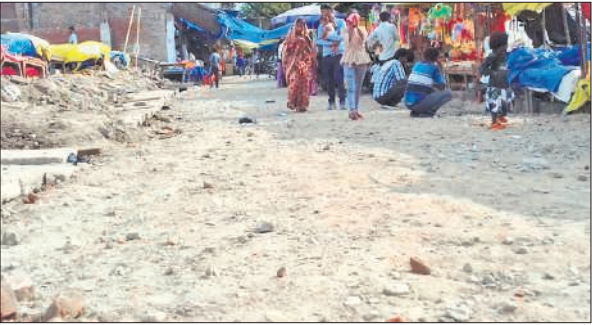
मूनलाइट स्टैडियो वाली गली निर्माण के लिए पड़े पथर।

मार्ग का कार्य सुचारू रूप से पूर्ण करा लें। विधायक के निरीक्षण के