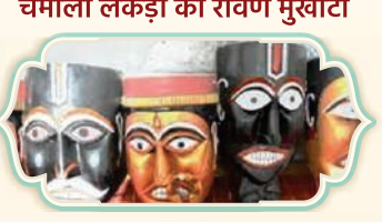
चमोली लकड़ी का रावण मुखौटा

उत्तराखण्ड के कारीगर तांबे का उपयोग करके बर्तन, सजावटी सामान और धार्मिक कलाकृतियां जैसी विभिन्न वस्तुएं बनाते हैं।