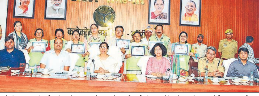
कलेक्ट्रेट सभागार में समीक्षा बैठक में प्रमाण पत्र के साथ मौजूद हरियाली को बढ़ावा देने वाले शहर के समाजसेवी।