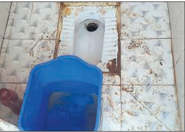
पानी न आने से शौचालय में बॉल्टी में रखा पानी।