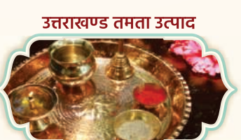
उत्तराखण्ड तमता उत्पाद

ऐपण एक पारंपरिक लोककला है, जिसे चावल के पेस्ट या चाक का उपयोग करके तैयार किया जाता है। धार्मिक और सांस्कृतिक समारोहों के दौरान यह लोककला फर्श, दीवारों या आंगनों पर देखा जाता है।