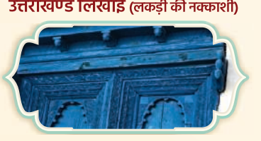
उत्तराखण्ड लिखाई (लकड़ी की नक्काशी)

थुलमा केवल उत्तराखण्ड में भोटिया समुदाय द्वारा भेड़ या याक के ऊन का उपयोग करके हाथ से बुना जाता है। ये केवल अपनी गर्माहट, टिकाऊपन के लिए जाने जाते हैं।