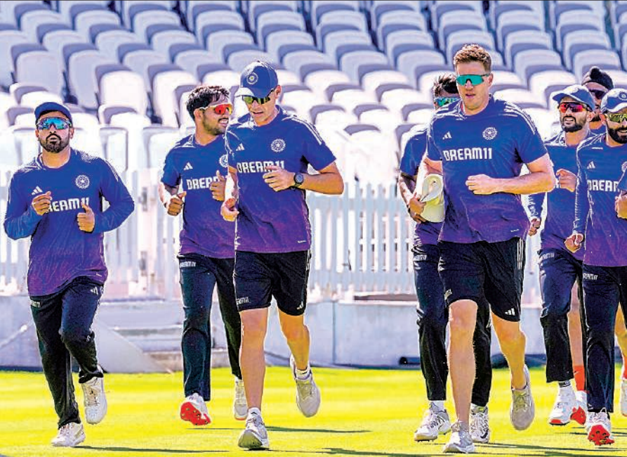
लंदन के लॉर्ड्स क्रिकेट ग्राउंड पर प्रशिक्षण सत्र के दौरान भारतीय खिलाड़ी।

स्टोक्स की बल्लेबाजी फॉर्म में गिरावट आई : आर्थरन लंदन : पूर्व कप्तान माइकल आर्थरन ने एजबस्टन में दूसरे टेस्ट में मेजबान टीम की भारत के हाथों शर्मनाक हार के बाद कहा कि बेन स्टोक्स की बल्लेबाजी फॉर्म में पिछले कुछ वर्षों में लगातार गिरावट आई है, विशेषकर ऐसे समय में जब उन्हें आलोचनाओं का सामना कर रही इंग्लैंड टीम की आगे बढ़कर अगुवाई करनी चाहिए।