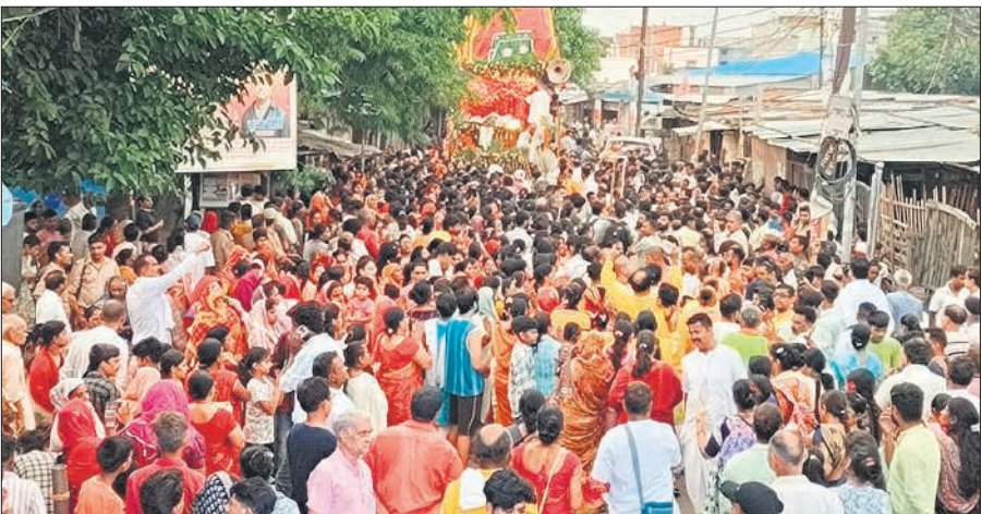
श्री जगन्नाथ रथ यात्रा में उमड़ी श्रद्धालुओं की भीड़।

रथ पर सवार होकर सुभद्रा और बलभद्र संग भ्रमण पर निकले जगन्नाथ, पुलिस ने ड्रोन के साथ यात्रा पर रखी नजर