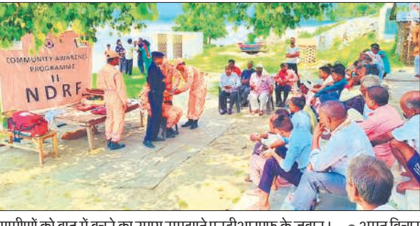
ग्रामीणों को बाढ़ में बचने का उपाय समझाते एनडीआरएफ के जवान।

अमृत विचार : एनडीआरएफ की टीम मंगलवार को कम्प्यूनिटी अवेयरनेस प्रोग्राम के तहत पलिया-भीरा के बीच बह रही शादा नदी तट पर पहुंची। टीम ने निकटवर्ती ग्रामों के ग्रामीणों को बाढ़ में फंसे होने पर बचने के उपाय समझाए।