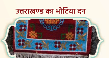
उत्तराखण्ड का भोटिया दन

हाउस ऑफ हिमालयाज के उत्पाद बेहद खास हैं, जो अपनी बेजोड़ गुणवत्ता और बेहतर कारीगरी के लिए जाने जाते हैं। यह बातें उन्हें बड़े पैमाने पर उत्पादन होने वाले दूसरे उत्पादों से विशिष्ट बनाती हैं।