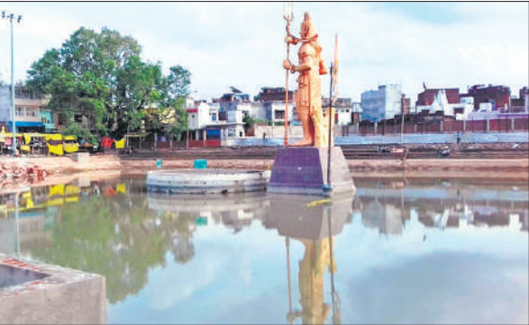
गोला के गोकर्ण तीर्थ में भरा बारिश का गंदा पानी।

छोटी काशी में सावन का विशेष महत्व है, जिसकी तैयारियां लगभग पूरी हो चुकी हैं। यूपीपीसीएल की कार्यदायी संस्था ने तीर्थ को टिन शेड लगवाकर कवर्ड कर दिया है। पौराणिक शिव मंदिर जाने के लिए चार रो में बैरिकेडिंग की गई है। जिला विद्यालय निरीक्षक ने सावन के चारों सोमवार 14, 21, 28 जुलाई और 4 अगस्त को नगर के सभी विद्यालयों को बंद रखने का आदेश जारी कर दिया है। 30 जून को हुई बारिश से तीर्थ में आसपास के नाले, नालियों का गंदा पानी आकर भर गया था, जिसे