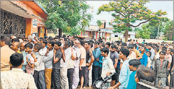
धौरहरा में समिति पर लगी किसानों की लंबी लाइन।

खाद की मारामारी: समिति कर्मचारियों और किसानों में होती रही तकरार , फिर भी नहीं मिल पा रही खाद