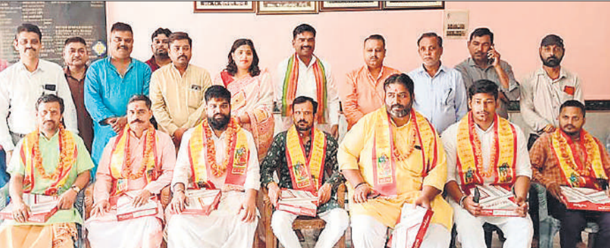
गौरीशंकर मंदिर में पुरस्कृत किए गए महंत संग भाजपा जिलाध्यक्ष, चेयरमैन व अन्य।