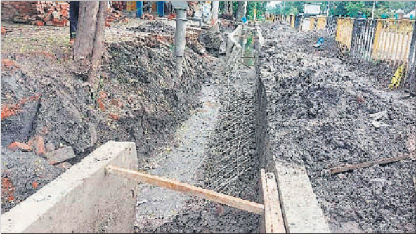
बरखेड़ा में सप्ताह भर के भीतर ढहा निर्माणाधीन नाला।

बता दें कि पीलीभीत-बीसलपुर मार्ग का चौड़ीकरण कार्य कराया गया है। इसके बाद नेशनल हाईवे की ओर सड़क के दोनों तरफ नाले का निर्माण कार्य करा दिया गया था। इसके अलावा कस्बे में गंदे पानी के निकास के लिए नगर पंचायत की ओर से नाला निर्माण कराया जा रहा है। ये नाला कस्बे में डिवाइडर के पूरब साइड में बनवाया जाना है। दो करोड़ रुपये