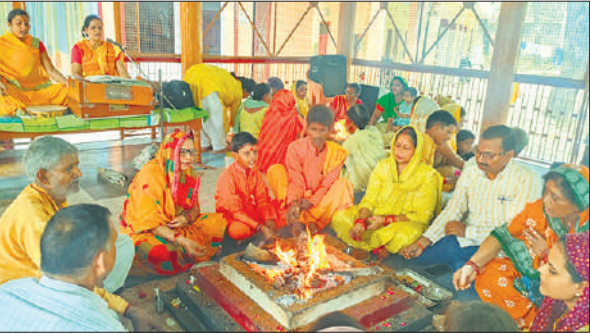
गायत्री शक्तिपीठ परिसर में गुरु पूर्णिमा पर सामूहिक हवन करते गायत्री परिजन।