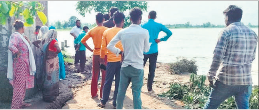
करसौर गांव में कटान देखकर आशंकित ग्रामीण।