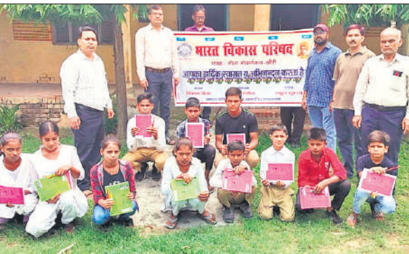
गांधी विद्यालय में पुरस्कृत विद्यार्थी।