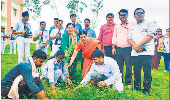
पौधरोपण करते अजमानी पब्लिक स्कूल के बच्चे।