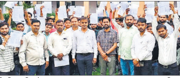
नियुक्ति पत्र दिखाते युवा।