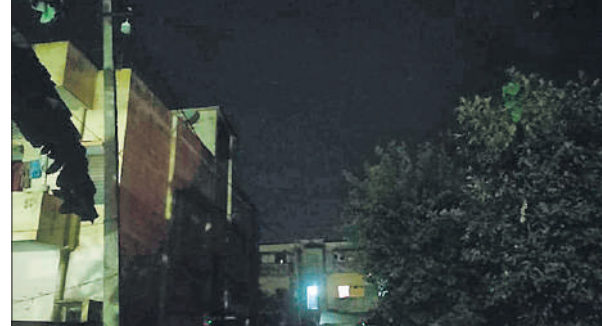
नकटादाना कर्मचारी कॉलोनी में स्ट्रीट लाइट खराब होने से पसरा अंधेरा।

अमृत विचार: नकटादाना कर्मचारी कॉलोनी में फैली अव्यवस्था का सुधार कराने के लिए डीएम ने नगर पालिका ईओ को निर्देश दिए हैं। सफाई व्यवस्था दुरस्त और रोशनी के इंतजाम कराते हुए तीन दिन के भीतर जिला सूचना कार्यालय में आख्या देने के निर्देश दिए गए हैं। डीएम के संज्ञान लेने के बाद नगरपालिका की टीम दौड़ी और कूड़े के ढेर तो हटवा दिए गए, लेकिन रोशनी का इंतजाम अभी नहीं कराया जा सका है। स्थानीय लोगों की मांग है कि रात के वक्त आ रही दिक्कत को देखते हुए स्ट्रीट लाइट व्यवस्था का सुधार करा दिया जाए। बता दें कि नकटादाना चौराहा के पास स्थित कर्मचारी कॉलोनी में विभिन्न विभागों के सरकारी