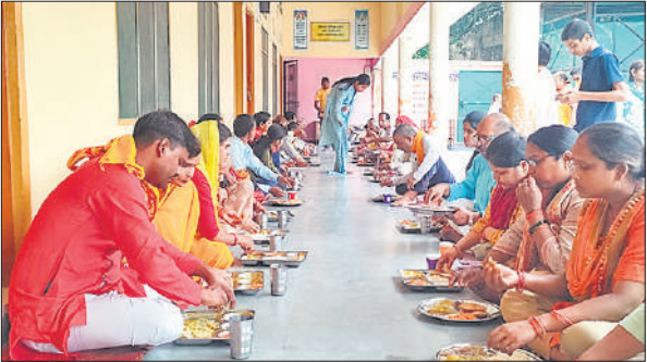
गुरु पूर्णिमा पर आयोजित भंडारे में प्रसाद पाते गायत्री परिजन।