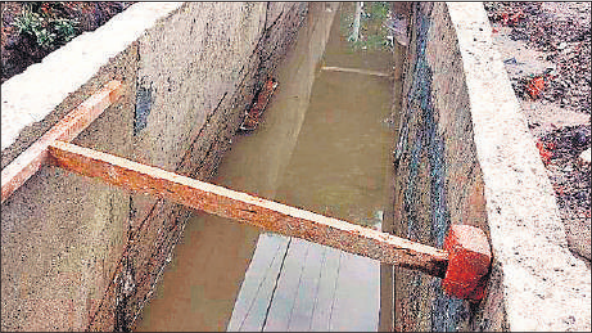
बरखेड़ा में निर्माणाधीन नाले को ढहने से बचाने को लगाई गई फंटियां।

पांच में से दो ठेकेदारों ने काम शुरू कर दिया है। एक ठेकेदार ने करीब 170 फीट की दीवार दोनों तरफ बनाकर तैयार कर दी