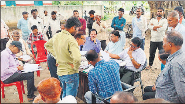
खजुरिया पचपेड़ा गांव में अभिलेख चेक कर जानकारी करते अधिकारी।