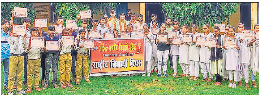
गांधी विद्यालय में पुरस्कृत छात्र और मौजूद शिक्षक।