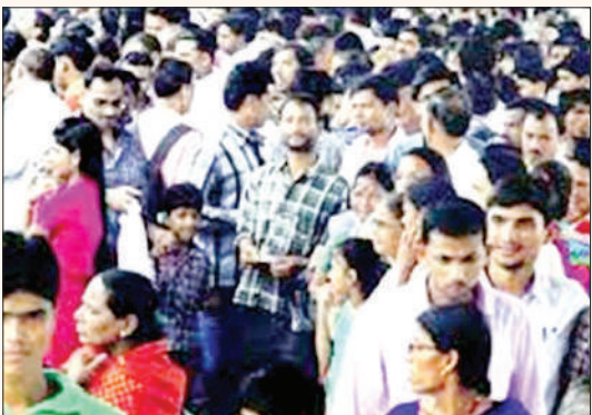
आज के बिहार में महिलाओं की आवाजें गूँज रही हैं।

की भजनलाल सरकार ने कुछ समय पहले राजस्थान पुलिस अधीनस्थ सेवा नियम-1989 में संशोधन करते हुए सीधी भर्ती में महिलाओं को 33 फीसदी आरक्षण देने का फैसला लिया था। बहरहाल, कहना गलत नहीं होगा कि बिहार में विधानसभा चुनाव होने वाले हैं, ऐसे में यह मुख्यमंत्री नीतीश कुमार का एक प्रकार से महिलाओं पर लगाया गया बड़ा दांव ही कहा जा सकता है, ताकि आने वाले विधानसभा चुनावों में उनकी पार्टी जीत हासिल कर सके। गौरतलब है कि साल 2005 में महिला सशक्तिकरण की बात करके ही नीतीश कुमार सत्ता में आए थे। बहरहाल, राजनीतिक दल और उनके नेता यह बात अच्छी तरह से जानते हैं कि आज के समय में महिला वोटरों की चुनावों में बहुत बड़ी भूमिका होती है। नीतीश कुमार भी अच्छी तरह से वाकिफ हैं कि आज के समय में बड़ी संख्या में महिला मतदाता अपने मताधिकार का प्रयोग करने लगी हैं। आंकड़े बताते हैं कि बिहार में साल 2020 के विधानसभा चुनाव में तो पुरुषों के मुकाबले 5.24 फीसदी अधिक महिलाओं ने वोट डाले थे। जानकारी के अनुसार वर्ष 2020 के बिहार विधानसभा चुनावों में 59.69 फीसदी