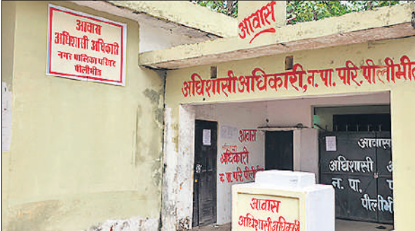
नकटदादना चौराहा पर इसी ईओ आवास पर लेना है पूर्णतया कब्जा।

अमृत विचार: नगर पालिका के ईओ आवास में संचालित समाजवादी पार्टी के कार्यालय को पूर्णतया खाली कराने की कवायद अंधर में है। नगरपालिका भवन पर कब्जा ले चुकी है लेकिन भीतर रखा समाजवादी पार्टी का सामान नहीं हट सका है। ऐसे में पूर्णतया कब्जा लेने को एक बार फिर कागजी तीर छोड़ा गया है, जिससे हलचल बढ़ गई है। नगरपालिका ईओ की ओर से डीएम-एसपी को पत्र लिखा गया है, जिसमें भवन पर पूर्णतया कब्जा लेने के लिए मजिस्ट्रेट और पुलिस बल की मांग की गई है। हालांकि ये कब्जा किस दिन लेना है, इसकी तिथि को लेकर संशय बाकी है। बता दें कि नकटदादना चौराहा पर समाजवादी पार्टी का कार्यालय ईओ आवास में संचालित हो रहा था। इसे बोर्ड की बैठक में प्रस्ताव पास करके 2005 में समाजवादी पार्टी को किराए पर आवंटित किया गया था। 2020 में आवंटन रिवरस्त