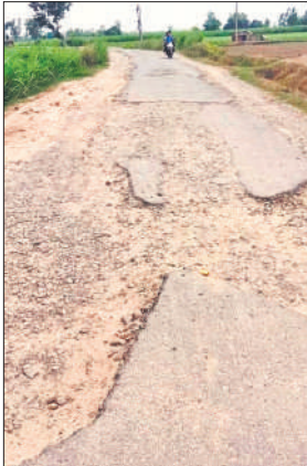
अमीरनगर से सरैया विलियम तक सड़क।