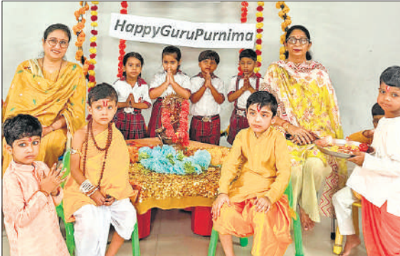
ज्ञान इंटरनेशनल स्कूल में हुए कार्यक्रम में मौजूद बच्चे।