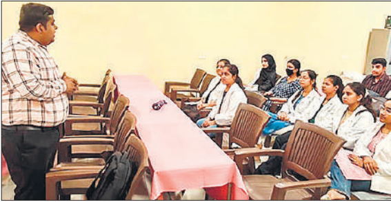
मेडिकल कॉलेज में प्रशिक्षण में मौजूद मेडिकल स्टूडेंट।