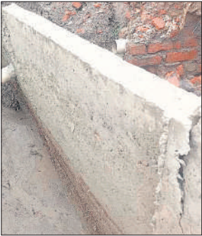
निर्माणाधीन नाले के बकाया हिस्से में पड़ी दीवार में दरार।

थी। इसकी गुणवत्ता पर उस वक्त सवाल उठ गए जब वह सप्ताह भर से पहले ही ढह गई। इस नाले की एक तरफ का 30 फीट का हिस्सा भरभरा ढह गया। बकाया में दरारें पड़ गई और झुक गया। इसके बाद नाले निर्माण में मानकों की अनदेखी करने का शोर मचा हुआ