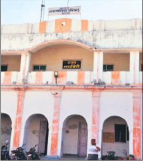
नगर पालिका परिषद कार्यालय।

नगर पालिका क्षेत्र के पांच किलोमीटर के दायरे में करीब 26 ग्राम पंचायतें हैं। इनमें से आधा दर्जन ग्राम पंचायत शहर में मिल चुकी है, लेकिन इन ग्राम पंचायतों को शहर जैसी सुविधाएं नहीं मिल रही हैं। शहर के नजदीक ग्राम पंचायतों को पालिका में शामिल करने के लिए वर्ष 2019, 2021, 20222 चुनाव से पूर्व बोर्ड की बैठक में सीमा विस्तार का प्रस्ताव पास कर भेजा था। फाइल मंजूरी के लिए शासन को भेज दी गई।