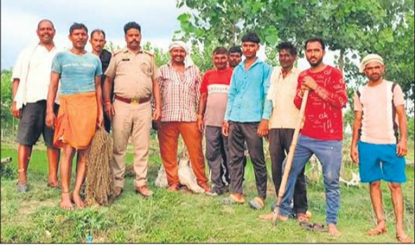
बेहटी गांव के तालाब के पास तैनात वन विभाग की टीम।