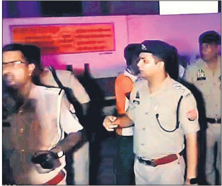
हादसे के बाद राहत व बचाव कार्य में जुटी पुलिस ।

इसी उत्साह में दूल्हे सूरज को लेकर जा रही बोलरो की रफ्तार इतनी तेज कर दी गई कि चालक नियंत्रित नहीं कर पाया। जुनावई में जनता इंटर कॉलेज के पास पहुंची तो इस कदर अनियंत्रित हुई कि सड़क पर ही