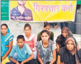
धरने पर बैठे मृतक के परिजन।