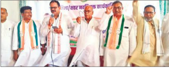
शपथ ग्रहण के बाद एक मंच पर खड़े नवनि्युक्त पदाधिकारी।