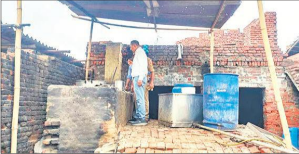
छापेमारी करती खाद्य सुरक्षा टीम व पुलिस ।