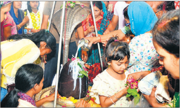
गौरी शंकर में भगवान शिव का जलामिषेक करते श्रद्धालु।