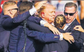
● 45 मिनट पहले मिली थी संदिग्ध शख्स की सूचना, नहीं की कार्रवाई

पिछले वर्ष ट्रंप पर राष्ट्रपति चुनाव के प्रचार के दौरान पेंसिलवेनिया के बटलर में आठ गोलीयां चलाई गई थीं। एक कमांडो ने तत्काल बंदूकधारी को मार गिराया था लेकिन गोलीबारी में एक व्यक्ति की मौत और दो लोगों के घायल होने की घटना ने खुफिया सेवा पर गंभीर सवाल खड़े कर दिए थे। सीनेट की होमलैंड सिक्योरिटी एंड गवर्नमेंटल अफेयर्स कमेटी की रिपोर्ट में कहा गया है जो हुआ वह माफ करने