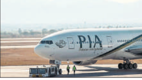
● जेहा में उतरने के बाद आख्रज अधिकारियों ने वापस लौटाया