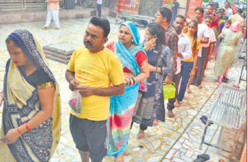
गौरी शंकर में भगवान शिव का जलामिषेक करते श्रद्धालु।