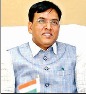
खेल मंत्री मनसुख मांडविया।

● खेल मंत्री मनसुख मांडविया ने दी जानकारी