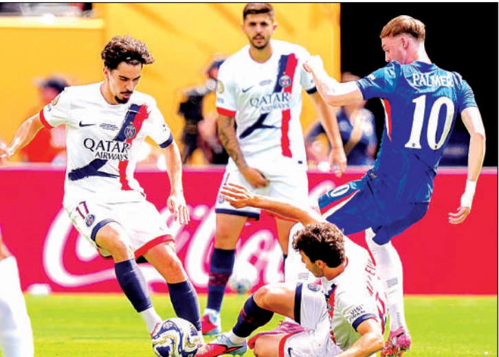
क्लब विश्व कप फाइनल के दौरान चेल्सी के कोल पामर फुटबाल छीनने का प्रयास करते हुए।

कोल पामर के दो गोल और जोआओ पेड्रो के एक गोल की मदद से चेल्सी ने यूरोपीय चैंपियन पेरिस सेंट जर्मेन (पीएसजी) को 3-0 से हरा कर क्लब विश्व कप फुटबॉल टूर्नामेंट का खिताब जीता। पामर ने 22वें और 30वें मिनट में पेनल्टी क्षेत्र के अंदर से बाएं पैर से लगभग एक जैसे गोल किए। उन्होंने तीसरा गोल करने में भी मदद की। उनके पास पर जोआओ पेड्रो ने 43वें मिनट में गोलकीपर जियानलुइगी डोनारुम्मा को छकाकर गोल किया जो दो जुलाई को चेल्सी से जुड़ने के बाद इंग्लैंड के इस क्लब की तरफ से उनका तीसरा गोल है। दो साल पहले मैनचेस्टर सिटी से चेल्सी में शामिल हुए 23 वर्षीय पामर ने इस सत्र में 18 गोल किए हैं। पीएसजी ने अपनी तरफ से वापसी के हर संभव प्रयास किए लेकिन चेल्सी की मजबूत रक्षा पंक्ति के सामने उसकी एक नहीं चली। उसे मैच के अंतिम कुछ मिनट 10 खिलाड़ियों के साथ खेलने पड़े क्योंकि 84वें मिनट में मार्क कुकुरेला को बाल पकड़कर