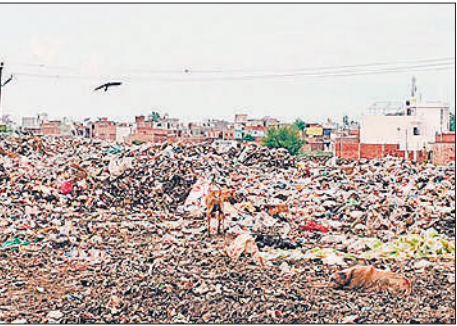
ककरा कला स्थित कूड़े का डंपिंग ग्राउंड।