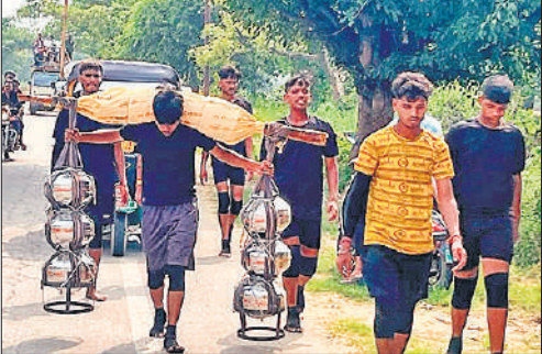
गंगाजल लेकर शिवधाम की ओर लौटते कांवड़िया।

शहर के बिरुआ बाड़ी मंदिर और गौरी शंकर मंदिर में श्रद्धालुओं की सबसे अधिक भीड़ देखने को मिली। भोर से मंदिर के कपाट खोल दिए गए थे। सबसे पहले रविवार से डेरा डाल कर बैठे कांवड़ियों के द्वारा भगवान शिव का जलामिषेक किया गया। इसके बाद अन्य लोगों ने भगवान शिव की अर्चना की। भोर से मंदिरों के बाहर श्रद्धालुओं की कतार लगनी शुरू हो गई थी। श्रद्धालुओं ने कतारबद्ध होकर भगवान शिव की बेलपत्र, पुष्प, फूल पंचामृत और गंगाजल से पूजन किया। मंदिरों के बाहर मेले जैसा नजारा था। मंदिरों के बाहर पूजा सामग्री की दुकानें सजी हुई थी। इन दुकानों से श्रद्धालुओं ने पूजा सामग्री को खरीद कर भगवान शिव की आराधना की। इधर कछला गंगा घाट से गंगा