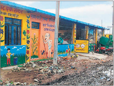
ककरा कला में बना सेंटर पूरी क्षमता से नहीं चल पा रहा है।

● मशीनों की निकल रही वारंटी, छह स्थानों पर बने सेंटर, बिजली कनेक्शन का इंतजार