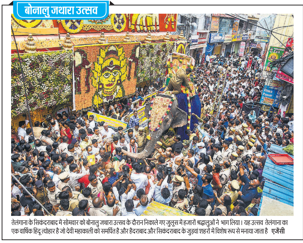
तेलंगाना के सिकंदराबाद में सोमवार को बोनालु जथारा उत्सव के दौरान निकाले गए जुलूस में हजारों श्रद्धालुओं ने भाग लिया। यह उत्सव तेलंगाना का एक वार्षिक हिंदू त्योहार है जो देवी महाकाली को समर्पित है और हैदराबाद और सिकंदराबाद के जुड़वां शहरों में विशेष रूप से मनाया जाता है