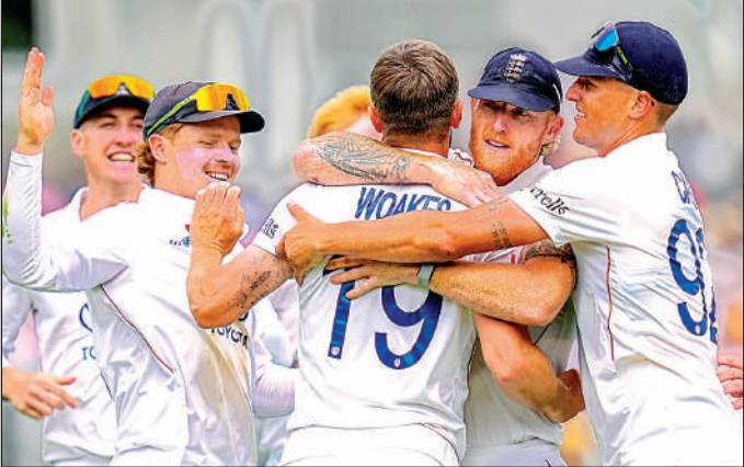
तीसरा टेस्ट मैच जीतने के बाद जश्न मनाती इंग्लैंड की टीम।

क्रिस वोक्स (21 रन पर एक विकेट) ने भी एक विकेट चटकाया। आर्चर ने अपना पिछला टेस्ट फरवरी 2021 में अहमदाबाद में भारत के खिलाफ ही खेला था। लक्ष्य का पीछा करते हुए भारत ने 82 रन तक सात विकेट गंवा दिए थे लेकिन जडेजा (नाबाद 61 रन, 181 गेंद, चार चौके, एक छक्का) ने नितीश