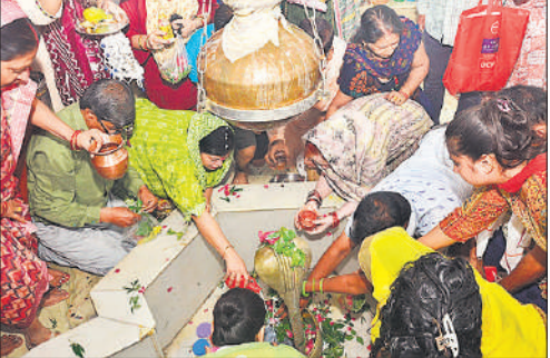
बिरुआ बाड़ी मंदिर में पूजा अर्चना करते श्रद्धालु।