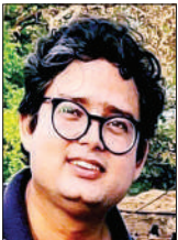
हफीज़ किदवाई लेखक