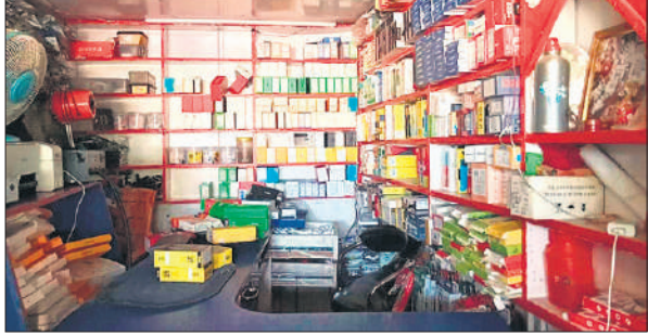
चोरी के बाद दुकान में फैले पड़े मोबाइल फोन के बॉक्स।