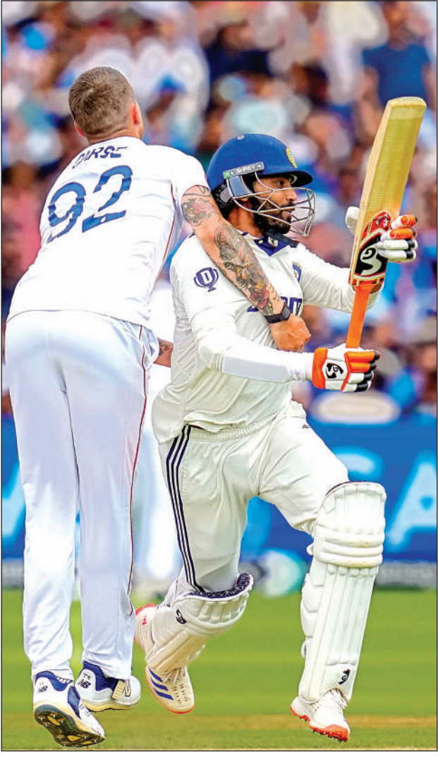
विकेट के बीच दौड़ते समय रवींद्र जडेजा और ब्रायडन कार्स टकरा गए।

बैडमिंटन खिलाड़ी साइना नेहवाल और पारुपल्ली कश्यप शादी के सात साल बाद आधिकारिक तौर पर अलग हो गए हैं। साइना ने सोशल मीडिया मंच इंस्टाग्राम पर एक भावुक पोस्ट लिखकर अपने अलग होने की पुष्टि की। उन्होंने लिखा कई बार जिंदगी हमें अलग रास्तों पर ले जाती है। सोच-विचार के बाद, कश्यप पारुपल्ली और मैंने अलग होने का फैसला लिया है। हम शांति, आगे बढ़ने और खुद को समझने के रास्ते को चुन रहे हैं। उन्होंने आगे लिखा, “बीते पलों के लिए शुक्रिया और आगे के लिए शुभकामनाएं। इस समय हमारी निजता का सम्मान करने के लिए धन्यवाद। भारतीय खेलों में कभी शक्तिशाली जोड़ी माने जाने वाले इस जोड़े ने हैदराबाद स्थित