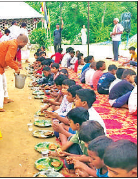
भंडारे में प्रसाद ग्रहण करते लोग ।