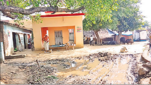
गांव में भरा कीचड़।