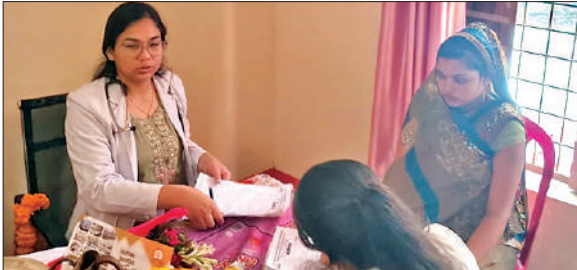
शिविर में जांच करते चिकित्सक। ● अमृत विचार

है। जो भी पहली किस्त ले, उसके बाद वह शौचालय निर्माण कार्य