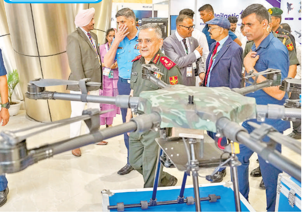
चीफ ऑफ डिफेंस स्टाफ जनरल अनिल चौहान ने बुधवार को नई दिल्ली में यूएपी और सीयूपएस के क्षेत्रों में विदेशी ओईएम से वर्तमान में आयात किए जा रहे महत्वपूर्ण घटकों के स्वदेशीकरण पर आयोजित कार्यशाला व प्रदर्शनी का निरीक्षण किया।