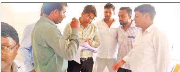
जांच करने पहुंचे अधिकारी।