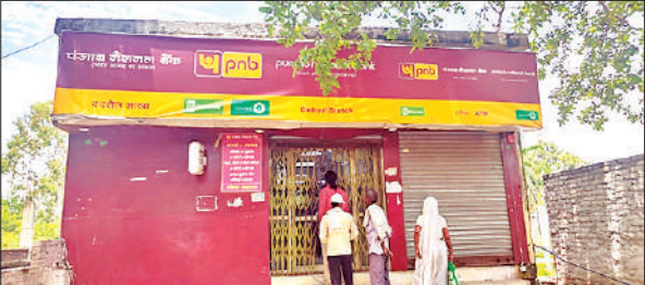
इसी बैंक में चोरी का प्रयास किया गया।