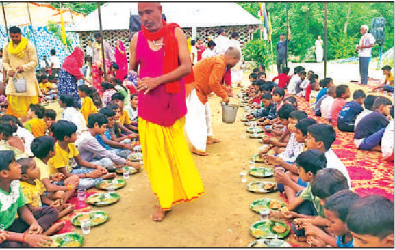
भंडारे में प्रसाद ग्रहण करते लोग ।