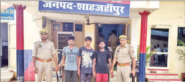
पुलिस हिरासत में पकड़े गए आरोपी।