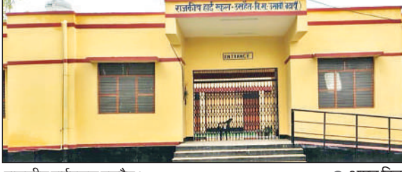
राजकीय हाईस्कूल उसहैत ।