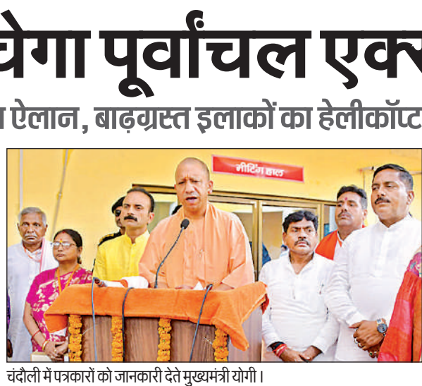
चंदौली में पत्रकारों को जानकारी देते मुख्यमंत्री योगी।

प्रशिक्षण ( आईजीओटी ) द्वारा कार्यान्वित किया जा रहा है। मिशन कर्मयोगी का उद्देश्य पारदर्शिता और प्रौद्योगिकी के माध्यम से सिविल सेवकों को एक आदर्श कर्मयोगी के रूप में राष्ट्र की सेवा करने के लिए भविष्य में उन्हें रचनात्मक, सृजनात्मक, नवीन, सक्रिय और तकनीकी रूप से सशक्त बनाना है।