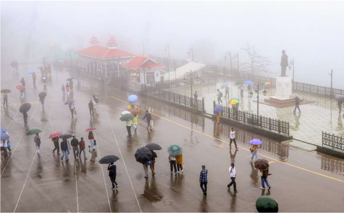
हिल स्टेशन शिमला में मानसून ने दस्तक दे दी है और पहाड़ी इलाकों में रिमझिम बारिश जारी है। बारिश के बीच लोग छाते लेकर माल रोड और अन्य पर्यटन स्थलों पर टहलते नजर आए। ठंडी हवा और नमी से मौसम सुहावना हो गया है, जिससे स्थानीय निवासी और पर्यटक दोनों ही आनंदित हैं।