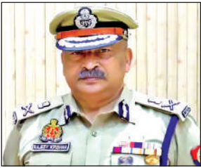
● मेरठ जोन में सबसे अधिक हुई कार्रवाई, अपराधियों में जीरो टॉलरेंस नीति का खौफ