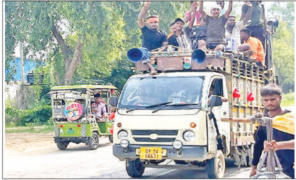
वाहन से कावड़ भरने जाते लोग।

बरेली की ओर आने वाली रोडवेज बसें और हल्के वाहन नवादा चौकी से कुंवरगांव, आंवला, अलीगंज, गैनी, रामगंगा, लाल फाटक होते हुए भेजे जाएंगे।