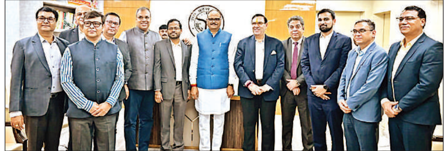
लखनऊ में अपने आवास पर कॉरपोरेट जगत के प्रतिनिधियों से मुलाकात करते उप मुख्यमंत्री ब्रजेश पाठक।

कॉलोनी स्थित अपने आवास पर देश के प्रतिष्ठित कॉरपोरेट जगत के प्रतिनिधियों से भेंट करने के बाद संबंधित कर रहे थे। प्रदेश की समृद्धि एवं प्रगति विषयक चर्चा के बाद उन्होंने बताया कि वर्तमान में देश-विदेश से हजारों करोड़ रुपये का निवेश हो रहा है। लाखों युवाओं के लिए रोजगार