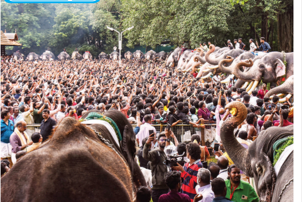
केरल के त्रिशूर स्थित श्री वडवकुमनाथन मंदिर में गुरुवार को मलयालम महीने कार्किडकम की शुरुआत के उपलक्ष्य में हाथियों को खाना खिलाते लोग, इस रस्म को आनाखूट्टू कहा जाता है। यह भगवान गणेश को समर्पित उत्सव है जिसमें हजारों लोग भाग लेते हैं। एर्जेसी