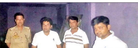
बंडा के आलमपुर पिपरिया में नकली खाद फैक्ट्री को सील करते अफसरों की टीम।