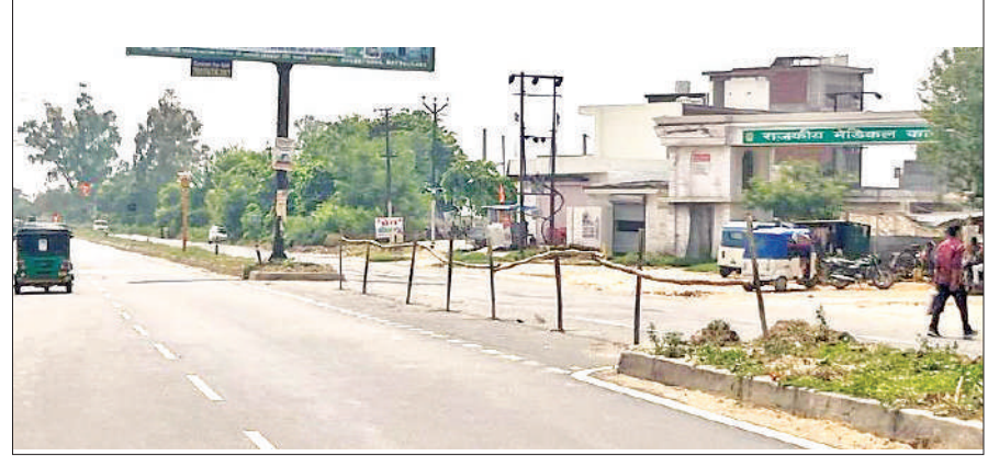
रोड को वन वे बनाने के लिए बीच में लगाई गई बल्लियां।