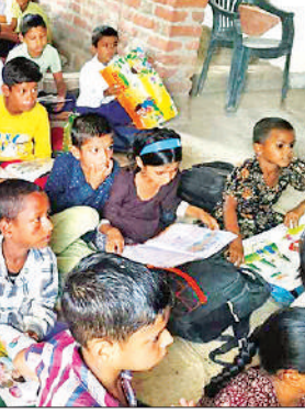
बिना मान्यता वाले विद्यालय में जमीन पर बैठे बच्चे।

के साथ जुर्माना भी वसूल किया जाएगा। बेसिक शिक्षा विभाग की इस कार्यवाही से जिले में चल रहे मान्यता के बगैर चल रहे स्कूल संचालकों में हड़कंप मचा है। इस कार्यवाही दिन भर चर्चा में रही।