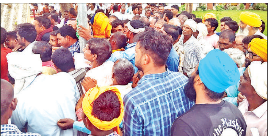
खुटार में खाद लेने के लिए लगी किसानों की लाइन।

कृषि विभाग का दावा है कि आपूर्ति जारी है, लेकिन किसानों का कहना है कि यूरिया की डिमांड हर साल बरसात में बढ़ती है और समय पर स्टॉक नहीं पहुंचता। जिला कृषि अधिकारी का कहना है कि डिलीवरी लगातार हो रही है। केंद्रों पर भीड़ ज्यादा है, इसलिए टोकन व्यवस्था अपनाई गई है। अगले दो-तीन दिनों में स्टॉक की स्थिति सामान्य हो जाएगी।