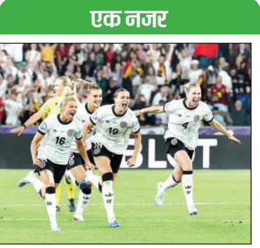
रिवटजरलैंड के सेंट जैकब पार्क में महिला यूरो 2025 क्वार्टर फ़ाइनल फुटबॉल मैच में फ्रांस को हराने के बाद जश्न मनाती जर्मनी की खिलाड़ी ।