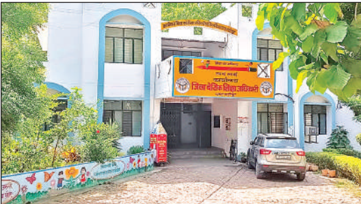
कार्यालय जिला बेसिक शिक्षा अधिकारी ।

अमृत विचार: बच्चों को पढ़ाई के साथ-साथ हुनर को मंच देने के लिए सरकार की इंस्पायर अवार्ड योजना में इस बार जिले के 80 बच्चों का चयन किया गया है। गत वर्ष मात्र 13 बच्चों का चयन हुआ था, जबकि इस बार अलग-अलग ब्लॉकों से चयनित संख्या में जबरदस्त बढ़ोतरी दर्ज की गई है। माध्यमिक व बेसिक विद्यालयों में विज्ञान और नवाचार को बढ़ावा देने के उद्देश्य से आयोजित इंस्पायर अवॉर्ड में चयनित बच्चों को विज्ञान मॉडल बनाने के लिए दस-दस हजार की धनराशि भारत सरदार द्वारा उनके खातों में भेजी जाएगी। जिससे बच्चे बहुत कुछ सीखकर अन्य बच्चों के लिए प्रेरणा बनकर सामने आएंगे। बच्चे इस राशि से अपने विज्ञान मॉडल तैयार करेंगे। 23 जुलाई को लगेगी संयुक्त