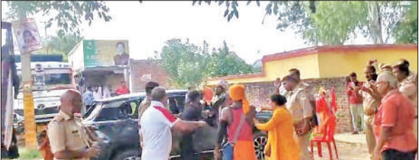
कार को धेरकर खड़े कावड़िया।