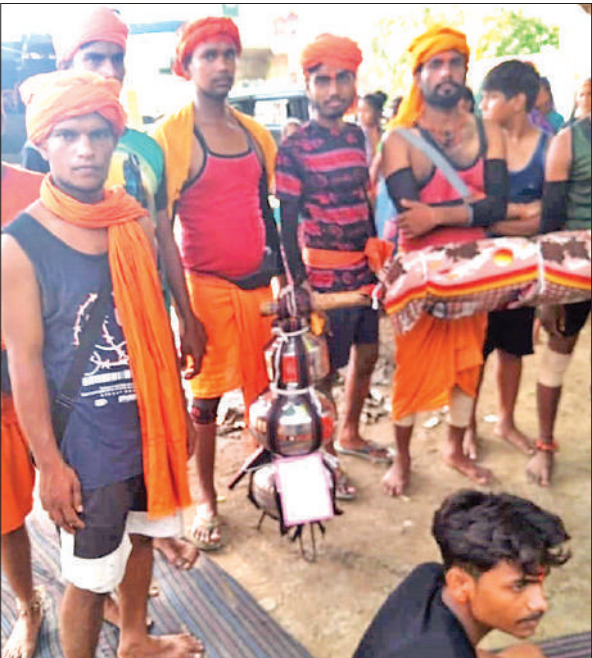
नाराजगी जताते कावड़िया।