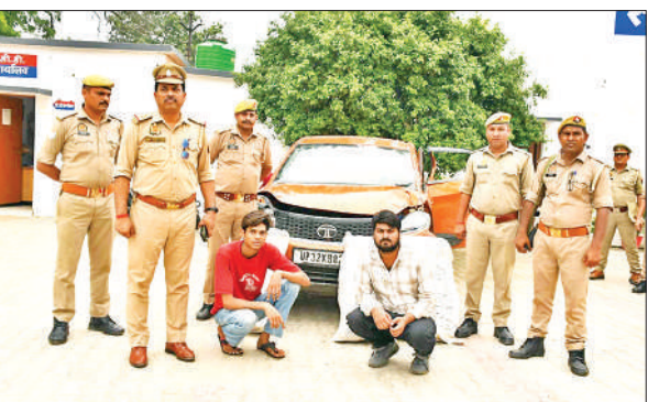
पुलिस की गिरफ्त में अवैध गांजा तस्करी के आरोपी।

अलापुर पुलिस ने बरामद किया 75.89 किग्रा अवैध गांजा, कार की खिड़की से भाग गया एक तस्कर