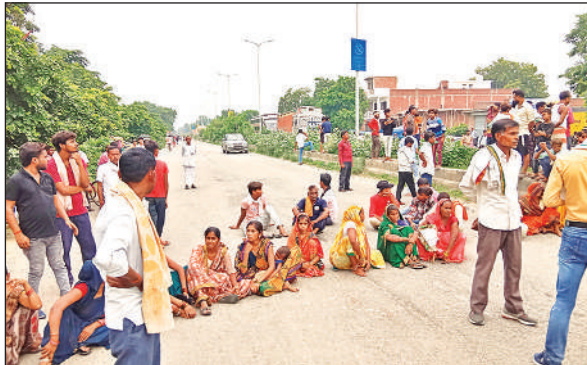
सड़क पर बैठी महिलाएं।

रविवार को पोस्टमार्टम के बाद परिजन किशोर का शव लेकर लालबाग चौराहे हाईवे पर पहुंचे और शव को रखकर प्रदर्शन शुरू कर दिया। परिजनों का आरोप है कि नदी के किनारे आरसीएल