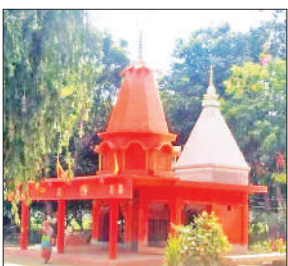
अंबारा गांव स्थित प्राचीन शिव मंदिर।

बिजुआ से आठ किमी दक्षिण में ग्राम पंचायत अंबारा में स्थित जंगल के किनारे महाबा शासक परिमाल की सेना के योद्धा आल्हा एवं ऊदल के आदि गुरु अमरा की तपोस्थली है।