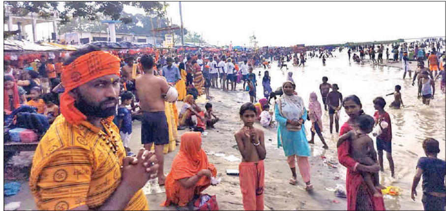
कछला में भागीरथी घाट पर स्नान करते श्रद्धालु।