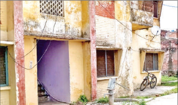
जिला महिला अस्पताल स्थित सरकारी आवास।