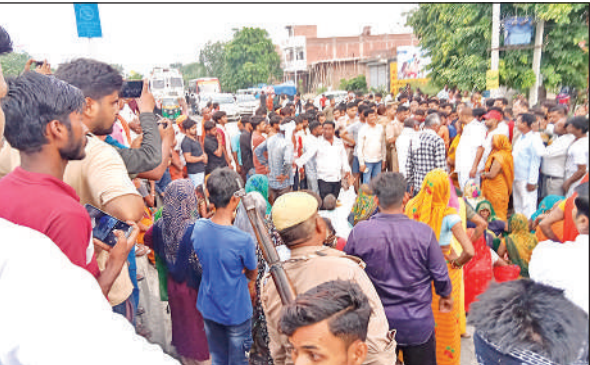
सड़क पर जाम लगाते परिजन।