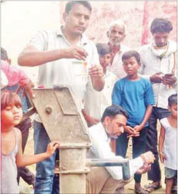
मौके गांव में हैंडपंप के पानी की जांच करती टीम।