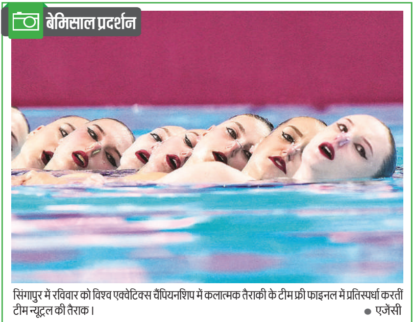
सिंगापुर में रविवार को विश्व एक्वेटिक्स चैंपियनशिप में कलात्मक तैराकी के टीम फ्री फाइनल में प्रतिस्पर्धा करती टीम न्यूट्रल की तैराक ।

के लिए एक कड़ी चुनौती थी। हम कुछ पहलुओं पर और बेहतर कर सकते थे। इस खंबू बल्लेबाज ने कहा कि कहा कि लॉर्ड्स में रन बनाना हमेशा मुश्किल काम होता है और उनकी टीम कुछ महत्वपूर्ण सबक लेकर वापस लौटोगी। उन्होंने कहा कई खिलाड़ियों को लॉर्ड्स में पहली बार खेलने का मौका मिला। उत्साह काफी ज्यादा था। इसलिए मुझे यकीन है कि बहुत से इन खिलाड़ियों ने काफी कुछ सीखा होगा। भारत ने 2017 में इसी मैदान पर इंग्लैंड से विश्व कप फाइनल हारा था।