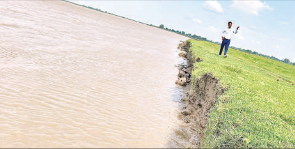
कादरचौक क्षेत्र में बहती गंगा।