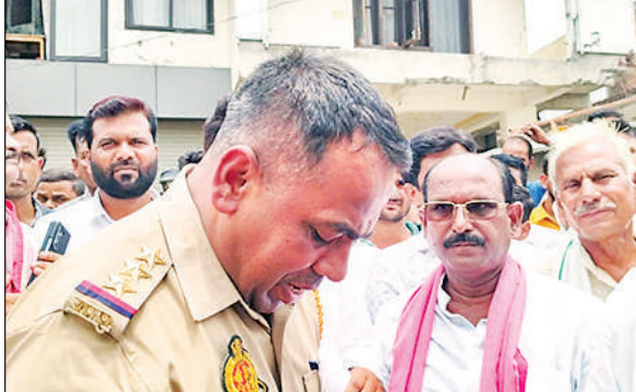
निगोही थाना प्रभारी से वार्ता करते सपा नेता।

मुफ्त और सामान्य ऑपरेशन पर 25 प्रतिशत छूट मिलेगी। शिविर में