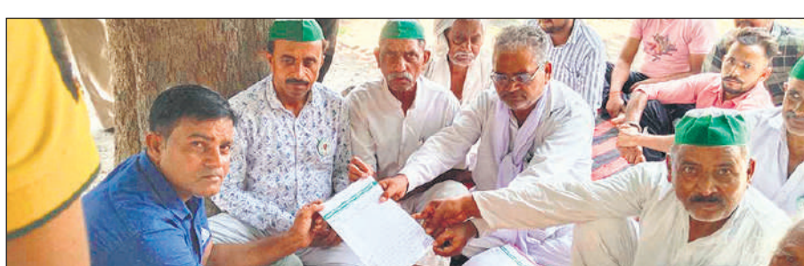
अवर अभियंता को ज्ञापन सौंपते भारतीय किसान यूनियन टिकैत के पदाधिकारी।

का फिलहाल कोई खतरा नहीं है लेकिन सतर्कता बढ़ा दी गई है।