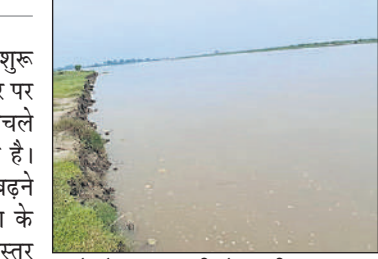
उसहैत के जटा गांव की ओर बहती गंगा।

पिछले कई दिनों तक बारिश नहीं हुई जिस कारण नरीरा से कम पानी छोड़ा जा रहा था। गंगा में कम पानी आने से तटवर्ती गांव के किसान खुश थे, लेकिन बुधवार से नरीरा बैराज से पानी कुछ अधिक छोड़ा जाने लगा। इससे गंगा का जलस्तर बढ़ रहा है। गुरुवार को नरीरा से 62 हजार क्यूसेक पानी डिस्चार्ज किया गया। गंगा में पानी बढ़ने से तटवर्ती इलाकों में बेचैनी बढ़ गई है। उसहैत के गांव जटा के निकट गंगा की धार बढ़ने लगी है। पानी ने फिर से आसपास हलचल