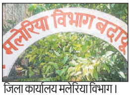
जिला कार्यालय मलेरिया विभाग।