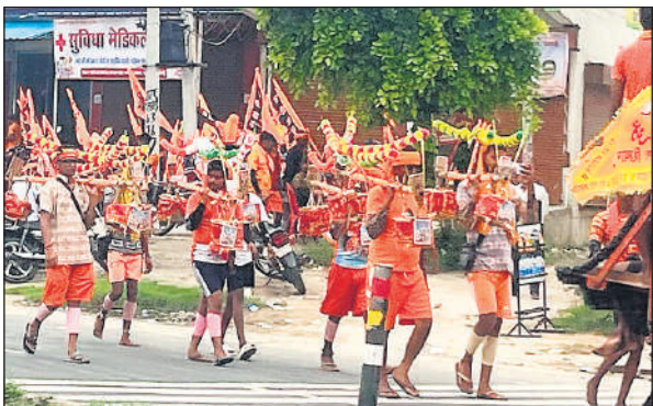
कांवड़ लेकर शिवधाम की ओर जाते श्रद्धालु ।

शिव का गंगा जल से स्नान कराने के लिए हजारों की संख्या में श्रद्धालु गंगा घाट पर जल लेने पहुंचते हैं। सबसे अधिक संख्या कछला गंगा घाट पर रहती है। श्रद्धालु घाट पर पहुंचने शुरू हो गए हैं। इनकी संख्या शुक्रवार