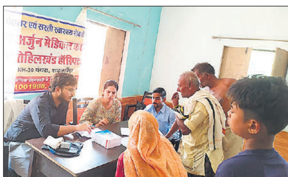
शिविर में मरीजों की जांच करते चिकित्सक।