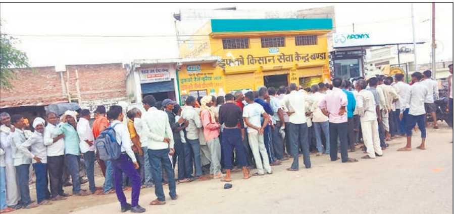
बंडा सहकारी समिति के बाहर खाद के लिए लाइन में लगे किसान।