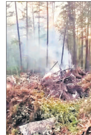
क्रैश हुए रूसी विमान का मलबा ।

चालक दल ने किसी के भी जीवित बचे होने की सूचना नहीं दी । क्षेत्रीय अंगारा एयरलाइंस का 50 साल पुराना विमान खाबरोवस्क-तिंडा-ब्लागोवेशेन्स्क मार्ग पर उड़ान भर रहा था । रेडियो बीएफएम ने कुछ विशेषज्ञों के हवाले से बताया कि खराब मौसम के दौरान मानवीय चूक दुर्घटना का संभावित कारण है । दूसरी ओर इंजन की समस्या को भी दुर्घटना के लिए जिम्मेदार बताया जा रहा है ।