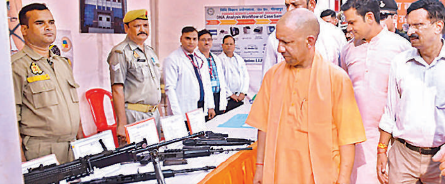
गोरखपुर के 26वीं वाहिनी पीएसी परिसर में लगाई गई प्रदर्शनी देखते मुख्यमंत्री योगी।

योगी गुरुवार को 26वीं वाहिनी पीएसी परिसर में 11 मंजिला बैरक टॉवर और 30 बेड के हॉस्पिटल के लोकार्पण समारोह को संबोधित कर रहे थे। उन्होंने कहा कि आज कोई भी बाहरी व्यक्ति कानून व्यवस्था के मामले में यूपी पर हंस नहीं सकता, न ही अंगुली नहीं उठा सकता है। यूपी का नौजवान आज कहीं भी जाता है तो सम्मान पाता है जबकि