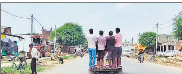
डग्गामार वाहन में लटककर यात्रा करते लोग।