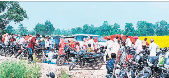
सड़कों पर दुकानें लगाए दुकानदार।