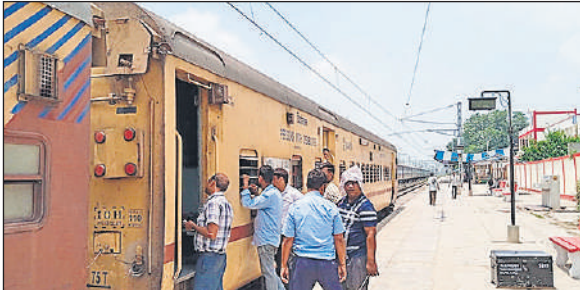
शाहजहांपुर रेलवे स्टेशन के प्लेटफॉर्म पर हंगामा करते यात्री।