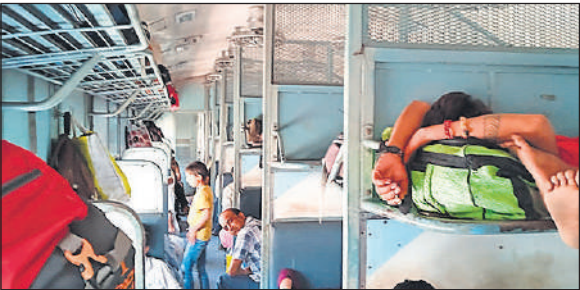
कोच के अंदर गर्मी से परेशान यात्री।

मेरठ से लखनऊ जा रही राज्यरानी एक्सप्रेस के गार्ड की बोगी के पड़ोस में जनरल कोच संख्या 084880 में पंखे नहीं चल रहे थे। पंखे न चलने से यात्री परेशान हो गए और गर्मी के कारण पसीने से तरबतर हो गए। सबसे अधिक परेशानी छोटे बच्चों को हो रही थी। यात्रियों ने बताया कि मुरादाबाद स्टेशन से कोच में