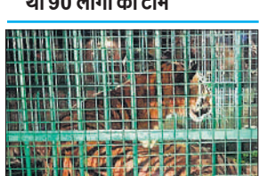
पिंजरे में कैद बाघिन ।

● पकड़ने के लिए जंगल में उतरी थी 90 लोगों की टीम