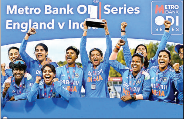
इंग्लैंड के खिलाफ वनडे सीरीज जीतने के बाद जश्न मनाती महिला टीम।