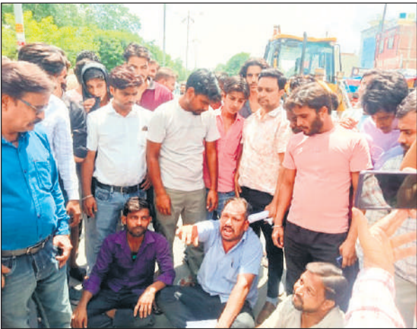
मेडिकल कॉलेज के सामने सड़क पर बैठ कर धरना देते भाजपाई व व्यापारी।