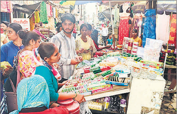
चूना मंडी स्थिति दुकान से चूड़ियां खरीदती महिलाएं।

अमृत विचार: शहर के प्रमुख बाजारों में शनिवार को ग्राहकों की भीड़ रही। तीज पर श्रृंगार के लिए महिलाओं ने चूड़ियां, पायल, बिंदिया, मेहंदी, साड़ियां, सिंदूर से लेकर नए और आकर्षक परिधानों की खरीदारी की। श्रृंगार व जहूरत के घरेलू सामान की खरीदारी के चलते बीते दिवस के मुकाबले बाजारों में ग्राहकों की भीड़ उमड़ने से दिनभर रौनक नजर आई। हरियाली तीज रविवार को मनाई जाएगी, जो महिलाओं के लिए बेहद उत्साह से भरा होता है। श्रावण मास में पड़ने वाले इस पर्व की तैयारी में