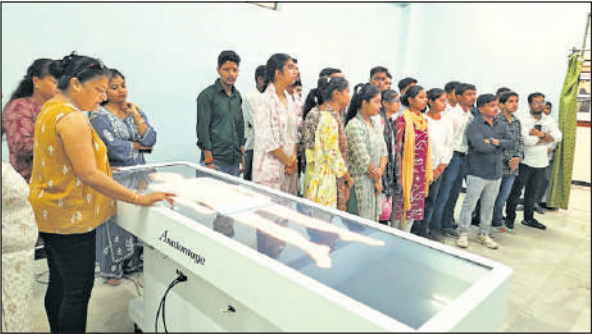
ओरिएंटेशन के दौरान छात्रों को व्यवहारिक जानकारी देते वक्ता।