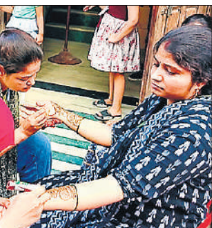
हाथों पर मेहंदी लगवाती महिला।