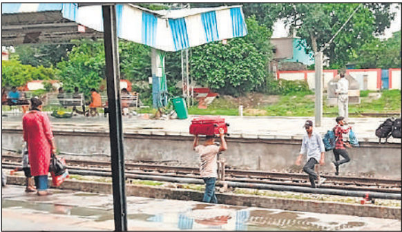
रेलवे स्टेशन पर ट्रैक पार कर दूसरे प्लेटफॉर्म की ओर जाते यात्री।

प्लेटफार्म एक से पांच तक बने इस स्टेशन पर सुरक्षित आवाजाही के लिए बाकायदा फुट ओवरब्रिज की व्यवस्था है, जो हर प्लेटफॉर्म पर उतरता है। लेकिन जल्दी में या आदतन, यात्री ट्रैक पार करना ज्यादा आसान समझते हैं। वे छोटे बच्चों को लेकर, भारी सामान के साथ, यहां तक कि बुजुर्गों को सहारा देते हुए पटरियों पार करते हैं। रेलवे प्रशासन की चेतावनियां, आरपीएफ की डांट और मना करने के बावजूद