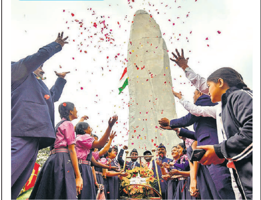
शनिवार को बैंगलुरु स्थित राष्ट्रीय सैन्य स्मारक पर कारगिल विजय दिवस के 26 साल पूरे होने के उपलक्ष्य में 75 फीट ऊंचे वीरगल्लू (नायक पथर) के अनावरण के दौरान घुषाप्राण करते छात्र और पूर्व सैन्य कर्मचारी।