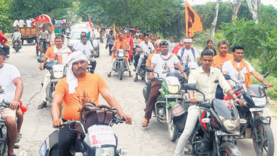
शिवधाम की ओर लौटता बाइक सवार कांविरियों का जत्था।

बम-बम भोले के जयकारों से वातावरण गूंज रहा है। कांवड़ियों का जगह-जगह पर स्वागत भी हो रहा है। समाजसेवियों और प्रशासन की ओर से कई स्थानों पर सेवा