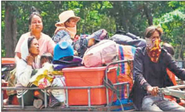
कंबोडिया में सीमावर्ती इलाके से पलायन करता एक परिवार।

क्षेत्रीय समूह दक्षिण पूर्व एशियाई राष्ट्र संघ (आसियान) पर अपने दोनों सदस्य देशों के बीच तनाव कम करने का दावा बंद रहा है। शुक्रवार को एक आपात बैठक के दौरान, संयुक्त राष्ट्र सुरक्षा परिषद के सदस्यों ने तनाव कम करने का आह्वान किया और आसियान से शांतिपूर्ण समाधान के लिए मध्यस्थता कराने की अपील