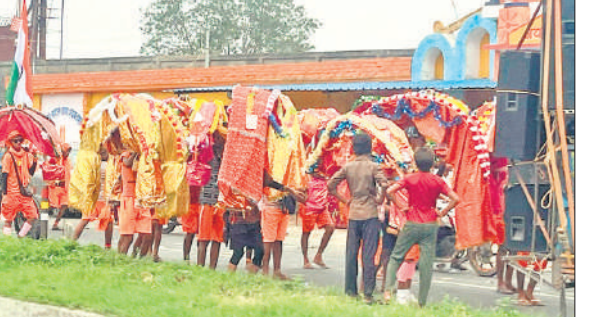
डीजे पर बज रहे भजनों पर नाचते गाते जाते कांवड़िये।

अमृत विचार: सावन मास के तीसरे सोमवार को लेकर श्रद्धालुओं में उत्साह है। महादेव का जलाभिषेक करने के लिए कांवड़िये कछला से गंगाजल लेकर मंजिल की ओर बढ़ रहे हैं। बरेली मथुरा हाईवे पर बम-बम भोले के जयकारों से धरा गूंज रही है। सड़के भगवा हो रही हैं। पुलिस प्रशासन की ओर से सतर्कता बढ़ा दी गई है। जगह-जगह भारी संख्या में पुलिस बल तैनात है। शिविरों में की कांवड़ियों की सेवा की जा रही है। कछला गंगा घाट पर बरेली, पीलीभीत, चंदौसी सहित अन्य जनपदों के कांवड़िये गंगा जल भर कर लौट रहे हैं। कांवड़िये डीजे की धुन पर नाचते गाते आगे बढ़ रहे हैं। इनमें अधिकांश पैदल कांवड़िये हैं। साथ ही डाक कांवड़ियों का भी जत्था हाईवे पर दौड़ रहा है। अन्य स्थानों के साथ-साथ स्थानीय श्रद्धालुओं की संख्या भी लगातार बढ़ती जा रही है। दिन में धूप तेज होने के कारण कांवड़ियों की संख्या