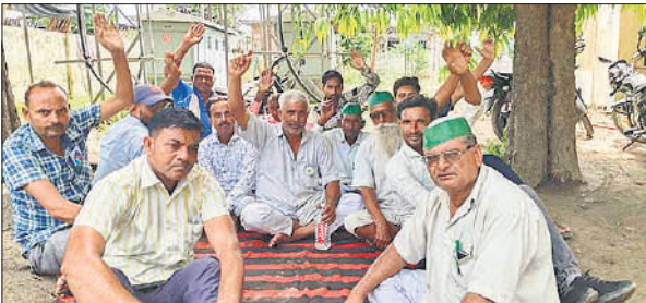
बिनावर सब स्टेशन पर धरना देते भाकियू के पदाधिकारी व कार्यकर्ता।