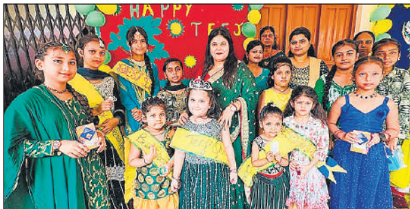
ऑल सेंट्स स्कूल में हरियाली तीज का पर्व मनाती छात्राएं।