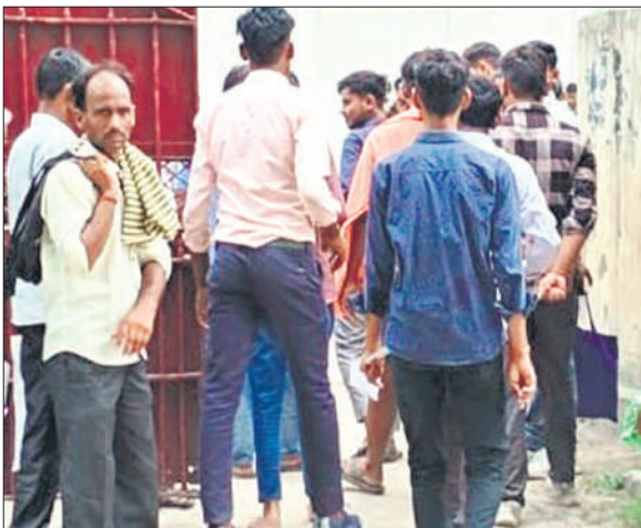
परीक्षा केंद्र में प्रवेश करते परीक्षार्थी।

छात्र-छात्राओं का प्रवेश पत्र और आधार कार्ड देखकर ही परीक्षा केंद्र पर दिया प्रवेश