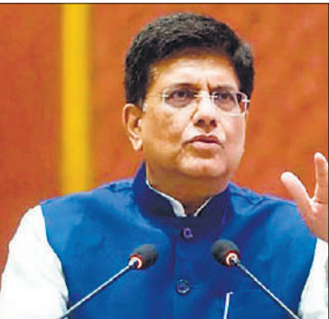
● कहा- 22 से 23 वर्ष की कशमकश के बाद संभव हुआ यह समझौता