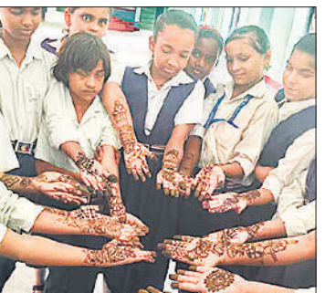
प्रतियोगिता के बाद मेहंदी दिखाती छात्राएं।

अमृत विचार : मीरा चौकी स्थित श्री राम सरस्वती विद्या मंदिर इंटर कॉलेज में हरियाली तीज मनाई गई। इस मौके पर पर पत्नी की बीमारी का हवाला देते हुए स्थानांतरण रुकवाने का लेखाकार ने हर बार की तरह प्रयास किया था। लेकिन आंतरिक लेखा निदेशक ने खारिज करते हुए डीएम को कार्यमुक्त करने के आदेश दिए थे। लेकिन निदेशक के आदेशों का अभी तक पालन नहीं हो सका है।