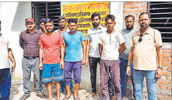
शिकायत करने के लिए विद्युत उपकेंद्र पहुंचे गांव ब्यौर के ग्रामीण।

रोप है कि लेखाकार प्रधानों और सफाई से अवैध धन उगाही कर रहा है। विरोध करने पर स्थानांतरण कराने की धमकी देता है। आरोप है कि प्रधानों और सफाई कर्मियों को लेखाकार अपने आवास पर बुलाकर धन की वसूली करता है। सफाई कर्मियों ने लेखाकार को कार्यमुक्त किए जाने की मांग की है। साथ ही चेतावनी दी है कि अगर लेखाकार को कार्यमुक्त नहीं किया