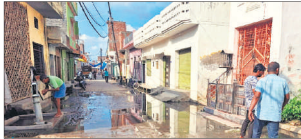
बिल्सी के मोहल्ला पांव में शिव मंदिर के सामने भरा गंदा पानी।