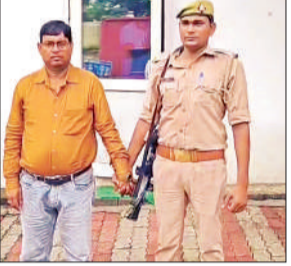
पकड़ा गया लेखपाल।

एंटी करप्शन टीम को शिकायत मिली थी कि नानपारा तहसील के मोहरबा के लेखपाल ने एक व्यक्ति से जमीन पर कब्जा न हटवाने के