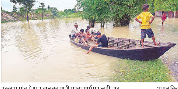
नकहरा गांव में भरा बाढ़ का पानी मुख्य मार्ग पर लगी नाव।

वहीं नदी का जलस्तर स्थिर होने से कटान तेज हो गयी है और ग्राम बेहटा, पारा, मांझा रायपुर, बहुवन मदार माझा, घरकुड़यां और चंदापुर किटौली के सामने सैकड़ों बीघा फसल व खाली पड़ी जमीन कटान की जद में आकर नदी में समा गई है। गुरुवार शाम से शुक्रवार तक नदी ने बेहटा, नकहरा, पारा और