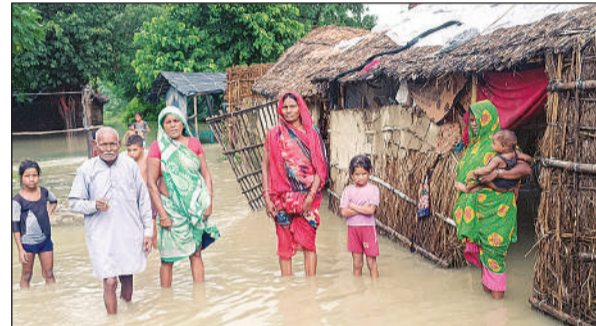
बाढ़ के पानी में खड़े नकहरा के ग्रामीण।

रातभर चूल्हा नहीं जला। चार प्यूडी और थोड़ी-सी सब्जी बच्चों को खिलाकर सुलाया। वो भी कैसे सोते, जब चायपाई के नीचे पानी भरा हो? बेटा परदेस में मजदूरी कर रहा है और वह पोते-पोतियों को छत पर