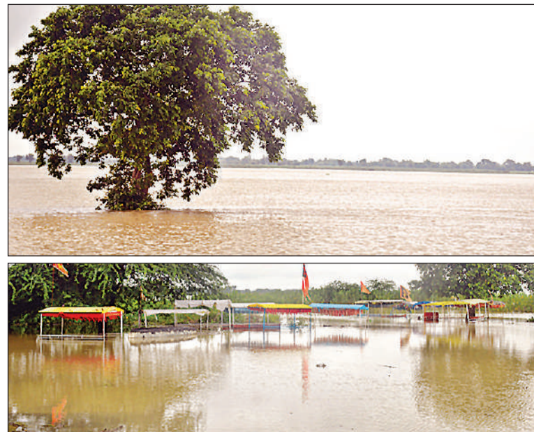
● अमृत विचार सरयू में आए उफान से निर्मली कुंड तक पहुंचा पानी (ऊपर) एवं गुप्तारघाट के निकट पानी में डूबी नावें।