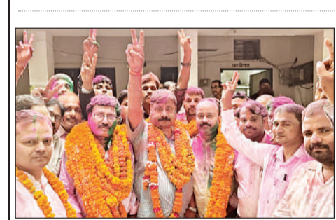
बार एसो. चुनाव नतीजे आने के बाद खुशी जताते विजयी प्रत्याशी।