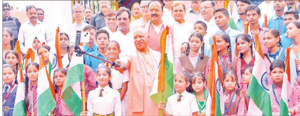
लखनऊ में शुकवार को मुख्यमंत्री योगी आदित्यनाथ ने काकोरी शहीद स्मारक पर विद्यार्थियों के साथ सेरफीली।

उन्होंने कहा कि देश की आर्थिक ताकत भी राष्ट्रनिर्माण से जुड़ी है और जब हम विदेशी वस्तुएं लेते हैं, तो न सिर्फ हमारा पैसा विदेश जाता है, बल्कि वही पैसा आतंकवाद और उग्रवाद में उपयोग होता है। उन्होंने अपील की कि आने वाले ल्यूहारों (रक्षाबंधन, जन्माष्टमी, दशहरा, दीपावली, छठ) में स्वदेशी वस्तुएं ही उपहार में दें और खरीदें। 2 अक्टूबर को सभी से गांधी आश्रम जाकर खादी खरीदने का संकल्प लेने की