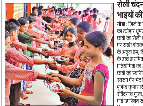
पूर्व माध्यमिक विद्यालय बेलवा नोहर में छात्रों को राखी बांधती छात्राएं।