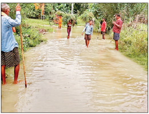
बलुडयामाझा में गांव में भरा बाढ़ का पानी एवं जानवरों के लिए चारे की व्यवस्था करते बाढ़ प्रभावित लोग।