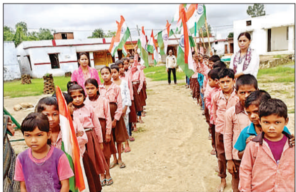
तिरंगा रैली में शामिल छात्र-छात्राएं और शिक्षक।

अंबेडकरनगर, अमृत विचार। बीते 2 अगस्त से 15 अगस्त तक तीन चरणों में आयोजित हो रहे हर घर तिरंगा कार्यक्रम के तहत प्रथम चरण में शुक्रवार को जनपद के विभिन्न स्कूलों, कॉलेजों और शैक्षणिक संस्थानों में तिरंगा रंगोली प्रतियोगिता, तिरंगा रैली सहित अनेक राष्ट्रप्रेम एवं देशभक्ति से जुड़े कार्यक्रमों और प्रतियोगिताओं का सफल आयोजन किया गया। इस अवसर पर विभिन्न विद्यालयों के विद्यार्थियों ने राष्ट्रप्रेम एवं देशभक्ति के जयकारों के साथ तिरंगा रैली निकाली। हाथों में तिरंगा लेकर राष्ट्रीय एकता, अखंडता और देशभक्ति का संदेश जन-जन तक पहुंचा गया। कार्यक्रम के दौरान प्रतिभागियों में विशेष उत्साह और जोश देखने को मिला।