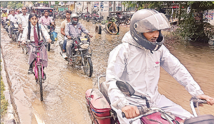
टॉमसन इंटर कॉलेज के सामने गोंडा-लखनऊ राजमार्ग पर जलभराव के बीच गुजरते लोग।

रात से शुरू हुई बारिश से शहर के टॉमसन इंटर कालेज के पास गोंडा लखनऊ राजमार्ग पर जलभराव हो गया। बारिश से सड़क तालाब बन गयी और इस जलभराव से वाहन चालकों व अन्य राहगीरों को मुश्किलों का सामना करना पड़ा। खासकर स्कूली बच्चों और दोपहिया वाहन चालकों को काफी मुश्किल हो रही है। शहर का मुख्य मार्ग होने के बावजूद सड़क से जलनिकासी का प्रबंधन होना सवाल खड़े कर रहा