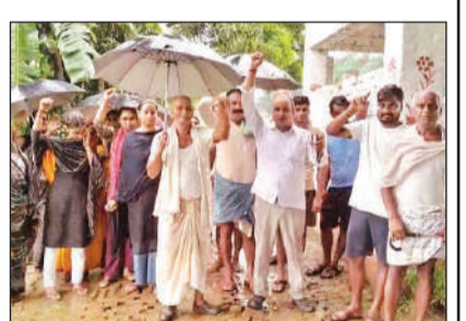
अपनी मांगों को लेकर विरोध प्रदर्शन करते ग्रामीण।