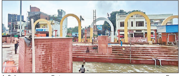
तेजी से बदल रहा वृहस्पति कुंड का आकार।

अमृत विचार: अब टेढ़ीबाजार स्थित वृहस्पति कुंड का सौंदर्यीकरण कराया जा रहा है। यह कुंड दक्षिण भारत के पर्यटकों को भी खूब भायेगा। ऐसा इसलिए क्योंकि यहां पर दक्षिण भारत के तीन महान व भक्ति गीतों के दिवंगत संगीतकारों की मूर्तियां सुशोभित होंगी। तद्विषय 4.49 करोड़ की लागत से तैयार हो रहे इस कुंड को महीने डेढ़ महीने में पर्यटकों के लिए खोल दिया जाएगा। श्रीराम की पावन नगरी एक बार फिर अपनी प्राचीन और आध्यात्मिक धरोहरों को सहेजने की दिशा में कदम