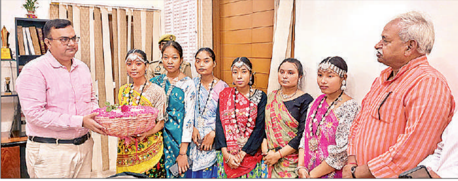
जिलाधिकारी अक्षय त्रिपाठी को राखी बांधने पहुंची थारू समुदाय की युवतियां और सद्भावना संस्था के अध्यक्ष। ● अमृत विचार

चूँकि यह कार्यक्रम पूर्व नियोजित था अतः जिलाधिकारी अपने आफिस में ही थे उन्होंने सबको बिठाया व राखी लेकर पहुंची थारू समाज की बेटियों से उनका परिचय जाना। डीएम