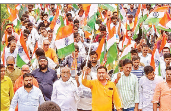
करनैलगंज में तिरंगा यात्रा निकालते भाजपा कार्यकर्ता।

दुखहरन नाथ मंदिर के बारे में मान्यता है कि लोक कथाओं के अनुसार भगवान शिव भगवान राम के दर्शन के बाद कैलाश लौट रहे थे तो इस स्थान पर विश्राम किया था और भक्तों के सारे दुख हर लिए थे,