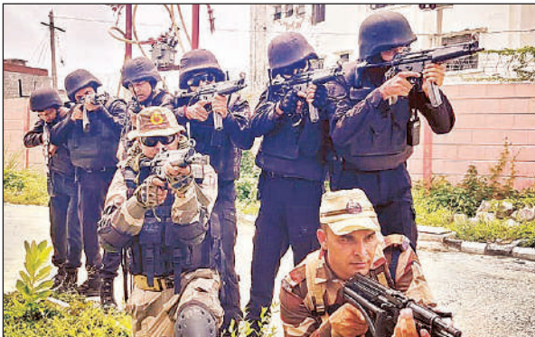
मॉक एक्सरसाइज के दौरान तैनात कमांडो।

इस मॉक एक्सरसाइज में कुछ डमी आतंकवादियों ने एयरपोर्ट परिसर में एक बस के ऊपर कब्जा करके उसे एयरपोर्ट के परिचालन क्षेत्र में जबरन घुसने की कोशिश की। वहां इट्यूटी पर तैनात सीआईएसफ कर्मियों ने गेट के बाहर लगे टायर कीलर का प्रयोग