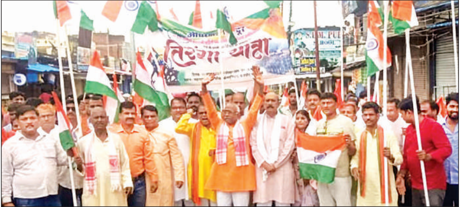
हाटा नगर पंचायत से तिरंगा यात्रा निकालते लोग।

होकर अध्ययन करें, शिक्षक शोधपूर्ण शिक्षा दें और शोधार्थी समाजोपयोगी अनुसंधान करें इसी से विश्वविद्यालय अग्रणी बनेगा और अग्रणी विश्वविद्यालय ही नए भारत को सशक्त करेगा। तिरंगा महोत्सव के अंतर्गत आयोजित प्रदर्शनी का मुख्य उद्देश्य स्थानीय व्यवसाय और स्टार्टअप के प्रति जागरूकता बढ़ाना था। प्रदर्शनी में विशेष रूप से बर्दपुर के बुद्धा डिलाइट द्वारा जिला वन उत्पाद के अंतर्गत काला नमक चावल से बनी कुकीज को प्रदर्शित किया गया, जिसे भगवान बुद्ध के प्रसाद के रूप में भी सराहा गया। बुद्ध डिलाइट के प्रबंध निदेशक