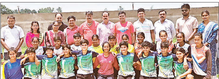
मंडलीय स्कूली हैंडबॉल का खिताब जीतने वाली अयोध्या की टीम।

मंडलीय प्रतियोगिता के अंडर -14 बालिका व अंडर-17 बालक वर्ग में अयोध्या की टीम विजेता रही। अंडर-14 बालक वर्ग में सुल्तानपुर व अंडर-17 में आंबेडकरनगर की टीम उपविजेता रही। अंडर -19 बालक वर्ग में अयोध्या की टीम ने