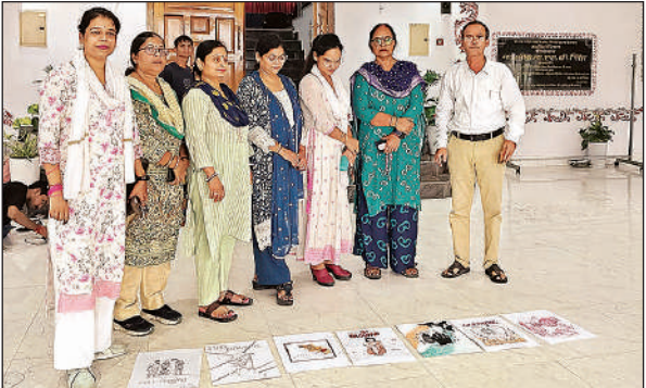
अवध विवि में रंगोली प्रतियोगिता के दौरान मौजूद ललित कला विभाग की शिक्षिकाएं।