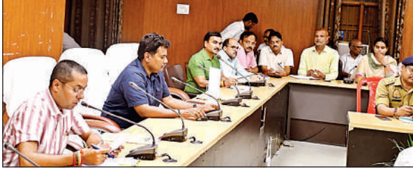
बैठक के दौरान अधिकारियों को निर्देश देते डीएम डॉ. राजा गणपति आर .।

सिद्धार्थनगर , अमृत विचार : 79वां स्वतंत्रता दिवस 15 अगस्त 2025 को परम्परागत एवं सादगीपूर्ण ढंग से मनाये जाने के लिए कलेक्ट्रेट सभागार में डीएम डा. राजा गणपति आर. की अध्यक्षता बैठक सम्पन्न हुई। बैठक में जिलाधिकारी ने कहा कि स्वतंत्रता दिवस के अवसर पर सुबह 8 बजे कलेक्ट्रेट में ध्वजारोहण किया जायेगा और इसी तरह समस्त विभागों एवं शिक्षण संस्थाओं आदि में ध्वजा रोहण अधिकारियों कर्मचारियों की उपस्थिति में किया जायेगा तथा पूर्व की भांति सरकारी भवनों, चौराहों पर सजावट कराई जायेगी। जिलाधिकारी ने बताया कि सुबह 7.00 बजे स्कूली बच्चों द्वारा प्रभात फेरी निकाली जायेगी एव देश भक्ति से संबंधित नारे लगाये जायेंगे। इस अवसर पर झण्डा अभिवादन और राष्ट्र गायन राष्ट्रीय गीत का गायन किया जायेगा। 10.00 बजे रक्तदान शिविर