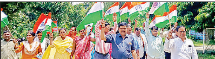
मया में पैदल रैली निकलते ब्लॉक के कर्मचारी।