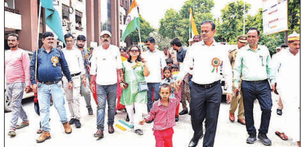
दिव्यांग बच्चों के साथ तिरंगा यात्रा में प्रतिभाग करते जिलाधिकारी।