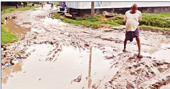
बंजारा टोला-लोरपुर ताजन के रास्ते में जमा कीचड़ के बीच से गुजरता वृद्ध। अमृत विचार

लोरपुर ताजन, पीरपुर से बंजारा टोला होकर मरैला स्थित जिला कारागार के निकट मार्केट से हजारों घरों को जोड़ने वाला वाई संख्या 01 का यह मुख्य मार्ग है। यह रास्ता हल्की बरसात से भी नारकीय हो जाता है। नालिया दूटकर अस्तित्व विहीन हो चुकी हैं। जबकि बड़ी संख्या में आम