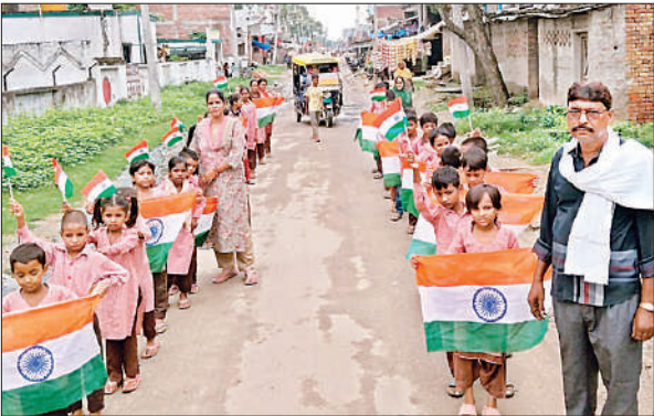
तिरंगा यात्रा निकालते प्राथमिक विद्यालय प्रथम के बच्चे।