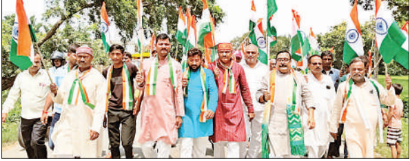
तिरंगा यात्रा में शामिल भाजपा जिला अध्यक्ष व अन्य पदाधिकारी कार्यकर्ता।

सभासद, नगर मंडल के पदाधिकारी, सभी शक्ति केंद्र प्रमुख, मोर्चा अध्यक्ष, महामंत्री, प्रदेश पदाधिकारी, जिला पदाधिकारी व नगरवासी शामिल हुए।