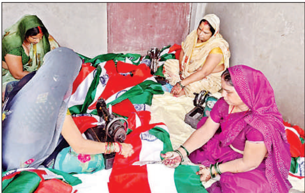
रुदौली ब्लॉक क्षेत्र में तिरंगा तैयार करती एसएसजी की महिलाएं।