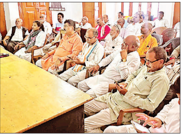
राहुल गांधी के कार्यक्रम को देखते कांग्रेस कार्यकर्ता।