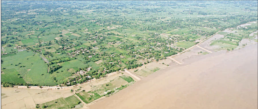
बाढ़ की झेन से ली गई तस्वीर।

ग्राम चंदापुर कटौली के तीन मजरों सहित नकहरा के नौ मजरों को प्रशासन बाढ़ग्रस्त मान रहा है, इसके अलावा बिचला, धुसवा, नाऊ पुरवा, खोलहरियन पुरवा दक्षिणी, पश्चिमी, सियाराम पुरवा, दमरौन पुरवा, मुखियाम पुरवा, कोहारन पुरवा, चमारन पुरवा और