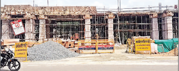
राम मंदिर परिसर के क्रॉसिंग 11 पर निर्माणाधीन शंकराचार्य द्वार।

● चार द्वारों में से रामानंदाचार्य और रामानुजाचार्य बनकर हुआ तैयार