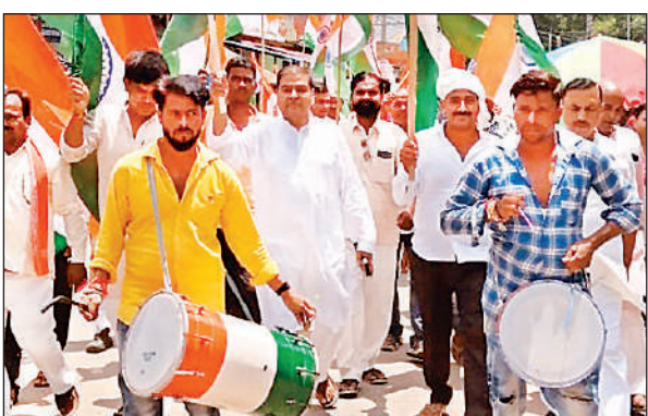
खरगपुर में पूर्व चेयरमैन के नेतृत्व में तिरंगा यात्रा निकालते हुए लोग।