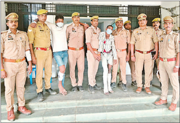
मुठभेड़ में गिरफ्तार घायल दुष्कर्म के आरोपियों के साथ पुलिस टीम। ● अमृत विचार

घटना बीती 11 अगस्त की है, जब 21 वर्षीया पीड़िता अपने मामा के घर से अकेले घर लौट रही थी। रास्ते में आरोपियों ने उसे लिफ्ट देने के बहाने मोटरसाइकिल