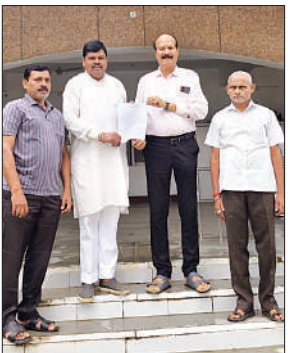
ज्ञापन देने कलेक्ट्रेट पहुंचे व्यापारी नेता।