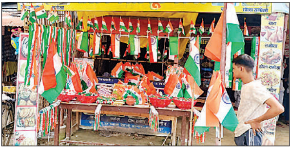
देहली बाजार में शुक्रापुर चौराहे पर तिरंगे से सजी दुकान।

इस बार लगातार दो दिनों के त्योहारों को लेकर न केवल बाजार