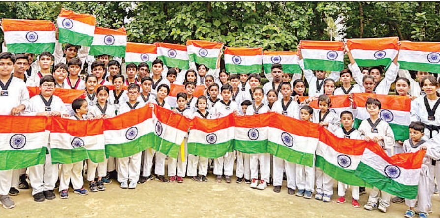
तिरंगे से नहाया खेल मैदान । गोंडा ताड़क्वांडो एसोसिएशन के बैनर तले गांधी पार्क के खेल मैदान में खिलाड़ियों ने तिरंगा हाथ में लेकर वंदेमातरम, भारत माता की जय के नारे लगाए ।