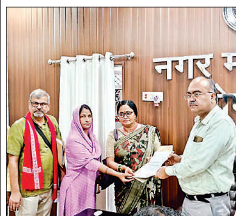
मजिस्ट्रेट को ज्ञापन देते लोग ।