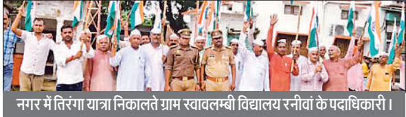
नगर में तिरंगा यात्रा निकालते ग्राम स्वावलम्बी विद्यालय रनीवां के पदाधिकारी।