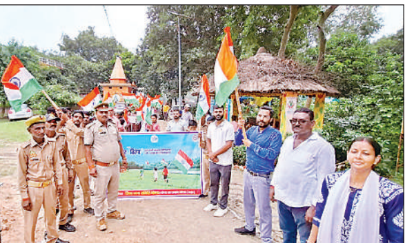
हर घर तिरंगा यात्रा में प्रतिभाग करते लोग ।