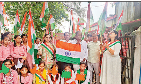
तिरंगा यात्रा निकालते बच्चे।