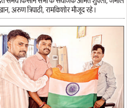
तिरंगा भेंट करते फार्मासिस्ट फेडरेशन के लोग ।