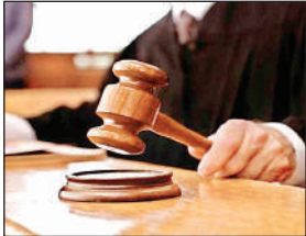
विधि संवाददाता, सुलतानपुर