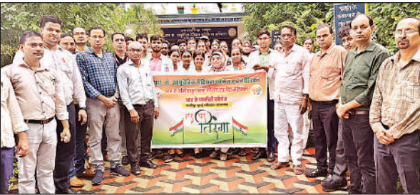
तिरंगा यात्रा में शामिल विद्यालय के प्रबंधन कर्मचारी और छात्र।