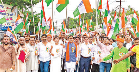
शहर में घेयरमैन के नेतृत्व में निकाली गई तिरंगा यात्रा।

नगर पालिका प्रांगण से शुरू हुई तिरंगा यात्रा शाहरांग चौराहा, बाधमंडी, पंचरास्ता, ठठेरी बाजार, घंटाघर, बस स्टेशन होते हुए आजाद पार्क और विकास भवन