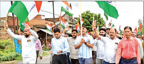
खंड विकास कार्यालय मया बाजार से तिरंगा यात्रा निकालते कर्मचारी।

अयोध्या, अमृत विचार : जिले में बुधवार से हर घर तिरंगा अभियान का तीसरा चरण शुरू हो गया। रैलियां निकाली गईं। रैली में विभागों के कर्मचारी शामिल रहे। स्कूली बच्चों ने भी रैलियां निकाली। लोगों को जागरुक करने के साथ उन्हें तिरंगे के साथ सेल्वी लेकर अपोलोड किए जाने के लिए प्रेरित किया गया। अब सभी शासकीय भवनों, शैक्षणिक संस्थानों, होटलों, कार्यालयों, बौधों, पुलों आदि पर ध्वजारोहण समारोह और तिरंगा प्रकाश व्यवस्था की तैयारी शुरू कर दी गई। 15 अगस्त को सुबह से ही कार्यक्रमों की झड़ी लगेगी। ध्यान रहे झंडा फहराते समय केसरिया रंग की पट्टी झंडे के ऊपर की ओर होनी चाहिए। सूर्योदय के बाद ध्वजारोहण किया जाना चाहिए। सूर्यास्त के साथ सम्मान के साथ उतारना चाहिए।