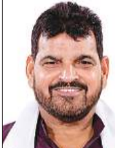
बृजभूषण शरण सिंह पूर्व सांसद, भाजपा।

उन्होंने सवाल किया कि कितने टुकड़े करोगे इस देश के। हिंदुस्तान की राजनीति में हिंदू को गाली देकर राजनीति नहीं कर सकते। पूर्व सांसद ने कहा कि अच्छा होता कि इस बैठक में अन्य वर्ग के विधायक भी शामिल होते। बैठक में आमंत्रित किए जाने के सवाल पर उन्होंने कहा