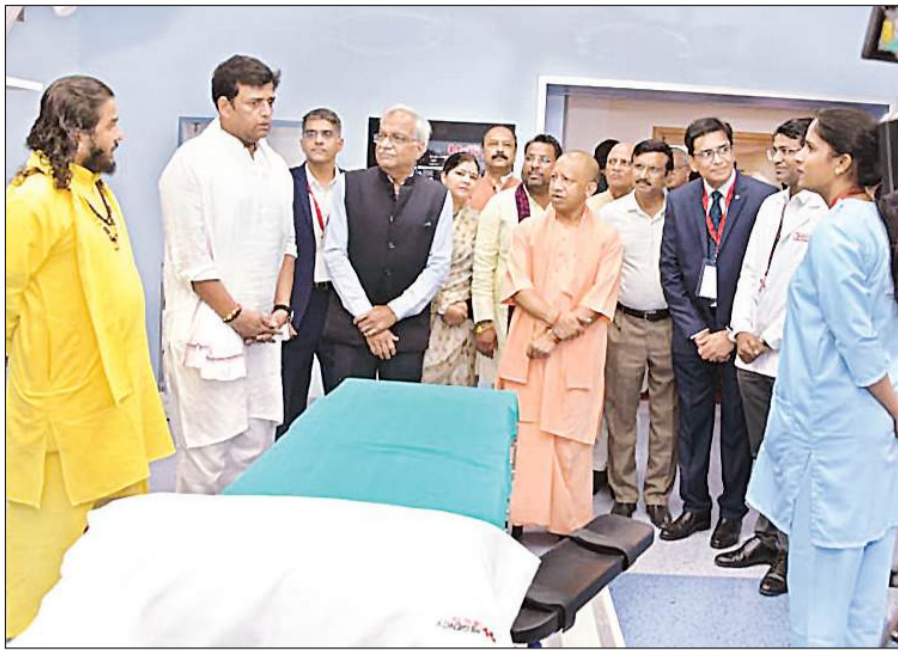
गोरखपुर में रीजेंसी हॉस्पिटल का लोकार्पण करने के बाद उपलब्ध सुविधाओं की जानकारी लेते मुख्यमंत्री योगी।

मुख्यमंत्री योगी रविवार को गोरखपुर में निजी क्षेत्र के रीजेंसी हॉस्पिटल के लोकार्पण के बाद समारोह को संबोधित कर रहे थे। उन्होंने हॉस्पिटल का निरीक्षण कर सुविधाओं का जायजा भी लिया। साथ ही, हॉस्पिटल के पेशेंट एप 'रीजेंसी माई केयर' को भी लांच किया। योगी ने कहा कि गोरखपुर में उच्च स्तरीय इलाज के लिए अब न तो स्पेशलिटी सुविधाओं की