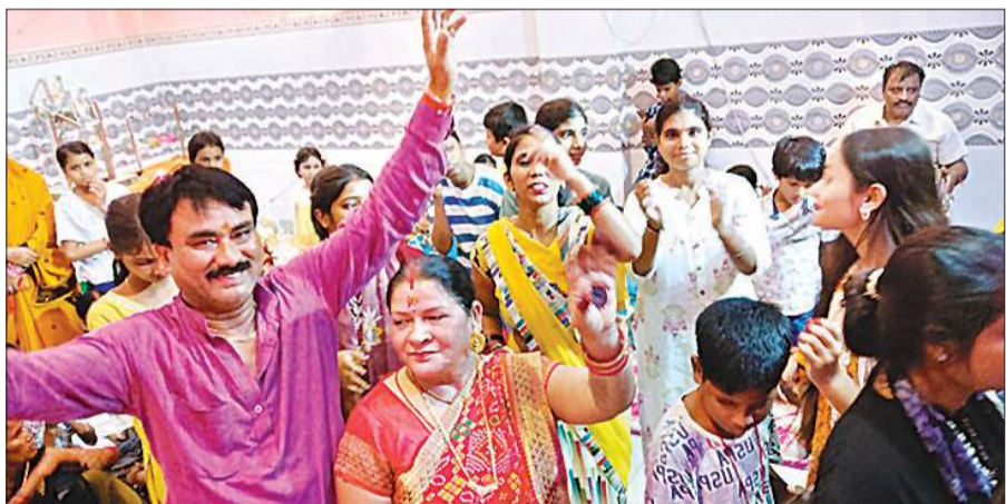
श्री कृष्ण जन्मोत्सव के अवसर पर झूमते श्रद्धालु।