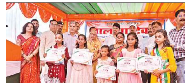
बाल वाटिका के शुभारंभ के मौके पर सम्मानित किए गए मेधावी।

उन्होंने बताया कि कोई भी विद्यालय बंद नहीं होगा, बल्कि मर्ज हुए विद्यालयों में अब बच्चों के चहुमुखी विकास के लिए बाल वाटिका संचालित होगी। इससे छात्र-छात्राओं को प्राथमिक कक्षाओं से पूर्व प्रारंभिक शिक्षा का बेहतर