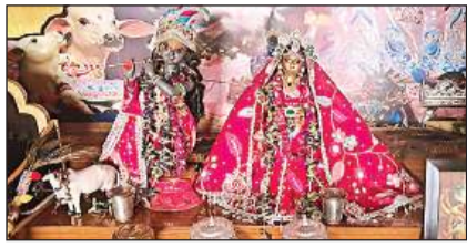
इस्कॉन मंदिर में कृष्ण जन्माष्टमी पर सजा राधा-कृष्ण का विग्रह।