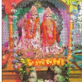
राधा-कृष्ण के विग्रह का किया गया श्रृंगार।

इस अवसर पर जनप्रतिनिधिगण, पुलिस अधिकारीगण व अन्य गणमान्य व्यक्ति अपने परिवार के साथ उपस्थित रहे।