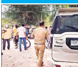
सड़क हादसे के बाद मौके पर मौजूद पुलिसकर्मी और लोग।

पकड़कर पुलिस को सूचना दी। सूचना पर पहुंची पुलिस नेचालक और वाहन को कब्जे में ले लिया है।