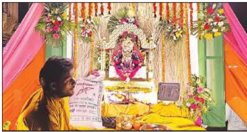
छोटी देवकाली से निकाली गई शोभायात्रा की झांकी।

अमृत विचार : रामनगरी में शनिवार की रात 12 बजे भगवान श्रीकृष्ण का जन्मोत्सव धूमधाम से मनाया गया। सुबह से श्रीराम के साथ राधेकृष्ण के जयकारों से अयोध्या गूंजती रही। राम मंदिर में भी जन्माष्टमी मनाई गई। रात 12 बजे गर्भगृह में विराजमान रामलला का पट खोला गया। जन्माष्टमी पर राम मंदिर में विशेष इंतजाम किए गए थे। मंदिर परिसर को फूलों से सजाया गया। भगवान को डेढ़ किंवदंतल पंजीरी और 50 लीटर चरणामृत के साथ 56 व्यंजनों का