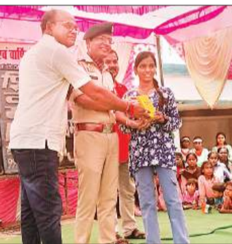
छात्रा को सम्मानित करते मुख्य अतिथि।

गोंडा, अमृत विचार : स्वतंत्रता दिवस पर पीएमश्री कंपोजिट विद्यालय कुतुबगंज में भव्य समारोह का आयोजन किया गया। इस अवसर पर बच्चों ने देशप्रेम पर आधारित सांस्कृतिक कार्यक्रम प्रस्तुत किये।