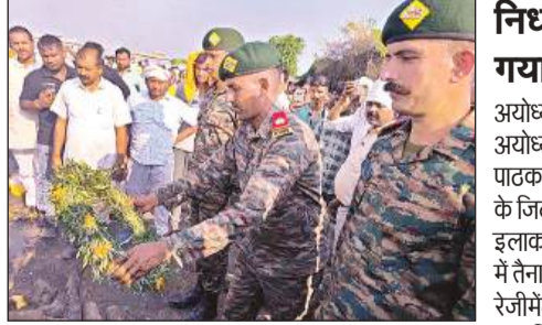
श्रद्धांजलि अर्पित करते सेना के जवान।