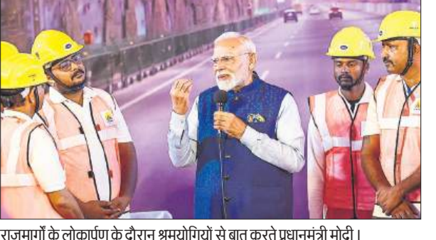
राजमार्गों के लोकार्पण के दौरान भ्रमयोगियों से बात करते प्रधानमंत्री मोदी।

प्रधानमंत्री नरेन्द्र मोदी ने रविवार को राष्ट्रीय राजधानी और उसके आसपास के इलाकों में यातायात की भीड़भाड़ कम करने के उद्देश्य से लगभग 11,000 करोड़ रुपये की लागत से बने द्वारका एक्सप्रेसवे के दिल्ली खंड और शहरी विस्तार मार्ग-दो (यूईआर-दो) का उद्घाटन किया। ये दोनों मार्ग राजधानी में यातायात की भीड़ कम करने की सरकार की व्यापक योजना के तहत बनाए गए हैं। इसका उद्देश्य दिल्ली व उसके आसपास के इलाकों में कनेक्टिविटी में सुधार, यात्रा समय में कटौती और यातायात के दबाव को कम करना है।