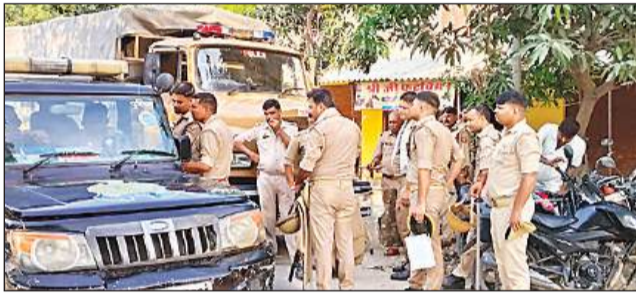
देवई गांव में बवाल के बाद तैनात पुलिस व पीएसी बल।

अमृत विचार : सोशल मीडिया पर जातीय विवादित टिप्पणी करने से नाराज करीब तीन गांव के 50 से ज्यादा युवकों ने थाना रौनाही क्षेत्र के देवई गांव में घुसकर दो परिवारों पर जानलेवा हमला किया, जो भी जहां मिला उसे जमकर पीटा। आरोप है कि आरोपी अवैध असलहों से भी लैस थे। इसमें कई घायल हो गए। वहीं गांव के लोगों के एकत्र होने पर सभी अपनी बाइक छोड़कर भाग खड़े हुए। इससे गांव में तनाव फैल गया। पुलिस ने बाइकों को कब्जे में लेकर 10 नामजद व अज्ञात के खिलाफ केस दर्ज कर तीन को गिरफ्तार कर लिया है। गांव में एहतियातन पीएसी की तैनाती कर दी गई है।