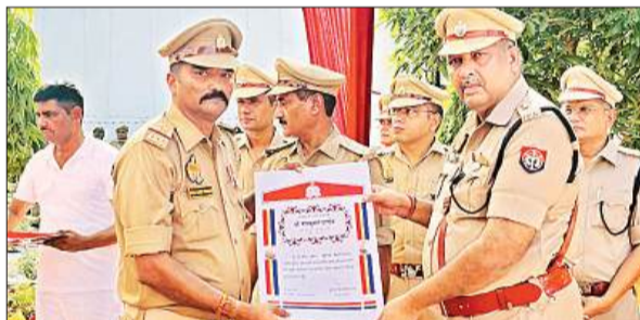
रामगांव के थानाध्यक्ष को सम्मानित करते पुलिस अधीक्षक।

इस अवसर पर लोगों को मिष्ठान विचारित कर स्वतंत्रता दिवस की शुभकामनाएं दी गई। इसी क्रम में नगर पंचायत कार्यालय पर