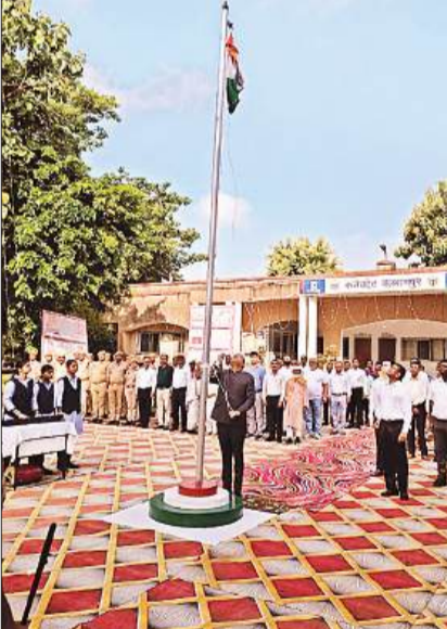
कलेक्ट्रेट में ध्वजारोहण करते जिला अधिकारी व मौजूद लोग।

जिले के अर्द्धसरकारी कार्यालयों, बैंकों और निगमों में कर्मचारियों ने ध्वजारोहण कर राष्ट्रगान गाया। वहीं नगर व ग्रामीण क्षेत्रों के सभी सरकारी और निजी विद्यालयों में बच्चों ने सांस्कृतिक कार्यक्रम प्रस्तुत किए। प्रभात फेरी, भाषण और देशभक्ति गीतों से माहौल देशभक्ति से सराबोर रहा।