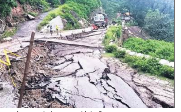
कटुआ में बादल फटने और भूस्खलन होने से क्षतिग्रस्त सड़क।

जम्मू-कश्मीर के कटुआ जिले में रविवार तड़के बादल फटने और भूस्खलन की दो अलग-अलग घटनाओं में पांच बच्चों समेत चार परिवारों के सात सदस्यों की मौत हो गई। जबकि कई लोग घायल हैं। जिले में रात भर हुई भारी बारिश के बीच राजबाग के जोध घाटी गांव और और जंगलोट में यह आपदा आई जिससे जलाशयों का जलस्तर बढ़ गया और कई निचले इलाकों में जलभराव हो गया है। कटुआ में बादल फटने की घटना जम्मू-कश्मीर के किरतवाड़ जिले के चिशोली गांव में 14 अगस्त को बादल