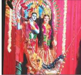
राधा-कृष्ण की सजी झांकी।