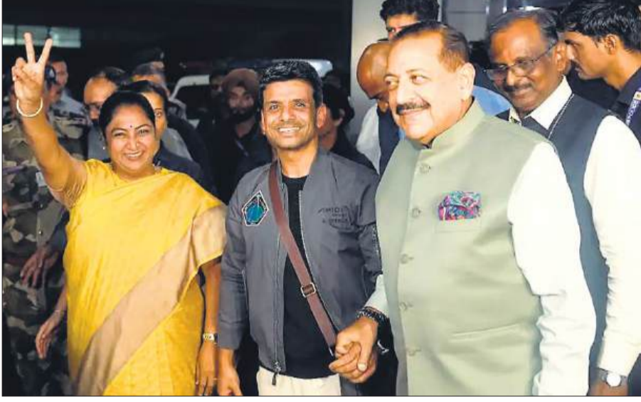
दिल्ली एयरपोर्ट पर शुभांशु शुक्ला का स्वागत करते केंद्रीय मंत्री जितेंद्र सिंह, दिल्ली की मुख्यमंत्री रेखा गुप्ता व अन्य।