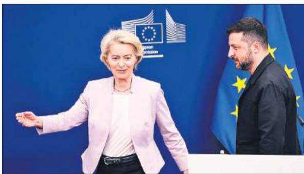
ईयू मुख्यालय में उर्सुला वॉन डेर लेयेन ने यूक्रेन के राष्ट्रपति जेलेंस्की से बात की।

यूरोपीय संघ की कार्यकारी शाखा की प्रमुख वॉन डेर लेयेन ने 'एक्स' पर पोस्ट किया, राष्ट्रपति जेलेंस्की के अनुरोध पर मैं कल व्हाइट हाउस में राष्ट्रपति ट्रंप और अन्य यूरोपीय नेताओं के साथ बैठक में शामिल होऊँगी। रविवार को एक के बाद एक कई यूरोपीय नेताओं ने भी घोषणा की कि वे वहाँ जा रहे हैं। इनमें फ्रांस के राष्ट्रपति इमैनुएल मैक्रों, जर्मनी के चांसलर फ्रेडरिक मर्ज और नाटो सैन्य गठबंधन के महासचिव मार्क रूटे शामिल हैं।