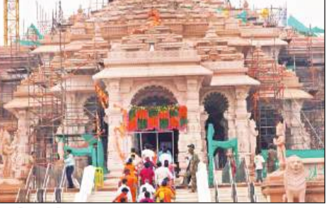
राम मंदिर का विहंगम दृश्य।

अमृत विचार: राम मंदिर में आने वाले सभी सुगम पास धारक श्रद्धालुओं को अब रामलला के साथ राम दरबार के भी दर्शन प्राप्त होंगे। श्री राम जन्मभूमि तीर्थ क्षेत्र ट्रस्ट ने सभी पास धारकों को राम दरबार के दर्शन कराए जाने की अनुमति दे दी है। इस सुविधा को 15 अगस्त से ही लागू कर दिया गया है। राम मंदिर में दर्शन करने के लिए आने वाले श्रद्धालुओं में 1800 विशिष्ट जनों को सुगम और विशिष्ट दर्शन पास जारी किया जा रहा है, जिसमें 6 अलग-अलग स्टाटा बनाए गए हैं। प्रत्येक स्टांट में 300 पास