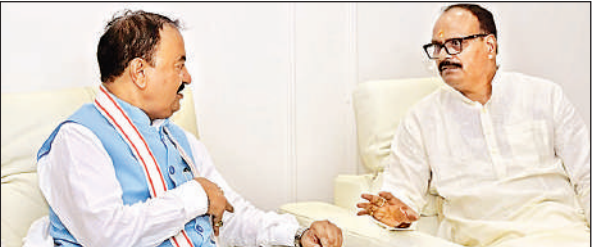
उप मुख्यमंत्री केशव प्रसाद मोर्य के लखनऊ स्थित सरकारी आवास पर मुलाकात करने पहुंचे उप मुख्यमंत्री ब्रजेश पाठक।

सोमवार को मुख्यमंत्री योगी आदित्यनाथ के दोनों उप मुख्यमंत्री की मुलाकात हुई। यह मुलाकात केशव प्रसाद मोर्य के लखनऊ स्थित सरकारी आवास पर उप मुख्यमंत्री