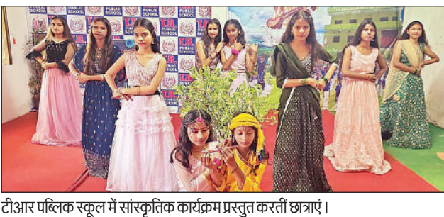
टीआर पब्लिक स्कूल में सांस्कृतिक कार्यक्रम प्रस्तुत करती छात्राएं।