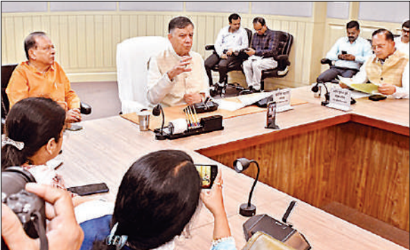
विधान भवन में पत्रकारों से वार्ता करते विधानसभा अध्यक्ष सतीश महाना।

सोमवार को विधानभवन में पत्रकारों से मुखातिब राज्य विधानसभा अध्यक्ष सतीश महाना ने कहा कि उप्र. अठारहवीं विधानसभा का वर्ष 2025 का द्वितीय सत्र अपने रचनात्मक विमर्श और अनुशासित कार्यवाही के लिए स्मरणीय बन गया। इस सत्र में विकसित भारत-विकसित उत्तर प्रदेश, आत्मनिर्भर भारत-आत्मनिर्भर उत्तर प्रदेश, विषय पर लगातार दो दिनों तक निरंतर चर्चा हुई, जिसने लोकतांत्रिक परंपरा को और अधिक मजबूती मिली।