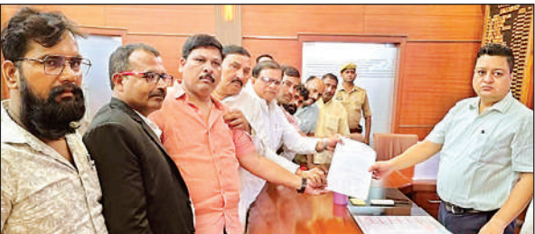
जिलाधिकारी को ज्ञापन सौंपते सपा नेता।