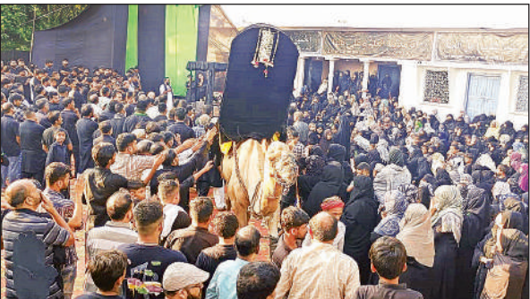
लोरपुर ताजन में अमारी का दीदार करते लोग।