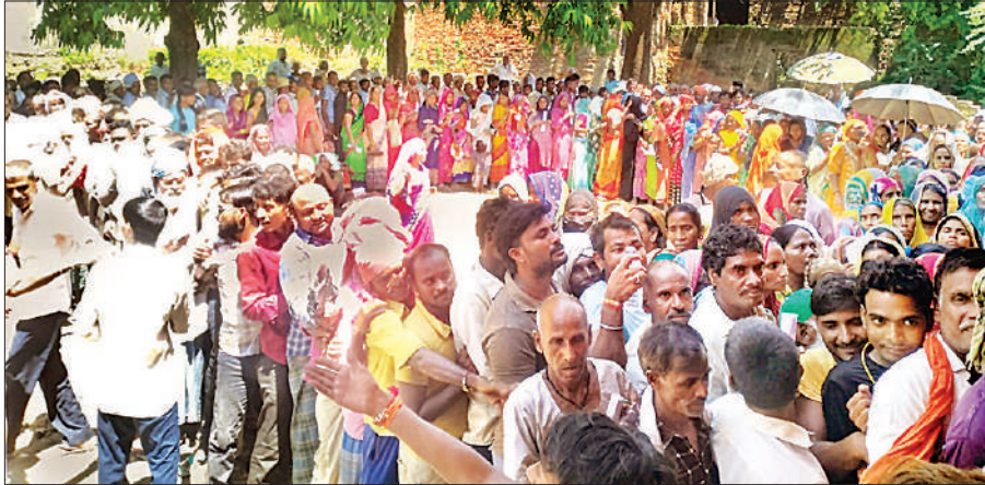
बाबागंज में खाद लेने के लिए उमड़ा किसानों का हुजूम।

विदित हो कि सोमवार को जिलाधिकारी के निर्देश पर पहुंची यूरिया खाद का वितरण होना था। इसकी सूचना जैसे ही क्षेत्र के किसानों को हुई वे हजारो की संख्या में किसान