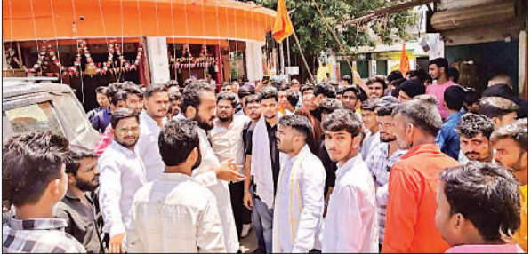
खेल मैदान का मांगपत्र सौंपते विद्यार्थी परिषद के पदाधिकारी।