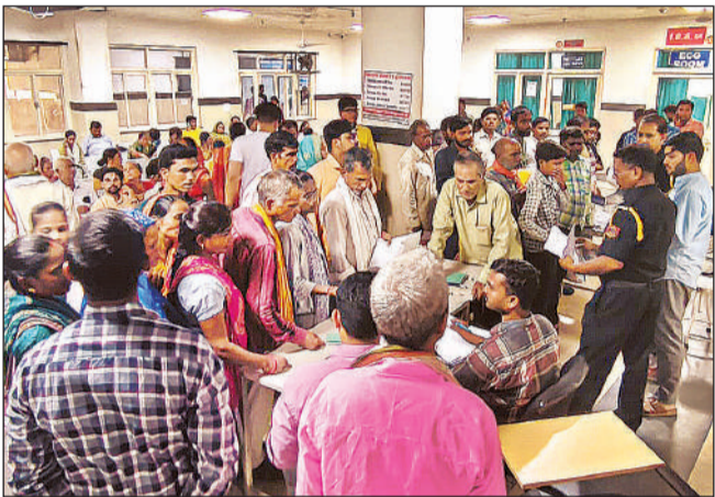
मेडिसिन ओपीडी में दिखाने के लिए अपनी बारी का इंतजार करते मरीज ।

चाइल्ड वार्ड में बेड की कमी साफ दिखाई दे रही है । रोजाना शाम को वार्ड, पीडियाट्रिक वार्ड और न्यू चिकित्सक मरीजों की स्थिति का