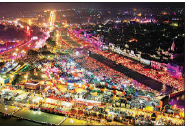
दीपों से जगमगाता राम की पैड़ी (फाइल फोटो) ।