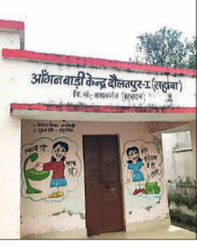
बंद पड़ा आंगनबाड़ी केंद्र।