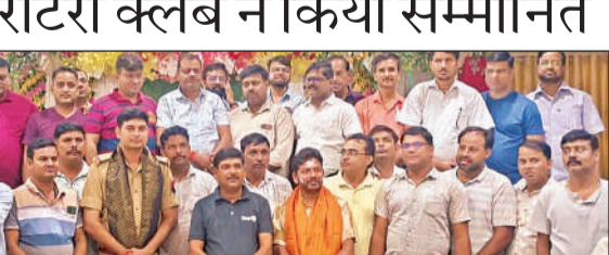
सम्मानित करते हुए रोटरी क्लब के पदाधिकारी व अतिथि।

ठहराव गाजियाबाद-दिल्ली शाहदरा-दिल्ली-सोनीपत-पानीपत-करनाल-कुरुक्षेत्र स्टेशनों पर नहीं रहेगा। दरभंगा से 21 नवम्बर,2025 को चलने वाली 02569 दरभंगा-नई दिल्ली विशेष गाड़ी परिवर्तित मार्ग बाराबंकी-लखनऊ-मुरादाबाद-गाजियाबाद के रास्ते चलाई जायेगी। मार्ग परिवर्तन के फलस्वरूप इस गाड़ी का ठहराव, ऐशबाग एवं कानपुर सेण्ट्रल स्टेशनों पर नहीं रहेगा।