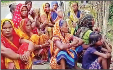
घटना के बाद मृतक के घर पर मौजूद महिलाएं ।

● पुलिस के हाथ पांव फूले, कोतवाली बीकापुर के संधुतारा गांव की घटना