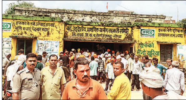
वजीरगंज में साधन सहकारी समिति पर यूरिया लेने के लिए खड़े किसान।

वजीरगंज साधन सहकारी समिति पर सुबह 10 बजे खाद वितरित की जाने की सूचना दी गई थी। जबकि सुबह 9 बजे से ही खाद वितरण शुरू कर दिया गया। किसानों का आरोप है कि सौ से अधिक किसानों की पर्ची पहले से ही खारिज की