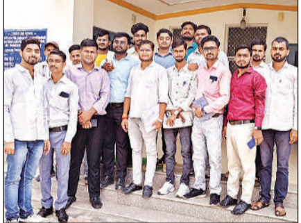
बैठक में मौजूद यूथ फार्मासिस्ट फेडरेशन के पदाधिकारी।