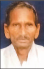
मेलादीन (फाइल फोटो)

● थाने में बोला, मैंने पिता की कर दी है हत्या, गिरफ्तार कर लें