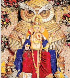
रानी बाजार में स्थापित प्रतिमा।

शहर के रानी बाजार में भगवान गणेश की भव्य प्रतिमा स्थापित की