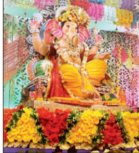
धानेपुर के करुणेश मंदिर में विराजे गणपति।

गयी है। यहां भगवान के दर्शन को भक्तों की कतार लगी रही। धानेपुर के करुणेश मंदिर में भगवान गणेश की स्थापना को साख पूजा पंडाल को भव्य तरीके से सजाया गया है