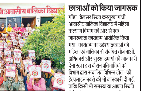
जागरूकता कार्यक्रम में मौजूद लोग।