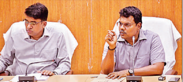
बैठक करते हुए जिलाधिकारी एवं मुख्य विकास अधिकारी।

बिना फिटनेस की बसों को बन्द करने का निर्देश दिया। बिना परमिट के चल रहे वाहनों पर कार्यवाही करने का निर्देश दिया तथा परमिट का उल्लंघन करने पर वाहन चलाने वालों पर कड़ी कार्यवाई करने का निर्देश दिया। जिलाधिकारी ने एआरटीओ को निर्देश दिया कि ओवर लोडिंग गाड़ियों नहीं चलनी चाहिए। ओवर लोडिंग वाहनों एवं