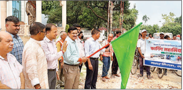
संचारी विशेष अभियान टीम को हरी झंडी दिखाकर रवाना करते महापौर।