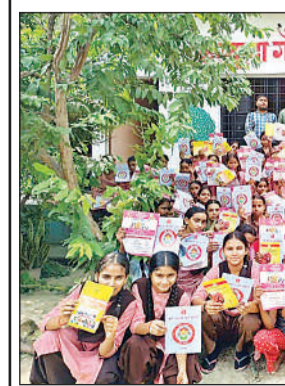
जागरूकता कार्यक्रम में मौजूद लोग।