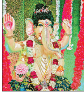
करनैलगंज में स्थापित गणेश प्रतिमा।

जो लोगों के आकर्षण का केंद्र है। भगवान विघ्नहर्ता का दर्शन करने के लिए बड़ी संख्या में श्रद्धालु पूजा पंडालों में पहुंच रहे हैं। करनैलगंज क्षेत्र मे चार स्थानों पर श्रीगणेश