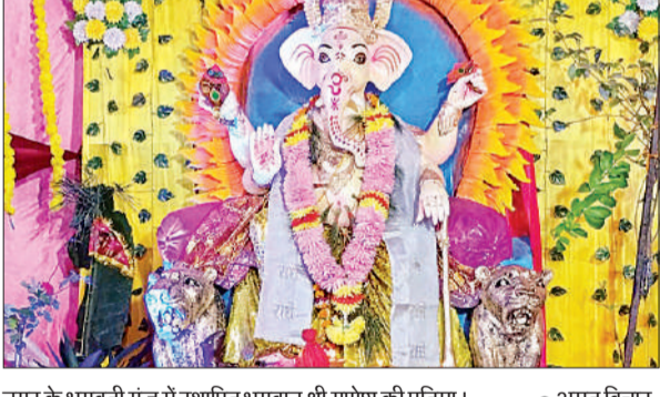
नगर के भगवती गंज में स्थापित भगवान श्री गणेश की प्रतिमा।

गणेश चतुर्थी का उत्सव आरंभ हो गया है। पूजा पंडालों में गणेश जी विराजे हैं। पंडालों में गणेश प्रतिमा देखने के लिए आमजन पहुंचे। गाजे-बाजे के साथ भगवान गणेश