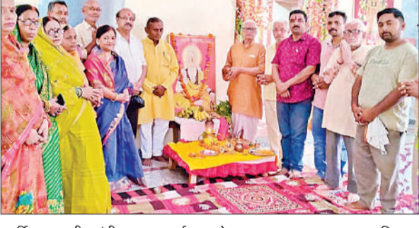
महर्षि कश्यप की जयंती पर पूजा-अर्चना करते श्रद्धालु।

यहां भक्ति-संगीत, झांकियों और सांस्कृतिक आयोजनों के बीच श्रद्धालु परिवार सहित पहुंचकर भगवान गणेश की आराधना कर रहे हैं। जगह-जगह रोशनी और सजावट ने माहौल को भव्य बना दिया है।