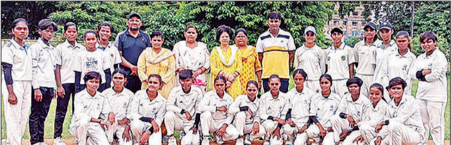
जिला बालिका स्कूली क्रिकेट की विजेता जीजीआईसी व बापू बालिका स्कूल की टीमें।