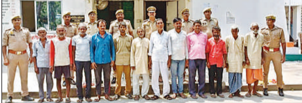
पुलिस गिरफ्त में वारंटी।