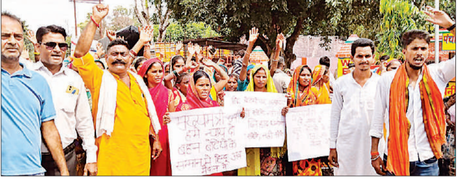
प्रदर्शन करते ग्रामीण।

अमृत विचार : एक महिला को दूसरे समुदाय के युवक द्वारा भगा ले जाने से नाराज ग्रामीण व आरोपी पक्ष के लोग आपस में भिड़ गये। दोनों पक्षों ने अपनी शिकायत नानपारा पुलिस से की। पुलिस ने पीड़ित के घर पर ही देर रात दबिश देकर लगभग एक दर्जन ग्रामीणों को उठा लिया। इससे नाराज सैकड़ों की संख्या में ग्रामीण नानपारा पहुंच गये और पुलिस पर पक्षपात का आरोप लगाते हुए प्रदर्शन किया। ग्रामीणों की नाराजगी इतनी थी कि