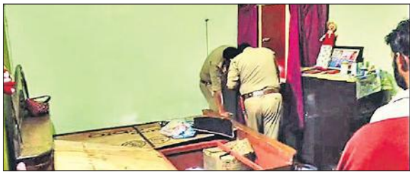
घर में जांच करते पुलिसकर्मी।