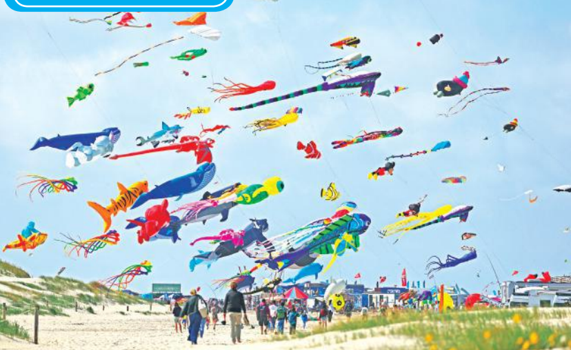
जर्मनी का सेंट पीटर-ऑर्डिंग जर्मनी का सबसे बड़ा समुद्र तट है और पतंगबाजी के लिए एक लोकप्रिय स्थान है। शुक्रवार को यहां शुरु हुए पतंग उत्सव के दौरान समुद्र तट पर अलग-अलग तरह की रंग-बिरंगी पतंगें उड़ती दिखाई दीं।

डार्क वेब इंटरनेट का वह हिस्सा है जिसे आम सर्व इंजन से नहीं खोजा जा सकता। डार्क वेब पर ड्रग्स, हथियार, नकली पहचान पत्र जैसी गैरकानूनी चीजों की खरीद-फरोख के साथ हैक किए गए डेटा का लेनदेन होता है। यहां यूजर की पहचान छुपी रहती है।