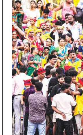
मछुआरा समुदाय के सदस्यों ने शुक्रवार को मुंबई के बधवार पार्क में नारली पूर्णिमा उत्सव मनाया। यह उत्सव हिंदू माह श्रावण की पूर्णिमा के दिन मनाया जाता है, इसमें मछुआरा समुदाय के लोग जोश-खरोश के साथ हिस्सा लेते हैं।