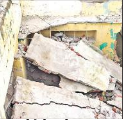
मकान की गिरी पक्की छत।