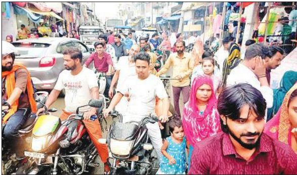
बाजार में राखी और मिठाई की खरीदारी के दौरान लगे जाम में फंसे रहे लोग।

शेरगढ़ में राखी, मिठाइयों और फलों की दुकानों पर भीड़ रही। राखी और मिठाई की दुकानों को आकर्षक ढंग से सजाया गया। बहनों ने भाईयों के लिए राखियां खरीदीं। कस्बे के अंदर शाही-शेरगढ़ मार्ग पर ई-रिक्षा यातायात व्यवस्था पर भारी पड़े तो बड़े वाहन भी मुख्य बाजार में खूब दौड़े जिससे लोगों को परेशानी का सामना