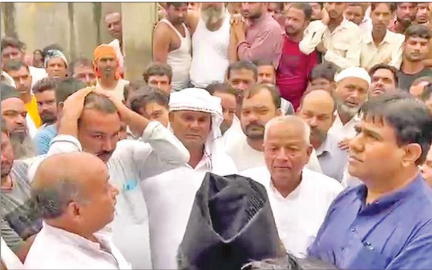
भीड़ के बीच विधायक और चेयरमैन के बीच तकरार हुई।