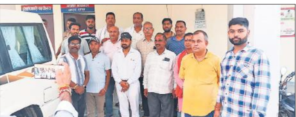
मीरगंज कोतवाली में प्रार्थना पत्र देकर निकलते ब्राह्मण समाज के लोग।