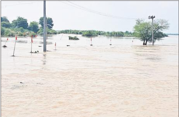
उसहैत क्षेत्र में गंगा का विकराल रूप।