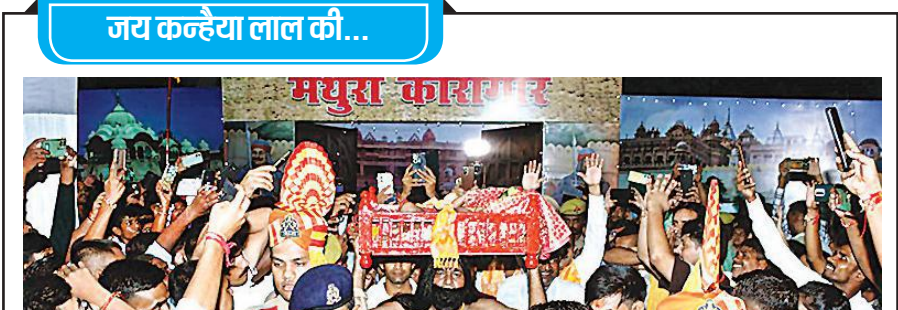
जन्माष्टमी पर्व पर लखनऊ में महानगर स्थित 35 बटालियन पीएसपी परिसर में बनाए गए मथुरा कारागार में भगवान कृष्ण के जन्म लेने के बाद झांकी निकालते पुलिसकर्मी व अन्य।

आयोग के सूत्रों के अनुसार, अभयारण्य व गोशाला विकास के तहत आयोग जल्द ही संबंधित जिलों की सूची तैयार करेगा। इससे गांवों में छुट्टा घूम रहे गोवंश से जहां किसानों को निजात मिल सकेगी, वहीं गोवंश के संवर्धन में तेजी आएगी। इसके अलावा प्रौद्योगिकी एकीकरण के तहत पतंजलि योगपीठ व आयोग की साझा टीम गोशालाओं की मैपिंग, समीक्षा, जियो-फेंसिंग, गाय गैंगिंग व फोटो डाटा बेस का कार्य होगा।