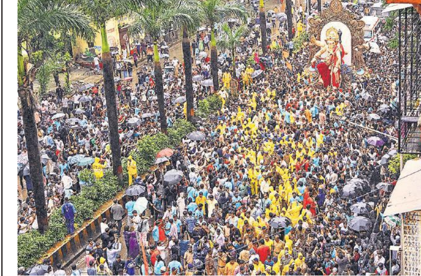
गणेश चतुर्थी उत्सव की देश भर में तैयारी शुरू हो गई है। रविवार को मुंबई में भगवान गणेश की मूर्ति ले जाते हुए लोग।