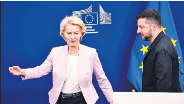
ईयू मुख्यालय में उर्सुला वॉन डेर लेयेन ने यूक्रेन के राष्ट्रपति जेलेंस्की से बात की।

ट्रंप और पुतिन के बीच शुरुवार को अलास्का में हुई शिखर बैठक में यूक्रेन और रुस के बीच लंबे समय से जारी युद्ध को समाप्त करने संबंधी बातचीत की गई हालांकि इस बैठक का कोई ठोस परिणाम नहीं निकला। अब सोमवार को ट्रंप वाशिंगटन में यूक्रेन के राष्ट्रपति जेलेंस्की और यूरोपीय नेताओं से मिलेंगे और उन्हें पुतिन के साथ हुई बातचीत का ब्योरा देंगे।