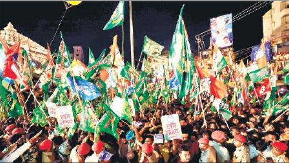
बिहार के औरंगाबाद में वोटर अधिकार यात्रा में उमड़ी कांग्रेस समर्थकों की भीड़।