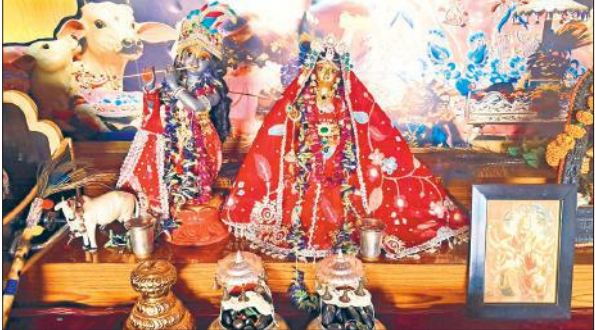
इस्कॉन अयोध्या मंदिर में कृष्ण जन्माष्टमी पर सजा राधा-कृष्ण का विग्रह।

जन्माष्टमी पर राम मंदिर में विशेष इंतजाम किए गए थे। मंदिर परिसर को फूलों से सजाया गया। भगवान को डेढ़ क्विंटल पंजीरी और 50 लीटर चरणांमृत के साथ 56 व्यंजनों का भोग भी लगाया गया। इस दौरान अयोध्या के कुछ साधु संत और श्रीराम जन्मभूमि तीर्थ क्षेत्र ट्रस्ट के पदाधिकारी मौजूद