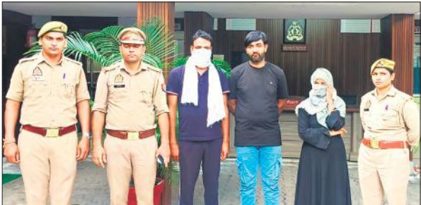
कटघर पुलिस की गिरफ्त में हनीट्रैप के आरोपी।