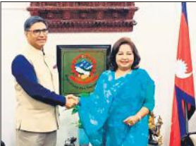
विदेशमंत्री आरजू राणा मिले विक्रम मिसरी।