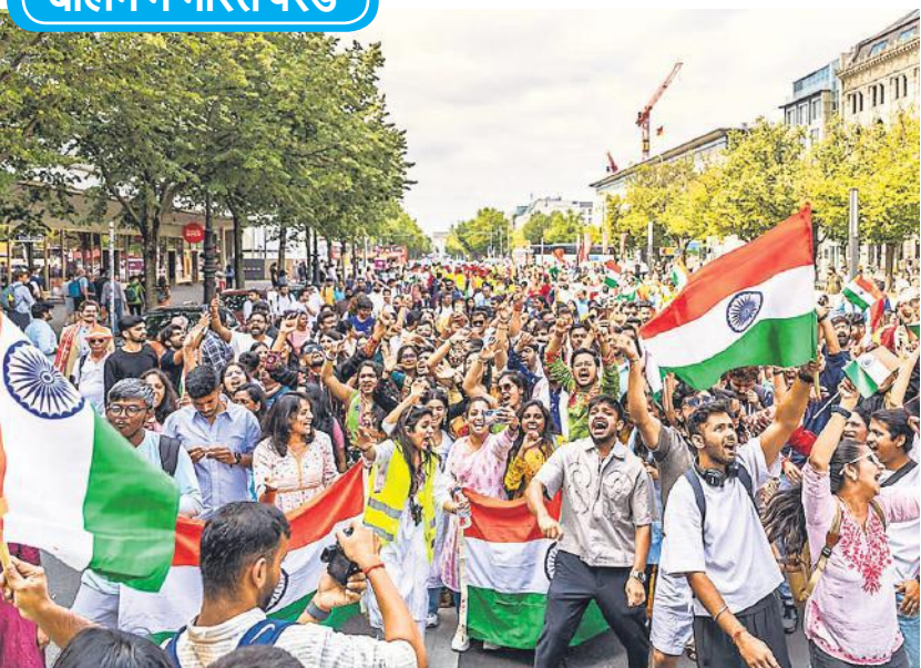
भारत का 79वें स्वतंत्रता दिवस का उत्सव दुनिया के कई और देशों में भी मनाया गया। बर्लिन के ब्रैंडेनबर्ग गेटन में रविवार को भारतीय समुदाय के लोगों ने पूरे जोशोखरोश के साथ भारत परेड निकाली।