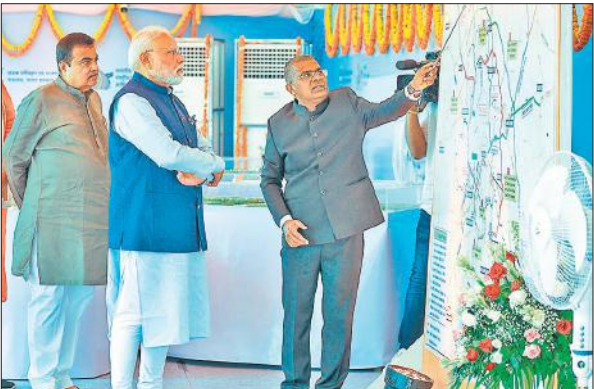
एक्सप्रेस-वे परियोजना देखते प्रधानमंत्री, साथ में केंद्रीय मंत्री नितिन गडकरी।

उन्होंने कहा कि ये जो लोग संविधान सिर पर रख कर नाचते हैं ना, वो संविधान को कैसे कुचलते थे, वो बाबा साहेब (आंबेडकर) की भावना को कैसे दगा देते थे, वो सच्चाई में बताने जा रहा हूं। उन्होंने कहा कि यह सुनकर आप हैरान रह जाएंगे। दिल्ली में हमारे सफाई कर्मचारी बहुत बड़ी जिम्मेदारी निभा रहे हैं। हमें हर सुबह उन्हें धन्यवाद देना चाहिए। उन्होंने कहा