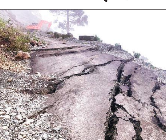
छोटा कैलाश मार्ग में आई दरार।