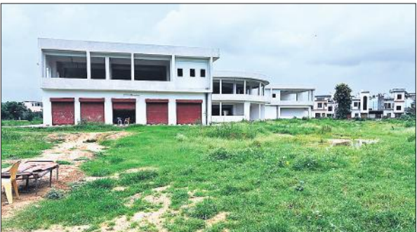
बजट के आभाव में अधर में लटका रोडवेज बस अड्डे का निर्माण।

पुराने और सेटेलाइट बस अड्डे का भार कम करने के लिए मिनी बाईपास पर नया बस अड्डा बनाने का कार्य उत्तर प्रदेश स्टेट कंस्ट्रक्शन एंड इन्फ्रास्ट्रक्चर डेवलपमेंट कारपोरेशन लिमिटेड (यूपी सिडको) को सौंपा गया है। इस बस अड्डे पर अगस्त 2021