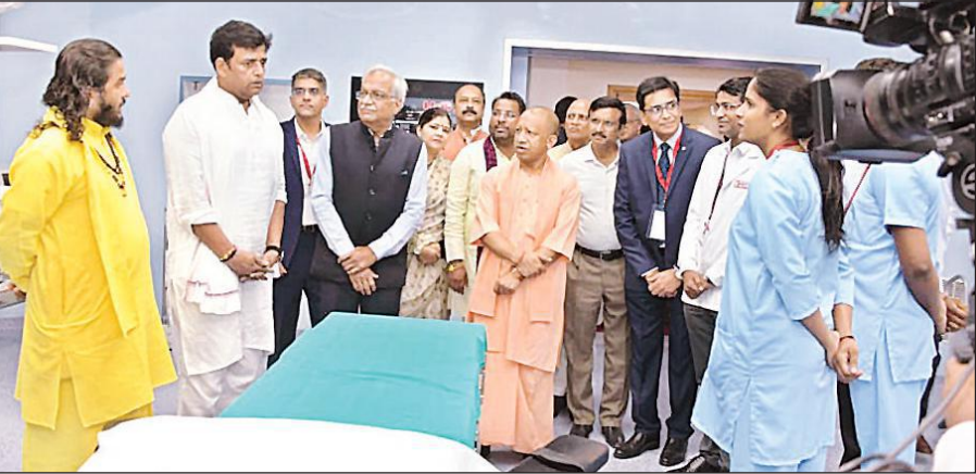
गोरखपुर में रीजेंसी हॉस्पिटल का लोकार्पण करने के बाद उपलब्ध सुविधाओं की जानकारी लेते मुख्यमंत्री योगी।

मुख्यमंत्री योगी रविवार को गोरखपुर में निजी क्षेत्र के रीजेंसी हॉस्पिटल के लोकार्पण के बाद समारोह को संबोधित कर रहे थे। उन्होंने हॉस्पिटल का निरीक्षण कर सुविधाओं का जायजा भी लिया। साथ ही, हॉस्पिटल के पेशेंट एप