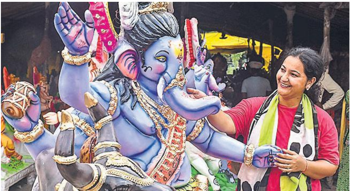
गणेश चतुर्थी, जिसे विनायक चतुर्थी के नाम से भी जाना जाता है, भगवान गणेश के जन्मदिन के रूप में मनाया जाता है। गणेश उत्सव 27 अगस्त को मनाया जाएगा। चतुर्थी तिथि 26 अगस्त को शुरू होगी और 27 अगस्त को समाप्त होगी। गणेश चतुर्थी उत्सव से पहले रविवार को मुरादाबाद में गणेश की मूर्ति को निहारती एक महिला।