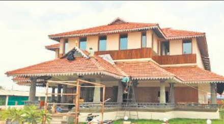
निर्माणाधीन वैक्स म्यूजियम।

इस म्यूजियम में भगवान श्रीराम सहित रामायण के करीब 50 प्रमुख पात्रों के मोम के पुतले प्रदर्शित किए जाएंगे, जो न केवल श्रद्धालुओं बल्कि पर्यटकों को भी इतिहास और संस्कृति का जीवंत अनुभव प्रदान