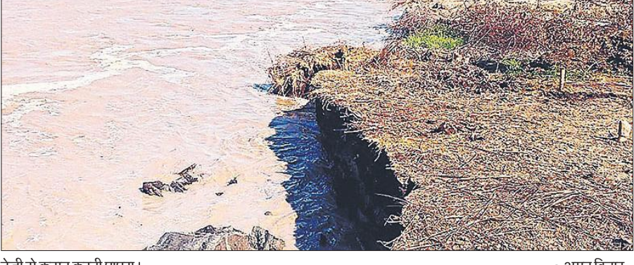
तेजी से कटान करती घाघरा।

घाघरा का कहर रामपुर मथुरा विकास खण्ड क्षेत्र में सबसे अधिक है। अब तक कटान कुन्नापुरवा, रामरूपपुरवा जलमग्न हो चुके हैं। कंपोजिट विद्यालय कटान की जद में आने के बाद लोधनपुरवा भी समाप्त की ओर है। 24 घंटे के भीतर घाघरा नदी ने सुंदरपुरवा, भूधनपुरवा सहित छह गांव को घेर लिया है। ऐसे में ग्रामीण तेजी से गृहस्थी समेटकर अपना नाव से पलायन कर रहे हैं। तहसीलदार महमूदाबाद अनिल