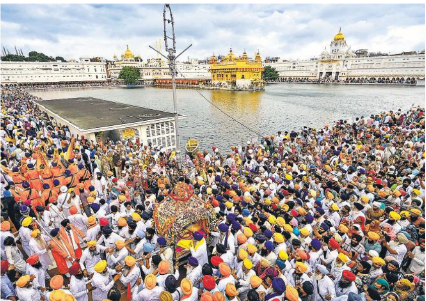
अमृतसर में रविवार को गुरु ग्रंथ साहिब प्रकाश उत्सव पर रवण मंदिर में नगर कीर्तन जुलूस में उमड़ी भीड़ ।