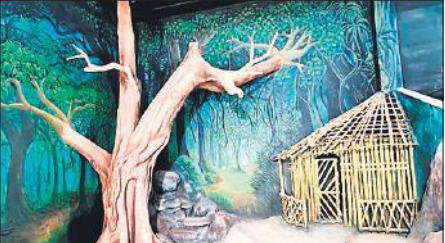
वैक्स म्यूजियम के अंदर का दृश्य।

करेंगे। इस परियोजना पर अब तक करीब 7.5 करोड़ रुपये खर्च हो चुके हैं। श्रीराम जन्मभूमि मंदिर के निर्माण के बाद से अयोध्या में श्रद्धालुओं और पर्यटकों की संख्या में लगातार वृद्धि हो रही है। इस वैक्स म्यूजियम के निर्माण से न केवल धार्मिक पर्यटन को बल मिलेगा, बल्कि यह रामायण