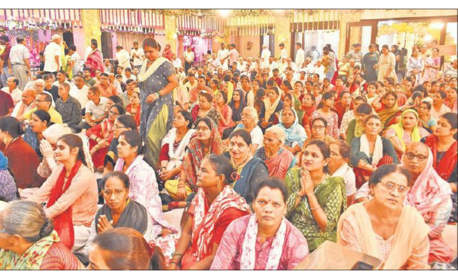
राजेंद्र नगर स्थित श्री बांके बिहारी मंदिर में कथा का रसपान करते श्रद्धालु।