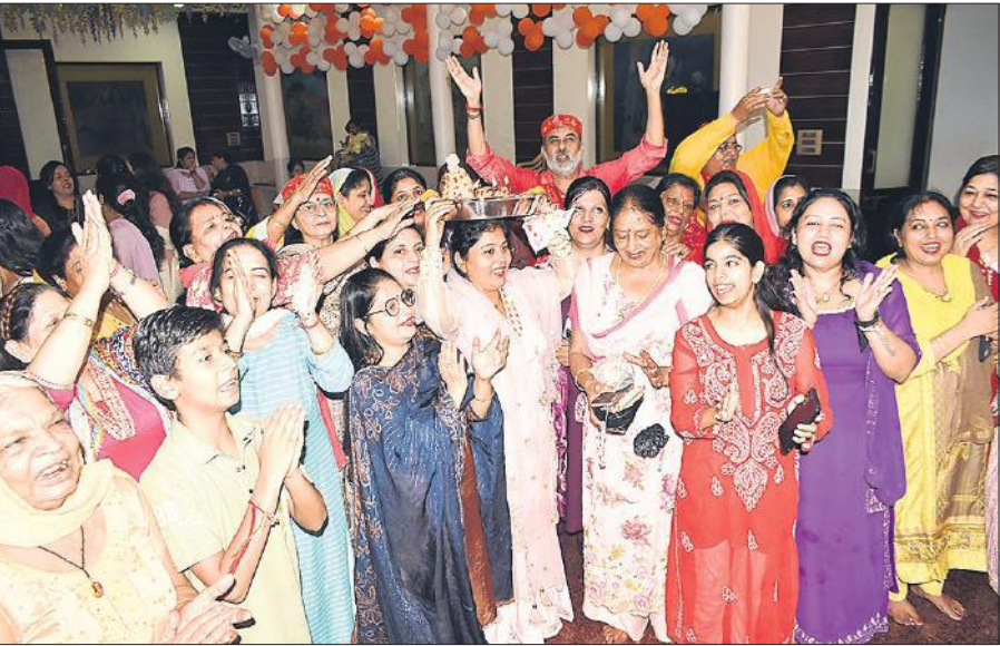
सिंधु नगर स्थित झूलेलाल मंदिर में भजन कीर्तन करते श्रद्धालु।