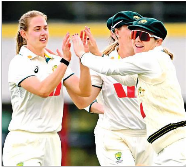
ऑस्ट्रेलिया महिला टीम को खिलाड़ी जात दज करन क बाद जश्न मनाता हुई। ऐसी