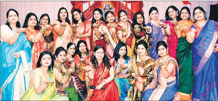
बंगाली थीम पर आधारित कार्यक्रम में भाग लेती वीन्स क्लब की सदस्य।