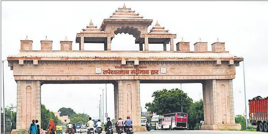
बदायूं रोड स्थित तपेश्वरनाथ नाथ मढ़ीनाथ द्वार।

अमृत विचार : बरेली में पांच साल से लगातार बदलाव हो रहा है। ऐतिहासिक प्राचीन भव्यता को समेटे नाथ मंदिरों को लेकर आध्यात्मिक नजरिये से बरेली नाथनगरी के रूप में देश में अपनी विशेष पहचान बना रही है, दूसरी ओर भौगोलिक क्षेत्रफल से बरेली विस्तार ले रही है, जहां आमजन की जरूरतों को ध्यान में रखते हुए सुख सुविधाएं बढ़ाई जा रही हैं, वहीं पांच साल में बने छह पुलों ने विकास की रफ्तार भी बढ़ाई है। इससे ट्रेफिक व्यवस्था में बेहतर सुधार हुआ है। नाथनगरी की शोभा बढ़ाने के लिए बरेली विकास प्राधिकरण ने काफी प्रयास किए हैं। आध्यात्मिक और पर्यटन के रूप में बरेली को विकसित करने के लिए नाथनगरी कॉरिडोर को भव्य स्वरूप देने की तैयारी शुरू हो गई है। सातों नाथ मंदिरों को जोड़ने वाले सर्किट बनाए गए हैं। धोपेश्वर नाथ मंदिर, मढ़ीनाथ मंदिर, तपेश्वरनाथ मंदिर, बनखंडीनाथ मंदिर, त्रिवेदीनाथ मंदिर, अलखनाथ मंदिर, पशुपति नाथ मंदिर को जोड़ते हुए 32.5