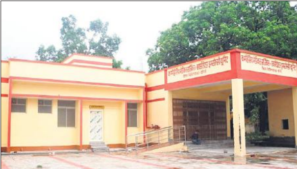
जिला अस्पताल परिसर में स्थापित ट्रामा विंग।