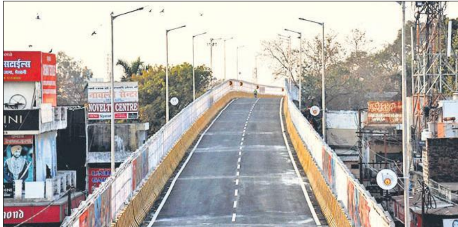
जाम की समस्या दूर करने के लिए शहर के बीचोबीच बना कुतुबखाना पुल।

2022 तक निर्माणाधीन पुलों पर तेजी से काम हुआ। कुदेशिया पुल, आईवीआरआई ओवरब्रिज, लाल फाटक ओवरब्रिज चालू होने के बाद चौपुला पुल, ब्रांच पुल, शहामतगंज