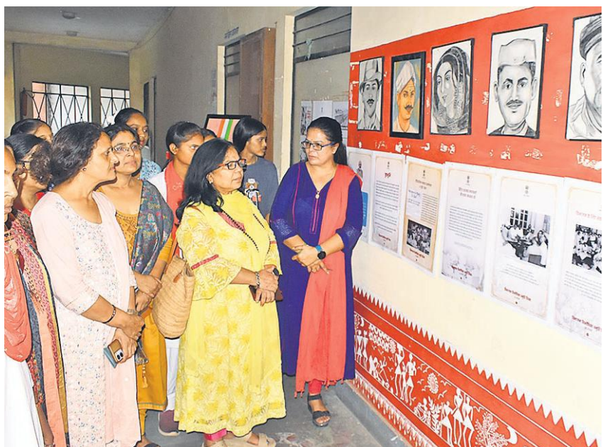
रानी अवंतीबाई महिला महाविद्यालय में विभीषिका स्मृति दिवस पर चित्रकला प्रदर्शनी देखती प्राचार्य व शिक्षिकाएं।