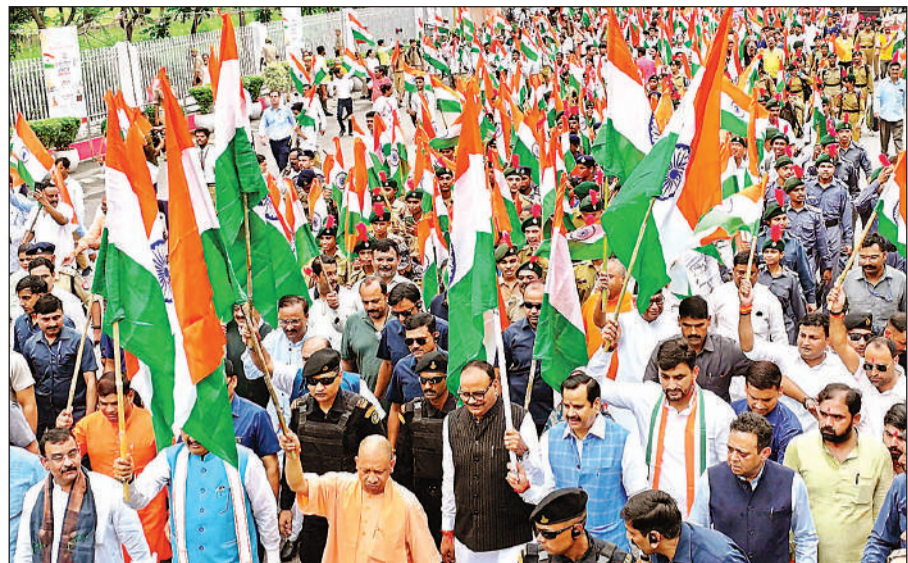
लखनऊ में 'हर घर तिरंगा' अभियान के तहत निकाली गई तिरंगा रैली का नेतृत्व करते हुए मुख्यमंत्री योगी, साथ में पार्टी नेता व अन्य।

मुख्यमंत्री योगी आदित्यनाथ ने बुधवार को 'हर घर तिरंगा' अभियान (13-15 अगस्त) की शुरुआत की। राष्ट्रपतिक के गीतों की धुनों के बीच मुख्यमंत्री ने तिरंगा यात्रा का नेतृत्व किया, फिर अपने आवास से यात्रा