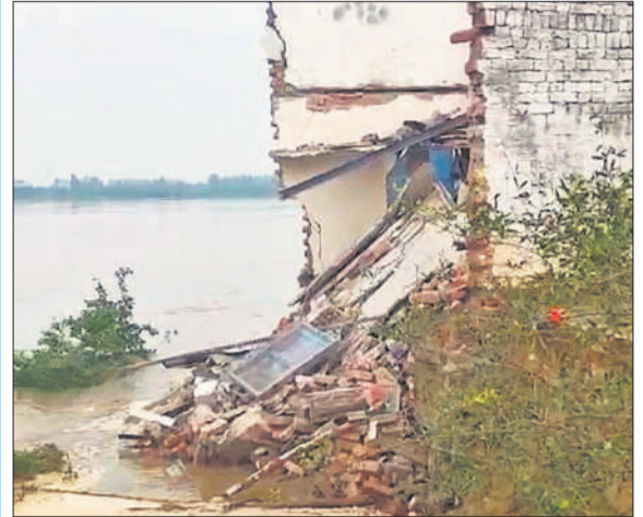
रामगंगा नदी में समया दो मंजिला मकान और किसान की सैकड़ों बीघा जमीन।

बरेली, अमृत विचार : रामगंगा में चौबारी के आसपास जलस्तर पिछले एक सप्ताह से 160.161 मीटर के आसपास बना हुआ है। जलस्तर में कुछ गिरावट दर्ज की जा रही है। जिले में 49 बाढ़ चौकियों से निगरानी जा रही है। वहीं 34 जगह पर शरणालय बनाए गए हैं। बाढ़ खंड विभाग के मुताबिक बुधवार सुबह रामगंगा का जलस्तर 160.840 मीटर तो शाम 4 बजे 160.740 मीटर और रात 8 बजे 160.660 मीटर रिकॉर्ड किया गया।