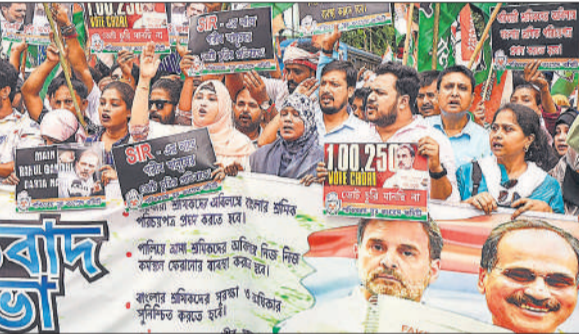
कांग्रेस कार्यकर्ताओं ने एसआईआर के खिलाफ कोलकाता में रैली निकालकर विरोध

पार्टी महासचिव प्रियंका गांधी ने भी यह वीडियो साझा कर लोगों से कांग्रेस के अभियान के साथ जुड़ने की अपील की। पिछले वृहस्पतिवार को कांग्रेस के पूर्व अध्यक्ष राहुल