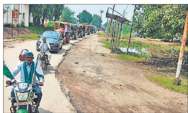
फरीदपुर में तिरंगा ट्रैक्टर यात्रा निकालते भाकियू कार्यकर्ता।