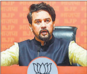
● केंद्रीय मंत्री अनुराग ठाकुर ने की भाजपा मुख्यालय में प्रेस कॉन्फेंस

ठाकुर ने तमिलनाडु की कोलाथूर विधानसभा सीट और उत्तर प्रदेश की मैनपुरी लोकसभा सीट पर मतदाता पंजीकरण में कथित अनियमितताओं का भी मुद्दा उठाया और चुनाव में ‘धांधली’ के लिए मुख्यमंत्री एवं द्रविड़ मुनेत्र कषगम (द्रमुक) सुप्रीमो एम के स्टालिन और समाजवादी पार्टी (सपा) की नेता डिंपल यादव से इस्तीफा देने की