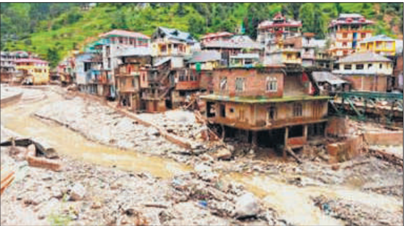
भारी बारिश और बाढ़ से हिमाचल प्रदेश में तमाम सड़कें तबाह हो गई हैं।