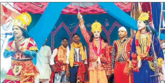
मंचन करते नगरिया कलां के युवा कलाकार।

गांव के युवाओं ने सांस्कृतिक मंचन के जरिए बालिका शिक्षा, साक्षरता, अंधविश्वास उन्मूलन, महिला जागरूकता, परिवार नियोजन, प्लस पोलियो जैसे राष्ट्रीय और सामाजिक संदेश जन-जन