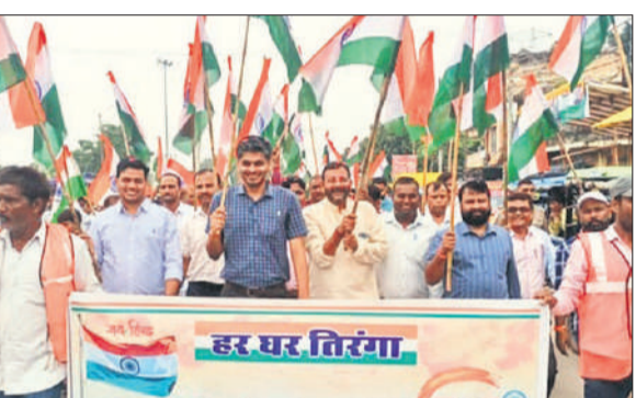
एसडीएम के साथ तिरंगा यात्रा में शामिल कर्मचारी और भाजपा नेता।

नवाबगंज, अमृत विचार : गंगाशील महाविद्यालय में आयोजित अंतर्राष्ट्रीय व्याख्यान श्रृंखला के सप्तम सोपान का विषय रहा भारतीय वाङ्मय और विज्ञान: वर्तमान संदर्भ में इसकी प्रासंगिकता। मुख्य वक्ता डॉ.