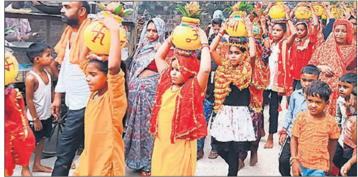
भागवत कथा से पूर्व कलश यात्रा निकालती महिलाएं।

रिहर्सल एक महीने रहता है, जिसमें कलाकार संवाद अदायगी, शस्त्र चलाना और रण कौशल के बारे में गंभीरता से सीखते हैं। कुछ कलाकार बाहर नौकरी करते हैं और छुट्टी लेकर अभिनय करने आते हैं। रामलीला सभा 83 वर्षों से गुरु शिष्य परंपरा निभा रही है।