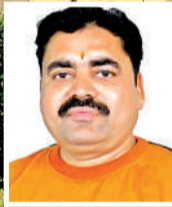
लेखक : लालजी बाजपेयी