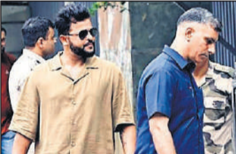
ईडी कार्यालय पहुंचे सुरेश रैना।

ऐसा माना जा रहा है कि पूर्व भारतीय क्रिकेटर कुछ विज्ञापनों के जरिए इस ऐप