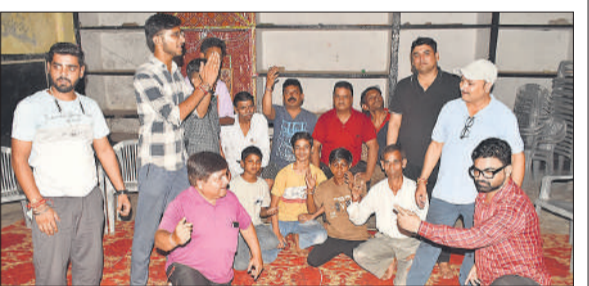
रामलीला का रिहर्सल करते कलाकार।