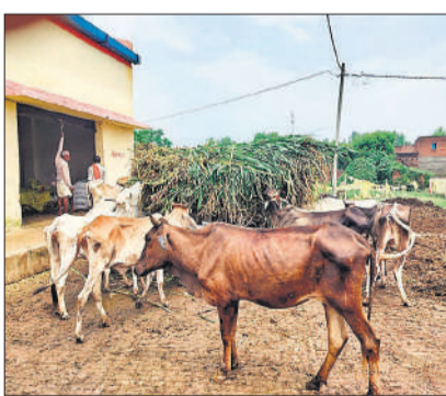
ट्रैक्टर पर लदे हरे चारे को देखकर भूखे पशु लपके।

बृहद गोशाला महेशपुर शिवसिंह में बुधवार को डीएम के आने के कार्यक्रम की सूचना पर