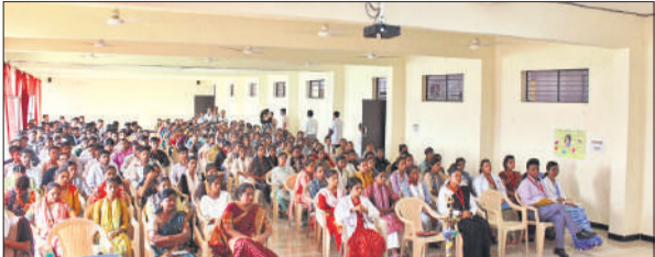
रोहिलखंड कॉलेज ऑफ नर्सिंग में एंटी रैपिंग कार्यक्रम में शामिल छात्र व शिक्षक।