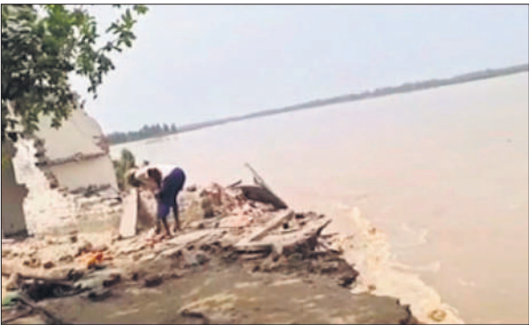
बचे मकान की ईंट एकत्र करता किसान।