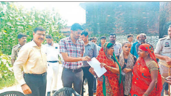
एसडीएम को मंदिर में गेट लगाने की अनुमति देने का प्रार्थना पत्र देती महिलाएं।