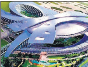
● 20 किलोमीटर तक के दायरे में मनमर्जी से नहीं कर पाएंगे निर्माण