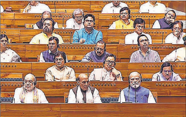
लोकसभा की कार्यवाही में उपस्थित प्रधानमंत्री मोदी व अन्य नेता।

लोकसभा को अनिश्चितकाल के लिए स्थगित करने से पहले अपने पारंपरिक संबोधन में लोकसभा अध्यक्ष ओम बिरला ने मानसून सत्र के दौरान कार्यवाही में गतिरोध बनाए रखने पर विपक्षी दलों के प्रति निराशा प्रकट करते हुए कहा कि नियोजित तरीके से सदन के कामकाज में व्यवधान पैदा किया गया जो लोकतंत्र और सदन की मर्यादा के अनुरूप नहीं है। इसी प्रकार राज्यसभा में उपसभापति हरिवंश ने सत्र के दौरान लगातार बने गतिरोध पर निराशा जताते हुए कहा, सूचीबद्ध कार्यों पर सार्थक और सुचारू चर्चा सुनिश्चित करने के आसन के भरसक प्रयासों के बावजूद, यह सत्र दुर्भाग्यवश बार-बार व्यवधानों के कारण बाधित रहा, जिसके परिणामस्वरूप बार-