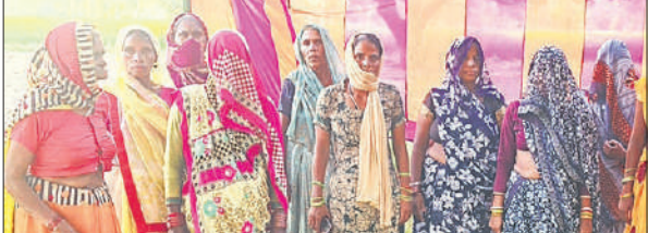
धरने के दौरान घुंसी गांव की महिलाएं।