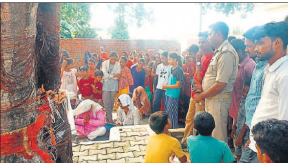
ब्रह्मदेव स्थान पर पूजा करते लोग।

लिए पीएसी ने फ्लैग मार्च भी किया। यह विवाद नया नहीं है। वर्ष 2005 से यह मामला सुलग रहा है। 2017 में भी यहां फर्श डाले जाने पर विवाद