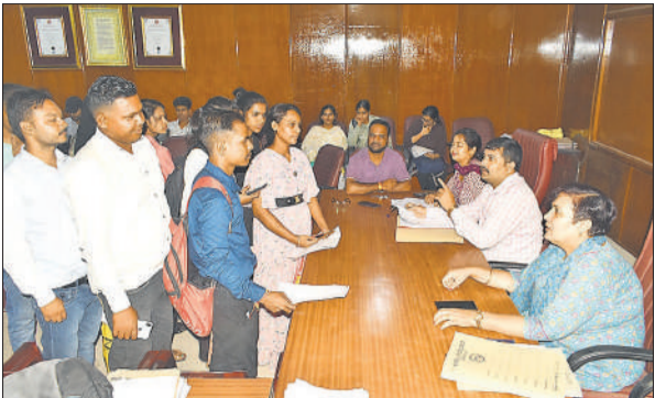
बरेली कॉलेज में सीट लॉक कराने पहुंचे छात्र- छात्राएं।

का 129.90 रहा है। वहीं एमकॉम की दूसरी मेरिट का ओपन इंडेक्स 65.50 से 64.00, सामान्य महिला का 64.00 से 60.40, ओपन पीएच, डीएफ व एफएफ का 63.95 से 58.00, ओबीसी ओपन का 63.95 से 58, ओबीसी महिला का 57.80 से 56.50, ओबीसी पीएच, डीएफ व एफएफ का सभी, एससी का सभी, इंडब्ल्यूएस का सभी रहा है। इसके अलावा एमए समाजशास्त्र की दूसरी मेरिट का इंडेक्स ओपन का 119.60 से 118.50, सामान्य महिला का 117.38 से 105.75, ओबीसी का