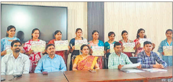
प्रशिक्षण प्राप्त करने वाले शिक्षक और डायट के प्रवक्ता।