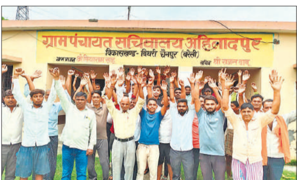
पंचायत सचिवालय में नारेबाजी कर प्रदर्शन करते किसान।

रिठौरा, अमृत विचार : बरेली विकास प्राधिकरण (बीडीए) द्वारा थाना इज्जतनगर के आधा दर्जन से अधिक गांवों की जमीन अधिग्रहीत करने के लिए किसानों की सहमति लेने के लिए गांव -गांव में बैठक कर रहा है। ताकि शेष जमीनों का अधिग्रहण कर उस पर काम शुरू किया जा सके। अहलादपुर गांव के किसानों ने बीडीए को औने-पौने दामों में जमीन लेने की कोशिश पर विरोध जताया।