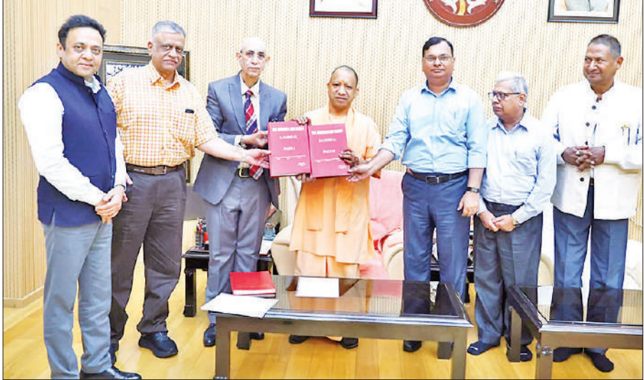
मुख्यमंत्री योगी आदित्यनाथ को संभल हिंसा की जांच रिपोर्ट सौंपते तीन सदस्यीय न्यायिक आयोग के सदस्य।