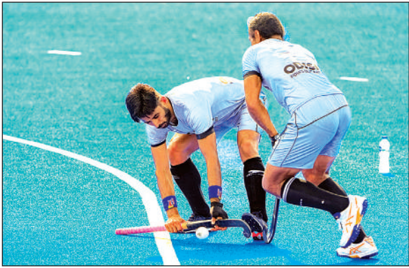
राजगीर स्पोर्ट्स कॉम्प्लेक्स में अभ्यास करते भारतीय खिलाड़ी।

लीग में सातवें स्थान पर खिसक गया। भारत ने आठ में से सिर्फ एक मैच जीता और सात मैच लगातार हारे जिससे कोच क्रेग फुल्टन को एशिया कप में अपनी सर्वश्रेष्ठ टीम