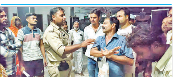
आक्रोशित लोगों को समझाती पुलिस।