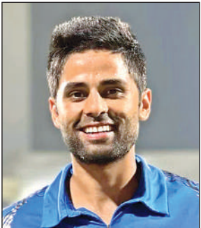
कप्तान सूर्यकुमार यादव।

14 सितंबर को दुबई में चिर प्रतिद्वंद्वी पाकिस्तान से मुकाबला करेगा भारत।