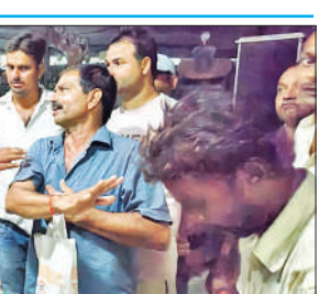
आक्रोशित लोगों को समझाती पुलिस।

देता है। पिछले साल कारोबारी भूमिगत हो गया। कस्बे में ईंट कारोबारी के आने की सूचना मिली तो गुरुवार को तमाम ग्राहक उसके घर पर पहुंच गए। वहां कारोबारी नहीं मिला। घर में सिर्फ महिलाएं थीं। उन्होंने कारोबारी के बारे में ग्राहकों को कोई संतोषजनक जवाब नहीं दिया। दर्जनों ग्राहक कारोबारी