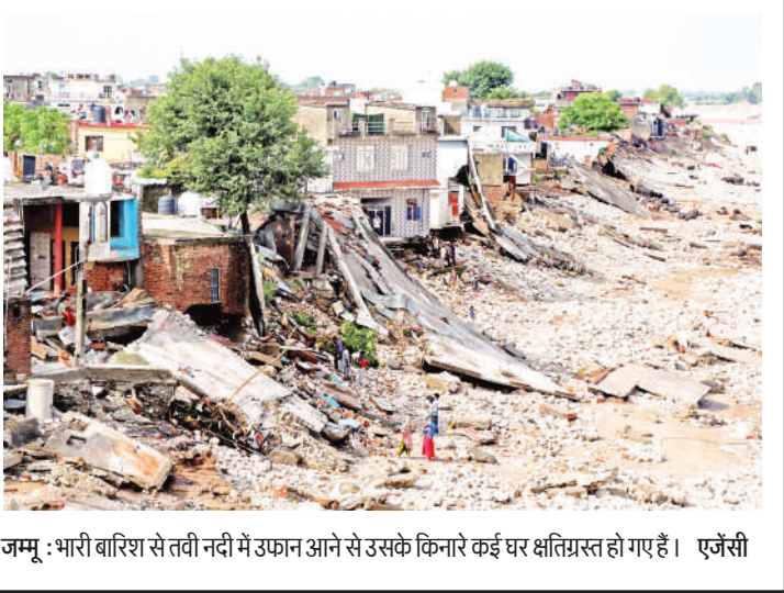
जम्मू : भारी बारिश से तवी नदी में उफान आने से उसके किनारे कई घर क्षतिग्रस्त हो गए हैं।

बीजिंग। चीन ने बृहस्पतिवार को घोषणा की कि तीन