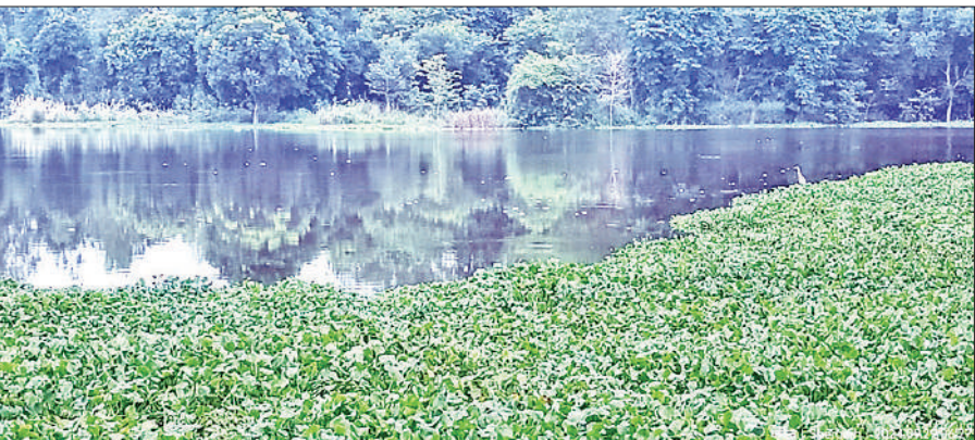
शेरगढ़- बरीपुरा मार्ग स्थित रानी तालाब। जिसे दूर दराज के लोग देखने के आते हैं।