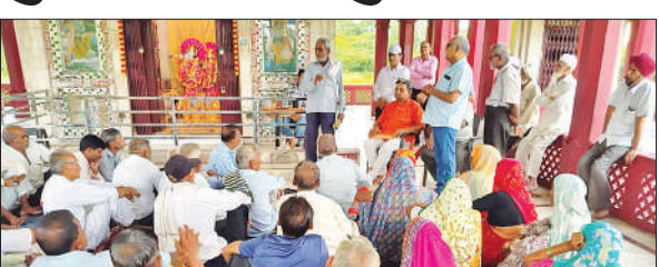
राधाकृष्ण मंदिर में बैठक करते श्रमिक नेता।