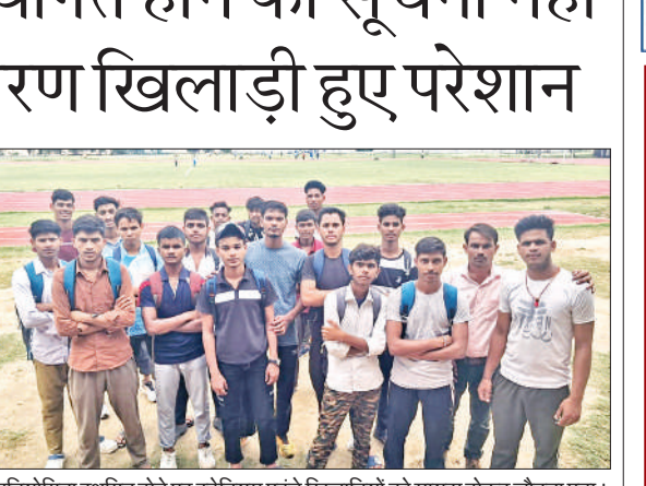
प्रतियोगिता स्थगित होने पर स्टैडियम पहुंचे खिलाड़ियों को मायूस होकर लौटना पड़ा।

अमृत विचार : स्पोर्ट्स स्टैडियम प्रबंधन ने राष्ट्रीय खेल दिवस उत्सव पर 28 अगस्त को होने वाली प्रतियोगिता स्थगित कर 29 अगस्त को कर दी। इसकी सूचना दूर-दराज के खिलाड़ियों तक नहीं पहुंची और वे स्टैडियम में पहुंच गए। बदायूं, आंवला, भोजीपुरा, क्यारा, हाफिजगंज के कबड्डी और अन्य खेलों के करीब 25-30 खिलाड़ी परेशान होकर वापस लौट गए। स्टैडियम पहुंचकर खिलाड़ियों को पता चला कि प्रतियोगिता स्थगित हुई है। खिलाड़ियों ने बताया कि दो दिन पहले यहां से सूचना दी गई थी कि मेजर ध्यानचंद के जन्म दिवस के उपलक्ष्य में कबड्डी प्रतियोगिता का आयोजन गुरुवार को सुबह 10 बजे से किया