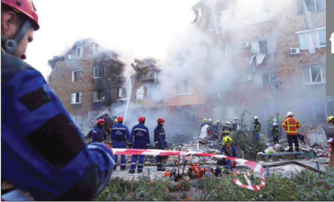
गुरुवार को यूक्रेन के कीव में रूसी हमले में नष्ट हुए एक घर पर काम कर रहा बचाव दल।

जब उनसे पूछा गया कि क्या उनका मतलब 'पुतिन का युद्ध' है तो नवारो ने दोहराया, मेरा मतलब मोदी का युद्ध है क्योंकि शांति का रास्ता आंशिक रूप से नई दिल्ली से होकर जाता है। ट्रंप ने रूसी तेल की खरीद के लिए भारत पर 25 प्रतिशत का अतिरिक्त शुल्क लगाया है, जो बुधवार से प्रभावी हो गया है। इसके साथ ही अमेरिका द्वारा भारत पर लगाया गया कुल शुल्क 50 प्रतिशत हो गया है। नवारो ने दावा किया कि भारत