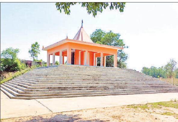
तालाब के पास ऊंचे टीले पर बना है भव्य शिव मंदिर।