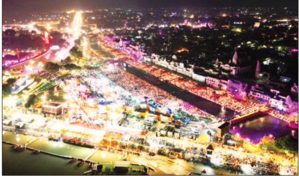
दीपों से जगमगाती राम की पैड़ी (फाइल फोटो)

की ओर से तैयारी शुरू कर दी गई है। अब तक हुए दीपोत्सव