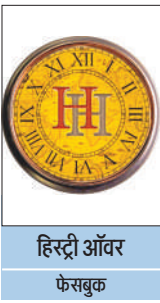
हिस्ट्री ऑवर फेसबुक

19वीं सदी के अंत में, अमेरिका के डेट्रॉइट शहर में, एक युवा मैकेनिक एक बिजली कंपनी में दिन में दस घंटे काम करके हफ्ते में केवल ग्यारह डॉलर कमाता था। यह उसका रोज का काम था।