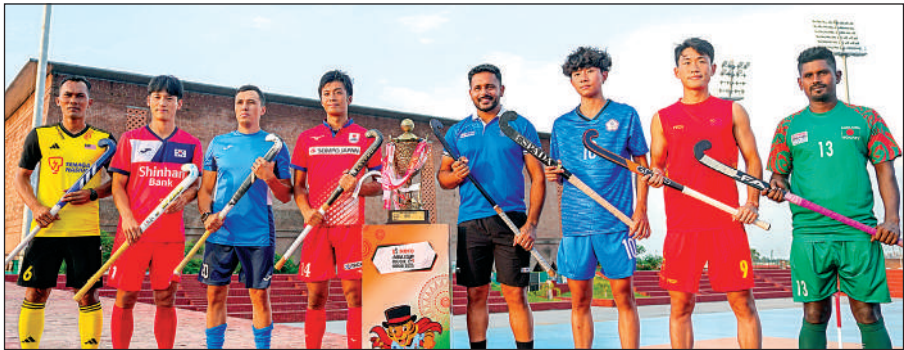
भारतीय कप्तान हरमनप्रीत सिंह अन्य प्रतिस्पर्धी टीमों के अपने समकक्षों के साथ गुरुवार को बिहार के राजगीर में पुरुष एशिया कप हॉकी टूर्नामेंट से पहले ट्रॉफी के साथ फोटो सेशन कराते हुए।

था। यह ज्यादातर सर्विस और पहले शॉट के बारे में था। मुझे खुशी है कि मैं दबाव को संभाल पाई और कुडरमेतोवा को जवाब दे पाई। दूसरे सेट में, मैं अपने रिटर्न गेम में काफी बेहतर महसूस कर रही थी, और मेरी सर्विस भी बेहतरी थी। दूसरी वरीयता प्राप्त अल्काराज ने बेलुची पर सीधे सेटों में ज्यादा