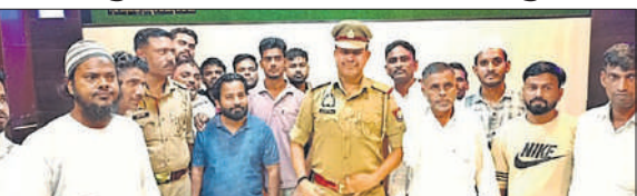
हरदुआ और रिछोला गांव के ताजिएदारों के बीच कोतवाल ने करायी समझौता ।

समझौते के मुताबिक अब रिछोला में 16 व 17 अगस्त को तथा हरदुआ मे 17 अगस्त को