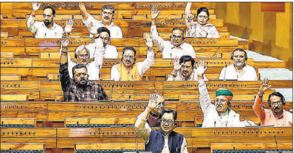
मंगलवार को लोकसभा में सत्ता पक्ष के सदस्यों ने भी की नारेबाजी।

जब विपक्षी सदस्यों ने कागज फाड़े और उसके टुकड़े आसन की ओर फेंक दिए। एसआईआर मुद्दे पर चर्चा की मांग कर रहे विपक्षी सदस्यों ने राज्यसभा में बहिर्गमन किया और सरकार ने संक्षिप्त बहस के बाद चार विधेयक पारित करा लिये। राज्यसभा ने राष्ट्रीय डोपिंग रोधी (संशोधन) विधेयक, 2025 और राष्ट्रीय खेल शासन विधेयक, 2025 और आयकर विधेयक पारित किया। कराधान विधि (संशोधन) विधेयक- को भी संक्षिप्त चर्चा एवं वित्त मंत्री निर्मला सीतारमण के