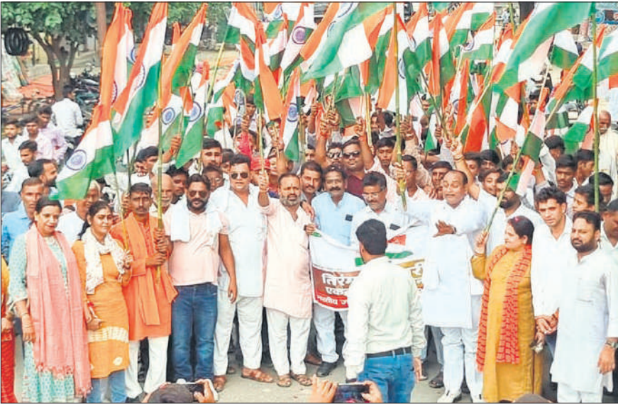
मीरगंज में तिरंगा यात्रा रैली निकालते भाजपा कार्यकर्ता।