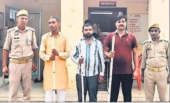
पुलिस गिरफ्त में प्रधान, पूर्व प्रधान व एक अन्य आरोपी ।