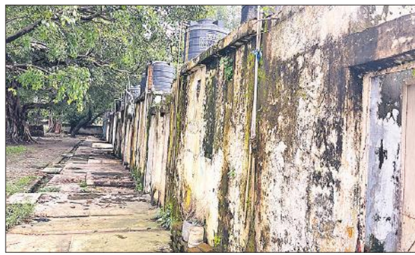
कैंट रेलवे कॉलोनी में आवास खस्ताहाल है ।

कई क्वार्टरों की छतों से पानी गिर रहा है। दीवारें नम और काली हो चुकी हैं। फश जगह-जगह से उखड़ चुका है। रेल कर्मों और उनके परिवार के सदस्य इन जर्जर आवासों में खतरे के बीच रह रहे हैं। अब तक न रेलवे प्रशासन ने मरम्मत कराई, न ही वैकल्पिक आवास की व्यवस्था की है। रेल कर्मों ने बताया कि हर वक्त हादसे का डर बना रहता है। एक दिन पहले कोटरी में दो सांप निकले थे। अब उसमें सोने से डर लगता है।कॉलोनी के कई हिस्सों में सीवर ओवरफ्लो है, जिससे बदबू आ रही है। गंदगी फैली हुई है। कुछ