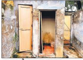
टूट पड़ा शौचालय का दरवाजा ।

● बारिश के मौसम में दीवारों की दरारों से निकल रहे सांप ● मुश्किल हालातों में आवासों में रहने को मजबूर रेलकर्मी