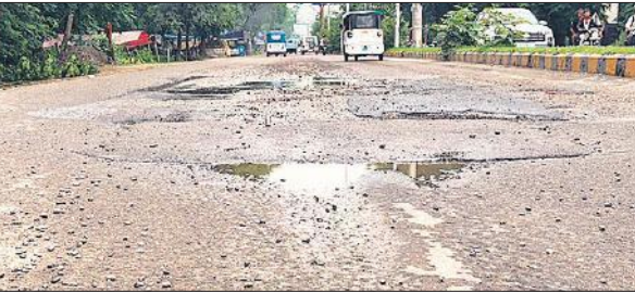
पैचवर्क उखड़ने के बाद पीलीभीत रोड पर फैली बजरी।