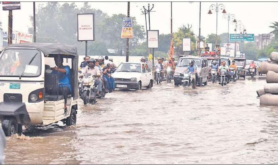
डेलापीर में डलावघर के पास जलभराव से होकर गुजरते वाहन।

के बाद आपत्ति और सुझाव मांगे जाएंगे। इसके बाद ही इसे लागू किया जा सके। यह प्रक्रिया पूरी होने में कम से कम तीन माह का समय सकता है।