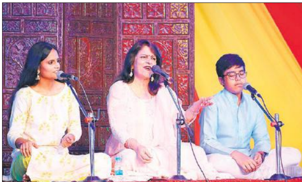
रिट्ठिमा में सूफी स्कोर कार्यक्रम में गायन करते कलाकार।