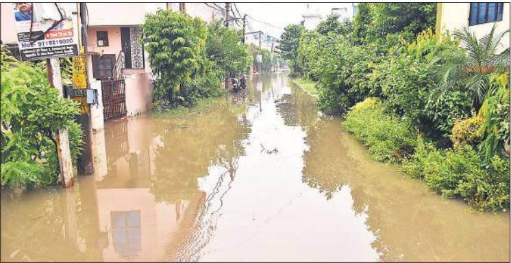
कुर्माचल नगर में भी घरों के अंदर घुस गया पानी।