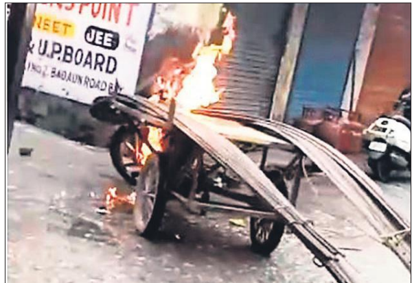
आग की लपटों में घिरा सरिया लदा जुगाड़ वाहन ।

स्थानीय लोगों के मुताबिक सरिया लदे जुगाड़ वाहन में अचानक धुंआ उठने लगा और कुछ ही सेकंड में आग की लपटें उठने लगीं। आग देखकर वाहन चालक घबराया नहीं, बल्कि तुरंत पास की नाली से बाल्टी से पानी भरकर आग बुझाने में जुट गया। उसी वक़्त आसपास के दुकानदार और राहगीर भी दौड़ पड़े और बाल्टी और मगगों से पानी डालकर आग