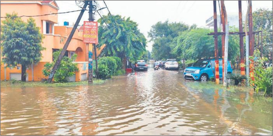
सनसिटी विस्तार कॉलोनी में कुछ देर की बारिश में ही भीषण जलभराव हो गया।