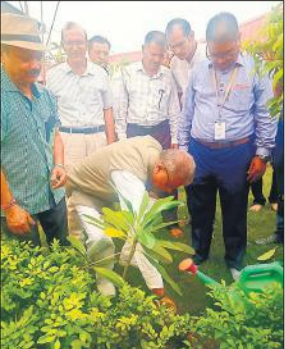
पौधरोपण करते वनमंत्री।