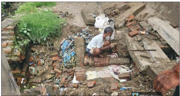
गिट्टी और ईंट भर कर सड़क तैयार करता स्थानीय व्यक्ति।

पौरबहोड़ा को पीलीभीत बाईपास से जोड़ने वाले मार्ग पर स्थित नाले की दीवार करीब एक माह पहले गिर गई थी। इसके कारण सड़क में मोटी दरार आ गई। बारिश के दौरान पुलिया के पास सड़क कट गई, जिसके कारण लोगों को आने जाने में दिक्कतों का सामना करना पड़ रहा है। यहां तक की मोहल्ले के कई लोग चार पहिया वाहन को दूसरी जगह पर खड़ा कर पैदल अपने घर पहुंच