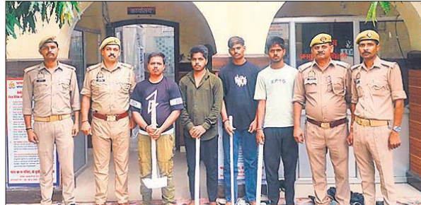
पुलिस गिरफ्त में चारों आरोपी ।