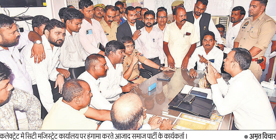
कलेक्ट्रेट में सिटी मजिस्ट्रेट कार्यालय पर हंगामा करते आजाद समाज पार्टी के कार्यकर्ता।