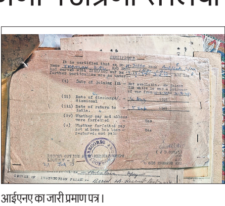
आईएनए का जारी प्रमाण पत्र।

की और 18 साल तक सेवाएं देते रहे, लेकिन उनके मन में देश को आजादी दिलाने की लौ भी जलती रही। आईएनए की स्थापना होते ही उन्हें मौका मिल गया। उस समय पिताजी की तैनाती सिंगपुर में थी। वह अंग्रेजी सेना की नौकरी छोड़ बागी हो गए। उन्होंने अपने 30 अन्य साथियों के साथ आईएनए ज्वाइन कर ली। उनकी कार्य कुशलता को देखते हुए नेताजी सुभाष चंद्र बोस ने उन्हें मेजर हवलदार बना दिया। इस दौरान