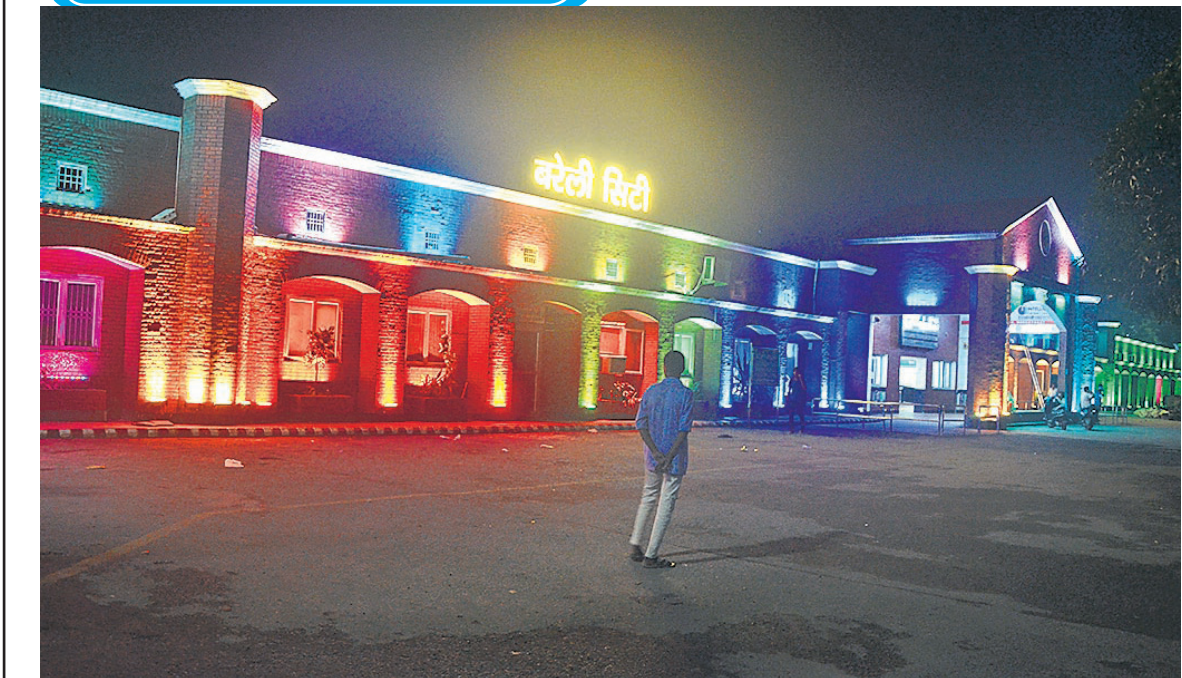
स्वतंत्रता दिवस की पूर्व संंध्या पर रंग बिरंगी रोशनी से जगमगाता बरेली सिटी स्टेशन।

वहीं, विभाग का दावा है कोई भी सचिव और प्रधान नई व्यवस्था में फर्जीवाड़ा नहीं कर सकेगा। आवास प्लस एप में आवेदक का नाम, पता और पात्रता की सभी शर्तों के अनुसार डिटेल्ड भरनी होती है। आवेदन के दौरान खींची गई फोटो का मिलान ऐप आवंटन के दौरान करेगा। अंतर मिलते ही तुरंत इसकी जानकारी देगा। ऐसे में