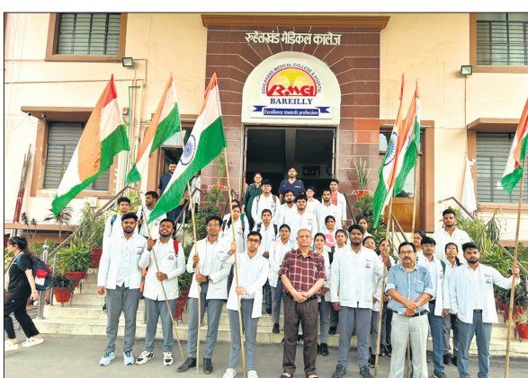
तिरंगा यात्रा में शामिल विद्यार्थी और शिक्षक।