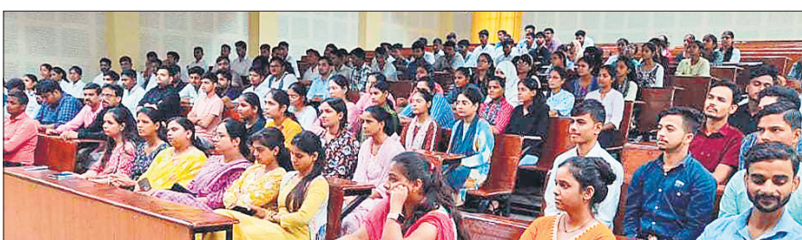
कार्यक्रम में मौजूद शिक्षक और छात्र-छात्राएं।