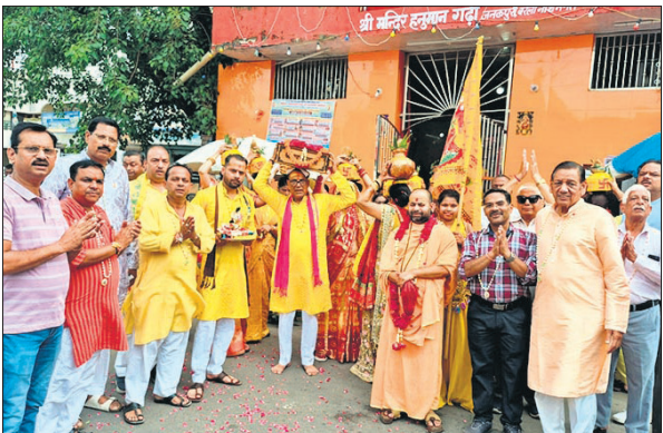
सोमनाथ मंदिर से कलश यात्रा की शुरुआत करते भक्त।