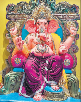
स्थापना से पहले गणपति प्रतिमा।

संस्था के पदाधिकारियों ने बताया कि भक्तजन पूरी श्रद्धा के साथ तैयारियों में जुटे हुए हैं। महोत्सव का समापन 2 सितंबर को विघ्नहर्ता गणपति बप्पा की भव्य शोभायात्रा और प्रतिमा विसर्जन के साथ होगा। इस शोभायात्रा में हजारों की संख्या में श्रद्धालु शामिल होंगे। परंपरा के अनुसार महाराष्ट्र से आए वैंड की