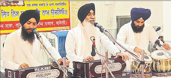
मॉडल टाउन गुरुद्वारे में कीर्तन करता रागी जत्था।

मरण की टेक का गायन किया, तो ऐसा प्रतीत हुआ मानो संगत स्वयं श्री दरबार साहिब अमृतसर में ही विराजमान हो। रात्रि लगभग 10:30 बजे तक यह दीवान चलता रहा। समापन अरदास, हुकुमनामा और सुखासन के साथ हुआ। इस विशेष अवसर पर पिछले दिनों हुए गुरमति मुकबलों के विजेताओं को सम्मानित किया गया। इसके अतिरिक्त, पहली बार गुरु ग्रंथ साहिब का सम्पूर्ण पाठ करने वाले 10 श्रद्धालुओं को गुरु की बख्शीश प्रदान कर सम्मानित किया गया, जिससे संगत में उत्साह और गर्व का भावना देखने को मिली। दीवान