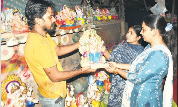
गजानन की प्रतिमा को खरीदते श्रद्धालु।