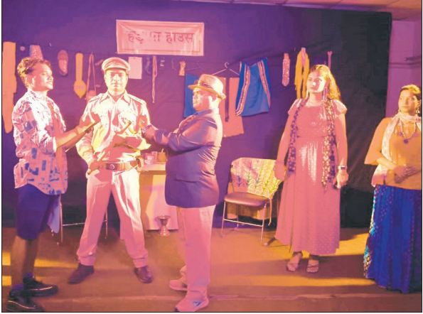
खुशहाली सभागार में हड़प्पा हाउस नाटक का मंचन करते कलाकार।