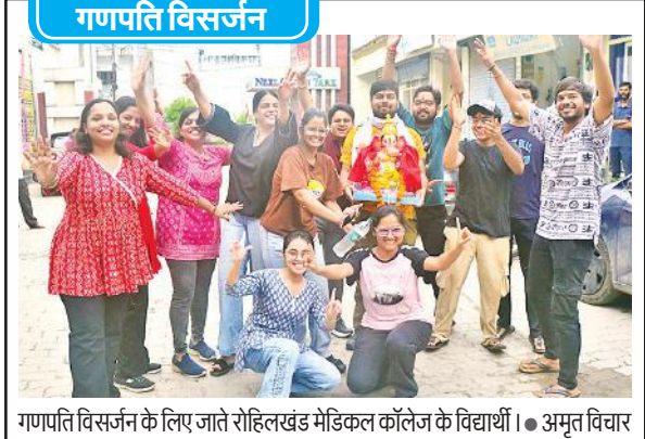
गणपति विसर्जन के लिए जाते रोहिलखंड मेडिकल कॉलेज के विद्यार्थी।