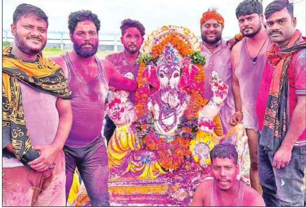
गणेश प्रतिमा विसर्जन को जाते श्रद्धालु।