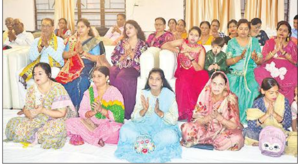
सोमनाथ मंदिर में भागवत कथा सुनते भक्त।