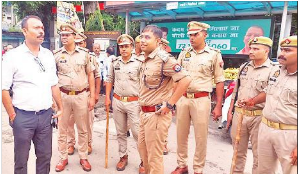
कलेक्ट्रेट के बाहर सिटी मजिस्ट्रेट के साथ छापा मारने पहुंची पुलिस।