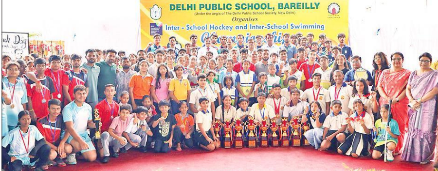
डीपीएस में 11वीं अंतर विद्यालयी प्रतियोगिता की विजेता टीम के साथ शिक्षक।