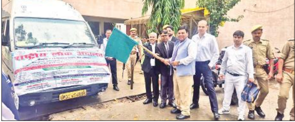
लोक अदालत की प्रचार वैन को हरी झंडी दिखाते जिला जज।