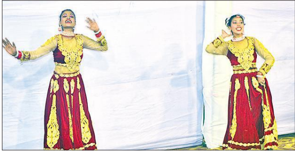
गणेश उत्सव में सांस्कृतिक कार्यक्रम प्रस्तुत करते बच्चे।