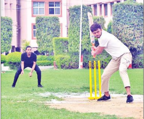
मैच में शॉट मारता खिलाड़ी।

खेल भावना का प्रदर्शन किया। वहीं रस्साकसी के मुकाबले में रोहिलखंड आयुर्वेदिक कॉलेज की टीम ने दमखम और तकनीक से जीता। कार्यक्रम के समापन पर विजेता और उपविजेता टीमों को सम्मानित किया गया। इस अवसर पर शिक्षकों और विद्यार्थियों ने एक स्वर में संकल्प