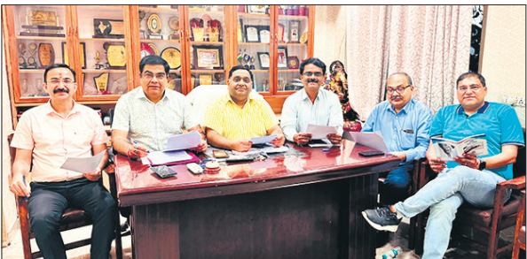
आईएमए चुनाव के संबंध में जानकारी देते पदाधिकारी।