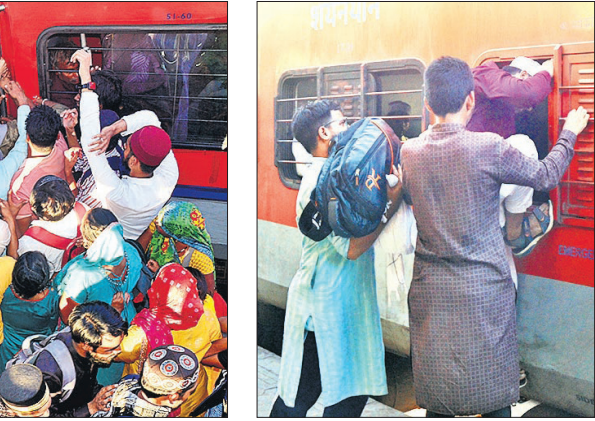
सिटी रेलवे स्टेशन पर टिकट लेने के लिए जुटे जायरीन।

भीड़ को उनके गंतव्य तक पहुंचाने के लिए बरेली जंक्शन से सहारनपुर के लिए और बरेली सिटी से पीलीभीत व लालकुआं के लिए उर्स स्पेशल ट्रेनें चलाई गईं। इन स्पेशल ट्रेनों ने काफी हद तक भीड़ का दबाव कम किया और हजारों जायरीन अपने गंतव्यों के लिए रवाना हो गए। फिर भी, देर शाम तक रेलवे स्टेशनों पर अफरा-तफरी का माहौल रहा। अतिरिक्त पुलिस बल और स्पेशल ट्रेनों की व्यवस्था से हालात धीरे-धीरे काबू में आ गए और जायरीन सकुशल रवाना हो सके।