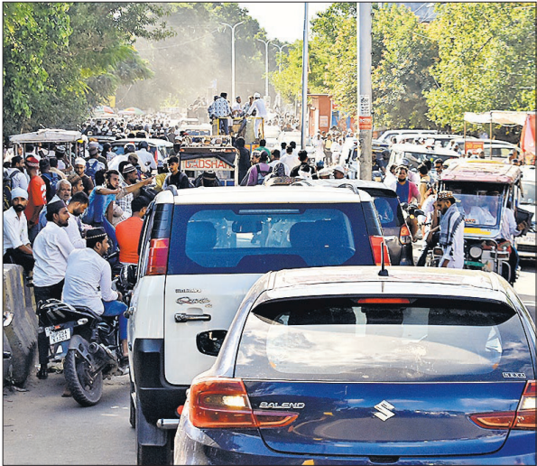
सिटी सब्जी मंडी रोड पर भी जाम में फंसे रहे वाहन।