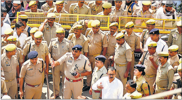
एसएसपी अनुराग आर्य ने पुलिस फोर्स के साथ उर्स स्थल पर संभाला मोर्चा।

करीब 55 सौ पुलिसकर्मी और पीएसपी के जवान झूटी पर तैनात रहे। 1300 कर्मियों की झूटी डीडीएमएस के जरिये चेक की गई। शहर की मुख्य सड़कों और उर्स स्थल पर जाने वाले मार्गों पर 300 से अधिक बैरियर लगाए गए।