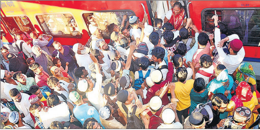
बरेली जंक्शन पर सियालदाह जम्मुतवी में चढ़ने के लिए धक्कामुक्की करते लोग।

स्थिति इतनी बिगड़ गई कि कई जायरीन ट्रेनों में चढ़ने के लिए सीधे ट्रैक पर उतर आए। बार-बार आनाउंसमेंट कर यात्रियों को ट्रैक से हटने और प्लेटफार्म पर खड़े रहने की अपील की गई, लेकिन भीड़ काबू में नहीं आ रही थी। धक्कामुक्की और मारामारी जैसे हालात बन गए। डर था कि कहीं यात्री चलती ट्रेनों पर सवार न हो जाएं। भीड़ को संभालने की