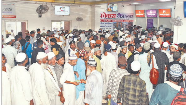
सिटी रेलवे स्टेशन पर टिकट लेने के लिए जुटे जायरीन।