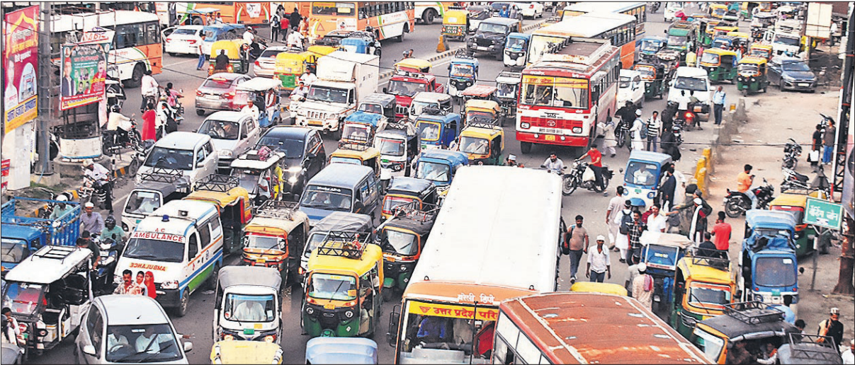
उर्स के समापन के बाद सेटेलाइट तिराहे और पुल पर लगा भीषण जाम।

एहतियात के तौर पर बुधवार को प्रमुख रूटों की ट्रैफिक लाइटों को भी बंद कर दिया गया था। जायरीन की भीड़ और डायवर्जन के बीच शहर के तमाम लोगों ने वैकल्पिक रास्तों के रूप में गली-कूचों का