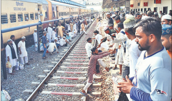
ट्रेनें में चढ़ने के लिए रेलवे पटरियां पार कर जोखिम में डाली जान।