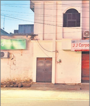
छापे के दौरान बाहर पसरा सनना।।

केंद्रीय वस्तु एवं सेवा कर की टीम बुधवार की सुबह करीब 10 बजे नोएडा से यहां पहुंची थी। टीम की ओर से पूछताछ इतनी गोपनीय ढंग से की गई कि व्यापारियों को