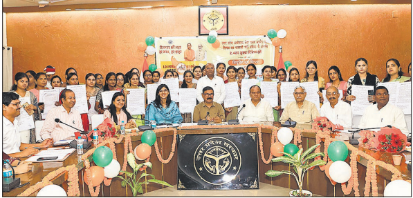
कलेक्ट्रेट सभागार में हुए कार्यक्रम के दौरान जनप्रतिनिधियों और प्रशासनिक अफसरों के साथ नियुक्त पत्र के साथ चयनित हुई मुख्य सेविकाएं। ● अमृत विचार

डीएम ने कहा कि 25 आंगनबाड़ी केंद्रों पर एक मुख्य सेविका कार्य करेंगी। बच्चों को