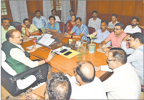
छात्रावास शुरू करने के लिए समिति के साथ बैठक करते प्राचार्य। ● अमृत विचार

कॉलेज में वॉयज और गर्ल्स हॉस्टल लंबे समय से बंद हैं। वॉयज हॉस्टल का भवन तो काफी जर्जर है लेकिन गर्ल्स हॉस्टल का भवन कम जर्जर है और इसमें काफी समय से पीएसी भी ठहरी हुई थी। विद्यार्थी लंबे समय से छात्रावास