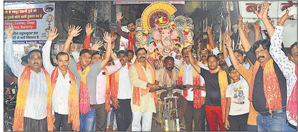
शोभायात्रा निकालते श्री गणेश महोत्सव समिति के पदाधिकारी।