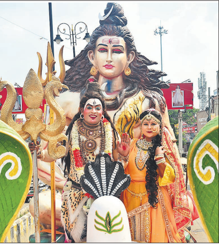
शोभायात्रा में शामिल शंकर भगवान की झांकी।