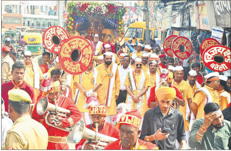
श्री गणेश उत्सव समिति की ओर से निकाली गई शोभायात्रा में शामिल पदाधिकारी व भक्त।