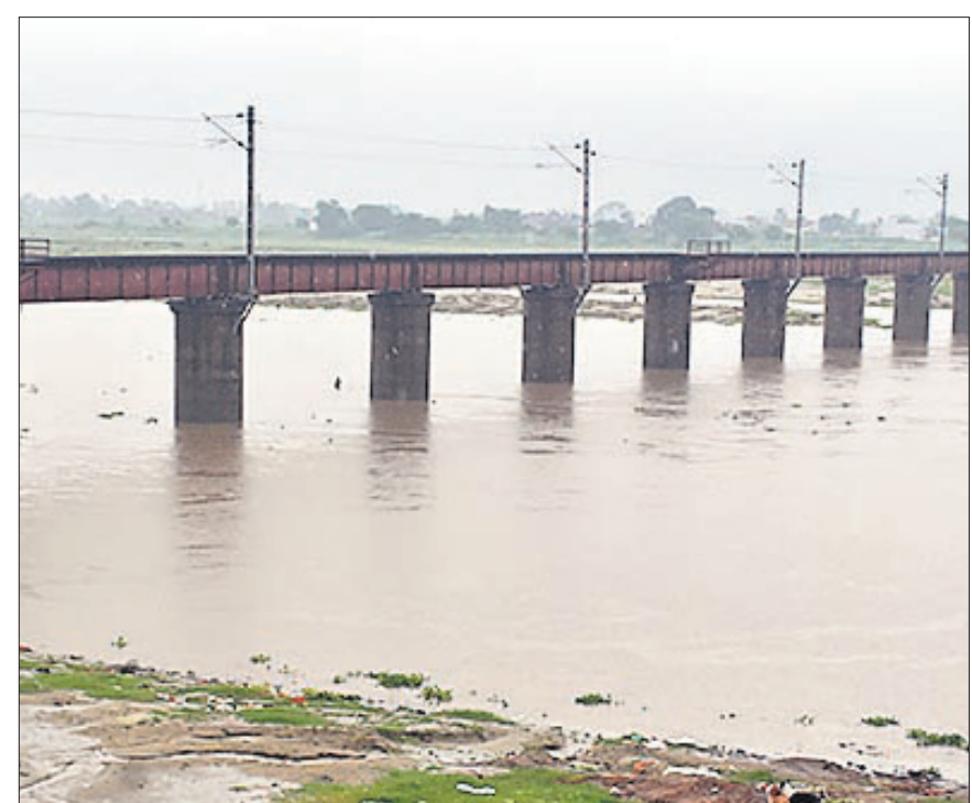
लगातार बारिश की वजह से रामगंगा का जलस्तर भी धीरे-धीरे बढ़ रहा है।