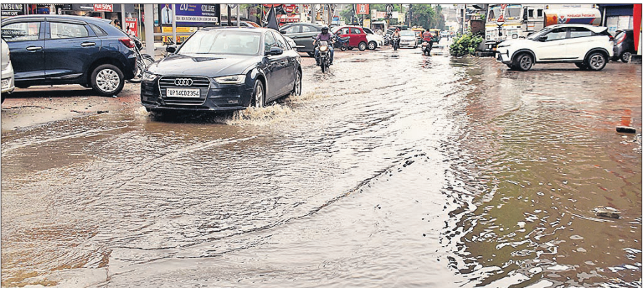
पॉश इलाके डीडीपुरम में जलभराव के बीच से होकर गुजरते वाहन।

इस वजह से मलुकपुर, बड़ी बमनपुरी रोड, डीडीपुरम, हजियापुर, सिकलापुर, दुर्गानगर, जोगी नवादा, संजय नगर,