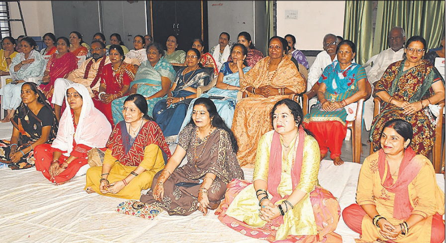
हरियाली तीज कार्यक्रम में गीत गाती महिलाएं।

योगी आदित्यनाथ का बरेली कॉलेज में कार्यक्रम है, इसकी वजह से विद्यार्थियों को सीट लॉक के लिए नहीं बुलाया गया है। इसके बाद सिर्फ एक दिन का समय बचा है, ऐसे में पूरी सीटें लॉक होना मुश्किल है। ऐसे में कॉलेज की ओर से विश्वविद्यालय से समय बढ़ाने का अनुरोध किया गया है।