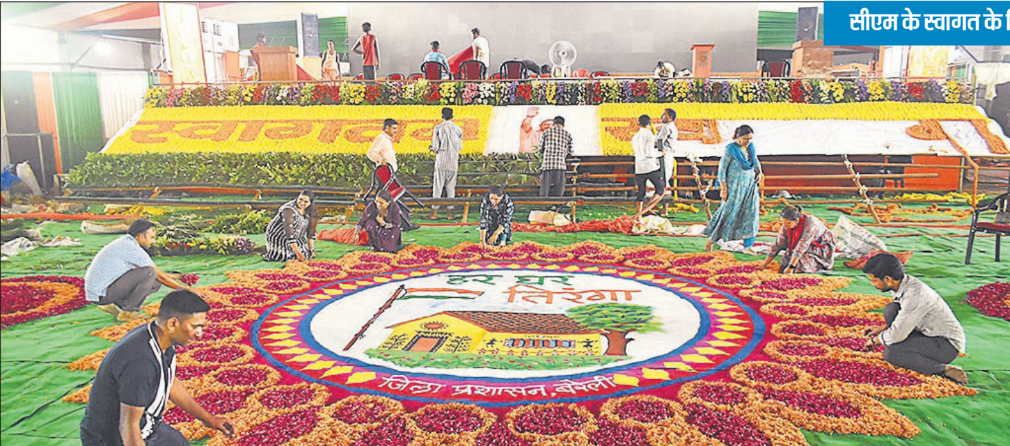
बरेली कॉलेज में मुख्यमंत्री योगी आदित्यनाथ के कार्यक्रम के लिए मंगलवार रात मंच को रंगोली और फूलों से सजाते कर्मचारी।