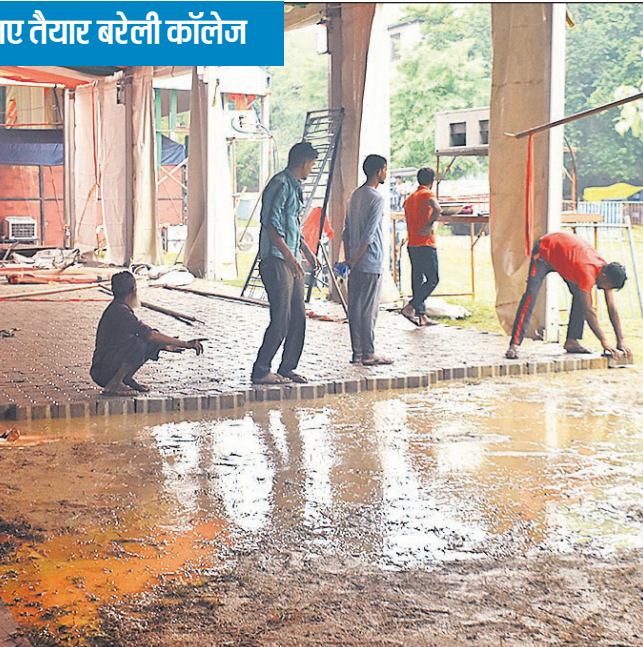
बारिश में जलजमाव की वजह से ईंट बिछाई गई।