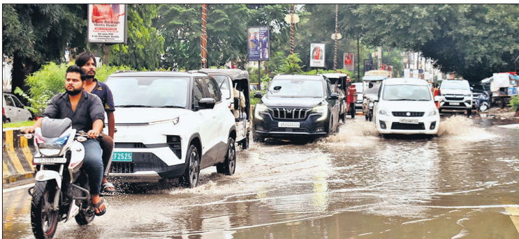
एकतानगर रोड पर जलभराव की वजह से वाहन निकलने में हुई परेशानी।