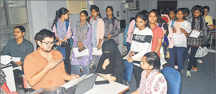
बरेली कॉलेज में सीट लॉक कराने के लिए इंतजार करती छात्राएं।

इन पाठ्यक्रमों का उद्देश्य विद्यार्थियों को बहुभाषिक दक्षताओं से सुसज्जित करना और उनके बहुभाषिक कौशल को विकसित करना है। विश्वविद्यालय के छात्र-छात्राओं में बहुभाषिक शिक्षा को सुदृढ़ करने एवं इन पाठ्यक्रमों में नामांकन को प्रोत्साहित करने के लिए विश्वविद्यालय परिसर के प्रत्येक संकाय और विभाग से विद्यार्थियों को पंजीकरण में सहयोग प्रदान करें। अपने-अपने विभागों में इस सूचना को प्रसारित करें।