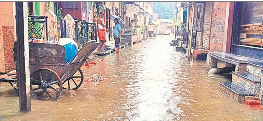
बड़ी बमनपुरी में सड़क पर पानी भरने के साथ घरों में भी घुस गया।