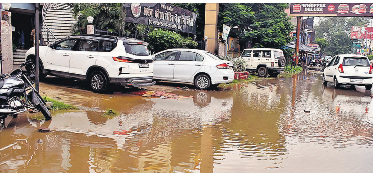
प्रेमनगर में अर्बन कॉर्पोरेटिव बैंक के सामने भी जलभराव हो गया।

मॉडल टाउन, मढ़ीनाथ, मुंशी नगर, सनसिटी, आकशपुरम, बाकरगंज सहित अन्य इलाकों में सड़कें तालाब बन गईं। इन जगहों से आने जाने में लोगों को दिक्कतों का सामना करना पड़ रहा है।