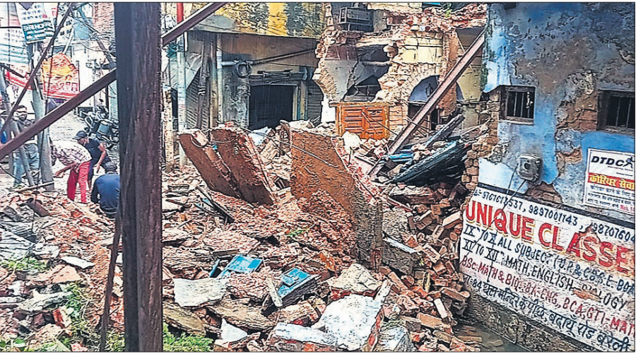
सुभाषनगर में करीब 90 साल पुराने मकान के गिरने के बाद बिखरा पड़ा मलबा।

वहीं दूसरी घटना जगाती मोहल्ले में की है। वार्ड 66 बजरिया पूरनमल स्थित मोहल्ला जगाती में जर्जर भवन के दूसरी मंजिल का कुछ हिस्सा गिर गया।