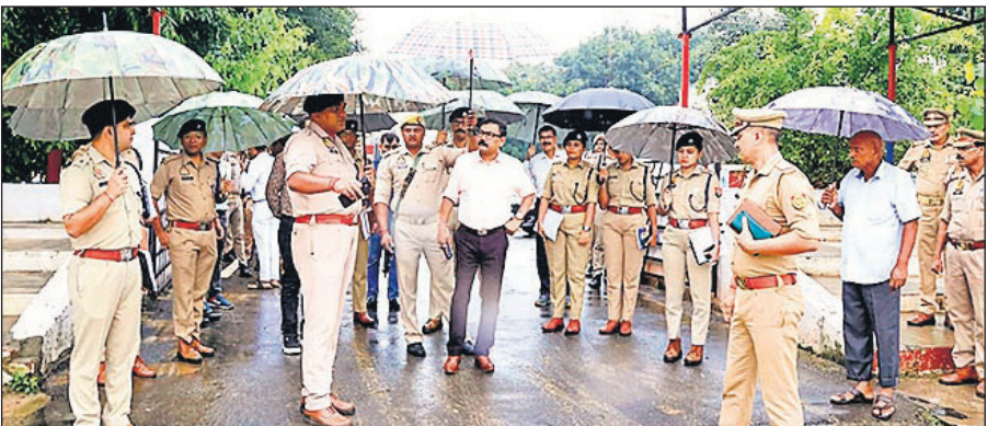
बरेली कॉलेज में मुख्यमंत्री के कार्यक्रम की तैयारियों और सुरक्षा का जायजा लेते अधिकारी।

बरेली कॉलेज से लेकर सर्किट हाउस तक सुरक्षा के कड़े प्रबंध किए गए हैं। सौ-सौ मीटर की रेंज में मजिस्ट्रेट को भी तैनात किया है, ताकि शांति और सुरक्षा व्यवस्था में किसी प्रकार की कोई कमी न रहे। सुरक्षा में 1750 से अधिक पुलिसकर्मियों की तैनाती की गई है। जिलाधिकारी अविनाश सिंह ने मुख्यमंत्री के कार्यक्रम को लेकर सर्किट हाउस से लेकर बरेली कॉलेज तक 86 मजिस्ट्रेट तैनात किए हैं, ये सभी मजिस्ट्रेट कानून व्यवस्था, मंच, पंडाल, रोजगार मेला स्थल, पार्किंग स्थल और वीआईपी को मंच तक पहुंचाने की व्यवस्था संभालेंगे। जिलाधिकारी ने मुख्य विकास अधिकारी देवयानी को संपूर्ण