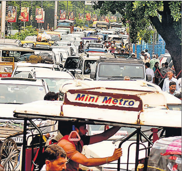
सर्किट हाउस के पास भी इसी तरह के हालात रहे।

चौकी चौराहे से गांधी उद्यान तक आने वाले रास्ते पर सीएम के काफिले को लेकर आधे घंटे पहले ही यातायात को रोक दिया गया। जिसके बाद लोगों ने सर्किट हाउस वाले रास्ते से जाने का प्रयास किया, लेकिन वहां पर सीएम की समीक्षा बैठक होने के चलते पुलिस ने आगे नहीं जाने दिया। जिससे आवास विकास कॉलोनी, बड़ा डाकखाना समेत अन्य जगह पर जाम लग गया। वहीं शहामतगंज, अयूब खां चौराहा, चौपुला, अटल सेतु, कालीबाड़ी, समेत अन्य जगह पर चार घंटे तक लोग जाम में फंसकर परेशान होते रहे।