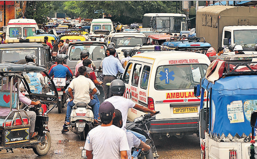
शहामतगंज रोड पर जाम में वाहनों के साथ कई एंबुलेंस भी फंस गईं।