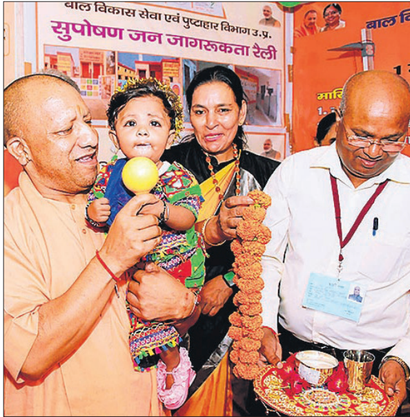
बच्ची का अन्नप्रासन कराते मुख्यमंत्री योगी आदित्यनाथ ।