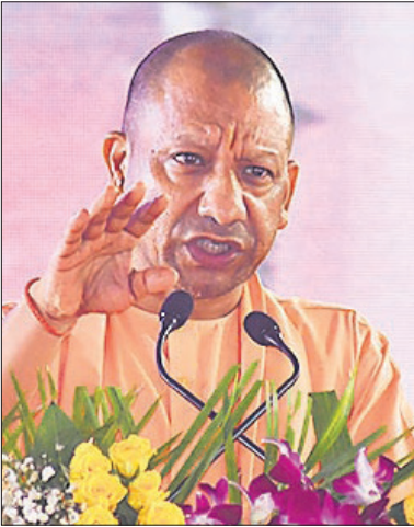
जनसभा को संबोधित करते योगी आदित्यनाथ ।

बरेली कॉलेज में आयोजित जनसभा को संबोधित करते हुए मुख्यमंत्री ने कहा, 2017 से पहले बरेली हर तीसरे महीने दंगों की आग में जलता था। अब वह नाथ कॉरिडोर और आध्यात्मिक पर्यटन के लिए जाना जाता है। अब किसी योजना में जाति, मजहब या क्षेत्र के आधार पर भेदभाव नहीं किया जाता है। यह नया भारत है, जो सबका साथ-सबका विकास की भावना के साथ आगे बढ़ रहा है। बरेली में तेजी के साथ विकास हो रहा है। डबल इंजन की सरकार लोगों के जीवन में खुशहाली और समृद्धि लाने के लिए हर संभव प्रयास कर रही है। प्रति व्यक्ति आय में वृद्धि हुई है। विकास के साथ विरासत भी के सिद्धांत के अन्तर्गत बरेली समृद्धि के मार्ग पर अग्रसर है। योगी ने कहा, नाथ