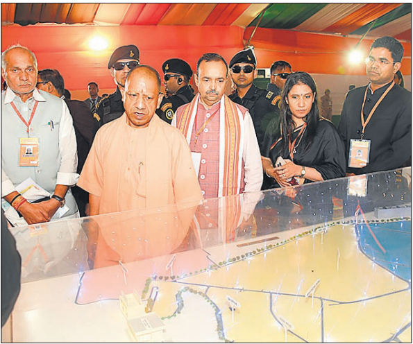
रुद्रा वनम् समेत कई प्रोजेक्ट के मॉडल का निरीक्षण करते मुख्यमंत्री।

इसके अलावा रंग बिरंगी लाइट के साथ म्यूजिकल फाउंटन लगेगा। इसमें भगवान शिव के मंत्र जाप की धुन गुंजेगी।