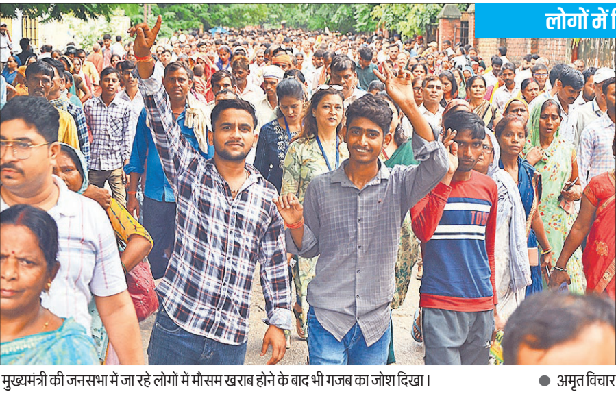
मुख्यमंत्री की जनसभा में जा रहे लोगों में मौसम खराब होने के बाद भी गजब का जोश दिखा।