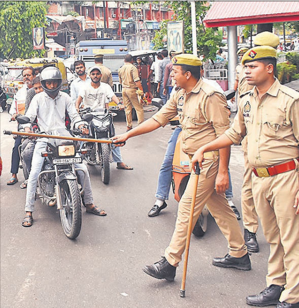
चौकी चौराहा पर वाहन चालकों को रोकते पुलिसकर्मी।