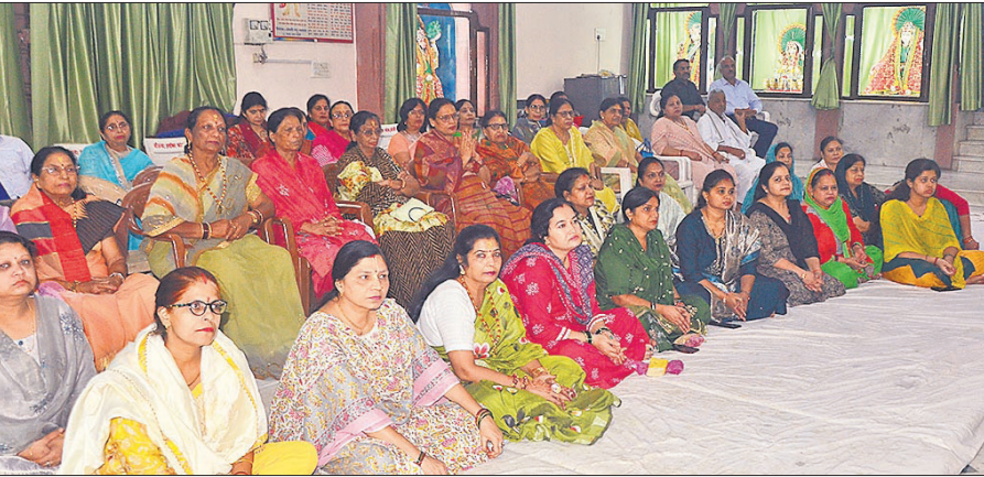
सोमनाथ मंदिर में शिव महापुराण कथा में बड़ी संख्या में श्रद्धालुओं ने भाग लिया।