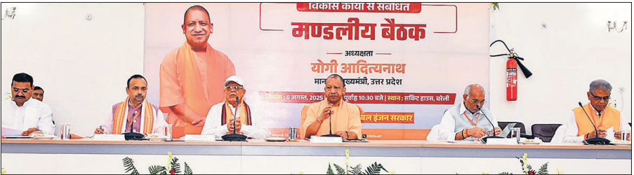
सर्किट हाउस में मंडलीय बैठक करते मुख्यमंत्री योगी आदित्यनाथ ।

अमृत विचार : मुख्यमंत्री योगी आदित्यनाथ ने बुधवार को सर्किट हाउस में जनप्रतिनिधियों के साथ बरेली मंडल में विकास की रफ्तार बढ़ाने के लिए संवाद किया। कई विधायकों की मांग पर मुख्यमंत्री ने एयरपोर्ट जाने वाली पीलीभीत बाईपास मार्ग को सिक्सलेन और सेटेलाइट फ्लाईओवर को वाई शेप में बनाने और पीलीभीत बाईपास मार्ग पर ही सौ फुटा चौराहे पर टी प्वाइंट फ्लाईओवर को मंजूरी दी। प्रत्येक विधायक की विधानसभा के दो प्रमुख कार्यों को स्वीकृति देते हुए पीडब्ल्यूडी के चीफ इंजीनियर को निर्देश दिए कि 15 सितंबर से 15 अक्टूबर तक जो विकास कार्य स्वीकृत हुए, इस अवधि में उनका शिलान्यास भी कराएं। सर्किट हाउस के नवनिर्मित सभागार में मुख्यमंत्री योगी आदित्यनाथ ने मंडल के बरेली,