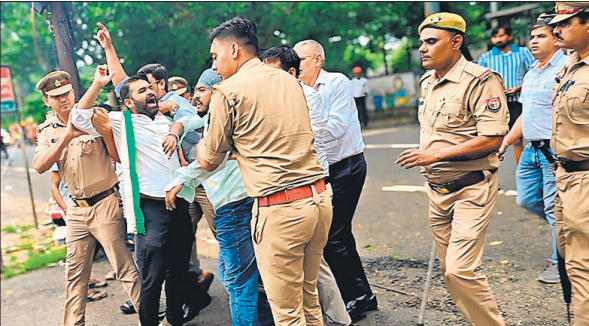
आवास विकास कॉलोनी के गेट के पास कांग्रेसियों को रोकते पुलिसकर्मी।