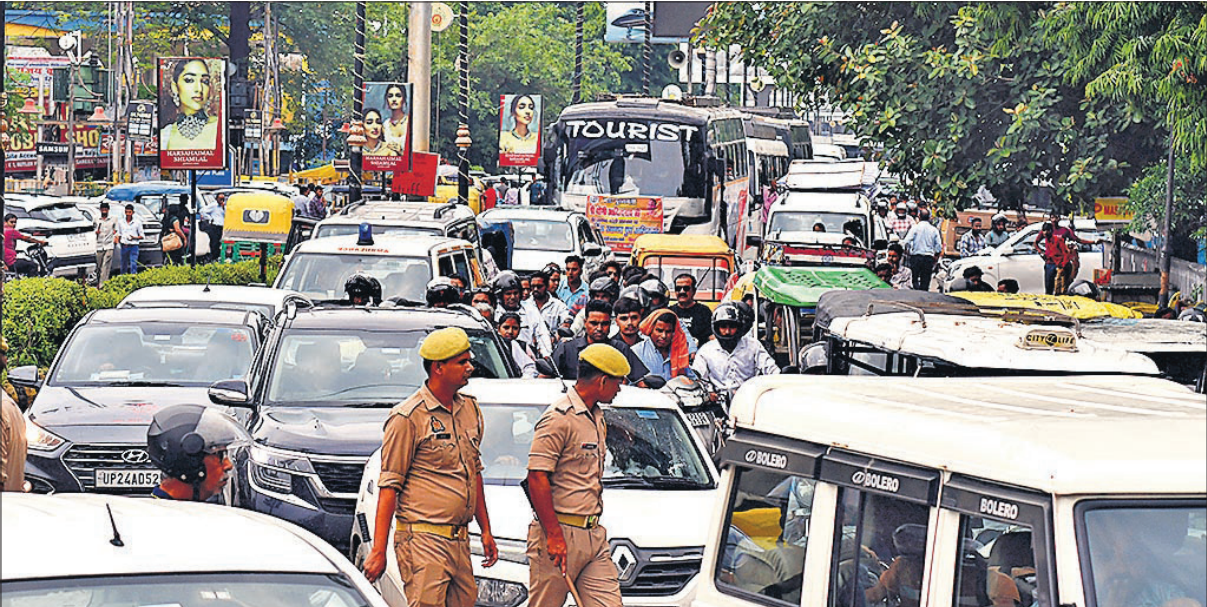
मुख्यमंत्री के कार्यक्रम की वजह से चौकी चौराहा पर ट्रैफिक रोकने से लगे भीषण जाम में फंसे वाहन।