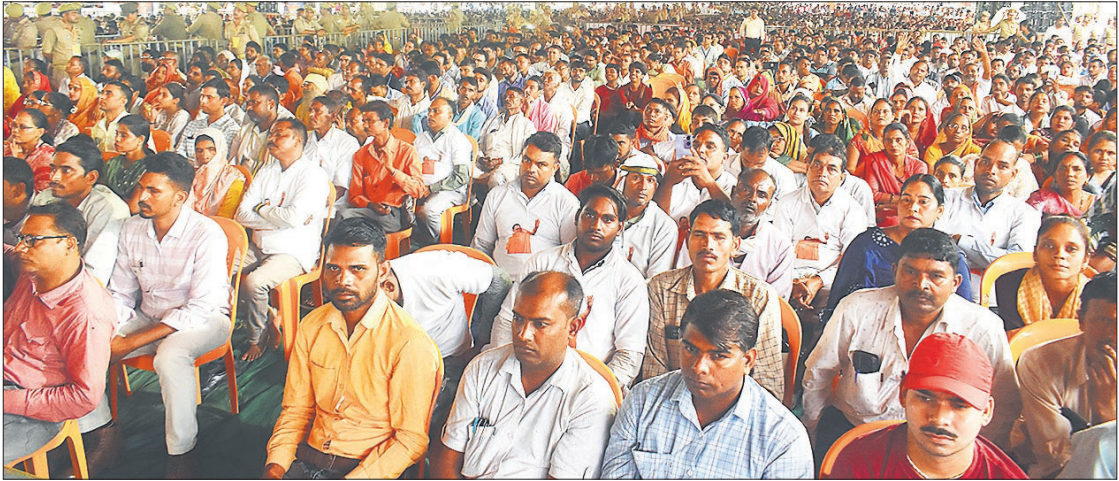
बरेली कॉलेज में मुख्यमंत्री की जनसभा में बड़ी संख्या में महिलाएं और पुरुष शामिल हुए ।

मुख्यमंत्री ने कहा कि न्यू बरेली में विकास प्राधिकरण, नगर निगम और जनप्रतिनिधियों द्वारा विकास कार्य कराया जा रहा है। उन्होंने कहा कि कुछ असामाजिक तत्व