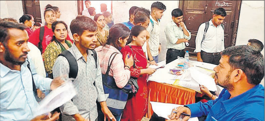
बरेली कॉलेज में आयोजित रोजगार मेले में साक्षात्कार देते आवेदक।

गुजरात से आई कंपनियों ने दी तकनीकी युवाओं को प्राथमिकता : गुजरात में मोबाइल के पाटर्स बनाने वाली कंपनियों के प्रतिनिधियों ने तकनीकी शिक्षा प्राप्त करने वाले युवाओं को प्राथमिकता दी। युवाओं के अनुसार कंपनी की ओर से 22 हजार के पैकेज पर गुजरात में काम करना था। इसमें कंपनी