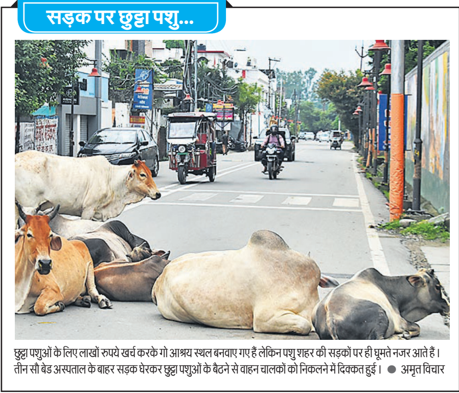
छुड़ा पशुओं के लिए लाखों रुपये खर्च करके गो आश्रय स्थल बनवाए गए हैं लेकिन पशु शहर की सड़कों पर ही घूमते नजर आते हैं। तीन सौ बेड अस्पताल के बाहर सड़क धेरकर छुड़ा पशुओं के बैठने से वाहन चालकों को निकलने में दिक्कत हुई।