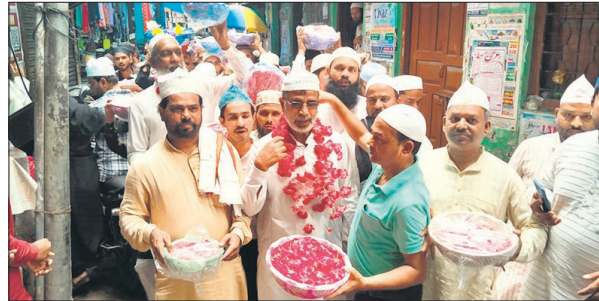
बिना डीजे के दरगाह आला हजरत पर पहुंचा जुलूस।