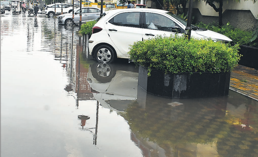
बारिश के बाद विकास भवन के पास आनंद आश्रम रोड पर भरा पानी।

अन्य गंभीर कारणों में छात्रों को छुट दी जा सकेगी। इसके लिए विद्यार्थियों को आवश्यक दस्तावेज उपलब्ध करवाने होंगे। अगर कोई छात्र मेडिकल कारणों से स्कूल नहीं आता है तो उसे अपने विद्यालय में आवश्यक दस्तावेजों सहित छुट्टी के लिए आवेदन करना होगा। बिना स्कूल को आवेदन किए अनुपस्थित रहने पर उपस्थिति नहीं मानी जाएगी। बोर्ड ने पहली बार गाइडलाइन जारी की है, जिसे सभी विद्यालयों के प्रधानाचार्यों को भेजा गया है।