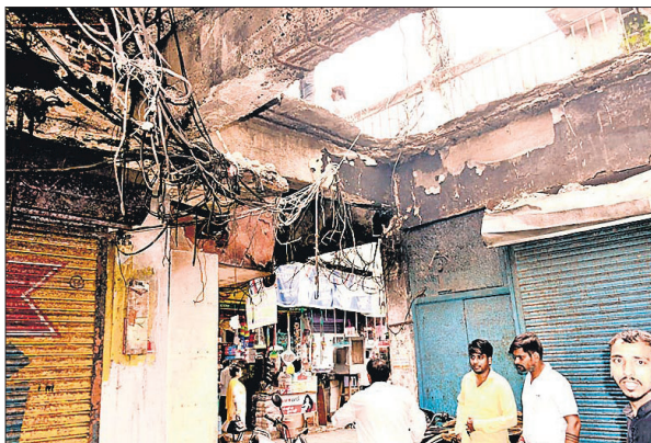
शास्त्रीनगर मार्केट में नगर निगम की जर्जर दुकानें।