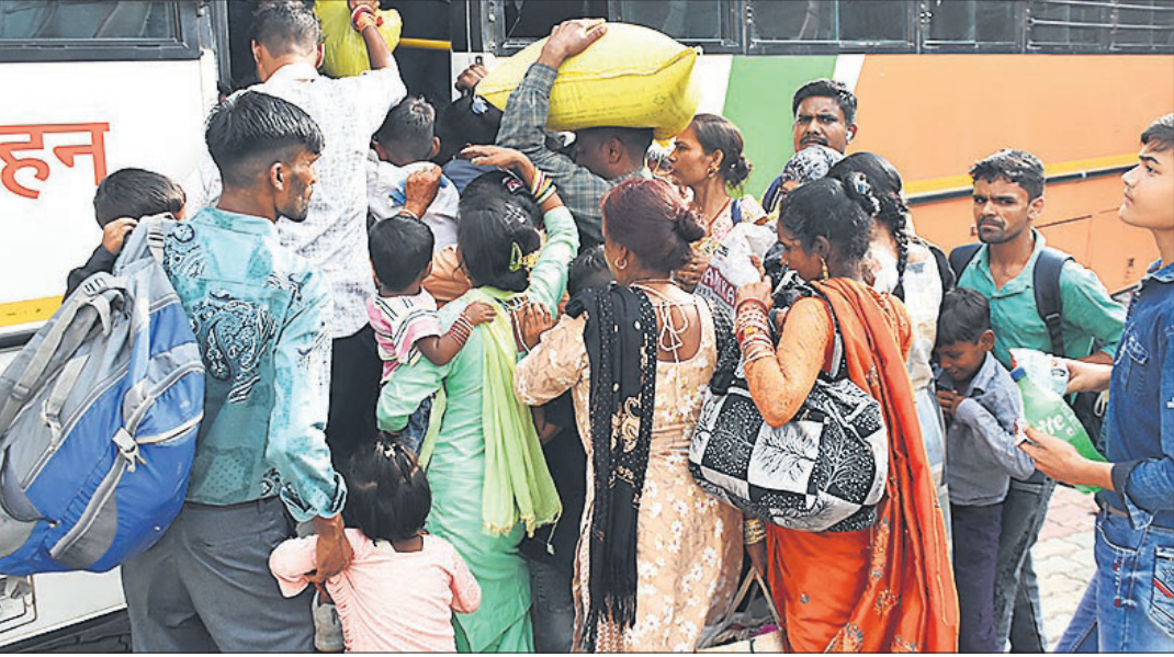
पुराने बस अड्डे पर रोडवेज बस में चढ़ने के लिए गेट पर धक्कामुक्की करते यात्री।

रक्षाबंधन पर रोडवेज की बसों से सफर कर भाई के पास पहुंचने वाली बहनों को पहले भाइयों के पास पहुंचने में भारी परेशानियों का सामना करना पड़ा। वहीं, रक्षाबंधन निपटने के बाद घर वापसी के लिए भी बसों में सीट पाने को लेकर काफी मशक्कत करनी पड़ी। यहां तक कई किलोमीटर तक महिलाओं को भीड़ में खड़े रहकर सफर करने को मजबूर होना पड़ा। दोनों ही बस स्टैंड पर रविवार सुबह करीब 11 बजे यात्रियों की काफी भीड़ रही। जो बसें थी वह यात्रियों से खचाखच भरी थीं। सैटेलाइट बस स्टैंड पर बसों में बैठने की होड़ मची रही। महिलाओं और पुरुषों ने खिड़की से बैग और रूमाल आदि रखकर सीट सुरक्षित करने का प्रयास किया, लेकिन इसमें