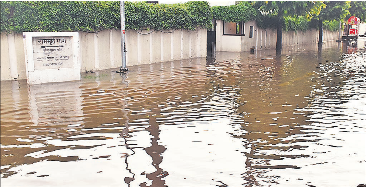
रामपुर गार्डन में रविवार शाम कुछ देर की बारिश के बाद राममूर्ति मार्ग पर भीषण जलभराव।

स्मार्ट सिटी का वार्ड सिकलापुर, आजमनगर, साहू गोपी नाथ में जल निकासी व्यवस्था ठीक न होने के कारण सड़क पर जलभराव होने से काफी समय तक घर से बाहर नहीं निकले। मॉडल टाउन में सीएम ग्रीड सड़क के लिए खोद गए गड्ढों में पानी भर गया और सड़क पर मिट्टी होने के कारण फिसलन बढ़ गई थी। वहीं सुभाष नगर पुलिया में बारिश का पानी घुसने के कारण काफी देर तक आवागमन प्रभावित रहा है, जबकि यहां नाले को करीब एक माह पहले सफाई कराया गया था। थोड़ी सी बारिश में मोहल्लों में जलभराव हो जा रहा है। इससे आशंका है कि नाला सफाई में लगी एजेंसियों ने सिर्फ कागजों में सफाई पूरा दिखा है लेकिन धरातल पर हकीकत यह है कि लोग जलभराव से जूझ रहे हैं। कई जगह नाले गंदगी से भरे पड़े हैं, इनकी सही तरीके से सफाई नहीं हुई, जहां हुई भी, वहां गाद और कचरा किनारे फेंक दिया गया और बारिश में फिर से नाले में आ गया है। इससे नाला चोक हो रहे हैं।