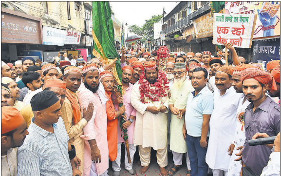
कलियर के लिए रवाना होता पैदल झंडे का काफिला।

दरगाह पर रविवार सुबह से ही अकीदतमंदों का तांता लगा रहा। महफिल-ए-शमा में कच्चालों ने कलाम पेश किए। उसके बाद साबरी लंगर बांटा गया। कलियर में होने वाले साबिर पाक के 757 वें उर्स के आगज ने लिए