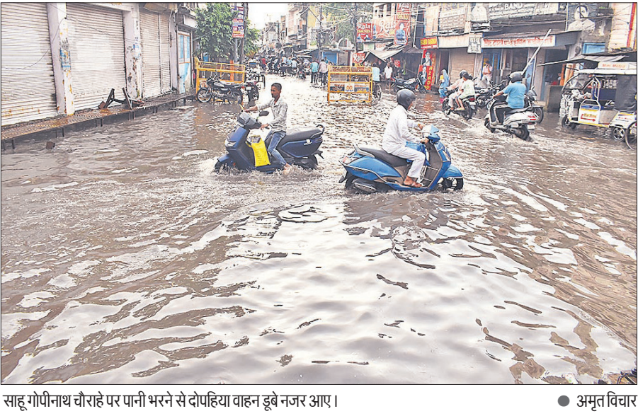
साहू गोपीनाथ चौराहे पर पानी भरने से दोपहिया वाहन डूबे नजर आए।