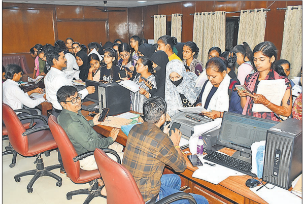
बरेली कॉलेज के सेमिनार कक्ष में सीट लॉक करने के लिए पहुंचे छात्र-छात्राएं।

मुताबिक परास्नातक पाद्यक्रमों में प्रवेश के लिए कुल 3536 आवेदन आए हैं। इनमें एमए हिंदी में 218, अंग्रेजी में 306, संस्कृत में 35, उर्दू में 37, दर्शनशास्त्र में 23, इतिहास में 404, अर्थशास्त्र में 142, राजनीति शास्त्र में 355, समाजशास्त्र में 281, ड्राइंग एंड पेंटिंग में 43, गणित में 9, सैन्य अध्ययन में 9, सांख्यिकी में 1, भूगोल में 123, एमएससी वनस्पति विज्ञान में 184, रसायन विज्ञान में 219,