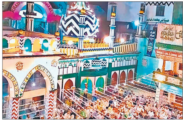
उर्स की तैयारियों पर आयोजित बैठक में मौजूद लोग।