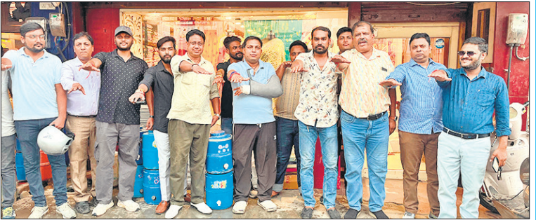
टैरिफ के विरोध में शपथ लेते मंडल के पदाधिकारी और सदस्य।