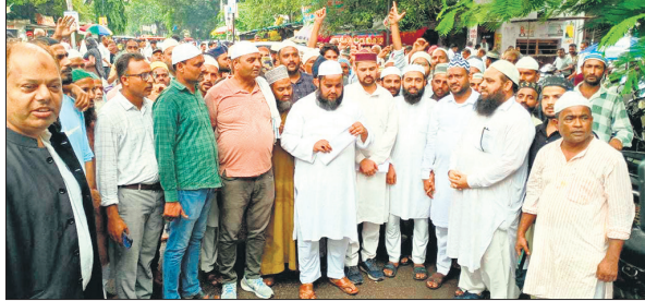
कलेक्ट्रेट में ज्ञापन देने पहुंचा ऑल इंडिया रजा एक्शन कमेटी का प्रतिनिधिमंडल।