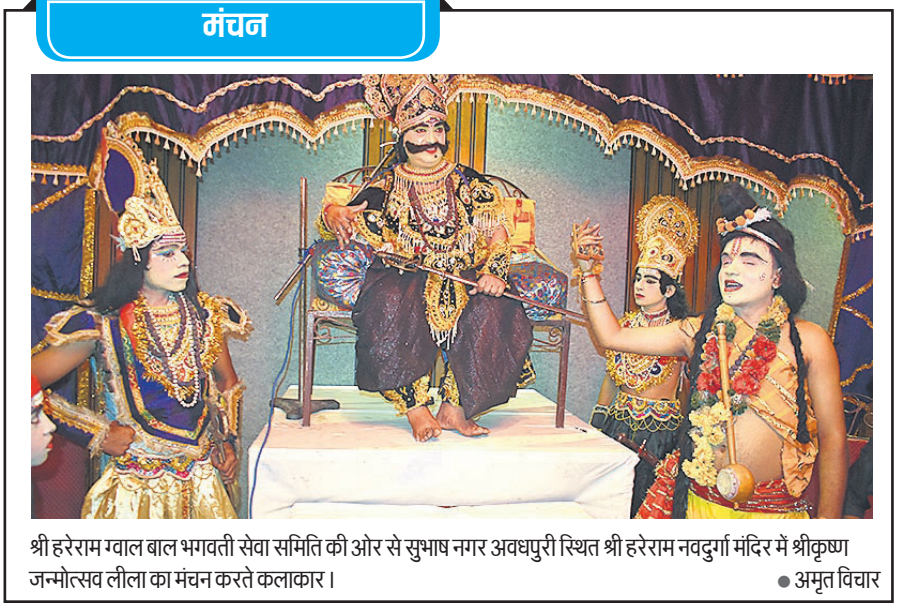
श्री हरेराम ग्वाल बाल भगवती सेवा समिति की ओर से सुभाष नगर अवधपुरी स्थित श्री हरेराम नवदुर्गा मंदिर में श्रीकृष्ण जन्मोत्सव लीला का मंचन करते कलाकार।