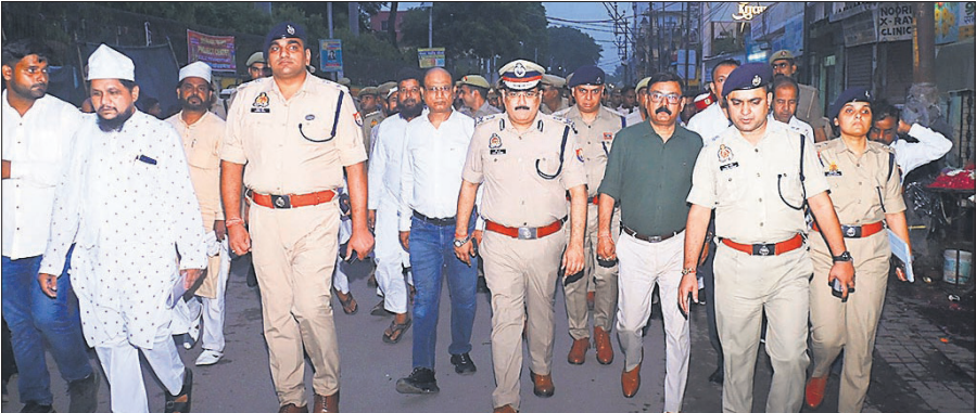
स्वतंत्रता दिवस और आगामी त्योहारों के मद्देनजर पैदल गश्त करते पुलिस और प्रशासन के अधिकारी।