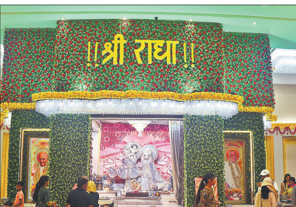
जन्माष्टमी के लिए फूलों से सजाया जा रहा हरि मंदिर।