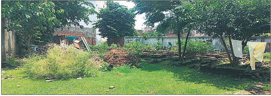
हरुनगला में बंद पड़ा फ्लावर वेस्ट प्लांट।

नाथ नगरी समेत विभिन्न मंदिरों से प्रतिदिन बड़ी मात्रा में फूल और पत्तियां चढ़ाई जाती हैं, लेकिन अभी इनका इस्तेमाल न होने के कारण इन्हें कचरे में फेंक दिया