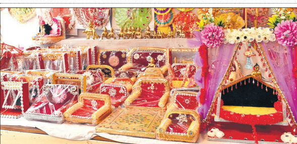
बाजार में पालना समेत अन्य सजावट के सामान मौजूद।