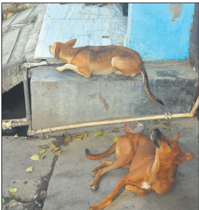
शहर में घूमते आवारा कुत्ते।

परिवार के लोगों ने बच्ची को फरीदपुर की सीएचसी में भर्ती कराया, लेकिन मंगलवार की सुबह