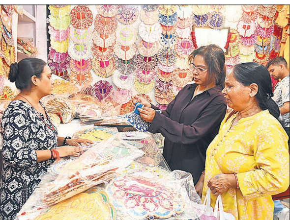
बाजार में श्रीकृष्ण जन्माष्टमी से जुड़ा सामान खरीदती महिलाएं।

बाजार में इस बार बाल कृष्ण की मार्बल डस्ट की मूर्तियां आई हैं। मार्बल की चमक वाली ये मूर्तियां वजन में बेहद हल्की हैं। इनकी कीमत 600 रुपये से शुरू है। वहीं राधा-कृष्ण के जोड़े समेत मूर्तियों की कीमत 1500 रुपये तक है। वही इस वर्ष बाल कृष्ण की नई डिजाइन की पोशाकें भी बाजार में लोगों को आकर्षित कर रही हैं, जिसमें वेल्वेट, रेशम, फूल, नेट व जर्किन की कढ़ाई सर्वाधिक हैं। बाल कृष्ण के लिए हार की कीमत