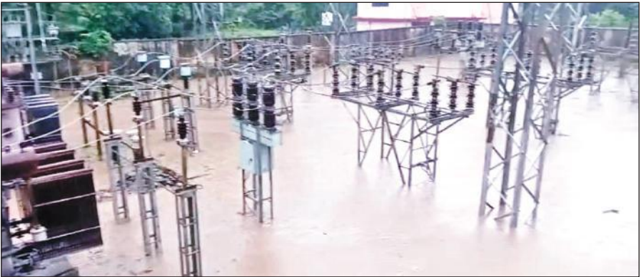
पानी में डूबा रानीबाग में स्थित यूपीसीएल का सब स्टेशन। ● अमृत विचार

अमृत विचार: रविवार को एक ओर जहां मूसलाधार बारिश ने शहर और ग्रामीण इलाकों में जनजीवन अस्त-व्यस्त कर दिया, वहीं दूसरी ओर बिजली संकट ने लोगों की मुश्किलें और बढ़ा दीं। रानीबाग स्थित विद्युत विभाग के सब स्टेशन में बारिश का पानी भर गया, जिससे रानीबाग और गौलापार क्षेत्र की बिजली आपूर्ति पूरी तरह उप्त हो गई।