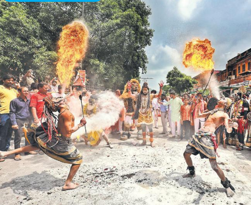
जयपुर में रविवार को कांवड़ यात्रा के दौरान कई कलाकार हेरतअगेज प्रदर्शन करते हुए गुजरे। सड़कों पर उन्हें देखने के लिए भीड़ लग गई। श्रावण मास में कांवड़ यात्रा के दौरान ऐसे करतब दिखाने वाले कलाकार लोगों को खूब खुबा रहे हैं।