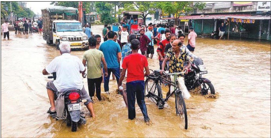
बाजपुर में बैरिया दौलत मुख्य मार्ग पर पुल के ऊपर से बहता लेवड़ा नदी में आई बाढ़ का पानी और निकलते लोग । ● अमृत विचार

अमृत विचार: पहाड़ में हुई मूसलाधार बारिश से अनेक कॉलोनियों में जलभराव की समस्या उत्पन्न हो गई है। जिससे बाढ़ प्रभावित परिवारों की दुश्चरियां बढ़ गई हैं। वहीं पर्वतीय क्षेत्र में भारी बारिश के कारण लेवड़ा, गड़प्पू, गड़री आदि नदियां उफान पर हैं। लेवड़ा नदी की बाढ़ का पानी बेरिया रोड पर नदी बनकर दौड़ने लगा। इतना ही नहीं नैनीताल-बाजपुर स्टेट हाइवे का करीब दो किलोमीटर का दायरा नदी में तब्दील गया जिससे वाहन चालकों को आवागमन में भारी परेशानी का सामना करना पड़ा। वहीं इन्द्रा कॉलोनी में एनडीआरएफ व एसडीआरएफ द्वारा करीब दस लोगों को रेस्क्यू किया गया। वहीं प्रशासन द्वारा बाढ़ पीड़ितों को भोजन आदि उपलब्ध कराया है। प्रशासन के अनुसार दो सौ से भी अधिक परिवार बाढ़ से प्रभावित हुए हैं। ग्राम जवरान, झांडखंडी में दावका का पानी लोगों के घरों में घुस गया जिसके चलते दो कच्चे घर गिर गए हैं। वहीं आवागमन भी प्रभावित हुआ है पानी के साथ सांप आदि बहकर आने से लोगों में दहशत भी व्याप्त है। प्रशासन द्वारा कच्चे घरों के गिरने की जानकारी पर सहायता प्रदान करने के लिए