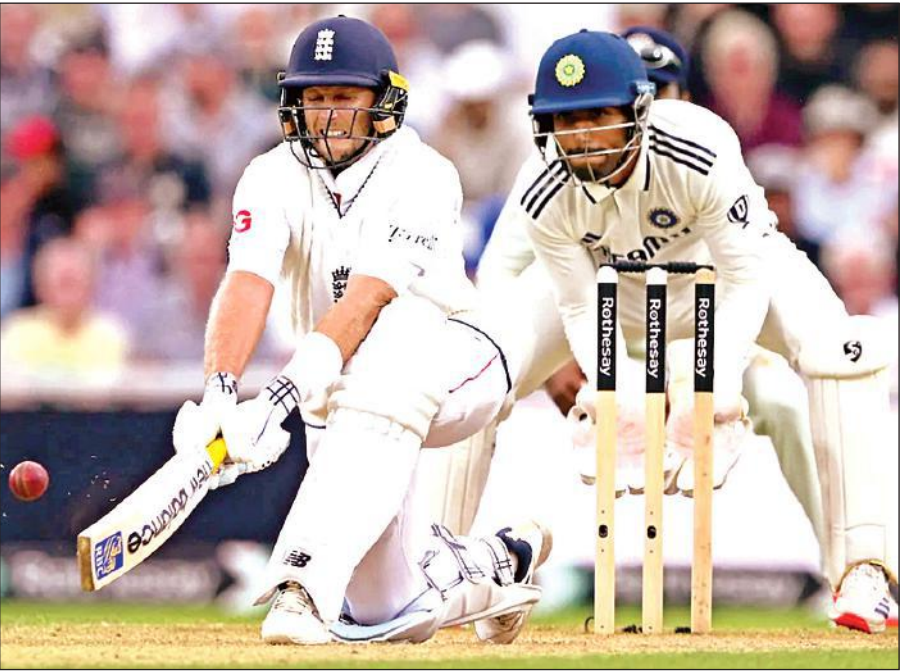
इंग्लैंड के बल्लेबाज जो रुट पारी के दौरान शॉट लगाते हुए।

टीम को जीत के लिए और 35 रन चाहिए जबकि भारत को चार विकेट की जरूरत है। इंग्लैंड श्रृंखला में 2-1 से आगे है और भारत को बराबरी करने के लिए चार विकेट की जरूरत है। चोट के कारण पहली पारी में बल्लेबाजी नहीं करने वाले क्रिस वोक्स हालांकि ड्रैसिंग रूम में हाथ में स्लिंग लागये टेस्ट टीम की जर्सी में दिखे जिससे अंदाजा लगाया जा सकता है कि वह जरूरत पड़ने पर बल्लेबाजी के लिए आ सकते हैं। मोहम्मद सिराज और प्रसिद्ध कृष्णा ने चाय के विश्राम के बाद शानदार गेंदबाजी करते हुए भारत की उम्मीदें जगा दी है। इंग्लैंड चाय के विश्राम तक चार विकेट पर 317 रन बनाकर काफी मजबूत स्थिति में था लेकिन