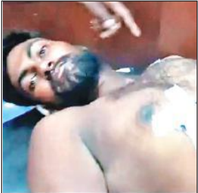
सीएचसी सितारगंज में भर्ती घायल युवक।