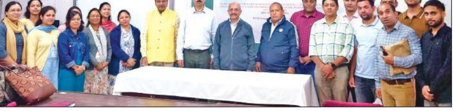
जलवायु परिवर्तन पर आयोजित कार्यशाला के दौरान शोधकर्ता ।