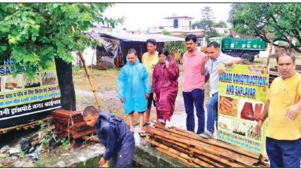
वार्ड 58 में जल भराव का निरीक्षण के दौरान नगर आयुक्त, सिटी मजिस्ट्रेट और पार्षद।

हो जाता है। जलभराव के कारण आए दिन कीचड़ और गड्ढों से सनी इस सड़क पर फिसलकर कई लोग चोटिल हो चुके हैं। स्थानीय दुकानदारों और रहवासियों का कहना है कि उन्होंने कई बार सड़क की मरम्मत की मांग स्थानीय जनप्रतिनिधियों और विभागीय अधिकारियों से की है, लेकिन आज तक केवल आशवासन ही मिला है। लोगों का कहना है कि बारिश के चलते अब हालात और बिगड़ते जा रहे हैं, लेकिन स्थिति जस की तस बनी हुई है। स्थानीय लोगों की मांग है कि इस सड़क की तत्काल मरम्मत कराई जाए ताकि आमजन को राहत मिल सके और क्षेत्र में आवागमन सुगम हो सके।