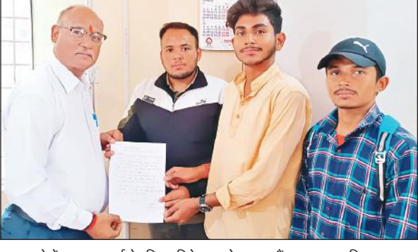
एसएसजे में एनएसयूआई ने परिसर निदेशक को ज्ञापन सौंपा। ● अमृत विचार

एसएसजे परिसर में बीसीए में सीटें बढ़ाने की मांग, ज्ञापन सौंपा