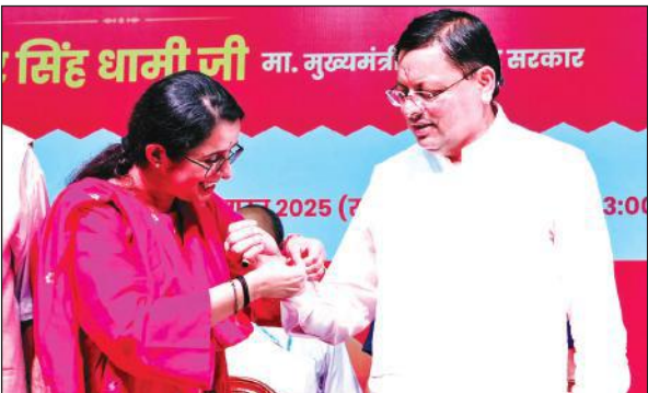
रक्षाबंधन समारोह के दौरान राखी बंधवाते मुख्यमंत्री पुष्कर सिंह धामी।

गढ़ीकैट देहरादून में हरबंस कपूर मेमोरियल कम्प्युनिटी हॉल में गजेन्द्र सिंह शेखावत भी मौजूद रहे। मुख्यमंत्री ने कहा कि हम ग्रामीण महिलाओं की आजीविका में वृद्धि के लिए जल्द ही ‘जल सखी योजना’ शुरू करने जा रहे हैं। साथ ही, ग्रामीण क्षेत्रों में पेयजल आपूर्ति का काम महिला स्वयं सहायता समूहों को सौंपने की भी तैयारी की जा रही है। ग्रामीण क्षेत्रों में नए