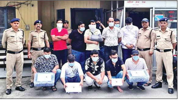
पुलिस की गिरफ्त में आरोपी।