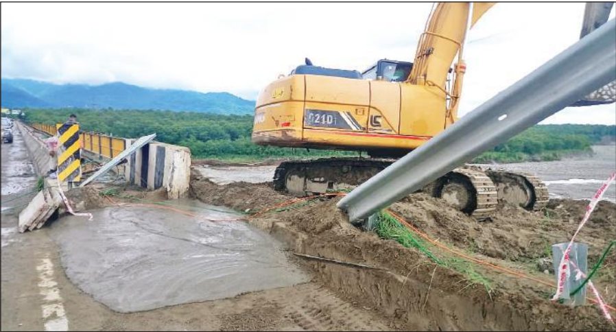
गौला पुल पर चल रहा मरम्मत का कार्य।

एक बार टूटने के बाद दोबारा बनाए गए गौलापुल को पहली बार नुकसान अक्टूबर 2021 की बारिश में पहुंचा था। पुल से जुड़ी एप्रोच सड़क के धंसने की वजह से पुल को कई दिनों तक बंद करना पड़ा था। इसके बाद अगस्त 2024 की बारिश में एक बार फिर से पुल की एप्रोच रोड को नुकसान पहुंचा। इसके बाद भी पुल को कई दिनों तक यातायात को बंद करना पड़ा था। इस बार मानसून की शुरूआत के साथ ही पुल को मजबूत करने