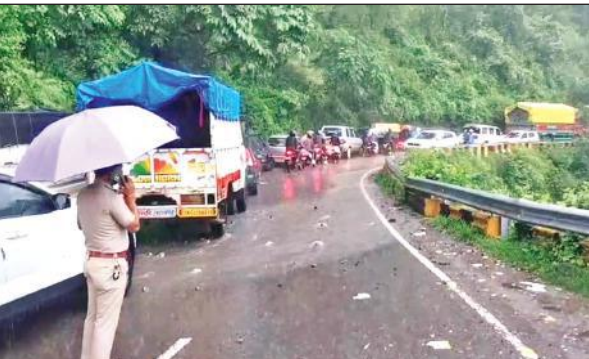
नैनीताल रोड पर रानीबाग में लगा जाम। ● अमृत विचार

वाहनों को लेकर आने लगे। इस वजह से नैनीताल रोड पर वाहनों का और भी भार बढ़ गया। सलड़ी