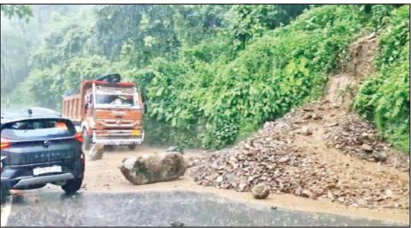
गुलाबघाटी में आया मलबा। ● अमृत विचार

नैनीताल : सरोवर नगरी में रविवार शाम झमाझम पानी बरसा। नाले उफान पर आ गए। मौसम विभाग ने अगले दो दिन तेज बारिश के आसार जताए हैं। नगर में आज सुबह ही मौसम का मिजाज नासाब नजर आया। दिन शुरू होते हो हल्की रिमझिम बारिश शुरू हो गई, जोकि रुक-रुक कर सुबह नौ बजे तक जारी रही। दोपहर में हल्की बूंदाबांदी का दौर रहा, पर वर्षा नहीं हुई। तीन बजते ही बारिश शुरू हो गई, जो कभी तेज तो कभी हल्की, देर शाम तक जारी रही।