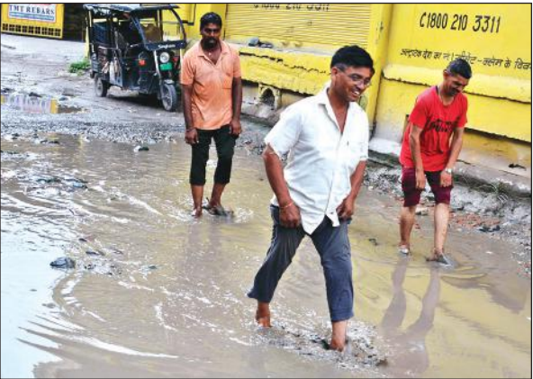
कीचड़ के बीच से होकर गुजरते लोग।

यह सड़क सुशीला तिवारी अस्पताल के पीछे से निकलने वाली नहर वाली सड़क से जुड़ती है, जिससे रोजाना बड़ी संख्या में लोग गुजरते हैं। सड़क के किनारे सब्जी और फलों की कई दुकानें