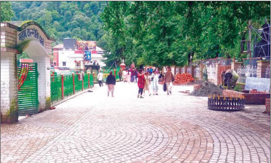
वीकेंड के मौके पर सुनसान पड़ा पंत पार्क ।