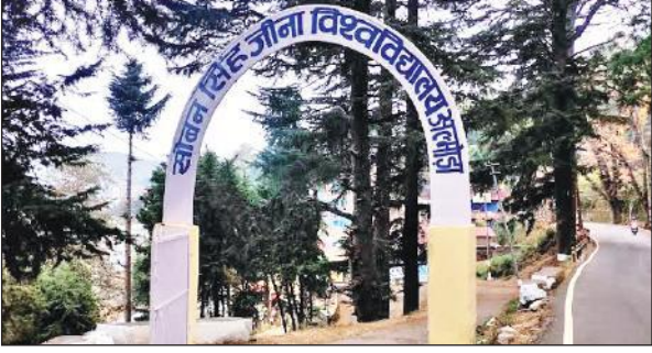
सोबन सिंह जीना विश्वविद्यालय अल्मोड़ा। ● अमृत विचार

अमृत विचार : सोबन सिंह जीना विश्वविद्यालय में अंकतालिकाओं में गड़बड़ी का मामला सामने आया है। बैक परीक्षा पास करने के बाद भी 700 से अधिक छात्र-छात्राओं को फेल दिखाया गया है। विवि की इस लापरवाही से अब छात्रों को अगली कक्षा में प्रवेश को लेकर दिक्कतों का सामना करना पड़ सकता है। विवि में किसी विषय में फेल होने पर छात्र अगले सत्र की परीक्षाओं के साथ उस विषय की बैक परीक्षा देते हैं। ताकि वह उस विषय में पास हो सके, लेकिन विश्वविद्यालय के कई छात्र बैक परीक्षा देने के बाद विवि की अंकतालिकाओं में फेल दिखाए गए हैं। जबकि छात्र-छात्राएं स्नातक की शिक्षा पूरी भी कर चुके हैं। फिर भी अंकतालिकाओं में बैक दिखने से छात्र परेशान हैं। विवि प्रशासन के अनुसार, ऐसे छात्र-छात्राओं की संख्या सात सौ के करीब है। रिजल्ट