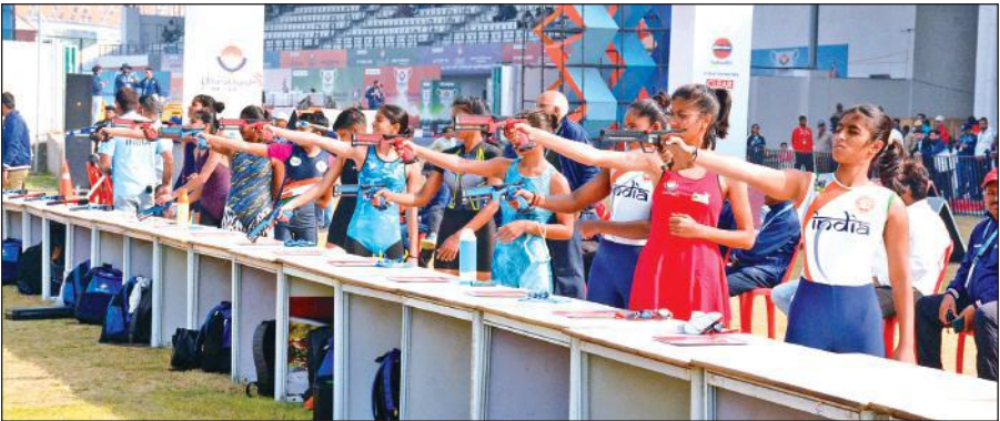
राष्ट्रीय खेलों के दौरान मॉडर्न पेंटाथलॉन में प्रतिभाग करते खिलाड़ी।