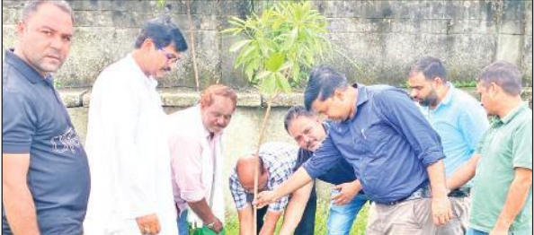
काशीपुर में पीसीबी की भूमि पर पौधरोपण करते अधिकारी। ● अमृत विचार