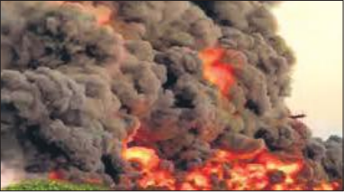
रूस के सोची में तेल डिपो से उठते धुएं के गुबार।

क्रास्नोडार क्षेत्र के गवर्नर वेनियामिन कोंड्राटयेव ने ‘टेलीग्राम’ पर बताया कि एक ड्रोन का मलबा गिरने से ईंधन टैंक में भीषण आग लग गयी, जिसे बुझाने के लिए 120 से अधिक दमकलकर्मী जुटे गए। सोशल मीडिया पर सामने आए इस घटना के वीडियो में तेल डिपो के ऊपर से धुएं के विशाल गुबार उठते दिखाई दिए। चोरोनिश क्षेत्र के अधिकारियों ने बताया कि एक अन्य यूक्रेनी ड्रोन हमले में चार लोग घायल हो गए। रूस के रक्षा मंत्रालय ने