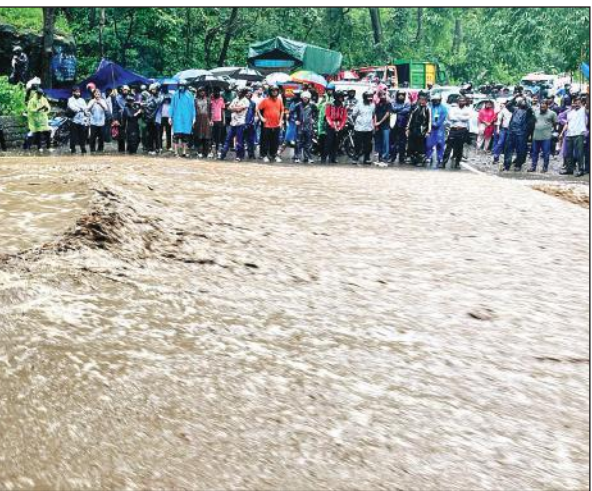
पहाड़ों पर भारी बारिश से नदिया उफान पर हैं तो पहाड़ टूटने से भुजियाघाट के पास इस कदर पानी का तेज बहाव देखने को मिला।

तेज बारिश के चलते सड़क पर नाले जैसा सैलाब आ गया, जिससे हल्द्वानी-नैनीताल मार्ग पूरी तरह से बंद हो गया। भारी वाहनों और पेट्रोकों की गाड़ियों की लंबी कतारें