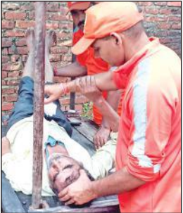
लेवड़ा में आई बाढ़ का पानी देख बेहोश हुए वृद्ध को उपचार को लाती टीम ।