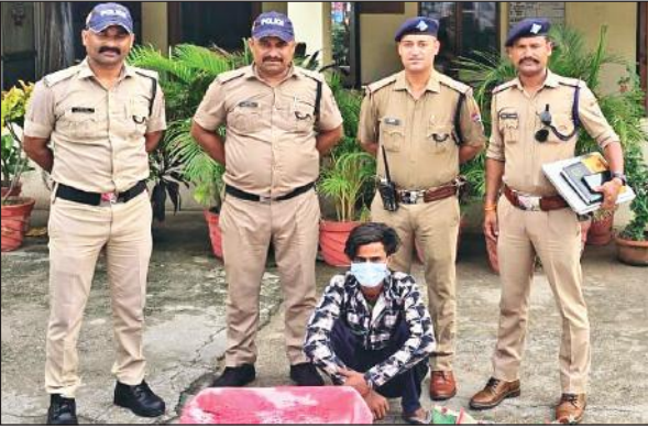
काशीपुर में पुलिस गिरफ्त में आरोपी।