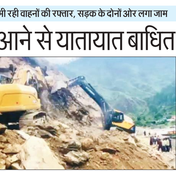
अल्मोड़ा- हल्द्वानी राष्ट्रीय राजमार्ग के क्वारब के पास मलबा हटती जेसीबी।

47वीं रैंक प्राप्त की है। आईएसएस गौरी प्रभात के पिता प्रभात कुमार 1985 बैच के उत्तर प्रदेश कैडर के रिटायर्ड आईएसएस अधिकारी हैं। वह उत्तर प्रदेश लोक सेवा आयोग के अध्यक्ष भी रह चुके हैं। गौरी प्रभात की माता भी आईआरएस अधिकारी हैं। स्थानीय लोगों का इस संबंध में कहना है कि, नवनियुक्त आईएसएस गौरी प्रभात के अनुभवों का लाभ निश्चित ही अब पर्यटक नगरी रानीखेत के लोगों के साथ ही यहां के विकास को मिलेगा।