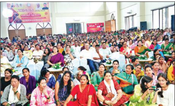
राजधानी में रविवार को आयोजित रक्षाबंधन समारोह में उपस्थित महिलाएं।

जहां बेटी बचाओ-बेटी पढ़ाओ योजना, सुकन्या समृद्धि योजना और उज्ज्वला योजना जैसी विभिन्न योजनाओं के माध्यम से मोदी सरकार देश की बेटियों और महिलाओं को आत्मनिर्भर बनाने का प्रयास कर रही है। सरकार ने तीन तलाक जैसी कुप्रथा का अंत करने के साथ-साथ, नारी शक्ति वंदन अधिनियम, शौचालय निर्माण, आवास योजना के तहत