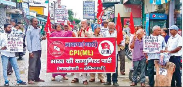
प्रदर्शन करते भाकपा माले के कार्यकर्ता । ● अमृत विचार