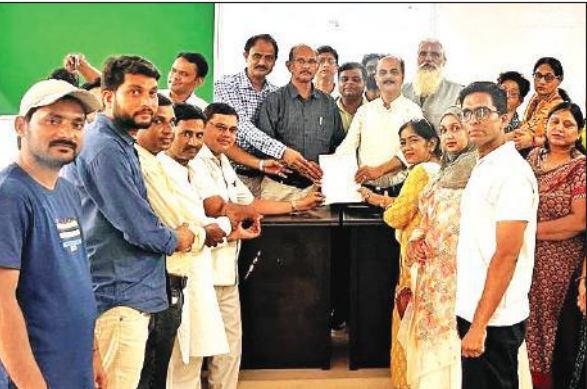
काशीपुर में बीईओ को ज्ञापन सौंपते निजी विद्यालय प्रबंधक संघ के पदाधिकारी।

शनिवार को बीआरसी में हुई बैठक में वक्ताओं ने कहा कि आरटीई के भुगतान में चार महीने का विलंब हो चुका है। जिसके