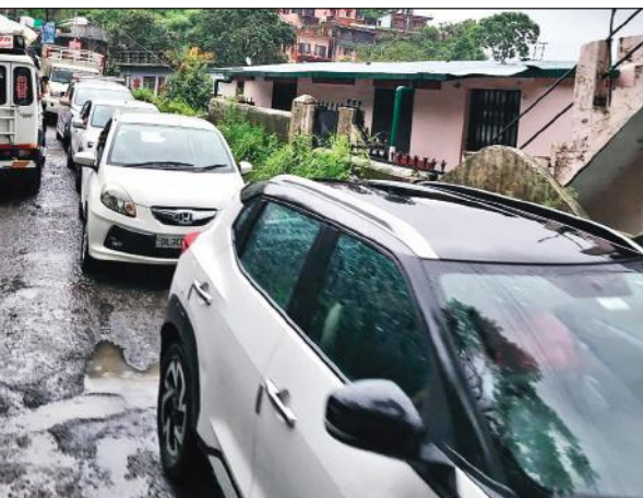
भीमताल रोड पर लगा जाम।