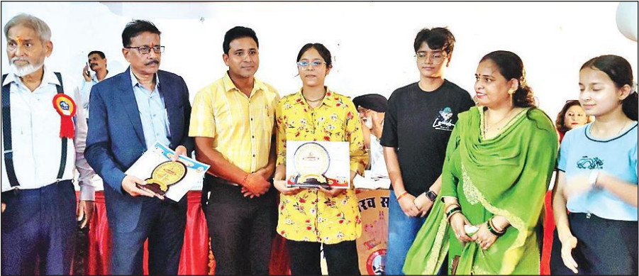
काशीपुर में आयोजित समारोह में मेधावी विद्यार्थियों को स्मृति चिह्न देते अतिथि व आयोजक।