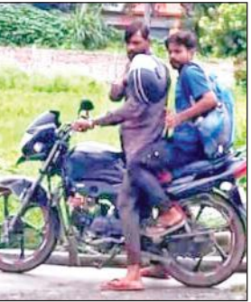
लोगों द्वारा लिया गया संदिग्धों का फोटो ।