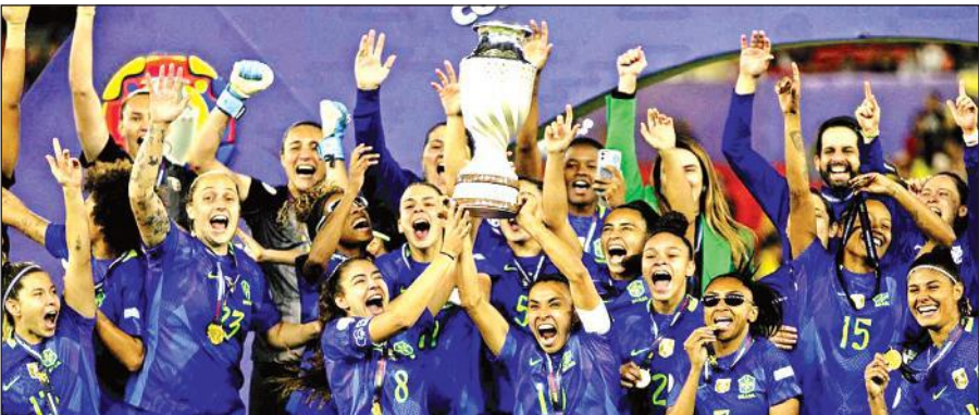
कोपा अमेरिका फेमिनिना खिताब जीतने के बाद ट्रॉफी के साथ जश्न मनाती ब्राजील की महिला फुटबॉल टीम।