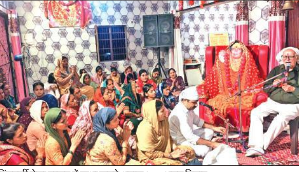
चित्तपूर्णी मेला उत्सव में कथा सुनते श्रद्धालु ।