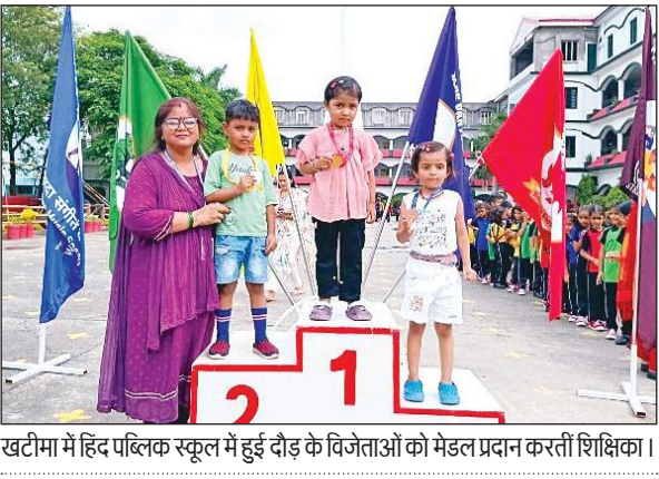
खटीमा में हिंद पब्लिक स्कूल में हुई दौड़ के विजेताओं को मेडल प्रदान करती शिक्षिका ।