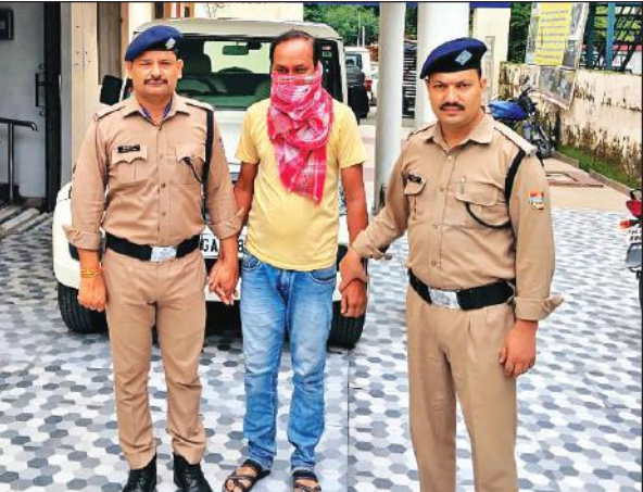
एसटीएफ द्वारा गिरफ्तार किया गया अंतर्राष्ट्रीय साइबर ठग।