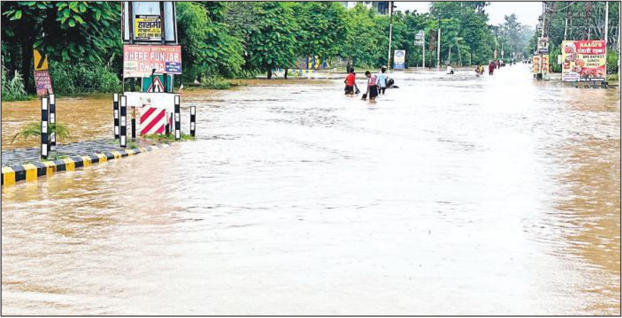
बाजपुर में नैनीताल मुख्य मार्ग पर लगभग दो किमी क्षेत्र में बहता लेवड़ा नदी की बाढ़ के पानी के बीच से गुजरते लोग । ● अमृत विचार

है। लोगों के घरों में पानी घुसने की बजह से लाखों का नुकसान होने की सूचना है। वही प्रशासन द्वारा नदियों में अधिक पानी आने के चलते लोगों को सजग रहने को कहा है। साथ ही सभी बाढ़