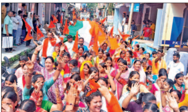
कालाढूंगी बाजार में निकाली गई यात्रा में शामिल सनातनी।