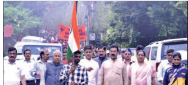
अल्मोड़ा में स्वतंत्रता दिवस पर बाजार में प्रभात फेरी निकालते स्थानीय नागरिक।

अमृत विचार : दिल्ली में आवारा कुत्तों के मुद्दे आए निर्णय को लेकर पशु प्रेमियों में खासी नाराजगी है। अल्मोड़ा में पशु प्रेमियों ने विरोध में कैंडल मार्च निकाल नाराजगी जताई। नगर के नंदादेवी मंदिर परिसर में