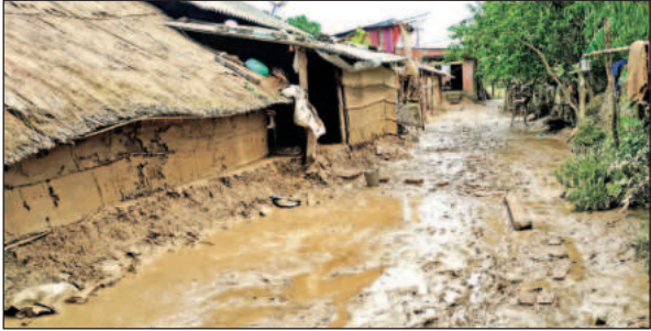
जल स्तर कम होने के बाद अस्त-व्यस्त नजर आया ग्रामीणों का आशियाना। ● अमृत विचार

अतिवृष्टि के चलते सुखी नदी ने रौद्र रूप धारण कर लिया था। यही नहीं जल प्रलय इतनी भयावह थी कि तटबंध को ध्वस्त हो गया। अचानक आई बाढ़ ने ग्रामसभा अरविंद नगर के गांव सात, आठ एवं नौ नंबर के साथ-साथ झाड़ी गांव को अपने चपेट में ले लिया जिससे देखते-देखते सैकड़ों घर जलमग्न हो गए। जब तक प्रशासन राहत एवं बचाव कार्य प्रारंभ करती तब तक लोग अपने-अपने आशियानों को