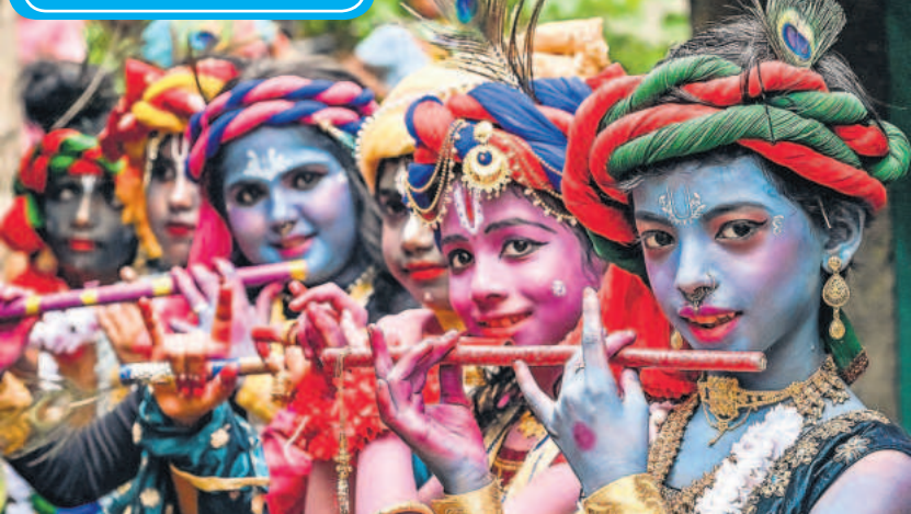
श्रीकृष्ण जन्मोत्सव पर शनिवार को पूरे देश में भवित का वातावरण नजर आया। पश्चिम बंगाल के शहर नादिया में शनिवार को जन्माष्टमी के अवसर पर भगवान कृष्ण की वेशभूषा में सजे युवा लड़के।