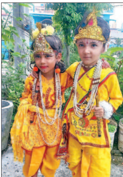
राधा-कृष्ण के रूप में सजे बच्चे।