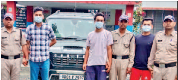
द्वाराहाट पुलिस की गिरफ्त में आरोपी।