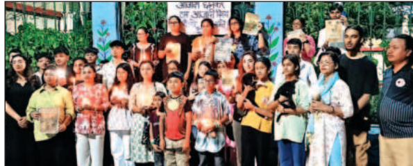
कैंडल मार्च निकालते पशुप्रेमी।