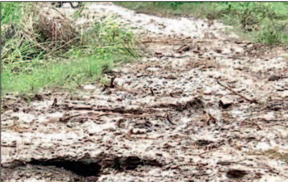
खटीमा के दाह ढाकी में क्षतिग्रस्त हुआ मार्ग। ● अमृत विचार

अनाज भी बाढ़ के भेंट चढ़ गया, अब उनके सामने खुद एवं परिवार का पेट कैसे भरें यह समस्या पहाड़ बनकर खड़ी है।