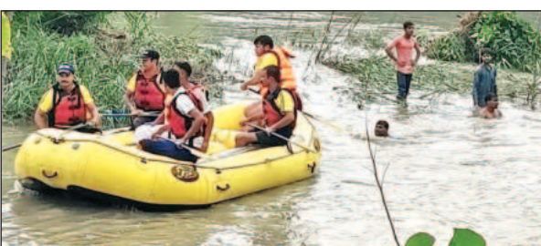
बाजपुर, घोघा नदी में बहे युवक की तलाश में जुटी एसडीआरएफ की टीम।