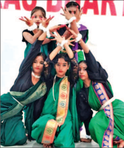
बाजपुर के विकास भारती स्कूल में नृत्य की मुद्रा में स्कूली बच्चे ।