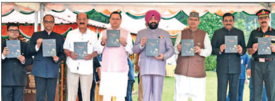
राजभवन में पुस्तक का विमोचन करते राज्यपाल गुरमीत सिंह और मुख्यमंत्री पुष्कर सिंह धामी।

इस दौरान उत्तराखंड सैनिक पुनर्वास संस्था द्वारा तैयार की गई कॉफी टेबल बुक "एक शाम सैनिकों के नाम" का भी विमोचन किया गया। कार्यक्रम में पूर्व मुख्यमंत्री भगत सिंह कोश्यारी, डॉ. रमेश पोखरियाल निशंक, कैबिनेट मंत्री गणेश जोशी, सुबोध उनियाल, सतपाल महाराज सहित सांसद, विधायक, वरिष्ठ प्रशासनिक अधिकारी मौजूद रहे।