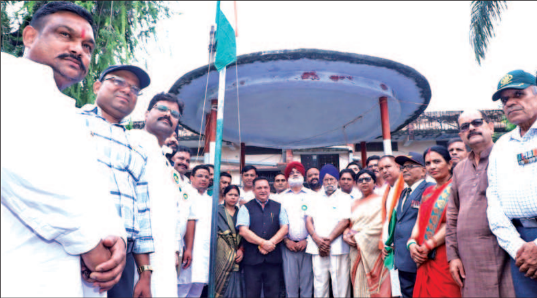
काशीपुर में स्वतंत्रता दिवस पर आयोजित कार्यक्रम में उपस्थित अतिथि । ● अमृत विचार