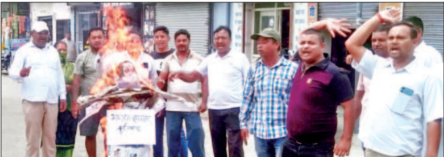
मुख्यमंत्री का पुतला दहन करते कांग्रेसी। ● अमृत विचार