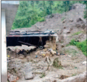
कौंता में मलबे में दफन हुआ घर, यहीं बंधे थे मवेशी।