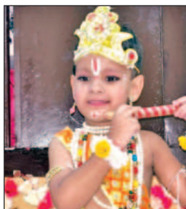
श्रीकृष्ण के वेश में सजा नन्हा बालक।