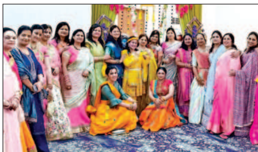
कार्यक्रम के दौरान मौजूद इनरव्हील क्लब की महिलाएं।