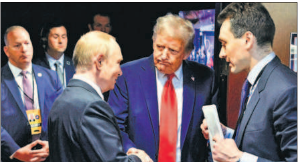
अलास्का में बैठक में बातचीत के बाद हाथ मिलाते ट्रंप और पुतिन।

ट्रंप अनेक बार यूक्रेन को अमेरिका का समर्थन मिलने पर एतराज जता चुके हैं और पुतिन की प्रशंसा जता चुके हैं। उन्होंने व्हाइट हाउस में वापसी के पहले ही दिन पूरे विश्वास