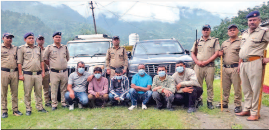
बेतालघाट में गोली चलाने के छह आरोपियों को पुलिस ने गिरफ्तार कर मीडिया के सामने पेश किया। ● अमृत विचार

05 लापता जिला पंचायत सदस्यों ने नहीं डाले मत