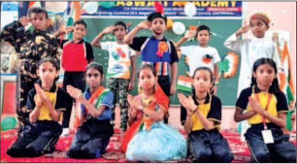
सांस्कृतिक कार्यक्रम प्रस्तुत करते सरस्वती एकेडमी के बच्चे ।