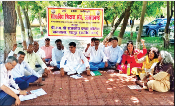
राजकीय इंटर कॉलेज बागवाला में धरना प्रदर्शन करते शिक्षक।

इसके अलावा प्रधानाचार्य सीधी भर्ती को निरस्त करने, अटल आदर्श विद्यालयों में पूर्व से कार्यरत और नवीन चयनित शिक्षकों के गुणांक समान करने और उन्हें स्थानांतरण प्रक्रिया में समान रूप से शामिल करने आदि की मांग उठा