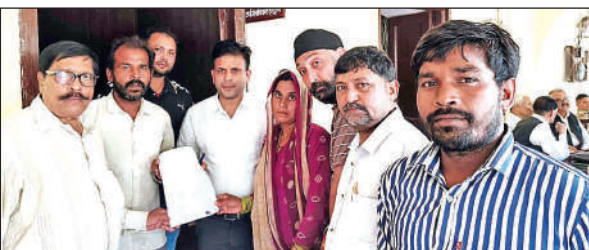
नृशंस हत्या की सीबीआई जांच की मांग को लेकर एसडीएम को ज्ञापन सौंपते लोग।