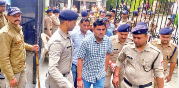
पांचों जिला पंचायत सदस्यों को पेशी के लिए हाईकोर्ट ले जाती पुलिस।