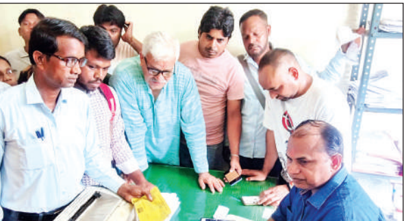
स्मार्ट मीटरों के बिल न मिलने पर आक्रोश जताते उपभोक्ता।

में काफी उत्साह देखने को मिला और युवा मतदाता ही निर्णायक भूमिका अदा भी करेगा।