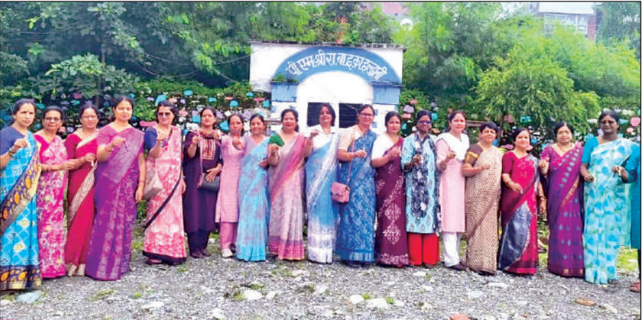
जेल रोड चौराहा हीरा नगर स्थित जीजीआईसी में चॉकडाउन हड़ताल के दौरान विरोध जताती शिक्षिकाएं।

वार्षिक स्थानांतरण प्रक्रिया 2025 को अविलंब शुरू करने जैसे मुद्दे शामिल हैं। राजकीय शिक्षक संघ उत्तराखंड की ओर से आहूत इस आंदोलन में जनपद के शिक्षक पूरे उत्साह और एकजुटता के साथ शामिल हुए। हड़ताल के पहले दिन सोमवार को सभी विद्यालयों में शाखा अध्यक्षों व मंत्रियों ने शिक्षकों के हस्ताक्षरयुक्त नोटिस प्रधानाचार्यों को सौंपे। इसके बाद शिक्षकों ने विरोध प्रदर्शन करते हुए फोटो और वीडियो सोशल मीडिया पर साझा किए। चॉकडाउन हड़ताल के कारण जिलेभर के 194 माध्यमिक स्कूलों के करीब 2360