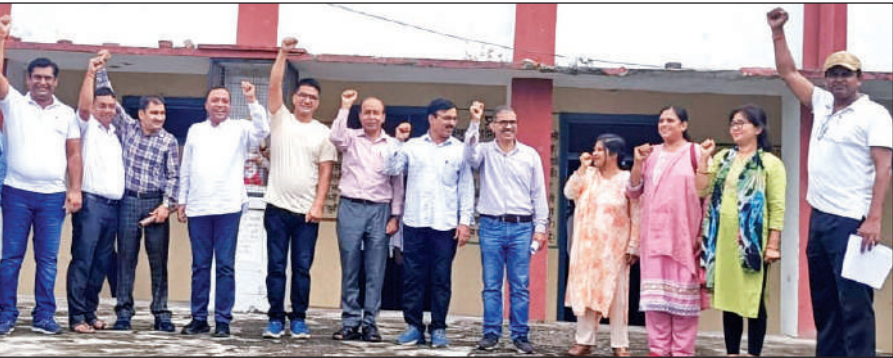
प्रांतीय राजकीय शिक्षक संघ के आवाह्न पर मांगों को लेकर प्रदर्शन करते शिक्षक।