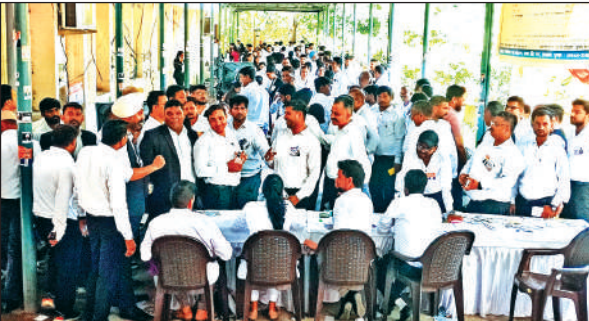
निर्वाचन प्रक्रिया के दौरान कोर्ट परिसर में लगी अधिवक्ताओं की भीड़।

सोमवार की सुबह नौ बजे से जिला जजी परिसर स्थित अधिवक्ता चैम्बर पर चहलकदमी प्रारंभ हुई। रव अधिवक्ता अपने-अपने प्रत्याशी के पक्ष में मतदान करने का आह्वान कर रहे थे। वहीं