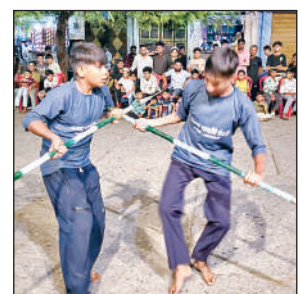
चेहल्लुम पर अखाड़े खेलते खिलाड़ी।