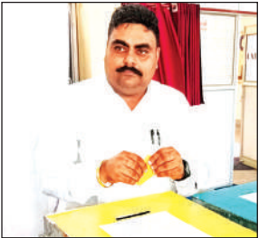
अपना वोट डालते कोषाध्यक्ष प्रत्याशी।

मतदाताओं ने अपने मतधिकार का प्रयोग किया। जिस कारण जिला बार एसोसिएशन का मतदान 94.70 फीसदी हुआ है। अब देखना यह है कि मंगलवार को होने वाले मतगणना प्रक्रिया में कौन अधिवक्ताओं का नेतृत्व करेगा। मुख्य चुनाव अधिकारी