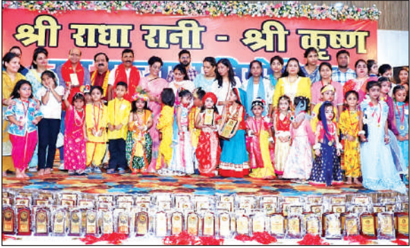
काशीपुर में प्रतियोगिता के बाद विजेता प्रतिभागी।