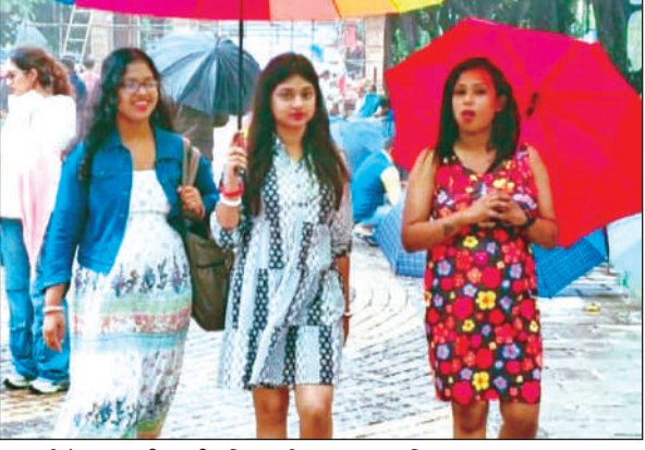
पंत पार्क में आवाजाही करती महिला पर्यटक। ● अमृत विचार

धराली आपदा के दौरान जिस तरह से नैनीताल के पर्यटन कारोबार को नुकसान हुआ था, उससे पर्यटन कारोबारियों में गहरी चिंता थी। कई होटल और गेस्ट हाउस सूने थे। कारोबारियों को इस