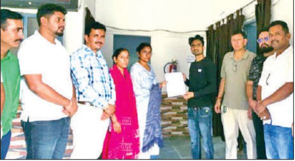
विद्युत वितरण उपखंड कार्यालय में कर्मचारी को ज्ञापन देते नागरिक।