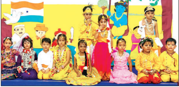
राधा-कृष्ण पर आधारित नाटक प्रस्तुत करते बच्चे। ● अमृत विचार

माउंट लिट्रा में कक्षा 3 और 2 के छात्रों ने ऑपरेशन सिंदूर पर प्रभावशाली प्रस्तुति दी। इसमें दिखाया गया कि सैनिकों ने किस प्रकार से शौर्य दिखाकर विजय का झंडा फहराया। छात्राओं ने देशभक्ति पर आधारित मनमोहक नृत्य प्रस्तुत किया। मुख्य आकर्षण आर्यप्रेशन सिंदूर पर आधारित नाट्य मंचन रहा। साथ ही सीनियर