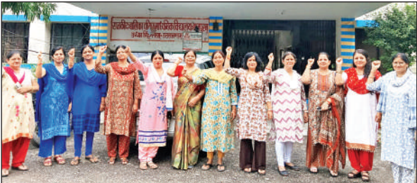
पीएमश्री जीजीआईसी बाजपुर में प्रदर्शन करती अध्यापिकाएं।