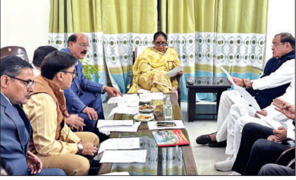
बैठक में मौजूद विस अध्यक्ष, संसदीय कार्य मंत्री, नेता प्रतिपक्ष एवं विधायक।

मानी जाती है और भविष्य में यह पृथ्वी से टकरा सकता है, लेकिन इस बार टकराने की कोई संभावना नहीं है। यह सुरक्षित पृथ्वी के नजदीक से होकर अपनी कक्षा में आगे बढ़ जाएगा। वैज्ञानिकों के अनुसार, इसके बाद 2029 में एपोफिस नामक क्षुद्रग्रह पृथ्वी के करीब पहुंचेगा। इस क्षुद्रग्रह के पृथ्वी से टकराने की आशंका बनी हुई थी, जिसकी नई गणना ने धरती से टकराने की संभावना से इंकार किया है। धरती के लिए खतरनाक माने जाने वाले क्षुद्रग्रहों की धरती में स्थापित दूरबीनों से निरंतर की जा रही है।