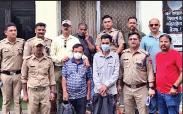
चरस तस्कर के साथ एएनटीएफ व टनकपुर पुलिस।