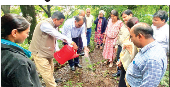
पौधरोपण करते प्रोफेसर व अन्य।