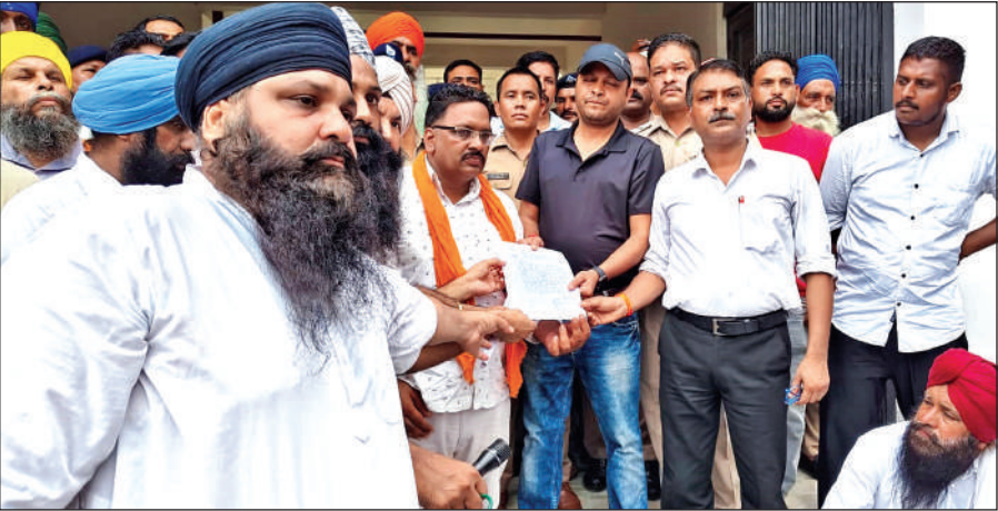
सितारगंज में उपजिलाधिकारी को ज्ञापन देते प्रत्याशी और समर्थक।