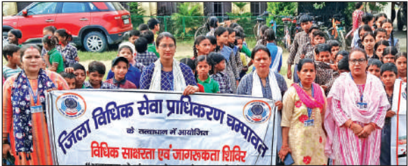
टनकपुर के आमबाग विद्यालय में शिविर के दौरान मौजूद विद्यार्थी व अन्य।