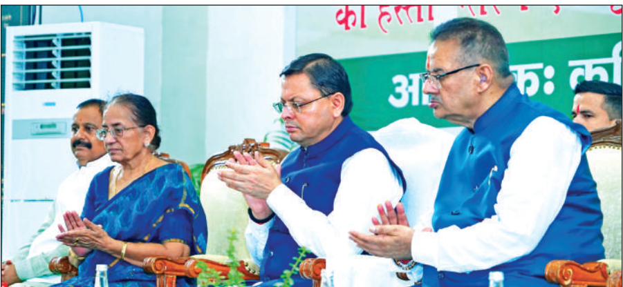
देहरादून में आयोजित कृषक संवाद कार्यक्रम में मौजूद मुख्यमंत्री पुष्कर सिंह धामी और कृषि मंत्री गणेश जोशी। ● अमृत विचार

प्रधानमंत्री ने शनिवार को वाराणसी से प्रधानमंत्री किसान सम्मान निधि की 20वीं किस्त के तहत देश के 9.71 करोड़ से अधिक किसानों के खातों में 20 हजार 500 करोड़ रुपये से अधिक की धनराशि का डिजिटल हस्तांतरण किया। उत्तराखंड के आठ लाख 28 हजार 787 लाभार्थी किसान परिवारों को 184.25 करोड़ रुपये की धनराशि हस्तांतरित की गई। सीएम ने गढ़ीकैट, देहरादून से इस