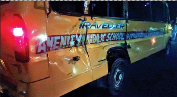
बाजपुर में ट्रक की टक्कर से क्षतिग्रस्त हुई स्कूल बस।