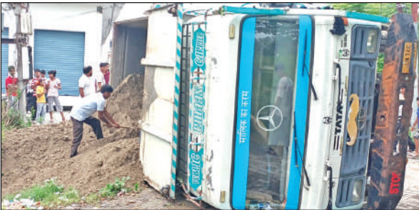
बाजपुर में बैक करते वक्त अनियंत्रित होकर पलटा खनन सामग्री से भरा डंपर।

में कोहराम मच गया। वहीं पुलिस ने तीनों क्षतिग्रस्त वाहनों को कब्जे में ले लिया है और पंचनामा भरकर दोनों शवों को पोस्टमार्टम के लिए भेज दिया। हादसे के बाद चालक वाहन छोड़कर फरार हुए कार सवार लोगों को पुलिस ने ग्रामीणों की मदद से पकड़ लिया है। फिलहाल अभी किसी की ओर से तहरीर प्राप्त नहीं हुई है। पुलिस अपने स्तर से मामले की जांच कर रही है।