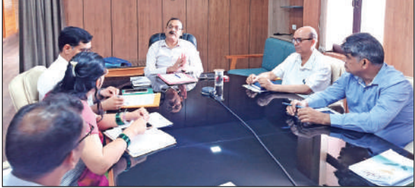
कलेक्ट्रेट में आयोजित बैठक के दौरान मौजूद जिलाधिकारी और अन्य। ● अमृत विचार