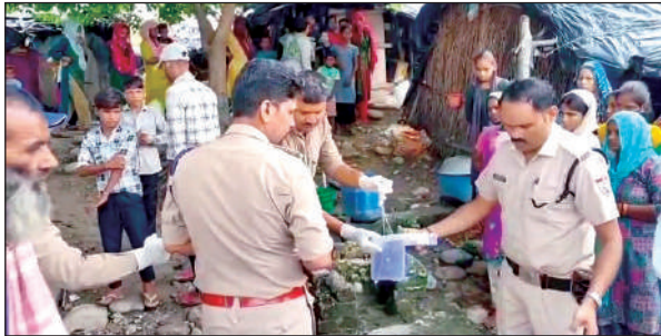
मौके पर जांच करती पुलिस।