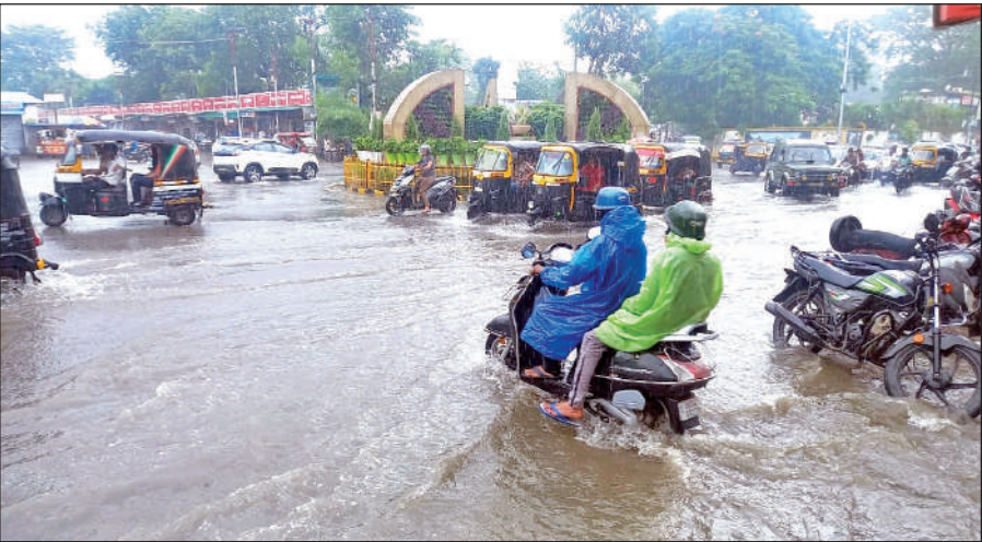
हल्द्वानी में बारिश के बाद तिकोनिया चौराहा पर बह रहा पानी।

अधिक ऊंचाई पर रहने लगे हैं। जिस कारण बारिश में कमी आना एक कारण है। साथ ही इस नगर के तापमान में भी उछाल आया है। अब इस वर्ष मानसून की अगस्त में की बारिश पर उम्मीद टिकी हुई है, जो जुलाई की वर्षा की भरपाई कर सकती है।