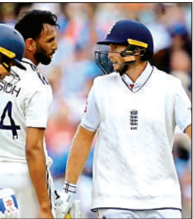
प्रसिद्ध कृष्णा व जो रूट।

■ लंदन : डेविड वार्नर ने कहा कि अगर इंग्लैंड को इस सर्दी में ऑस्ट्रेलिया में सफल होना है, तो जो रूट को अपने अगले पैर से सर्फबोर्ड हटाना होगा। 38 वर्षीय वार्नर, द हंड्रेड में लंदन स्पिरिट के साथ खेलने के लिए इंग्लैंड में हैं और हालांकि वह एक महीने के लिए लॉर्ड्स को अपना घर कहने के लिए उत्सुक हैं, पर वह अपने पूर्व एशोज प्रतिद्वंद्वियों पर कटाक्ष करने से खुद को नहीं रोक पाए। इंग्लैंड नवंबर में एशोज में ऑस्ट्रेलिया का सामना करेगा, जब वे 10 साल में पहली बार एशोज भूखला जीतने की कोशिश करेंगे। वार्नर ने बीबीसी स्पोर्ट से कहा इसमें सबसे बड़ा एंकर रूटी है, जिन्होंने अब तक ऑस्ट्रेलिया में शतक नहीं बनाया है।