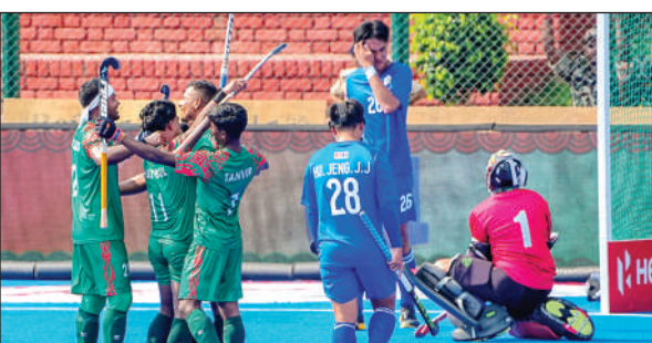
चीनी ताइपे के खिलाफ गोल करने के बाद जश्न मनाते हुए बांग्लादेश के खिलाड़ी।