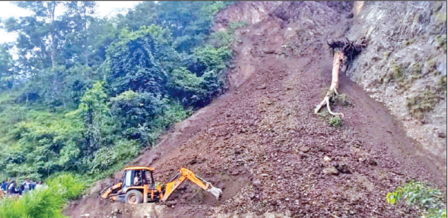
भीमताल-काठगोदाम मार्ग पर सलड़ी मल्ली के पास आया मलबा। ● अमृत विचार

अस्त-व्यस्त रहा। पानी की मोटरें न चल पाने से कई मोहल्लों में पानी की टंकियां खाली हो गईं। दोपहर तक घरों में पीने के पानी तक की किल्लत होने लगी। परीक्षा की तैयारी कर रहे छात्रों के लिए यह बिजली कटौती मुसीबत बन गई। लैपटॉप और मोबाइल चार्ज न हो पाने से ऑनलाइन