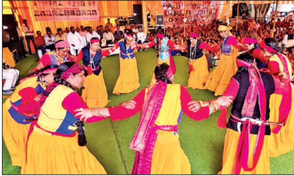
अल्मोड़ा में नंदादेवी मेले के तहत झोड़े की प्रस्तुति देती महिलाएं।