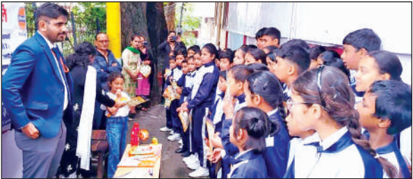
बच्चों को जानकारी देते विशेषज्ञ। ● अमृत विचार

अमृत विचार: इंडियन ऑयल के सहयोग से कुमाऊं मंडल विकास निगम की ओर से शनिवार को मल्लीताल स्थित नैनी पब्लिक स्कूल में जागरूकता अभियान चलाया गया। आयोजकों ने छात्र-छात्राओं, शिक्षकों और अभिभावकों को घरेलू गैस सिलेंडर के सुरक्षित उपयोग से संबंधित महत्वपूर्ण जानकारी दी। बच्चों को गैस के प्रयोग के दौरान बरती जाने वाली सावधानियों के बारे में विस्तार से बताया गया।