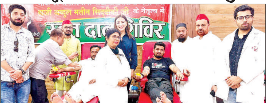
बनभूलपुरा में जश्न-ए-ईद मिलाद-उन-नबी के मौके पर रक्तदान करते लोग।