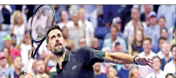
पीठ की समस्या से उबरते हुए शानदार प्रदर्शन करते हुए नोवाक जोकोविच।

सफर एलेना रयबाकिना से 6-1, 6-2 से हार के साथ समाप्त हुआ। गत चैंपियन एरिना सबालेका और 2024 की उपविजेता जेसिका पेगुला भी अगले दौर में जगह बनाने में सफल रही। पुरुष वर्ग में अमेरिका के खिलाड़ियों का प्रदर्शन अच्छा नहीं रहा तथा नंबर छह बेन शेल्टन और नंबर 17 फ्रांसेस टियाफो दोनों को हार का सामना करना पड़ा।