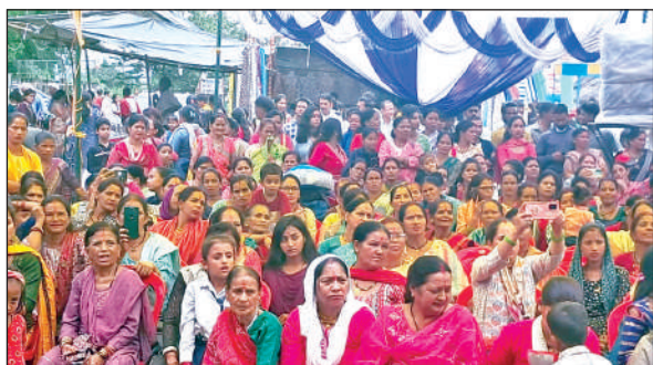
ज्योलीकोट गणेश महोत्सव में सांस्कृतिक कार्यक्रम का आनंद लेते श्रद्धालु।