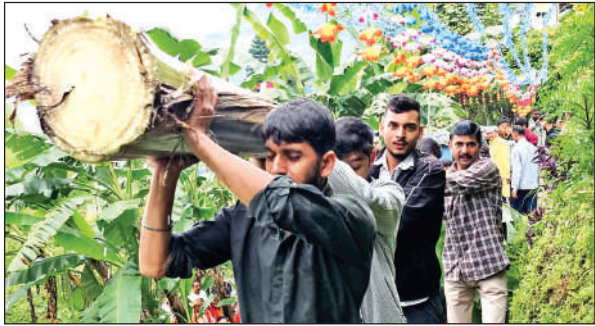
अल्मोड़ा में मां नंदा सुनंदा की मूर्ति निर्माण को कदली वृक्ष के खाम को लाते श्रद्धालु।