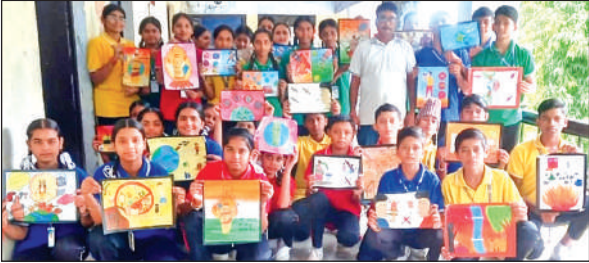
खटीमा के आरएनवी में नशामुक्ति पर आयोजित प्रतियोगिता में अपने चित्रों के साथ बच्चे।