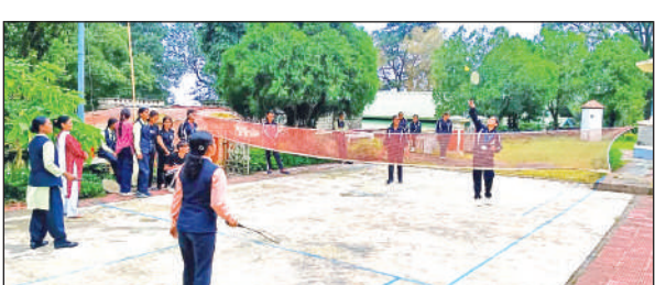
हरमन माइनर डिग्री कॉलेज में बैडमिंटन प्रतियोगिता में भागीदारी करती छात्राएं।

कार्य किया जा रहा है। लंबे समय से शहर की सारी सड़क खोद दी गई है, परंतु उनमें पाइपलाइन बिछा कर उन्हें बंद करने की जहमत नहीं उठाई गई है। जिसके चलते आपदिन दोपहिया वाहन चालक उक्त गड्ढों में गिरकर चोटिल हो रहे हैं। साथ ही शहर में कई स्थानों पर बड़े-बड़े गड्ढे खोदकर डाल दिए गए हैं, जहां आवाजा पशु भी गिर रहे हैं। आरोप लगाया कि गत दिवस जल निगम के कर्मचारियों ने वार्ड नंबर