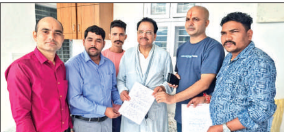
सांसद को ज्ञापन देते धारी ब्लॉक के ग्रामीण। ● अमृत विचार

ज्ञापन में बताया गया कि धारी ब्लॉक के बबियाड क्षेत्र का गैराखाड़ से कैलाश द्वार तक का मार्ग पिछले 15 वर्षों से जर्जर पड़ा हुआ है जिस कारण आवाजाही बंद हो चुकी है।