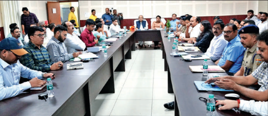
अधिकारियों के साथ बैठक करते राज्य आपदा प्रबंधन सलाहकार समिति के उपाध्यक्ष डॉ. विनय कुमार रुहेला ।

अमृत विचार: उत्तराखंड राज्य आपदा प्रबंधन सलाहकार समिति के उपाध्यक्ष डॉ. विनय कुमार रुहेला अपने एक दिवसीय जनपद भ्रमण के दौरान जिला आपदा प्रबंधन कार्यालय कलेक्ट्रेट परिसर पहुंचे। यहां उन्होंने परिसर में एक पेड़ मां के नाम अभियान के तहत लीची का पौधा रोपा। उन्होंने जनपद में आपदा प्रबंधन कार्यों की विभागावार विस्तृत समीक्षा की। शनिवार को समीक्षा के दौरान