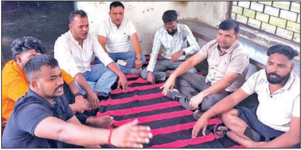
जल संस्थान कार्यालय के समक्ष धरना देते सभासद व अन्य। ● अमृत विचार

कार्य किया जा रहा है। लंबे समय से शहर की सारी सड़क खोद दी गई है, परंतु उनमें पाइपलाइन बिछा कर उन्हें बंद करने की जहमत नहीं उठाई गई है। जिसके चलते आपदिन दोपहिया वाहन चालक उक्त गड्ढों में गिरकर चोटिल हो रहे हैं। साथ ही शहर में कई स्थानों पर बड़े-बड़े गड्ढे खोदकर डाल दिए गए हैं, जहां आवाजा पशु भी गिर रहे हैं। आरोप लगाया कि गत दिवस जल निगम के कर्मचारियों ने वार्ड नंबर