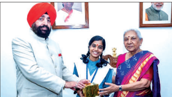
छात्रा का सम्मान करते राज्यपाल गुरमीत सिंह और राज्यपाल आनंदीबेन पटेल।

लालकुआ: पूर्वोत्तर रेलवे इज्जतनगर मंडल प्रशासन ने त्योहारों पर यात्रियों की अतिरिक्त भीड़ को देखते हुए लालकुआं से राजकोट के बीच विशेष गाड़ियों का संचालन करने का निर्णय लिया है। रेलवे के अनुसार 05045 लालकुआं-राजकोट त्योहार विशेष गाड़ी लालकुआं से 07 से 14 सितंबर तथा 12 अक्टूबर से 2 नवंबर तक कुल 6 फेरों के लिए प्रत्येक रविवार को चलेगी। वहीं, वापसी में 05046 राजकोट-लालकुआं विशेष गाड़ी राजकोट से 8 से 15 सितंबर 2025 व 13 अक्टूबर से 3 नवंबर तक 6 फेरों के लिए प्रत्येक सोमवार को संचालित होगी। यह गाड़ी लालकुआं, किच्छा, बहेड़ी, भोजीपुरा, इज्जतनगर, बरेली सिटी, बरेली जं., बदायूं, कासगंज, हाथरस सिटी, मथुरा, भरतपुर, जयपुर, जोधपुर, समदड़ी समेत कई अन्य स्टेशनों पर रुकेगी।