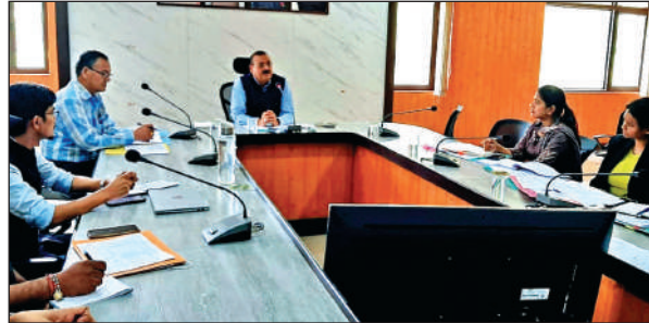
तहसीलदार व नायब तहसीलदारों को बैठक में निर्देश देते जिलाधिकारी अल्मोड़ा।

कलक्ट्रेट सभागार में आयोजित बैठक में डीएम ने कहा कि आपदा की किसी भी स्थिति में रिस्पांस