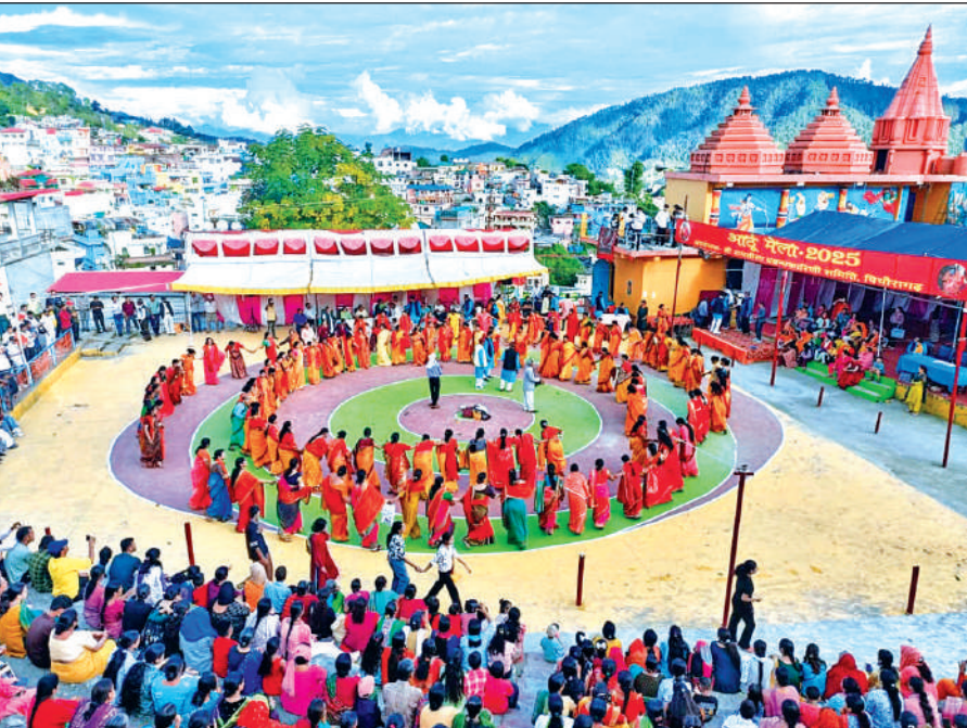
पिथौरागढ़ के रामलीला मैदान में सातूं-आठूं महोत्सव पर झोड़ा-चांचरी लगाती महिलाएं।