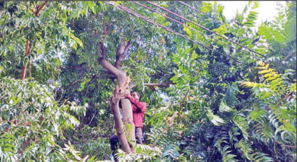
पेड़ों की टहनियों की लॉपिंग-चॉपिंग करता बिजली विभाग का कर्मचारी।

बिजली कटौती का असर कालाढूंगी चौराहा सब स्टेशन से जुड़े बरेली रोड फीडर, आजाद नगर फीडर, रामपुर रोड फीडर और बाजार फीडर पर पड़ा। इनसे जुड़े क्षेत्र इन्द्रा नगर, बड़ी रोड, गौजाजाली, शनि बाजार, गल्ला मंडी, उजाला नगर, धान मिल, नई बस्ती, ममूर विहार, जोशी