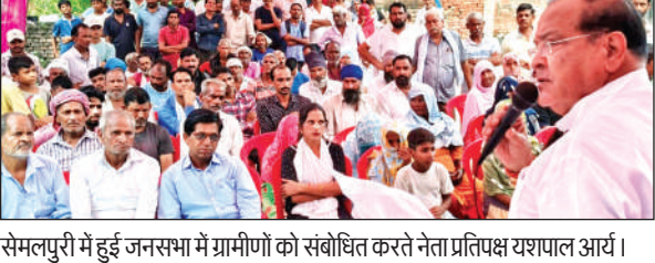
सेमलपुरी में हुई जनसभा में ग्रामीणों को संबोधित करते नेता प्रतिपक्ष यशपाल आर्य।