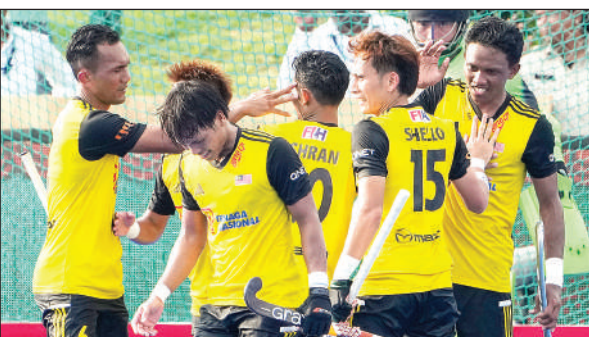
कोरिया के खिलाफ जीत दर्ज करने के बाद जश्न मनाते मलेशियाई खिलाड़ी।

बहुत खुश हूं। सात्विक और चिराग ने 2022 में इस टूर्नामेंट में कांस्य पदक जीता था और इस तरह से उनका विश्व चैंपियनशिप में यह दूसरा पदक होगा। इससे 2011 में ज्वाला गुट्टा और अश्विनी पोनप्पा के कांस्य पदक जीतने के बाद से भारत का प्रत्येक विश्व चैंपियनशिप में पदक जीतना भी सुनिश्चित हो गया। एशियाई खेलों के चैंपियन का अगला मुकाबला चीन की 11वीं वरीयता प्राप्त जोड़ी चैन बो यांग और लियू यी से होगा। यह पूछे जाने पर कि क्या चीनी टीम अंडरडॉग होगी, सात्विक ने कहा बिल्कुल नहीं। सेमीफाइनल खेल रहे हैं, कोई अंडरडॉग नहीं है। कुछ ही घंटे पहले पीवी सिंधू के क्वार्टर फाइनल में बाहर होने से भारत महिला एकल में पदक से वंचित रह गया था। जब सात्विक और चिराग कोर्ट पर उतरे तो उन पर उम्मीदों का बोझ साफ दिख रहा था।