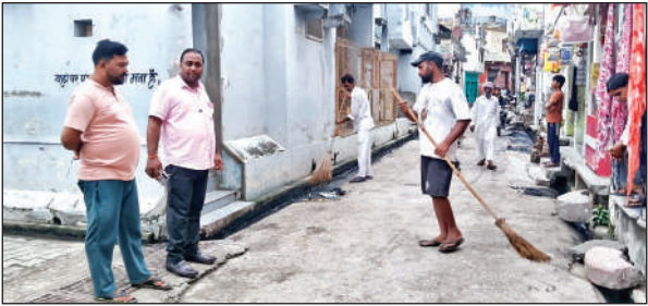
सुल्तानपुर पट्टी में सफाई अभियान चलते नगर पंचायत चेयरमैन ।