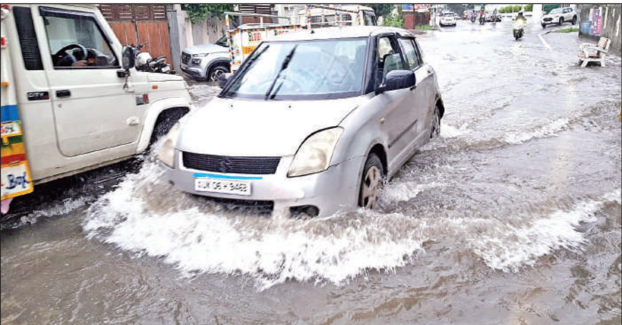
हल्द्वानी में सोमवार को हुई बारिश के दौरान कालाढूंगी सड़क में भरा पानी। ● अमृत विचार

नगर निगम व अन्य विभागों ने मानसून के पहले से ही नालों की सफाई करना शुरू कर दिया था इसके बावजूद हल्द्वानी में सोमवार को अपराह्न के समय डेढ़ घंटा तेज बारिश हुई और नैनीताल रोड, कालाढूंगी रोड, नवाबी रोड, नहर कवरिंग रोड आदि पर पानी भर जाने से लोगों का चलना भी मुश्किल हो गया। सत्यनारायण मंदिर के पास इतना जलभराव था कि बाइकों के आधे पहिए उसमें डूब गए। गड्डों की वजह से लोगों को चलने में डार लगने लगा। कई दोपहिया वाहनों के इग्निशन प्लग व साइलेंसर में पानी घुसने से बाइक बंद हो गईं। इसी तरह नवाबी रोड पर भी यही हाल था। नैनीताल रोड पर तिकोनिया के पास जलभराव हो गया और सड़क पर पानी दौड़ता नजर आया। कालाढूंगी रोड पर सड़क के एक तरफ यही हाल था। वहां भी आधे से ज्यादा सड़क जलमग्न हो गईं। गलियों में भी यही हाल था। राहत रही कि शाम