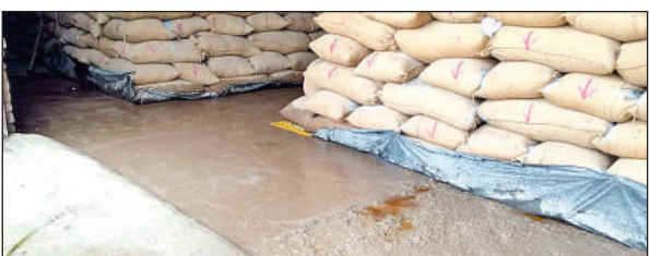
एग्रो सीड के गोदाम में घुसा पानी व मलबा। ● अमृत विचार