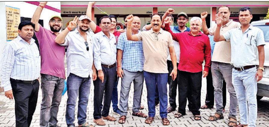
खटीमा में वेतन रोके जाने पर शिक्षा विभाग के खिलाफ प्रदर्शन करते शिक्षक। ● अमृत विचार

अमृत विचार: उत्तरांचल स्टेट प्राइमरी टीचर्स एसोसिएशन ने शिक्षकों का वेतन रोके जाने पर शिक्षा विभाग के खिलाफ जमकर नारेबाजी करते हुए प्रदर्शन किया। उन्होंने विभाग पर शिक्षकों का उत्पीड़न करने का आरोप लगाया। शिक्षकों की लगातार दो चुनाव इयूटियों के चलते पीएम पोषण योजना का एसएमएस नहीं भेजा जा सका था जिसके कारण उनका वेतन रोक दिया गया है। खंड शिक्षा अधिकारी के आश्वासन के बाद शिक्षक शांत हुए। एसोसिएशन के बैनर तले प्रदर्शन करते हुए शिक्षकों ने कहा पंचायत चुनाव में शिक्षक-शिक्षिकाओं की इयूटी 24 और 28 दोनों चरणों का मतदान कराने