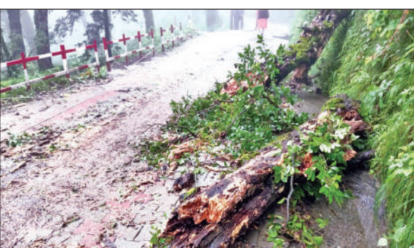
नैनीताल में भारी बारिश के बीच बिड़ला मार्ग पर गिरा पेड़।