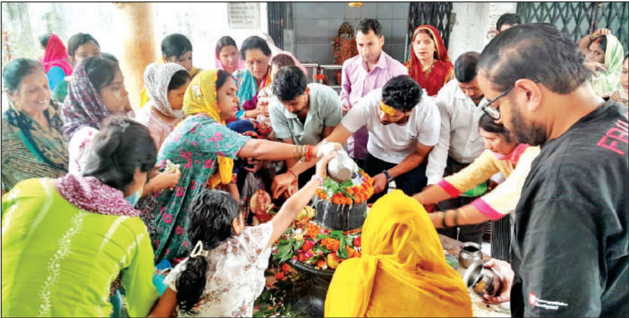
रुद्रपुर के शिव मंदिर में जलाभिषेक कर ते बाबा के भक्त । ● अमृत विचार

उधर, शक्तिफार्म में भी सावन के अंतिम सोमवार को क्षेत्र के शिवालयों में शिव भक्त जलाभिषेक के लिए उमड़ पड़े। तारकेश्वर धाम सुरेंद्रनगर में मंदिर कमेटी द्वारा चाक चौबंद व्यवस्था की गई।