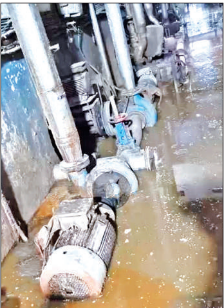
बाजपुर में जलमग्न पीएसपी पेपर का कारखाना।