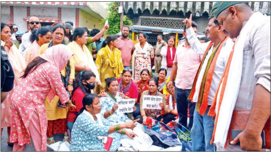
योगा ट्रेनर की मौत के मामले को लेकर सोमवार को सड़क पर बैठकर धरना-प्रदर्शन करते लोग।