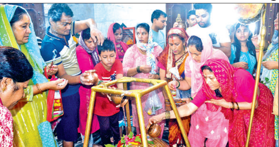
सावन के अंतिम सोमवार को सिद्धेश्वर महादेव मंदिर में जलाभिषेक करते श्रद्धालु।

पीपलेश्वर महादेव मंदिर, प्राचीन शिव मंदिर समेत शहर के अन्य प्रमुख शिवालयों में श्रद्धालुओं ने गंगाजल, दूध, बेलपत्र, धतूरा और भांग से शिवविंजण का जलाभिषेक कर विशेष पूजन किया। इस दौरान श्रद्धालुओं ने कतारों में लगकर