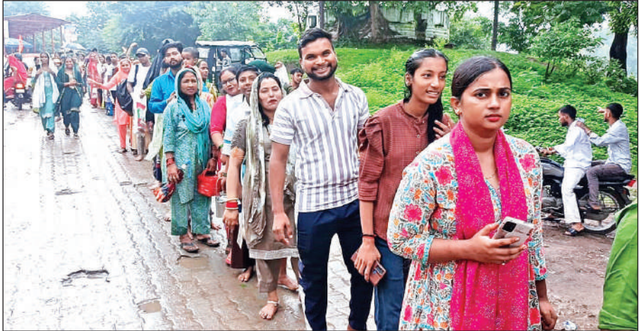
काशीपुर में जलाभिषेक के लिए मंदिर के बाहर लाइन में लगे श्रद्धालु ।