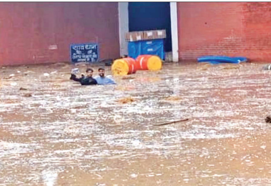
बाजपुर में जलमग्न पीएसवी पेपर में जमा चार फीट पानी से बमुश्किल निकलते श्रमिक।