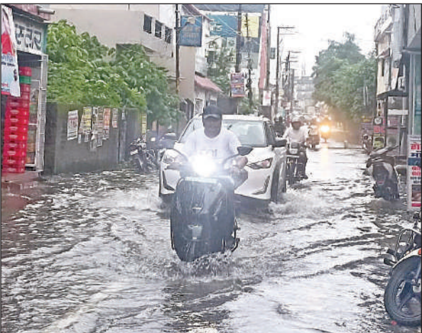
हल्द्वानी में सोमवार की तेज बारिश के दौरान नवाबी रोड में भरा पानी।