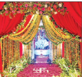
शेष नाग पर विराजमान महादेव की झांकी।

इस दौरान बाहर से आए गायक कलाकारों ने भजनों से माहौल को भक्तिमय बना दिया। उसके पश्चात नृत्य झांकियों ने