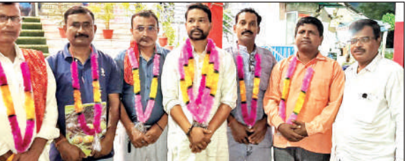
शक्तिफार्म में मनोनीत शारदीय दुर्गा पूजा कमेटी के पदाधिकारी । ● अमृत विचार

टैगोरनगर में 28 सितंबर से 2 अक्टूबर तक पांच दिवसीय शारदीय दुर्गा पूजा महोत्सव के दृष्टिगत, सफल आयोजन के लिए