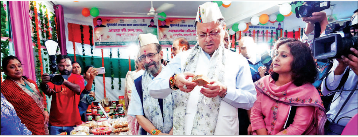
महिला स्वयं सहायता समूहों द्वारा लगाए गए स्टॉलों पर उत्पाद का अवलोकन करते मुख्यमंत्री धामी।

हमारी सरकार ने ‘उत्तराखंड राज्य ग्रामीण आजीविका मिशन’ के अंतर्गत प्रदेश की महिलाओं को स्वयं सहायता समूहों से जोड़कर उन्हें संगठित करने का काम किया है, ताकि उनके जीवन में आत्मविश्वास, आत्मनिर्भरता और गरिमा का नया अध्याय जुड़ सके। आज राज्य में 68 हजार स्वयं सहायता समूह (एसएचजी) बनाकर लगभग 5 लाख महिलाएं संगठित होकर अपना व्यवसाय कर रही हैं। 7 हजार से अधिक ग्राम्य संगठन और 500 से अधिक क्लस्टर संगठनों के माध्यम से राज्य की महिलाएं सामूहिक नेतृत्व की एक अद्वितीय मिसाल पेश कर रही हैं। राज्य के 95 विकासखंडों से विभिन्न महिला स्वयं सहायता समूहों से संवाद में सीएम धामी ने कहा कि, हमने वर्ष 2023 में