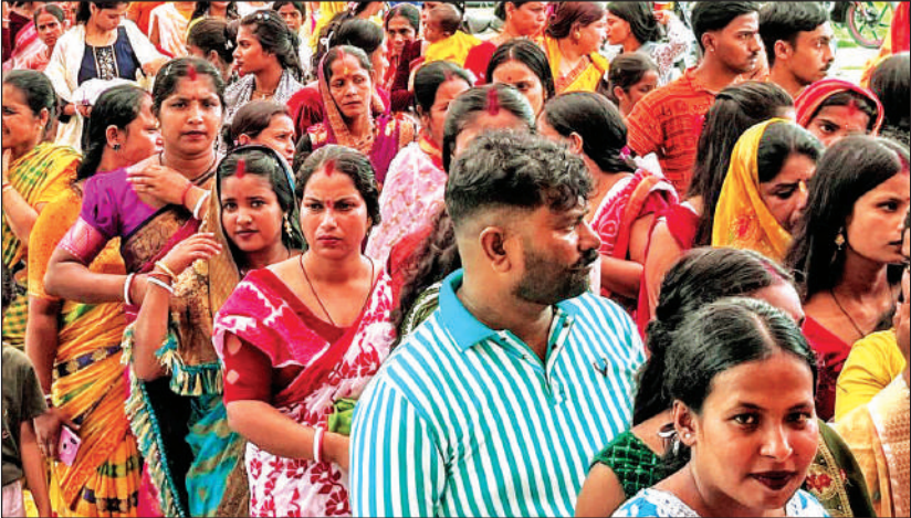
शक्तिफार्म में सुरेंद्र नगर के तारकेश्वर धाम में जलाभिषेक के लिए कतार में खड़े शिवभक्त । ● अमृत विचार