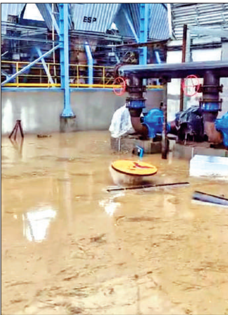
पीएसवी पेपर मिल की मशीनों में भरा पानी।