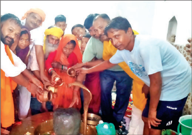
दिनेशपुर के प्राचीन शिव मंदिर रामबाग में जलाभिषेक करते मंदिर के पुजारी व कांवड़िए ।