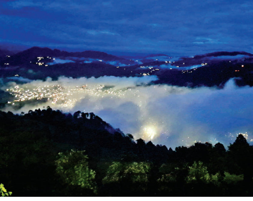
बागेश्वर : देवभूमि में कुदरत के अद्भुत नजारे देखने को मिलते हैं। बागेश्वर घाटी में सोमवार को मौसम साफ रहा तो शाम को बरसात के बाद कोहरा लग गया। जौलकांडे गांव से बागेश्वर बाजार का मनोहारी दृश्य इस प्रकार रहा।

देहरादून, अमृत विचार: मुख्यमंत्री ने सोमवार को सचिवालय में फिल्म बौल्या काका के पोस्टर का विमोचन किया। इस फिल्म में मुख्य भूमिका में बॉलीवुड अभिनेता हेमंत पांडेय नजर आएंगे। फिल्म की शूटिंग राज्य के खूबसूरत और सुदूर गांवों जैसे-ग्वालदाम, थराली, तलवाड़ी में की गई है। मुख्यमंत्री तथा फिल्म की टीम के बीच राज्य में फिल्म निर्माण के अवसर, सम्भावनाओं तथा राज्य सरकार द्वारा फिल्म निर्माताओं को दिए जा रहे प्रोत्साहन व इस क्षेत्र में की गई पहल पर चर्चा हुई। मुख्यमंत्री ने कहा कि राज्य सरकार ने ‘उत्तराखंड नई फिल्म नीति’ लागू की है। सरकार का मुख्य उद्देश्य राज्य में फिल्म निर्माण को प्रोत्साहित करना, युवाओं को रोजगार के अवसर देना और पर्यटन को नई उड़ान देना है।