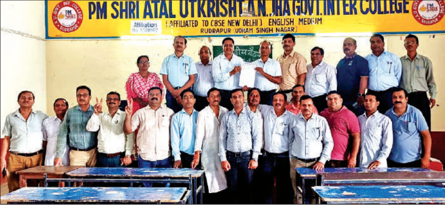
बैठक के बाद मांग पत्र दिखाते शिक्षक।