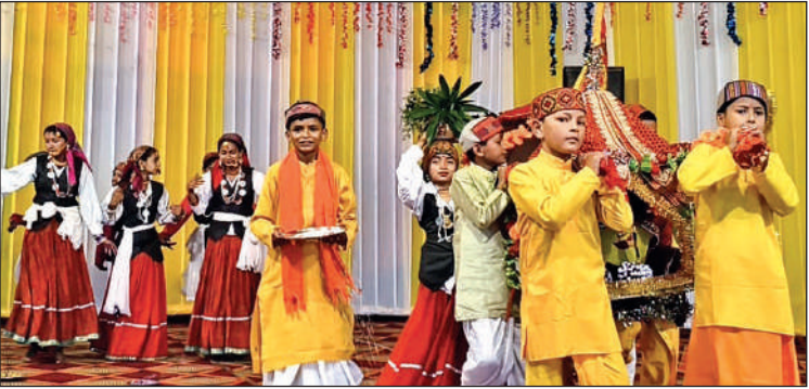
देवीधुरा में सांस्कृतिक कार्यक्रम प्रस्तुत करते बच्चे। ● अमृत विचार

लिए सेक्टर मजिस्ट्रेटों की नियुक्ति की गई है, ताकि निगरानी व्यवस्था प्रभावी रहे। वर्षा ऋतु को देखते हुए जल निकासी को सुचारु बनाए रखने के लिए नालियों की सफाई, सुरक्षा दीवारों का निर्माण एवं पानी की निकासी की विशेष व्यवस्था की गई है। मंदिर समिति की ओर से डीएम को स्मृति चिन्ह और अभिनंदन पत्र भेंट कर सम्मानित किया गया। कार्यक्रम के दौरान छात्र-छात्राओं द्वारा रंगारंग सांस्कृतिक प्रस्तुतियों ने सभी उपस्थितजनों को मंत्रमुग्ध