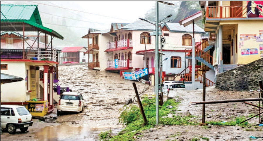
बादल फटने के बाद जल प्रलय आया और कई मकानों तक पहुंच गया, अचानक बाढ़ के कारण आंशिक रूप से जलमग्न हुए घर।

मंगलवार दोपहर करीब 1:50 बजे खीर गाढ़ में अतिवृष्टि के बाद नदी ने भारी जल सैलाब और मलबे के साथ ऐसा तांडव मचाया कि पर्वतीय अंचल में बसा खूबसूरत धराली क्षेत्र और उसका बाजार देखते ही देखते जल समाधि ले गया। इस प्राकृतिक आपदा का खौफनाक वीडियो सोशल मीडिया प्लेटफार्मस पर तेजी से वायरल हो गया। ऊपर से आ रहा जलसैलाब इतनी तीव्र गति से आ रहा था कि लोगों को बचाव का मौका तक नहीं मिला और सैलाब जान बचाते लोगों के साथ मकान, दुकान, होटल, पेड़ जो भी बीच में आया उसे अपने आगोश में लेते हुए गुजर गया। इस