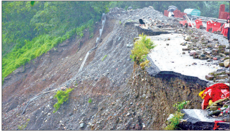
बारिश के बाद क्षतिग्रस्त बनभूलपुरा रेलवे क्रॉसिंग के आगे स्टैंडियम को जाने वाली सड़क । ● अमृत विचार

जारी रहेगा। बारिश की वजह से हल्द्वानी में पारे में बहुत गिरावट आई है। पहाड़ों में भी मूलसाधार बारिश की वजह से पारे में काफी गिरावट आई है। मुन्तेश्वर में पारा 18.5 डिग्री रहा है।