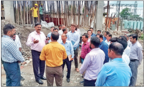
हेमपुर डिपो स्थित नेपा फार्म में निरीक्षण करते पिटकुल के प्रबंध निदेशक।