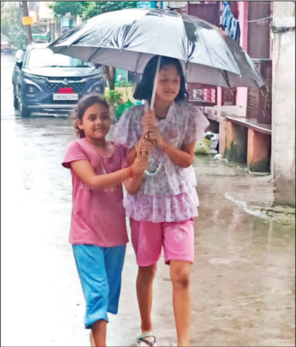
बारिश में छाता लगाकर निकलते बच्चे। ● अमृत विचार

वहीं जिले की नदियां भी अभी शांत बहाव में बह रही हैं। प्रशासन द्वारा जारी रिपोर्ट के अनुसार जसपुर में 20 एमएम, काशीपुर में 70 एमएम, बाजपुर में 04 एमएम, गदरपुर में 05 एमएम, रुद्रपुर में 03 एमएम, किच्छा में 20 एमएम, सितारगंज में 29 एमएम और किच्छा में 28