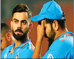
विराट कोहली व रोहित शर्मा।

वाशिंगटन सुंदर कभी जिम्मेदारी से पीछे नहीं हटे। यशस्वी ने जरूरत पड़ने पर योगदान दिया, आकाश दीप और प्रसिद्ध कृष्णा प्रभावी नजर आए और साई सुदर्शन ने अपनी दीर्घकालिक उपस्थिति का झलक दिखाई। लेकिन इस शानदार प्रयास का एक ओर आयाम भी है। इससे सवाल उठता है कि टी20 और टेस्ट क्रिकेट से संन्यास लेने वाले विराट