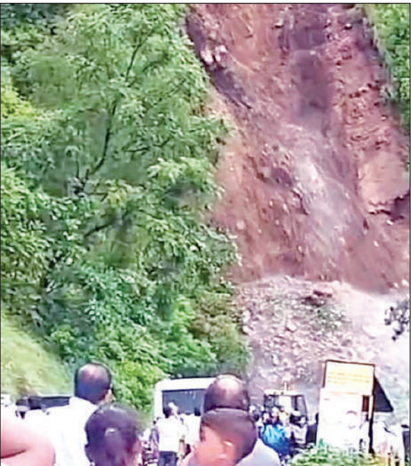
बाल्दियाखान हनुमान मंदिर के पास पहाड़ी से हुआ भूस्खलन । ● अमृत विचार

बारिश के कारण लगातार हो रहे भूस्खलनों ने नैनीताल और आसपास के क्षेत्रों में जनजीवन को प्रभावित किया है। बाल्दियाखान, ज्योलीकोट, बेलुवाखान और बल्दियाख जैसे संवेदनशील इलाकों में भी मलबा