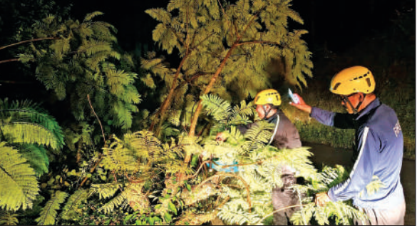
पेड़ को हटाकर यातायात सुचारु कराते फायर कर्मी। ● अमृत विचार

अमृत विचार : अल्मोड़ा-रानीखेत राष्ट्रीय राजमार्ग के जीबी पंत संस्थान कोसी के पास बीते सोमवार देर शाम एक विशालकाय पेड़ गिर गया। पेड़ गिरने से दोनों ओर से वाहनों की आवाजाही बाधित हो गई। लोग घंटों तक लोग जाम में फंसे रहे। सूचना के बाद मौके पर पहुंची फायर सर्विस की टीम ने कड़ी मशक्कत के बाद पेड़ को हटाकर यातायात सुचारु कराया। मिली