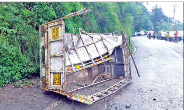
पहाड़ी से पिकअप वाहन में गिरे बोल्टर, वाहन क्षतिग्रस्त । ● अमृत विचार

नैनीताल : सरोवर नगरी में मंगलवार को रुक-रुक कर वर्षा का क्रम जारी । शाम को कुछ देर बारिश का रुख हल्का रहा तो देर शाम को पुनः तेज बारिश का दौर रहा । दिन में 15 मिमी वर्षा रिकॉर्ड की गई है । नगर में सुबह से ही वर्षा का क्रम शुरू हो गया था, जो रुक कर कर पुरे दिन जारी रहा । 10 बजे से 12 बजे के बीच थोड़ा राहत मिली, लेकिन उसके बाद कुछ देर विराम देने के बाद वर्षा जारी रही । जिसका सामान्य जनजीवन पर बुरा असर पड़ा है । इधर नैनी झील का जलस्तर 83.2 फीट पार कर गया है । जीआईसी मौसम विज्ञान केंद्र के अनुसार अधिकतम तापमान 26 व न्यूनतम 22 डिग्री सेल्सियस रहा । बारिश 15 मिमी हुई है ।