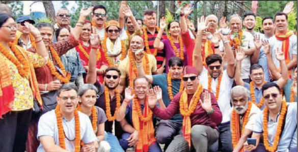
पिथौरागढ़ पहुंचा श्रद्धालुओं का दल।