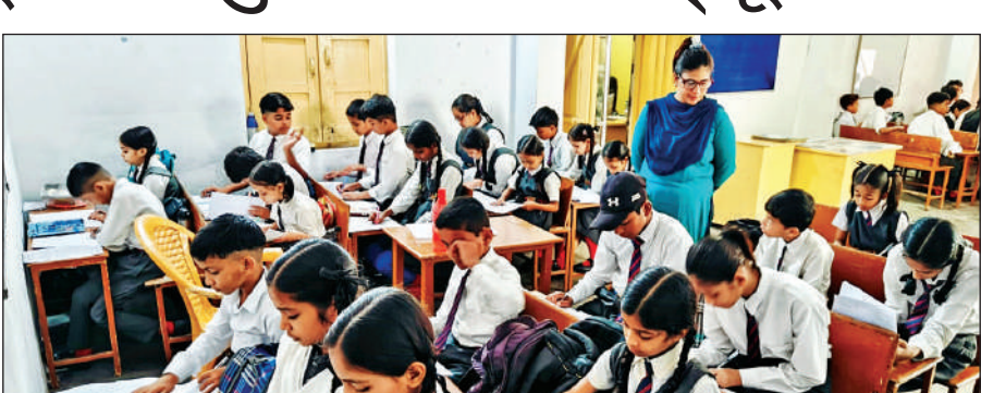
खटीमा के शाहजी पब्लिक स्कूल में टेस्ट देते बच्चे।