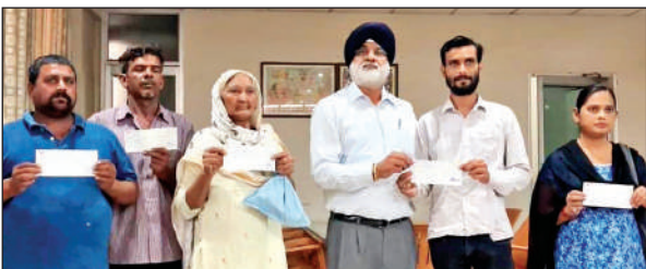
जरूरतमंदों को चेक वितरित करते विधायक चीमा।