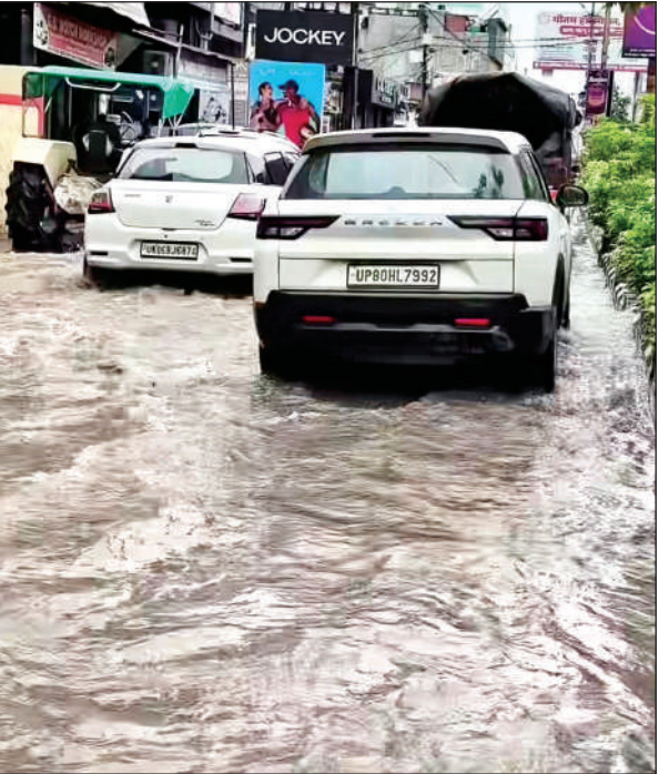
शहर में हुए जलभराव से गुजरते वाहन।

बारिश हुई है। वहीं कुछ नदियों का जलस्तर बढ़ा है, लेकिन खतरे के निशान तक नहीं पहुंचा।