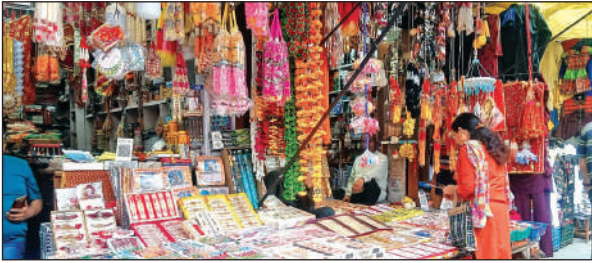
अल्मोड़ा की एक दुकान में सजी रंग-बिरंगी राखियां। ● अमृत विचार

अमृत विचार : अल्मोड़ा में रक्षाबंधन पर्व को लेकर बाजार रंग बिरंगी राखियों से सजने लगा है। एक से बढ़कर एक राखी बाजार में उपलब्ध हैं। युवा और बच्चों को राखी लुभा रही हैं। महिलाओं के लिए भी आकर्षक राखी आई हैं। त्योहार पर महंगी राखियों की मांग भी है। इनमें चंदन, तुलसी, चांदी, मोतियों की राखी शामिल है। रक्षाबंधन का त्योहार नौ अगस्त को मनाया जाएगा, तीन दिन शेष रह गए हैं। जिसके चलते राखियों का बाजार भी पूरी तरह से सज गया है। बहनें राखियां खरीदकर दूर रह रहे अपने भाईयों को पोस्ट भी कर रही हैं। बाजार में राखियों की बिक्री शुरू हो गई है। बाजार में दस रुपये