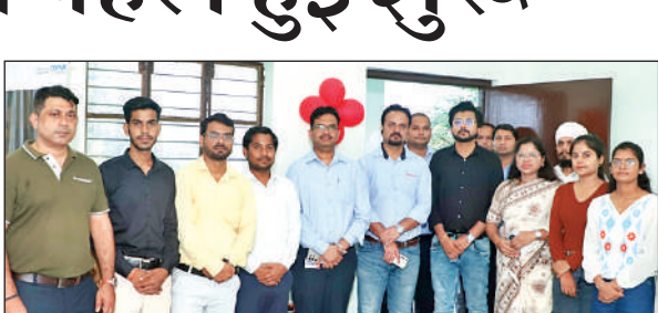
प्रशिक्षण सेंटर उद्घाटन के दौरान अतिथि। ● अमृत विचार

अमृत विचार : महिलाओं को आत्मनिर्भर बनाने के उद्देश्य से महिंद्रा एंड महिंद्रा व सेंटम फाउंडेशन ने कौशल विकास कार्यक्रम की पहल शुरू कर दी है और आदर्श कॉलोनी स्थित एक विद्यालय में प्रेरणा स्किल डेवलपमेंट सेंटर का शुभारंभ किया। जहां महिलाओं को रोजगार परक, प्रशिक्षण और कौशल विकास प्रदान करने का प्रशिक्षण दिया जाएगा। ताकि आर्थिक स्वतंत्रता