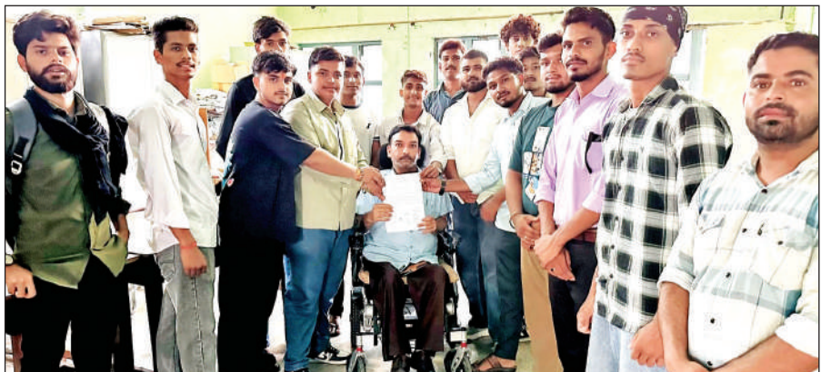
खटीमा में प्राचार्य को ज्ञापन सौंपते छात्र। ● अमृत विचार

बचाने के लिए भागने लगी और ट्रक चालक ने बगवाड़ा चौकी पहुंचकर अपनी जान बचाई। चश्मदीदों का कहना था कि आरोपी आबकारी