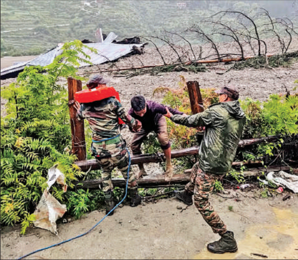
भूस्खलन और अचानक आई बाढ़ के बाद बचाव अभियान चल रहा है।