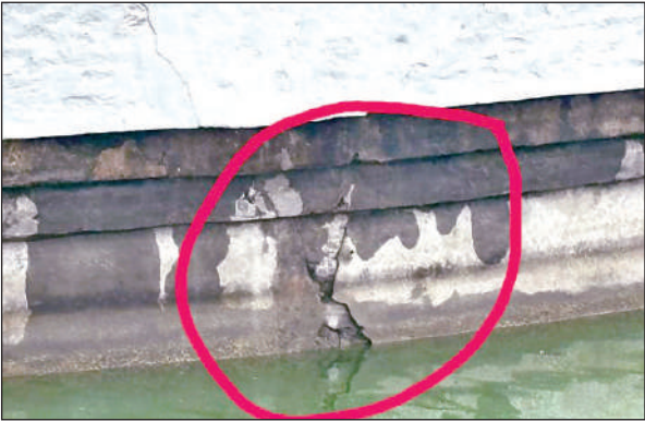
भीमताल डैम की दीवारों में पड़ी दरार।