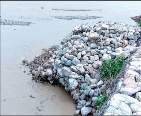
लालकुआं में बारिश से बहा तटबंध ।