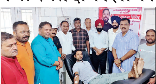
रक्तदान करते युवा।