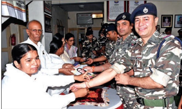
एसएसबी के जवानों को राखी बांधतीं ब्रह्माकुमारी विद्यालय की बहनें।