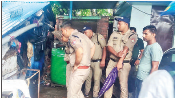
हत्यारोपी के घर के पीछे बनी गौशाला की तलाशी लेती पुलिस । ● अमृत विचार

पुलिस को हत्यारोपी की मां पर भी शक हल्द्वानी : पूरे मामले में एक ओर बात सामने आई है। बताया गया कि हत्यारोपी घर में अपने माता-पिता और भाई-भाभी के साथ रहता है। सोमवार को घटना से पहले हत्यारोपी का परिवार घर पर नहीं था। घर पर हत्यारोपी और उसकी मां ही थी। मां भी कुछ वक्त के लिए घास काटने गई थी, लेकिन सवाल यह है कि इस गधन्य हत्याकांड को अंजाम देने, दफनाने और शव के टुकड़ों को ठिकाने लगाने में कुछ घंटे लगे होंगे। ऐसे में इस बात का संभावना काफी कम है कि हत्यारोपी की मां को हत्या की जानकारी न हो। संभव है कि उसने अपने बेटे का साथ दिया हो।