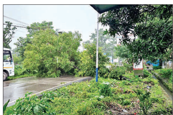
मुख्य मार्ग पर पेड़ गिरने से बाधित यातायात व्यवस्था।