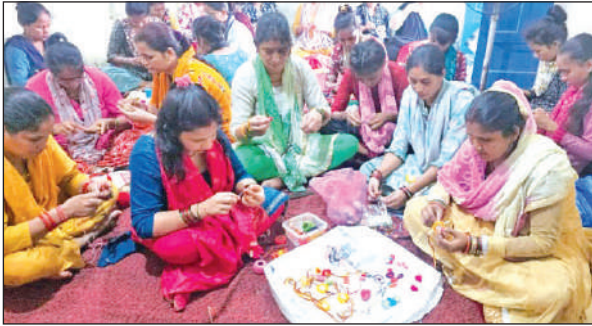
रामनगर में राखी बनाती महिलाएं। ● अमृत विचार

अमृत विचार: कुछ नया करने का हौसला अगर मन में हो तो ईंसान सफलता की सीढ़ियां खुद चढ़ना सीख जाता है। कुछ ऐसा ही करते आगे बढ़ रही हैं रामनगर की महिलाएं। जिन्होंने देवभूमि उत्तराखंड की संस्कृति और कला को आगे बढ़ाते हुए देश-दुनिया में अपनी अलग पहचान बनाई है। इसी परंपरा को आगे बढ़ाते राखियों को नया सांस्कृतिक रूप देकर न सिर्फ अपनी लोक कला को संजोया है, बल्कि उसे स्वरोजगार से भी जोड़ा है। यहां महिलाएं उन और कुरेशी कला की मदद से ऐसी राखियां बना रही हैं, जिनमें कुमाऊंकी संस्कृति की झलक साफ