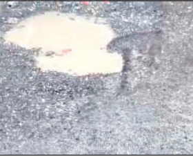
ब्लॉक रोड में हुए गड्ढे। ● अमृत विचार

स्थानीय निवासियों के मुताबिक उन्होंने इस संबंध में विधायक को भी कई बार प्रार्थना-पत्र भी दिए थे, लेकिन कोई कार्रवाई नहीं हुई। होटल कारोबारी और पूर्व मंडल