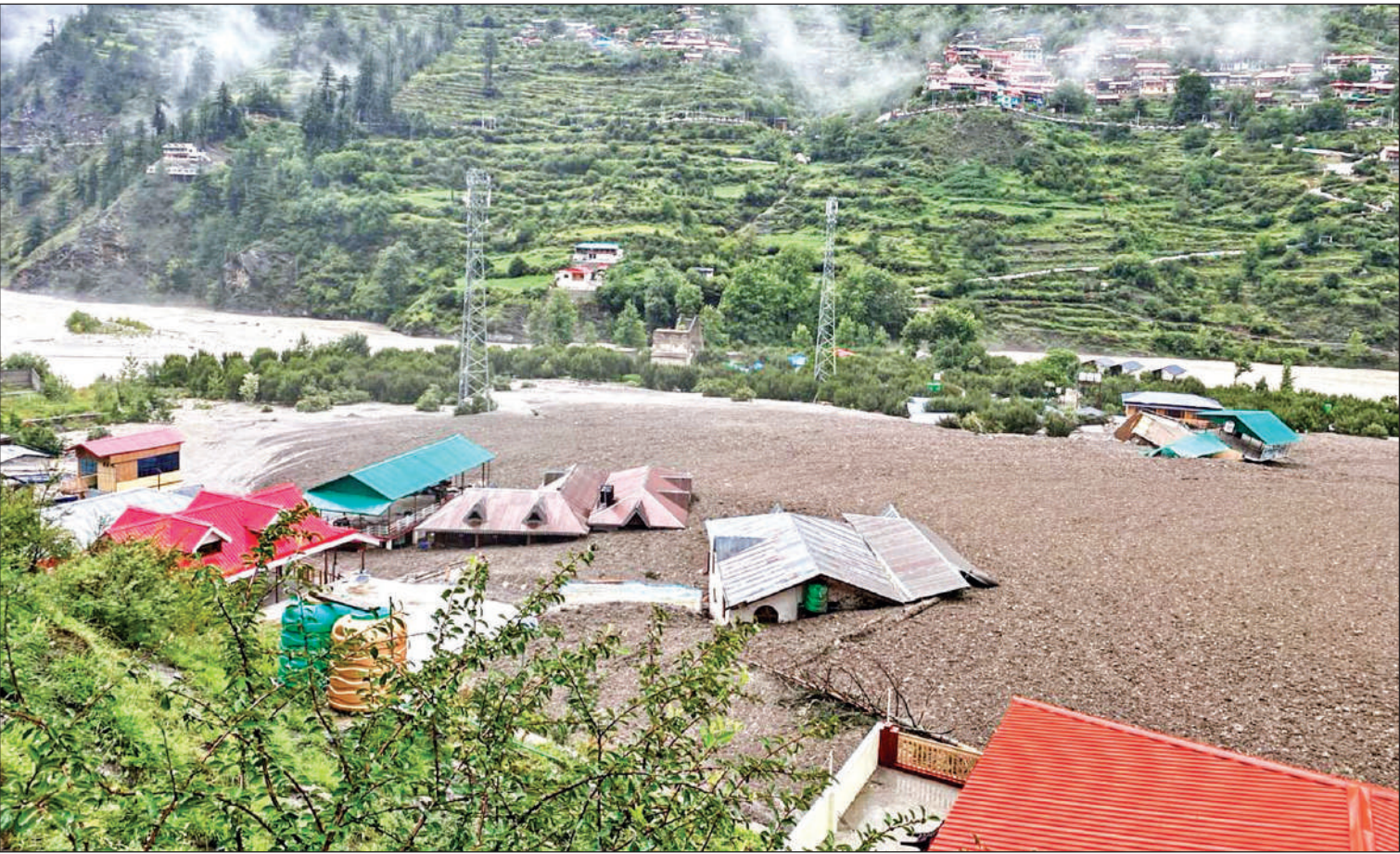
जल समाधि : उत्तरकाशी के धराली में खीर गाड़ क्षेत्र में बादल फटने से आई बाढ़ के बाद पूरा क्षेत्र देखते ही देखते मलबे और पानी ने समा गया।

निर्देश दिए। प्रभावित लोगों से संपर्क बनाए रखने के लिए जल्द से जल्द नेटवर्क व्यवस्था बहाल करने के निर्देश दिए। धराली एवं हर्षिल क्षेत्र में आपदा प्रभावितों तत्काल रेस्क्यू के बाद होटल, होमस्टे आदि में रहने, खाने तथा दवाइयों की व्यवस्था करने के निर्देश दिए। मुख्यमंत्री ने वरिष्ठ सैन्य अधिकारियों से हर्षिल क्षेत्र में बन रही झील को जल्द से जल्द खुलवाने की व्यवस्था करने के निर्देश दिए हैं।