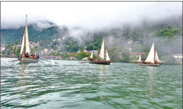
नैनी झील में अभ्यास करते एनसीसी कैडेट्स। ● अमृत विचार

अभियान मोस्ट इंटरप्राइजिंग नेवल यूनिट के तहत संचालित किया जा रहा है। जिसमें कैडेट्स आगामी 10 दिनों तक 280 घंटे से अधिक नौकायन अभ्यास करेंगे। यह शिविर कैडेट्स में नेतृत्व, टीम भावना, पर्यावरणीय चेतना और सामाजिक उत्तरदायित्व के मूल्यों का विकास कर रहा है। कमांडिंग