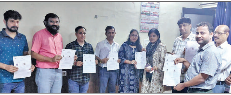
यूसीसी में पंजीकरण कराने के बाद सर्टिफिकेट दिखाते नगर निगम के अधिकारी-कर्मचारी ।

अमृत विचार : नगर निगम की ओर से समान नागरिक संहिता (यूसीसी) कानून के तहत विवाह पंजीकरण के लिए विशेष शिविर का आयोजन मंगलवार को नगर निगम परिसर में किया गया, जिसमें नगर निगम के समस्त अधिकारियों, कर्मचारियों सहित आम जनता ने यूसीसी में अपना पंजीकरण कराया। इस दौरान नगर आयुक्त ऋषा सिंह ने स्वयं पंजीकरण कर उदाहरण प्रस्तुत किया और उपस्थित लोगों को विवाह पंजीकरण प्रमाण पत्र वितरित किए। नगर आयुक्त ने बताया कि अब तक नगर निगम की ओर से लगभग 8500 विवाह पंजीकरण किए जा चुके हैं। नगर निगम के समस्त 60