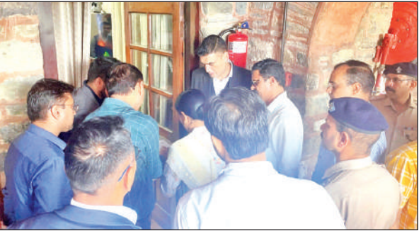
जिलाधिकारी कार्यालय में वीडियो रूम में जाते प्रत्याशी और हाईकोर्ट की कमेटेी।