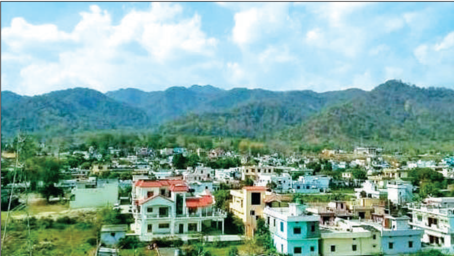
हल्द्वानी का दमवाढूंगा क्षेत्र। ● अमृत विचार

दमुवाढूंगा को अब नगर निगम में शामिल कर दिया गया है। इस क्षेत्र को लंबे समय से राजस्व ग्राम घोषित किए जाने की मांग उठ रही है। पूर्व में साल 2016 में इस क्षेत्र को राजस्व ग्राम घोषित कर दिया गया था लेकिन बाद में लेखपाल की रिपोर्ट के बाद कहा गया है कि यह क्षेत्र काफी घनी बस्ती है। इसलिए यहां पर सर्वे और सीमांकन का काम नहीं हो सकता है। इसके बाद मामला फिर से अटक गया। कोविड-19 महामारी काल बीतने के बाद यह मामला फिर से तेजी के साथ उठा। इधर पिछले दिनों प्रशासन ने दमुवाढूंगा क्षेत्र में कई जगह खाली पड़ी जमीनों पर कब्जे के बोर्ड लगा दिए। इससे लोगों में भय पैदा हुआ कि यहां गैर राजस्व भूमि पर सरकार कब्जा कर रही है। आबादी की बात करें तो दमुवाढूंगा के तीन वार्डों में 20 से 25 हजार की आबादी रहती है। यहां दमुवाढूंगा बंदोबस्ती भी क्षेत्र है जो राजस्व इलाका है।