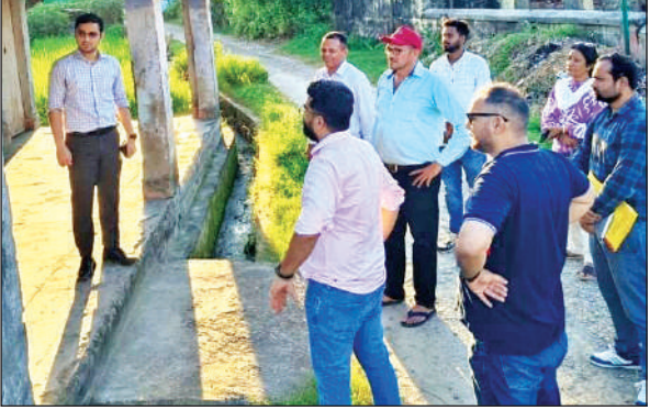
खटीमा के कुटरी स्थित खाली भवन का निरीक्षण करते सीडीओ और अन्य ।

मुकाबले अधिक जागरूक हो गए हैं। लेकिन क्या आपने कभी सोचा है कि हमारा खान-पान हमारे स्वास्थ्य पर कितना असर डालता है निःसंदेह 100 प्रतिशत।