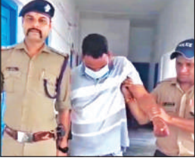
गिरफ्तार आरोपी के साथ पुलिस टीम ।