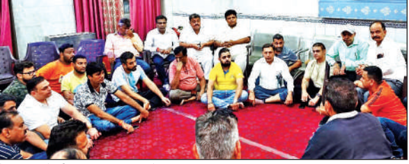
बैठक करते श्रीराम नाटक क्लब के कलाकार ।