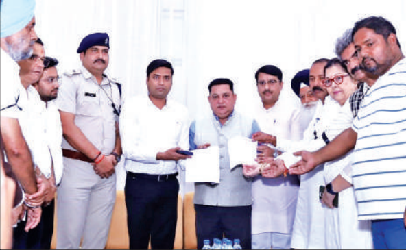
काशीपुर में प्रशासनिक अधिकारियों को ज्ञापन सौंपते शिक्षक।