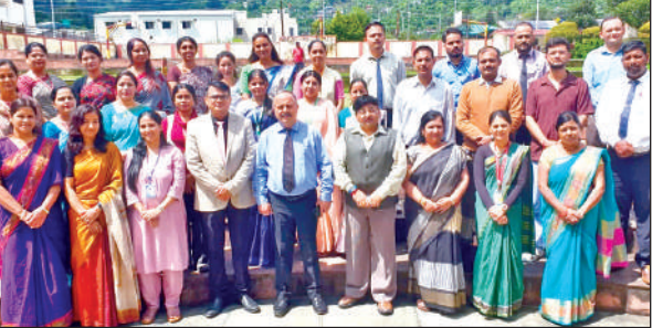
कैपेसिटी बिल्डिंग कार्यशाला में उपस्थित विभिन्न विद्यालय के शिक्षक। ● अमृत विचार