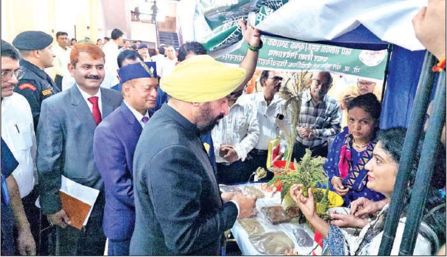
पंतनगर में आयोजित श्रीअन्न महोत्सव कार्यक्रम में स्टॉलों का निरीक्षण कर जानकारी लेते राज्यपाल ।

गुरुवार को कार्यक्रम के दौरान राज्यपाल ने कहा कि आज का यह महोत्सव केवल कृषि का उत्सव नहीं है। यह हमारे आहार, स्वास्थ्य, संस्कृति और जीवन दर्शन का उत्सव है। आजकल स्वास्थ्य हर व्यक्ति के लिए एक प्रमुख मुद्दा है, हर व्यक्ति स्वस्थ एवं फिट रहना चाहता है, इसके लिए कोई जिम जा रहा है, कोई सुबह की सैर करता है कोई योग करता है। सभी लोग पहले के