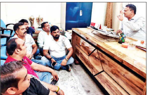
राज्य कर प्रवर्तन कार्यालय में धरना देते व्यापारी नेता।