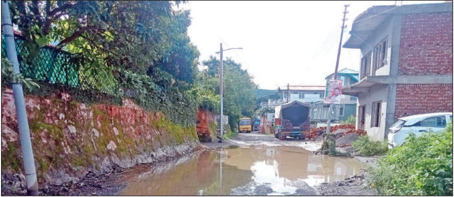
खस्ताहाल मार्ग पर हुआ जलभराव। ● अमृत विचार

मोटर मार्ग में जगह-जगह गड्डे होने की वजह से हजारों लीटर पानी सड़कों में जमा है। इतना ही नहीं इस पानी के अंदर जो सड़क है वह कितनी गहरी है इसकी भी जानकारी नहीं लग पा रही है। ऐसी स्थिति दुर्घटना होने की आशंका प्रबल हो गई है। लोक निर्माण विभाग भवाली