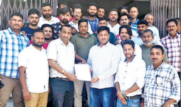
एआरटीओ को ज्ञापन देते ट्रांसपोर्टर। ● अमृत विचार

ज्ञापन में ट्रांसपोर्टरों ने कहा कि ट्रांसपोटर मालिक अपने वाहनों की फिटनेस आरटीओ कार्यालय में ही कराते थे, लेकिन कुछ समय से यह फिटनेस सेवा बंद कर दी गई है। वाहनों की फिटनेस रामनगर में न हो पाने की वजह से वाहन स्वामियों को बहुत नुकसान हो रहा है। फिटनेस कराने के लिए वाहन को लेकर हल्द्वानी जाना पड़ रहा है। इसमें अनावश्यक पैसे और समय की बर्बादी हो रही है। एक दिन में