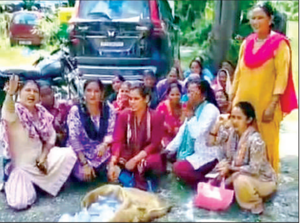
कच्ची शराब के साथ प्रदर्शन करती महिलाएं। ● अमृत विचार

अमृत विचार: नई बस्ती हनुमानगढ़ी क्षेत्र में महिलाओं ने एकजुट होकर अवैध शराब बेचने वालों से कच्ची शराब जब्त कर ली। महिलाओं के तेवर देखते हुए अवैध शराब विक्रेता कच्ची शराब छोड़कर मौके से फरार हो गए। गुस्साई महिलाओं ने अवैध शराब बेचने वाले कारोबारियों की गिरफ्तारी और अवैध शराब के धंधे को बंद कराने की मांग को लेकर पुलिस चौकी पर प्रदर्शन भी किया। महिलाओं का आरोप है कि मालधन में अवैध शराब को रोकने में प्रशासन असमर्थ है। उन्होंने शराब नहीं रोजगार को के नारे लगाते हुए मालधन क्षेत्र में अवैध रूप से जगह जगह बिक रही कच्ची व पक्की शराब को तत्काल रोकने