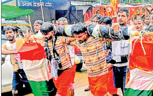
कांवड़ लेकर जाते कांवड़िये।

सावन को लेकर अब लोगों में पहले जैसा उल्लास नजर नहीं आता। संयुक्त परिवार के स्थान पर एकल परिवार की बढ़ती मानसिकता व छोटे होते घरों के कारण झूले जैसी पुरानी परंपराएं अब दम तोड़ रही हैं।