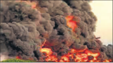
रूस के सोची में तेल डिपो से उठते धुएं के गुबार।