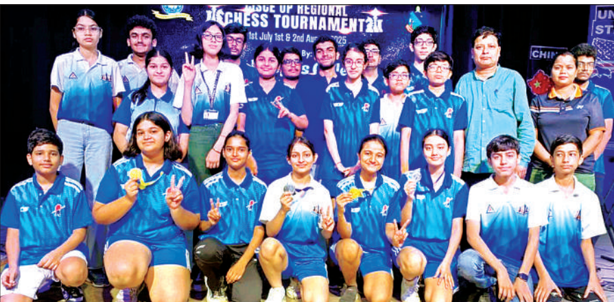
रीजनल शतरंज में शानदार प्रदर्शन करने वाले खिलाड़ी।