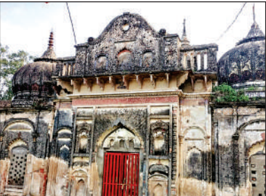
तातमऊ गांव के ठाकुरद्वारा मंदिर का मुख्य द्वार।

अमृत विचार: राजस्थानी शैली में निर्मित तातमऊ गांव का ठाकुर द्वारा मंदिर रखरखाव के अभाव में जीर्ण-शीर्ण होता जा रहा है। यह मंदिर करीब 200 साल पुराना है। ठाकुरद्वारा मंदिर में स्थापित अष्टधातु की राम भगवान, सीता माता व लक्ष्मण की मूर्तियां करीब पचास वर्ष पूर्व चोरी चली गई। इसके बावजूद मैथा तहसील के तातमऊ गांव से होकर निकलने वाले लोगों का ध्यान बरबस ही यह मंदिर अपनी तरफ ध्यान खींचता है। राजस्थानी शैली में निर्मित