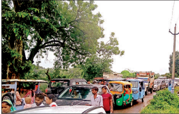
शिवराजपुर में लगा भीषण जाम।