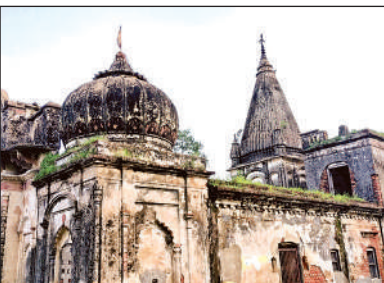
मुख्य मंदिर पर लगी प्राचीन ध्वजा।