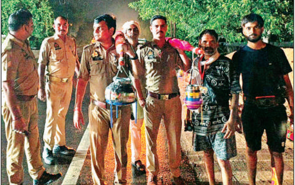
कांवड़ लेकर जाते पुलिस कर्मी।