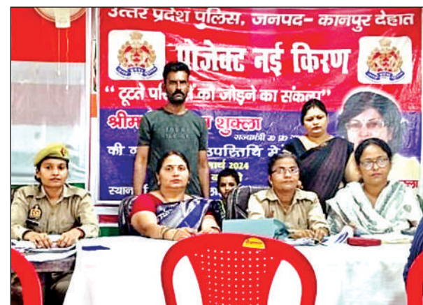
नई किरण में सुनवाई करती महिला पुलिस कर्मी व सदस्य।