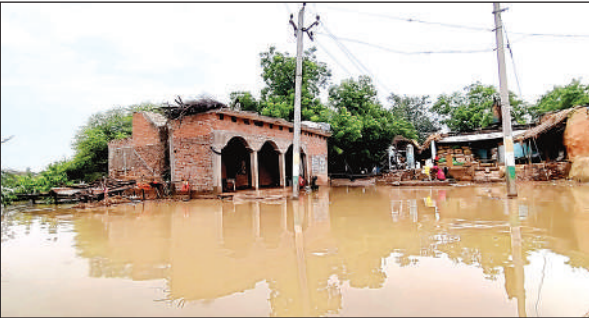
बाढ़ के पानी से घिरे महादेवा गांव के मकान।

उन्होंने कहा कि लगातार वर्षा के कारण जनपद के कई गांव बाढ़ की चपेट में हैं, जिनमें किसी भी स्थिति में राहत व बचाव कार्यों में कोई कोताही नहीं होनी चाहिए। उन्होंने निर्देश दिए कि जनपद स्तर पर स्थापित नियंत्रण कक्ष 24 घंटे सक्रिय रहे और किसी भी प्रकार की सूचना पर तत्काल कदम उठाया जाए। जिन कर्मचारियों की तैनाती बाढ़ चौकियों पर की जाए, उनकी उपस्थिति शत-प्रतिशत सुनिश्चित