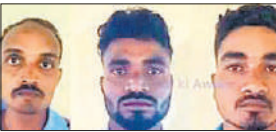
पकड़े गए आरोपी।

यह घटना लगभग 15 दिन पहले हुई थी, जिसमें कई बच्चे बीमार पड़ गए थे, हालांकि किसी की जान जाने