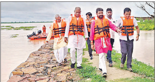
बलिया में बाढ़ प्रभावित क्षेत्र का निरीक्षण करते मंत्री दयाशंकर दयालु व अन्य।

इन इलाकों में बाढ़ से 84,392 लोग प्रभावित हैं, जिनमें से 47,906 लोग ऐसे हैं, जिन्हें राहत सहायता प्रदान की गई है। वहीं बाढ़ की वजह से 2,759 मवेशियों को