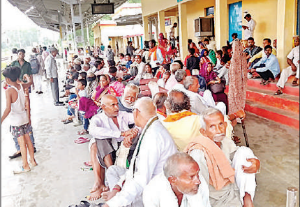
गंगाघाट स्टेशन पर ट्रेनों का इंतजार करते यात्री।

अमृत विचार: जैतीपुर रेलवे स्टेशन पर चल रहे मरम्मत कार्य के चलते रविवार को पांचवे दिन भी रेल संचालन प्रभावित रहा। सुबह नौ बजे से दोपहर डेढ़ बजे तक रेलवे ट्रैक पर ब्लॉक लगने के कारण ट्रेनों की आवाजाही पूरी तरह से ठप रही। दोपहर करीब पौने दो बजे वंदे भारत एक्सप्रेस के साथ रेल संचालन शुरू हुआ, जिसके बाद शताब्दी एक्सप्रेस, नीलांचल एक्सप्रेस सहित अन्य ट्रेनों को प्राथमिकता के आधार पर रवाना किया गया। इस कार्य के कारण सबसे अधिक परेशानी मेमो पैसेंजर ट्रेन के विलंब से चलने से हुई,