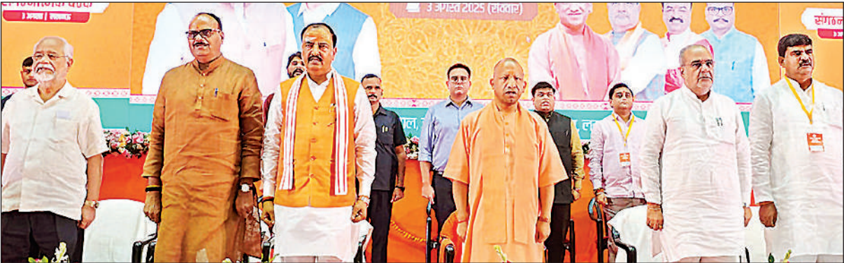
लखनऊ में आयोजित भाजपा की संगठनात्मक बैठक में उपस्थित मुख्यमंत्री योगी, प्रदेश अध्यक्ष भूपेंद्र सिंह चौधरी, उप मुख्यमंत्री केशव मोर्य व ब्रजेश पाठक और अन्य।

मुख्यमंत्री रविवार को इंदिरा गांधी प्रतिष्ठान में आयोजित भाजपा की संगठनात्मक बैठक में