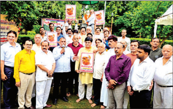
मोतीझील में राष्ट्रकवि को नमन किया गया।