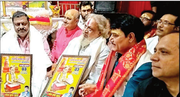
तुलसी जयंती पर सम्मान समारोह हुआ।