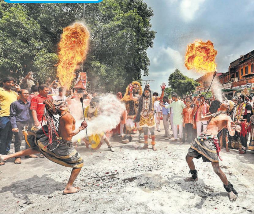
जयपुर में रविवार को कांवड़ यात्रा के दौरान कई कलाकार हेरतअंगेज प्रदर्शन करते हुए गुजरें। सड़कों पर उन्हें देखने के लिए भीड़ लग गई। श्रावण मास में कांवड़ यात्रा के दौरान ऐसे करतब दिखाने वाले कलाकार लोगों को खूब लुभा रहे हैं।

इस्लामाबाद। पाकिस्तान और ईरान ने अपने भौगोलिक क्षेत्र और दूरी की छूट का लाभ उठाते हुए द्विपक्षीय व्यापार को सालाना आठ अरब डॉलर तक बढ़ाने पर सहमति जताई। दोनों देशों के व्यापार मंत्रियों ने आर्थिक और राजनीतिक संबंधों को गहरा करने के लिए चर्चा की। यह समझौता ईरानी राष्ट्रपति मसूद पेजेशकियन की पाकिस्तान यात्रा के दौरान वाणिज्य मंत्री जाम कमाल खान और ईरानी उद्योग, खान एवं व्यापार मंत्री मोहम्मद अताबाक के बीच हुई बैठक के दौरान हुआ। पेजेशकियन शनिवार दोपहर लाहौर पहुंचे और शाम को राजधानी के लिए रवाना हुए।