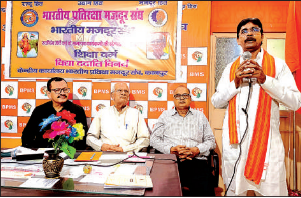
भारतीय प्रतिरक्षा मजदूर संघ कार्यालय में दी गई जानकारी।