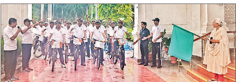
राजभवन से साइकिल जागरूकता रैली को हरी झंडी दिखाकर रवाना करतीं राज्यपाल आनंदी बेन पटेल।

अमृत विचार, लखनऊ : कस्तूरबा गांधी विद्यालयों में पौधारोपण व स्वच्छता अभियान 'एक पेड़ मां के नाम 2.0' के तहत रविवार को राजभवन से उन्नाव के लिए दो दिवसीय साइकिल रैली को रवाना किया गया। राज्यपाल आनंदीबेन पटेल ने हरी झंडी दिखाकर रैली को रवाना किया। अभियान के तहत राजभवन के अधिकारियों-कर्मचारियों की टीम उन्नाव के कस्तूरबा गांधी आवासीय बालिका विद्यालय में पौधारोपण व साफ-सफाई से संबंधित कार्यों में शामिल होगी। देर शाम राजभवन के अधिकारियों ने बताया कि टीम उन्नाव में गौरा कंठेरवा, नवागंज व आदमपुर बरेली हसनगंज स्थित कस्तूरबा गांधी आवासीय बालिका विद्यालय पहुंची व पौधारोपण व साफ-सफाई अभियान में शामिल हुई। कुल 100 पौधे रोपित किये गये। इन पौधों में जामुन, छितवन, मौलसी, सहजन, नीम, बॉटल ब्रश, आंवला आदि शामिल हैं।