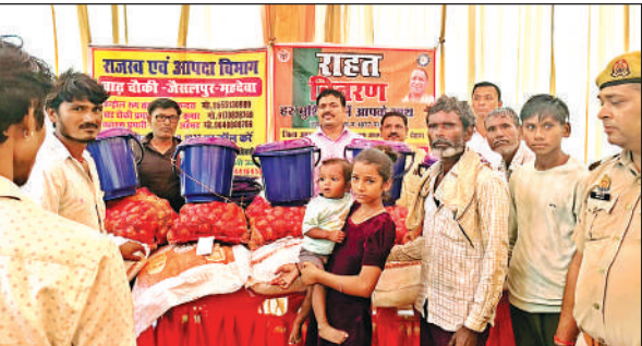
बाढ़ पीड़ितों को खाद्य सामग्री देते राजस्व कर्मी।