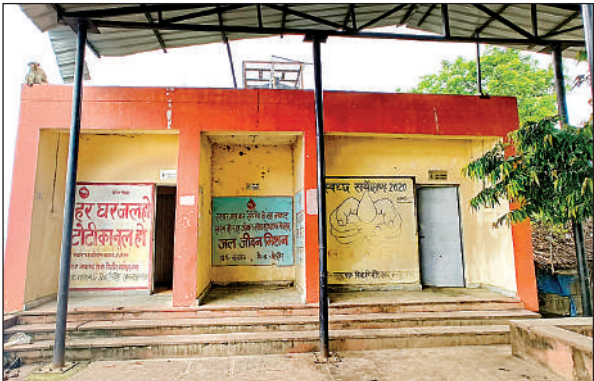
खराब पड़ा शौचालय।

अमृत विचार। बिल्हौर के नानामऊ गंगा घाट पर चारों तरफ गंदगी ही गंदगी है। गंदगी के चलते यहां आने वाले श्रद्धालु बहुत परेशान होते हैं। सोमवार के दिन, जब लाखों की संख्या में भक्त गंगा स्नान के लिए यहां पर आते हैं, तब भी घाट पर बने शौचालयों की हालत बद से बदतर रहती है। सावन के पवित्र महीने में भी 'नमामि गंगे' योजना का मजाक उड़ाया जा रहा है और जिम्मेदार अधिकारी इस ओर कोई ध्यान नहीं दे रहे हैं। केवल नानामऊ नहीं बल्कि अकबरपुर सेग और सरैया घाट की भी हालत वैसी ही है। सावन के महीने में लाखों श्रद्धालु हरदोई ,उन्नाव ,मिथिख