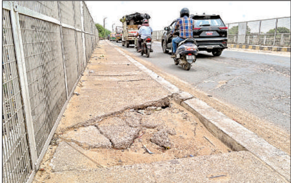
पनकी धाम पुल का फुटपाथ टूट रहा है।

शहर से करीब दो लाख से अधिक वाहन कालपी रोड होते हुए भौंती हाईवे की तरफ जाते हैं। इन वाहनों को कालपी रोड से भौंती हाईवे पर पहुंचने के लिए करीब 50 वर्ष पुराने पनकी धाम स्टेशन पुल से होकर गुजरना