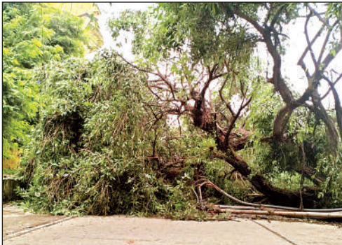
जूही खलवा पुल पर पेड़ गिरने से रास्ता हुआ बंद, टूटे बिजली के तार।