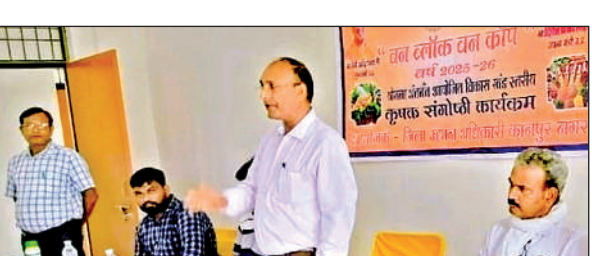
किसानों को संबोधित करते अतिथि।

चंपतपुर गांव स्थित राजकीय पौधशाला में आयोजित गोष्ठी में मुख्य अतिथि के रूप में मौजूद कानपुर मंडल के उपनिदेशक