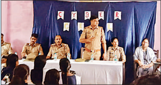
बच्चों को साइबर क्राइम के बारे में जानकारी देते अधिकारी। अमृत विचार

करते हुए प्रथम व द्वितीय स्थान के लिए छात्राओं को चुना। बाद में प्रधानाचार्य ने बताया कि