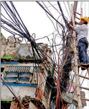
सीसामऊ बाजार में बिजली मरम्मत का कार्य।

शहर के बाबूपुरवा, योगेंद्र विहार, गोविंद नगर, गंगागंज, नवाबगंज, साकेत नगर, रतन लाल नगर, बर्रा दो, बंबा रोड कल्यानपुर, बर्रा विश्व बैंक सी ब्लॉक, किवदई नगर के ब्लॉक, आवास विकास हंसपुरम, बारासिरोही, यशोदा नगर, आर्य नगर, कर्नलगंज, खलसी लाइन, शिवकटरा, जूही, श्याम नगर, देहली सुजानपुर, पीएसी मोड व सीसामऊ बाजार