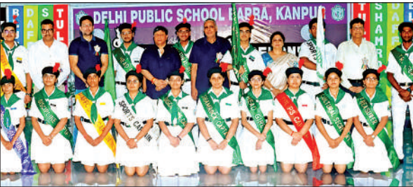
डीपीएस बर्रा में मौजूद छात्र-छात्रा पदाधिकारी।