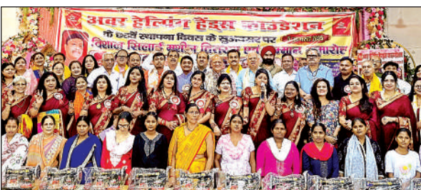
अवर हेलिपॉर्ट हैंड्स फाउंडेशन का स्थापना दिवस मनाया गया।

छात्रों और शोधार्थियों को नवाचार और व्यवहारिक अनुभव के अवसर भी प्रदान करेगी। यह समझौता सीएसजेएम विश्वविद्यालय को रक्षा अनुसंधान और स्वदेशी तकनीकी नवाचार में एक नई पहचान देगा और आत्मनिर्भर भारत के सपने को साकार करने की दिशा में एक ठोस पहल सिद्ध होगा। कार्यक्रम