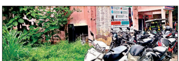
अस्पताल में खड़ी घास-फूस।