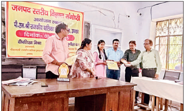
प्रमाणपत्र व स्मृति चिह्न देते निर्णायक मंडल के सदस्य व प्रधानाचार्या। अमृत विचार

क्वांटम युग का आरम्भ, सम्भावनाएं व चुनौतियां विषय पर