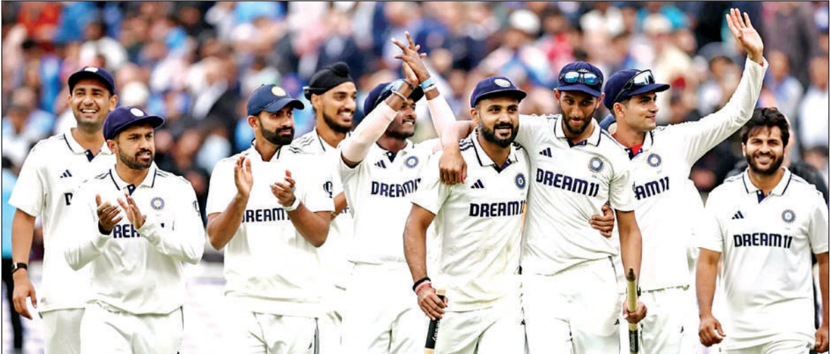
इंग्लैंड के खिलाफ पांचवां व अंतिम मैच जीतने के बाद जश्न मनाते भारतीय टीम के युवा खिलाड़ी।

भारत ने दो मैच गंवाए, लीड्स में पहला मैच और लॉड्स में तीसरा टेस्ट। इन मैच में भी भारत जीत सकता था, लेकिन यही वह सबक है जो युवा खिलाड़ियों को मिला है। भारतीय टीम की सबसे बड़ी विशेषता यह रही कि उसने किसी भी मैच में आखिर तक हार नहीं मानी और दो मैच में शानदार वापसी की। इससे टीम के जज्बे का पता चलता है। इस श्रृंखला में