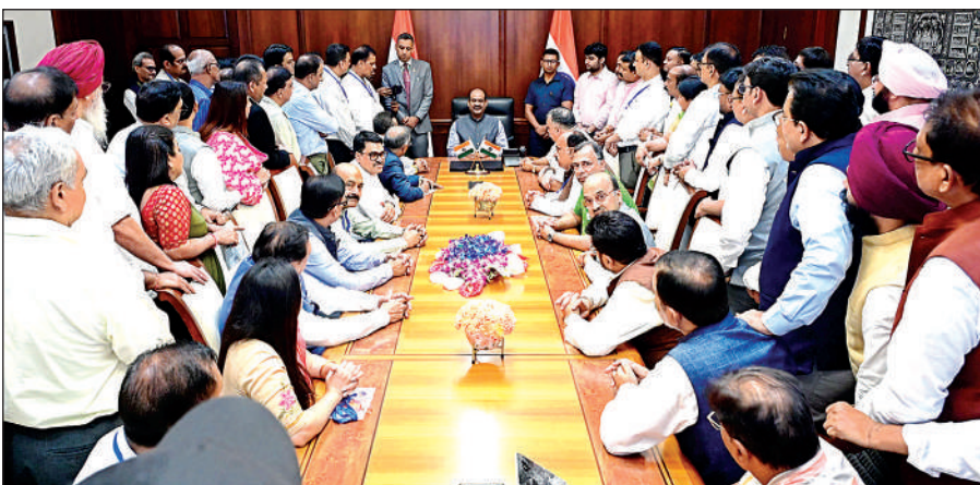
नई दिल्ली में लोकसभा अध्यक्ष से मुलाकात करते व्यापारी।

लिए प्रयासरत रहना चाहिए। उन्होंने प्रधानमंत्री नरेंद्र मोदी के