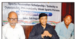
जानकारी देते पदाधिकारी।

छठे सत्र के आवेदन पत्रों का वितरण 25 जुलाई से चालू है। सात अगस्त से चयन ट्रायल होगा। 13 अगस्त से एए प्रशिक्षण सत्र की शुरुआत होगी। संस्थान में बच्चों को दस प्रमुख