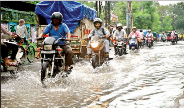
शहर के दिल मालरोड पर भी जलभराव।

गड्ढे बने परेशानी के सबब: जीटी रोड सहित पूरे शहर की सड़कों के छोटे-बड़े गड्ढे भी इस बारिश के मौसम में परेशानी का सबब बने हुए हैं। जीटी रोड में तेजाब मिल कैपस मोड़ से जरीब चौकी की तरफ, अनवरगंज डाकखाना के पास, द्वारिकापुरी ढाल से गुमटी रोड, कोकाकोला चौराहे से गोल चौराहे की तरफ, रावतपुर मेट्रो स्टेशन, गीतानगर, गुरुदेव चौराहे से कल्याणपुर मेट्रो स्टेशन तक जगह-जगह गड्ढों में पानी भरा रहा। इससे सवहन सवारों को आवगमन में दिक्कत हुई। कई दुपहिया वाहन सवार इन गड्ढों में जाकर गिर भी गए।