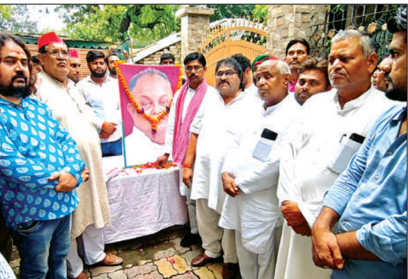
समाजवादी नेता जनेश्वर मिश्र की जयंती मनाते सपाईं।