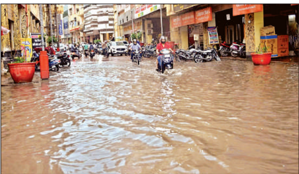
सबसे पॉश इलाके बिरहाना रोड में भी पानी भरा।