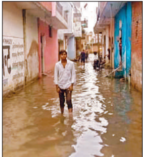
कंचन नगर बी की गली में जलभराव।

कंचन नगर, कंचन नगर बी, सर्वोदय नगर व कृष्णा नगर में हालात सबसे खराब हैं। यहां लगभग सौ से अधिक घरों के सामने घुटनों तक गंदा पानी जमा हो गया है। जल निकासी की उचित व्यवस्था न होने के कारण बारिश रुकने के कई घंटे बाद भी गलियों में पानी भरा रहा।