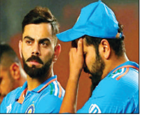
विराट कोहली व रोहित शर्मा।

इससे सवाल उठता है कि टी20 और टेस्ट क्रिकेट से संन्यास लेने