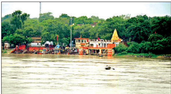
गंगा का जलस्तर तेजी से बढ़ रहा है।

आने वाले दिनों में गंगा नदी में तेजी से पानी बढ़ने की संभावना है। हालांकि इसमें 5 दिन लगेंगे। इसको देखते हुए अधिकारियों ने तैयारी शुरू कर दी है। मंगलवार की बात करें तो गंगा के अपस्ट्रीम पर 113.050 मीटर पानी दर्ज किया गया। वहीं, डाउनस्ट्रीम में