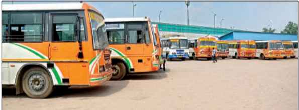
झकरकटी बस अड्डेपर खड़ी बसें।