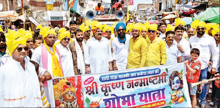
शोभा यात्रा में शामिल लोग।