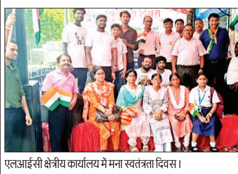
एलआईसी क्षेत्रीय कार्यालय में मना स्वतंत्रता दिवस।