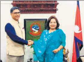
विदेशमंत्री आरजू राणा मिले विक्रम मिसरी।