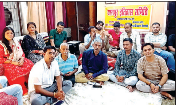
संगोष्ठी में मौजूद इतिहासकारों ने चर्चा की।