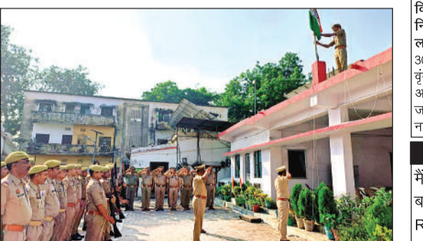
थाना परिसर में होता ध्वजारोहण।