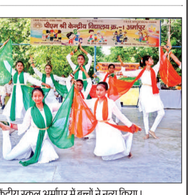
केंद्रीय स्कूल अर्मापुर में बच्चों ने नृत्य किया।