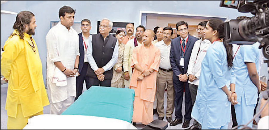
गोरखपुर में रीजेंसी हॉस्पिटल का लोकार्पण करने के बाद उपलब्ध सुविधाओं की जानकारी लेते मुख्यमंत्री योगी।

मुख्यमंत्री योगी रविवार को गोरखपुर में निजी क्षेत्र के रीजेंसी हॉस्पिटल के लोकार्पण के बाद समारोह को संबोधित कर रहे थे। उन्होंने हॉस्पिटल का निरीक्षण कर सुविधाओं का जायजा भी लिया। साथ ही, हॉस्पिटल के पेशेंट एप