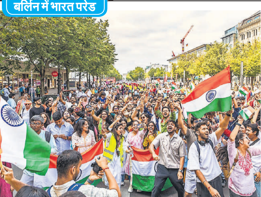
भारत का 79वें स्वतंत्रता दिवस का उत्सव दुनिया के कई और देशों में भी मनाया गया। बर्लिन के ब्रैंडेनबर्ग गेटन में रविवार को भारतीय समुदाय के लोगों ने पूरे जोशोखरोश के साथ भारत परेड निकाली।