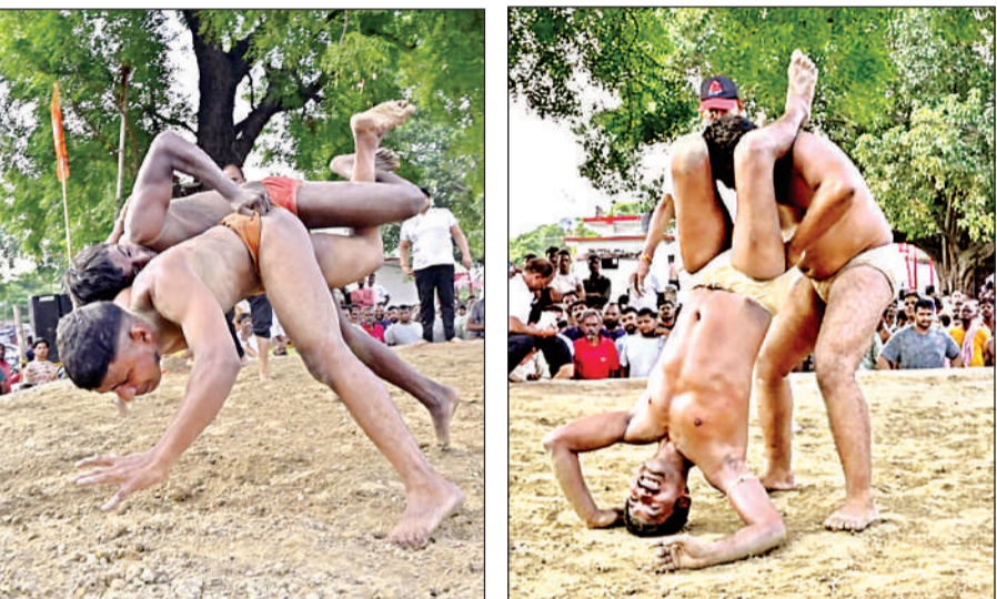
अर्मापुर की विश्वनाथ व्यायामशाला में पहलवानों ने जोर –आजमाईश की।