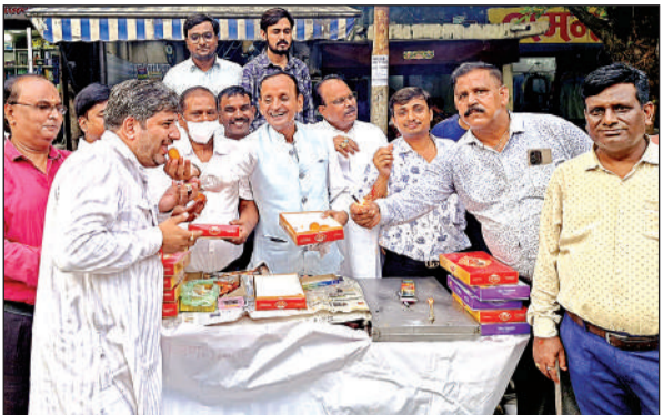
व्यापारियों ने मिठाई बांटी।