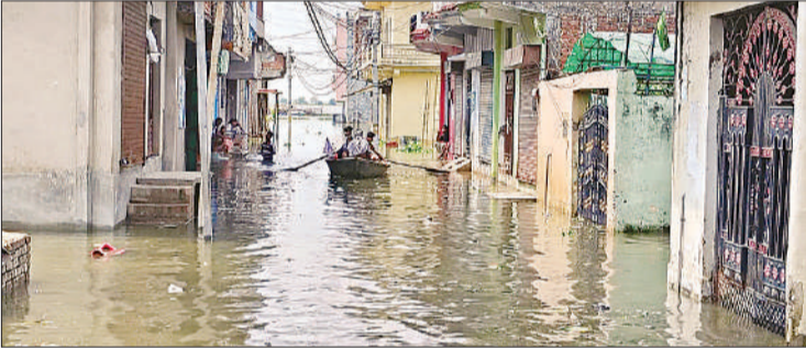
बाढ़ प्रभावित क्षेत्र की गली में चलती नाव।