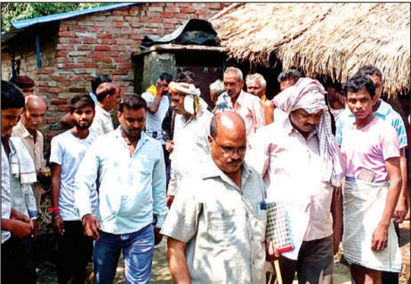
मृतका के घर के बाहर लगी लोगों की भीड़।