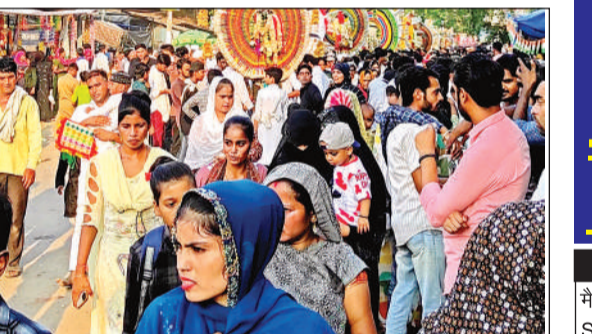
जुलूस में मौजूद लोग।

हजरत इमाम हुसैन व उनके 72 साथियों की शहादत के 40वें दिन मनाये जाने वाले चेहल्लुम पर रविवार को दोपहर कस्बा स्थित जामा मस्जिद से उठा सवारी व ताजियों का जुलूस कस्बे की विभिन्न गलियों से भ्रमण करता हुआ बिदूर रोड तिराहा पहुंचा।