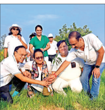
पौधरोपण करते आईएमए के पदाधिकारी।