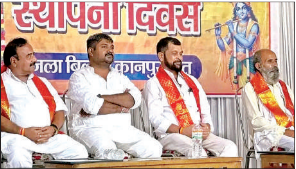
कार्यक्रम में मौजूद लोग।