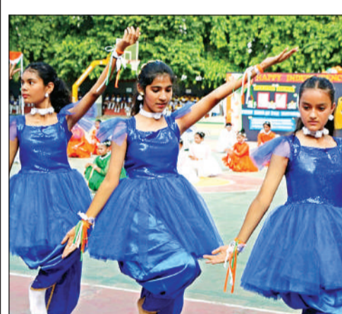
मर्सी मेमोरियल स्कूल में बच्चों ने डांस किया।