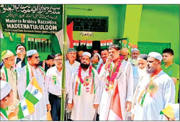
मदरसे में राष्ट्रगान गाया गया।