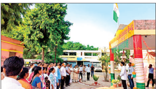
ध्वजारोहण के बाद राष्ट्रगान की मुद्रा में खड़े लोग।