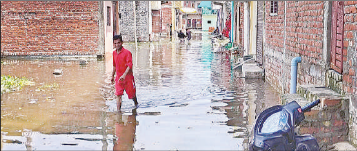
चंपापुरवा के निचले इलाके में बाढ़ के पानी से निकलता युवक।

बैराज बांध से पानी छोड़े जाने के कारण शनिवार रात करीब दो बजे गंगा का जलस्तर खतरे का निशान 113 मीटर तक पहुंच गया। जिसके बाद रविवार सुबह आठ बजे गंगा का जलस्तर 113.030 मीटर मापा गया। उफनाई गंगा के कारण नगर व ग्रामीण क्षेत्रों के सैकड़ों मकान जलमग्न हो गए हैं। जिस कारण नेतुआ, सरैयां में पानी पहुंचने लगा है। वहीं श्री नगर, रविदास नगर, गंगा नगर के भी हालात काफी खराब हैं यहां भी मकानों में पानी भर चुका है। वहीं ग्रामीण इलाकों के नेतुआ, गगनी खेड़ा, अलालोंक नगर, रतीरामपुरवा, झब्बू पुरवा, गुरी पुरवा, सोलह बीघा, कटरी पीपरखेड़ा के सैकड़ों मकान बाढ़