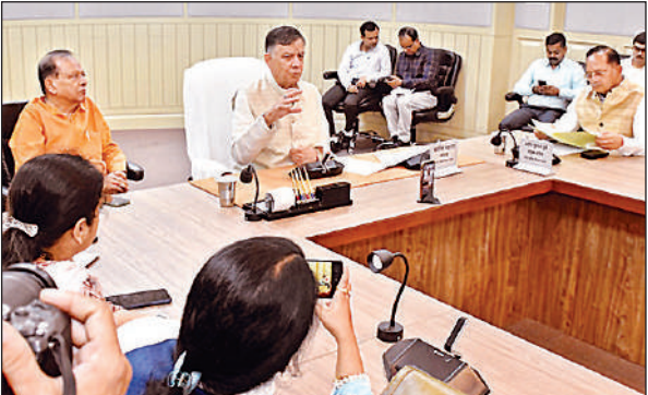
विधान भवन में पत्रकारों से वार्ता करते विधानसभा अध्यक्ष सतीश महाना।

सोमवार को विधानभवन में पत्रकारों से मुखातिब राज्य विधानसभा अध्यक्ष सतीश महाना ने कहा कि उप्र. अठारहवीं विधानसभा का वर्ष 2025 का द्वितीय सत्र अपने रचनात्मक विमर्श और अनुशासित कार्यवाही के लिए स्मरणीय बन गया। इस सत्र में विकसित भारत-विकसित उत्तर प्रदेश, आत्मनिर्भर भारत-आत्मनिर्भर उत्तर प्रदेश, विषय पर लगातार दो दिनों तक निरंतर चर्चा हुई, जिसने लोकतांत्रिक परंपरा को और अधिक मजबूती मिली।