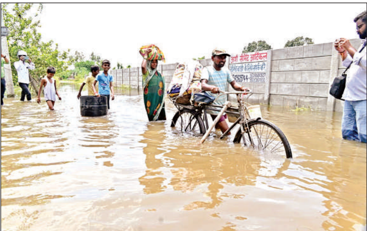
चैनपुरवा में ग्रामीण गृहस्थों का सामान लेकर पलायन कर रहे हैं।