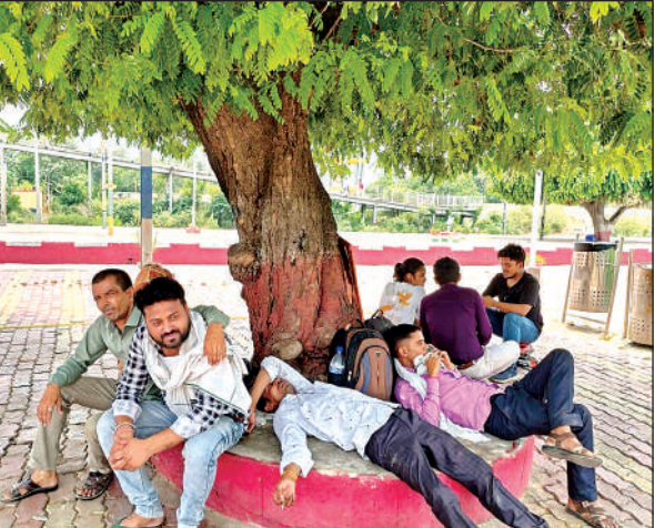
रूरा स्टेशन में पेड़ की छांव में बैठकर ट्रेन का इंतजार करते यात्री । अमृत विचार

मौसम बार-बार करवट बदल रहा है। पिछले तीन दिन से तेज धूप से लोगों के साथ ही पशु-पक्षी भी बेहाल हो रहे हैं। कुछ स्थानों पर बूँदा-बांदी होने व तेज धूप निकलने से उमसभरी गर्मी से लोग बेचैन हो रहे हैं। बारिश के महीने में भी झमाझम बारिश का लोगों को