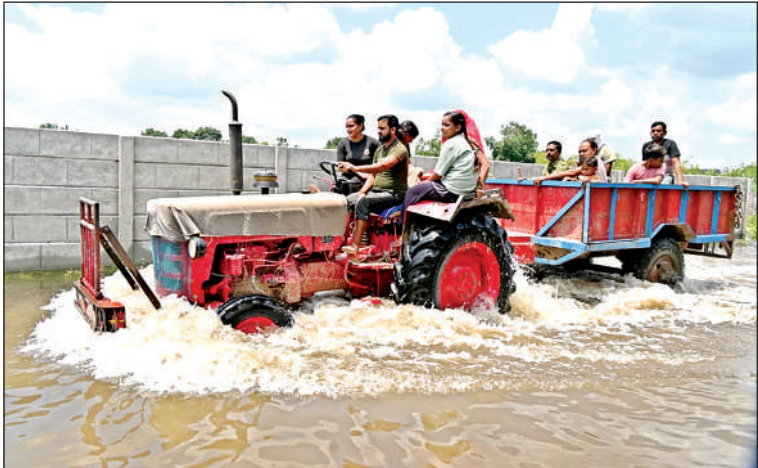
गंगा कटरी के गांवों में पानी घुस गया है।

घंटाघर से टाटमिल ब्रिज के समानान्तर एक और ब्रिज बनाने की योजना प्रस्तावित है। ऐसे में रेलवे चाहता है कि समानान्तर ब्रिज का निर्माण आरंभ होने से पहले तीनों अतिरिक्त प्लेटफार्म पर काम शुरू हो जाए।