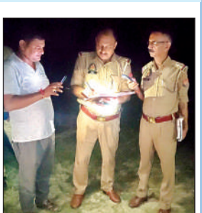
मौके पर जांच करती पुलिस ।