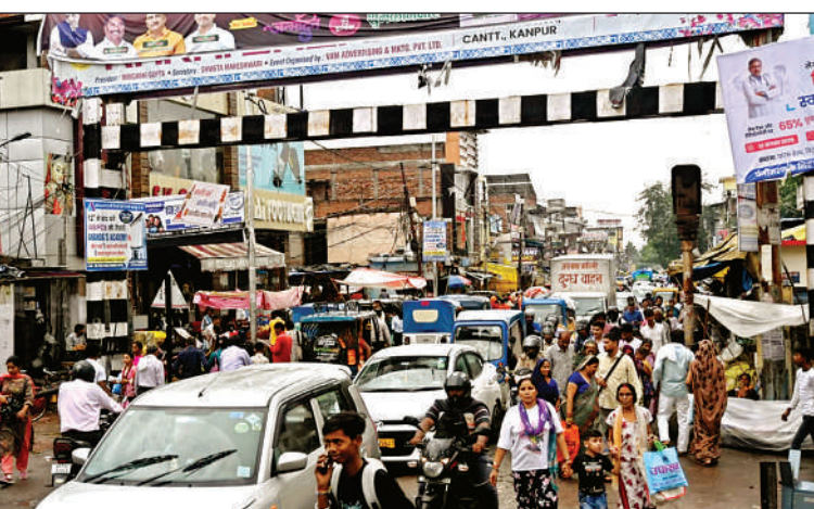
कल्याणपुर क्रासिंग पर रोज जाम लगता है। इससे बाजार खत्म हो रहा है।

■ गंगा का जलस्तर बैराज पर रविवार को 114.75 मीटर था। सोमवार को 114.76 मीटर दर्ज किया गया। इसमें 24 घंटे में एक सेंटीमीटर की बढ़त हुई है। जलस्तर अभी खतरे के निशान 115 मीटर से सिर्फ 24 सेंटीमीटर दूर है। नरीरा से एक लाख 28 हजार 716 और हरिद्वार से एक लाख 48 हजार 108 क्यूसेक पानी आया। बैराज के सभी 30 गेट खुले हैं। सोमवार को यहां से चार लाख 26 हजार 854 क्यूसेक पानी छोड़ा गया।