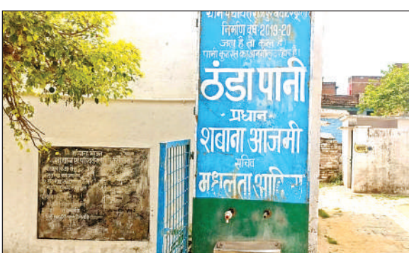
जलापूर्ति नहीं होने से शोपीस बना प्राइमरी स्कूल का वाटर कूलर ।