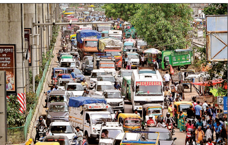
कल्याणपुर जीटी रोड पर लगा जाम।