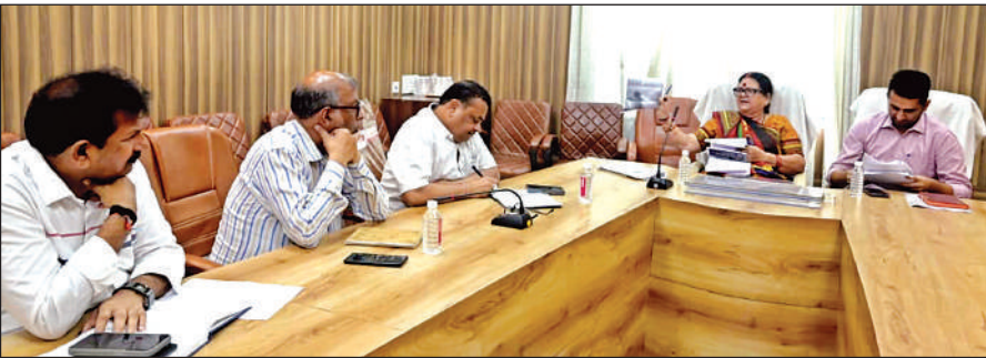
नगर निगम समिति कक्ष में बैठक करती महापौर और नगर आयुक्त।