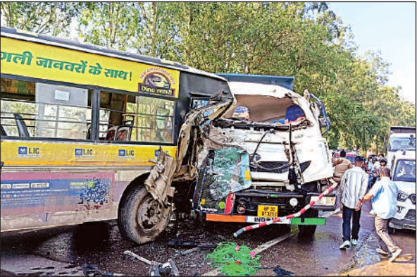
दुर्घटना के बाद क्षतिग्रस्त खंड डंपर और बस।

अमृत विचार। बिल्हौर तहसील क्षेत्र में इन दिनों किसानों को खाद के लिए भारी परेशानियों का सामना करना पड़ रहा है। जो प्राइवेट दुकानदार पहले अधिक मुनाफे के चलते खाद बेच रहे थे, उन्होंने अब हाथ पीछे खींच लिए हैं। इसका सीधा असर किसानों पर पड़ रहा है, जिन्हें अब खाद के लिए पूरी तरह से साधन सहकारी समितियों पर निर्भर रहना पड़ रहा है। इन समितियों पर अचानक उमड़ी किसानों की भारी भीड़ से वहां अव्यवस्था का माहौल है। आलम यह है कि बिल्हौर व ककवन विकासखंड क्षेत्र के तमाम समितियों पर पुलिस लगाकर खाद बंटवानी पड़ रही है। स्थानीय