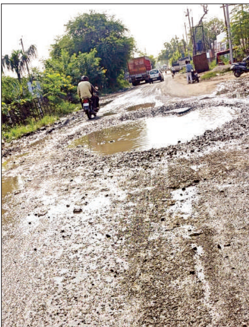
भैलामऊ भीमसेन जाने वाली सड़क पर बड़ा गड्ढा है।