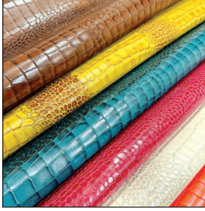
लेदर उत्पाद का होता है निर्यात।

शहर से अमेरिका के बाजार में लगभग 25 सौ करोड़ का कारोबार होता है। इनमें 60 फीसदी कारोबार लेदर के उत्पादों का है। लेदर के उत्पादों में लगभग 20 फीसदी उत्पाद छोटे उत्पादों की श्रेणी में आते हैं। निर्यातक इसी सेमेंट में लेदर और सिंथेटिक लेदर मिक्स