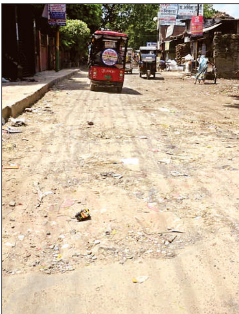
लकड़मंडी रोड गांव की पगड़ंडी जैसी है।

■ घंटाघर चौराहे से कलक्टरगंज रोड कानपुर के ऐतिहासिक और व्यापारिक केंद्रों में से एक रही है। घंटाघर शहर के समय का प्रतीक था और कलक्टरगंज रोड इस चौराहे से जुड़ती है, जो एक महत्वपूर्ण व्यावसायिक क्षेत्र है। वर्तमान में घंटाघर चौराहे से कलक्टरगंज तक सड़क की हालत खराब है, जहां गड्ढे हैं, जिससे बचने के लिए वाहन धीमी गति से गुजरते हैं और इस वजह से इस मार्ग पर दिनभर जाम के हालात रहते हैं। यहां अन्य जिलों व प्रदेश से आने वाले लोग सड़कों की हालत और जगह-जगह गंदगी देखकर कानपुर स्मार्ट सिटी के दर्जे पर सवालिया निशान छोड़ते हैं।