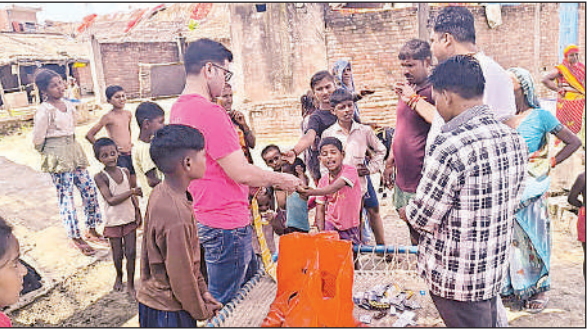
बाढ़ प्रभावित क्षेत्रों में ग्रामीणों को दवाएं बांटती स्वास्थ्य टीम ।