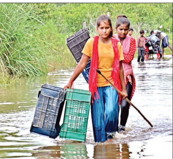
गांवों में पानी भरने के कारण आवागमन में भारी दिक्कत है।

बिदूर विधायक और उप जिलाअधिकारी ने ट्रैक्टर और नाव से बाढ़ प्रभावित क्षेत्र का दौरा किया। भोपालपुरवा और भगवानदीनपुरवा के कई परिवार परिवारों ने शहर में अन्य जगहों पर रह रहे अपने रिश्तेदारों के घर शरण लेना शुरू कर दिया है। वहीं बाढ़ पीड़ितों ने गंगा बैराज पर अपने पालतू पशुओं के लिए टेंट लगाना शुरू कर दिया है।