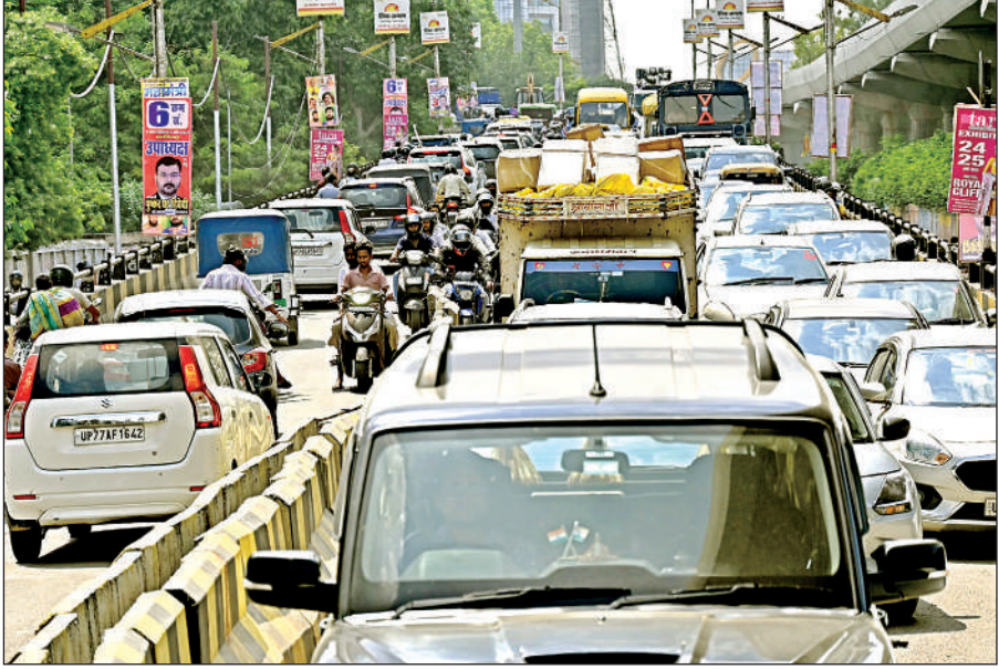
हैलट पुल पर दोपहर में ही लगा रहा जाम।

शास्त्री नगर पुलिस पर चौराहे का सुंदरीकरण हो रहा है। इसकी वजह से चौराहा पर जगह कम हो गई है। जेके टैपल, शास्त्री नगर, डबलपुलिया और नीरक्षीर चौराहे से आ रहे वाहन सवार चौराहे पर फंस जा रहे हैं। सुबह और शाम के समय पर स्थिति बिगड़ रही है।