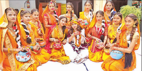
राधा कृष्ण की वेश भूषा में बैठे महते के छात्र ।