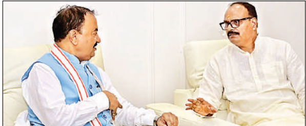
उप मुख्यमंत्री केशव प्रसाद मोर्य के लखनऊ स्थित सरकारी आवास पर मुलाकात करने पहुंचे उप मुख्यमंत्री ब्रजेश पाठक। अमृत विचार

सोमवार को मुख्यमंत्री योगी आदित्यनाथ के दोनों उप मुख्यमंत्री की मुलाकात हुई। यह मुलाकात केशव प्रसाद मोर्य के लखनऊ स्थित सरकारी आवास पर उप मुख्यमंत्री