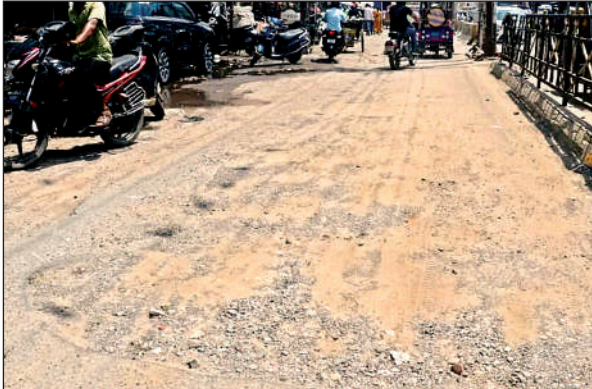
घंटाघर चौराहे से कलक्टरगंज जाने वाली रोड उखड़ गई है।

कानपुर। आजादी का जश्न 15 अगस्त को सभी अफसरों ने धूमधाम से मनाया लेकिन शहरवासी बर्बाद सड़कों से आजादी मिलने की राह देख रहे हैं। महीनों हो गए टूटी सड़कों पर झटके खाते लेकिन सड़कों के भाग्य नहीं जागे। जिन सड़कों पर प्रतिदिन लाखों