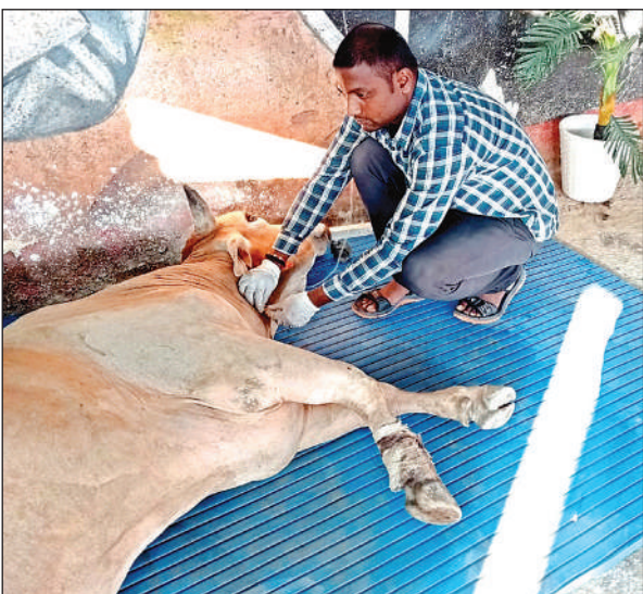
वेटनरी हास्पिटल में गोवंश का इलाज होता है।