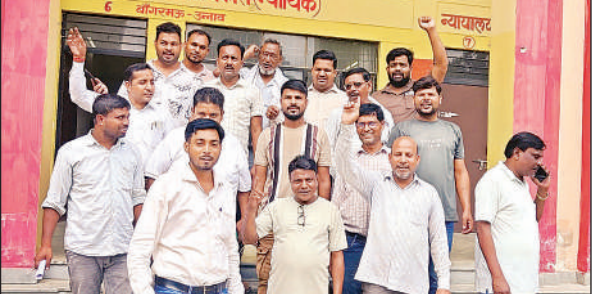
तहसील से बाहर निकलते सभासद ।

जिलाधिकारी ने अधिकारियों को निर्देशित किया कि आईजीआरएस सरकार की प्राथमिकताओं में है । इसकी गंभीरता को समझते हुए विशेष रुचि लेकर लंबित संदर्भों का निस्तारण गुणवत्तापूर्ण करें । उन्होंने कहा कि यह सुनिश्चित किया जाए कि डिफाल्टर होने से पहले ही संदर्भों का निस्तारण हो जाए । शिकायत के निस्तारण से शिकायतकर्ता संतुष्ट होना चाहिए ।