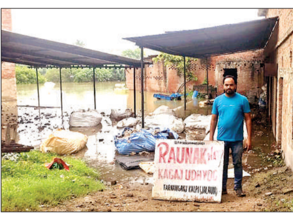
कागज फैक्ट्री में भरा बाढ़ का पानी।