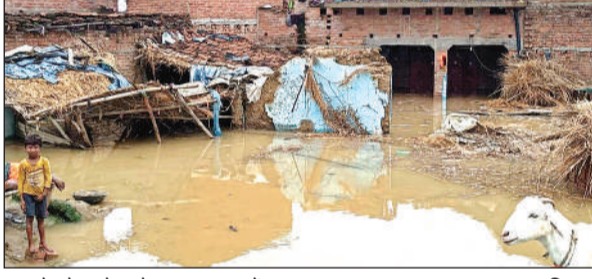
बाढ़ से डूबे कच्चे पक्के मकान व छत में रखा सामान।

यमुना खतरे के निशान से साढ़े तीन व बेतवा ढाई मीटर ऊपर बह रही, घरों में भर गया पानी