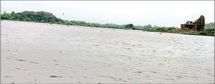
उफनाता शहर का मदन सागर सरोवर।

अमृत विचार। इस साल जोरदार बारिश के चलते जिले के अधिकांश तालाब उफना गए हैं। तालाबों के बंधों को टूटने से बचाने के लिए सिंचाई विभाग द्वारा नहरों को खोलकर पानी निकाला जा रहा है। इससे दूसरे तालाब नहरों के जरिये भर रहे हैं। यही वजह है कि इस साल जिले के बांध और तालाब उफान पर हैं। शहर के बीचो बीच बने चंदेल कालीन मदन सागर सरोवर के उफना जाने से तालाब के उत्तर दिशा सिंचाई विभाग ने खतरे के निशान के ऊपर पानी आने से पहले ही मदन सागर नहर को खोलकर कीरत सागर में पानी भरना शुरू कर दिया है। लेकिन बंधान के