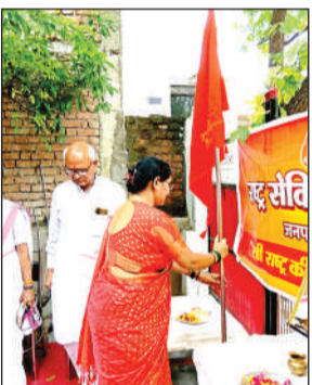
भगवाध्वज लगाती स्वयंसेविका।