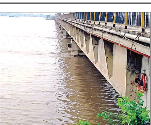
यमुना नदी का बढ़ा हुआ जल स्तर।

प्रभावितों को भोजन कराया जा रहा है। इसके अतिरिक्त बाढ़ प्रभावित ग्रामीणों के साथ आए पशुओं के लिए चारा एवं भूसे की समुचित व्यवस्था