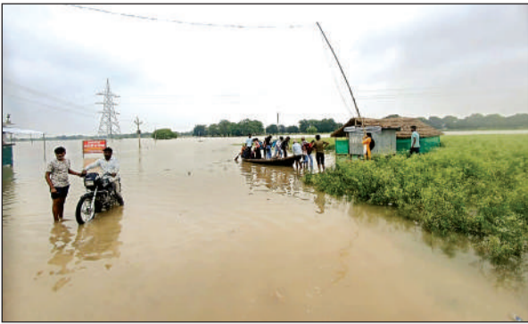
सरधुआ- अर्की मार्ग पर भरे पानी से निकलते लोग।