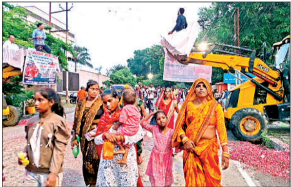
जेसीबी से शिव भक्तों व कांवड़ियों पर पुष्प वर्षा करते भक्त।

कांवड़ियों ने कन्नौज जनपद की सीमा में प्रवेश करने के बाद महादेवी गंगाजी घाट पर आस्था की डुबकी लगाई। उसके बाद पैदल, दोपहिया, चौपहिया वाहनों के अलावा ट्रैक्टर-ट्रॉलियों में बैठकर श्रद्धालु शहर पहुंचे। यहां तिर्वा क्रांशिंग होते हुए सदर ब्लॉक के निकट मार्ग से सिद्धपीठ बाबा गौरीशंकर में कांवड़ियों में जल अर्पित किया।