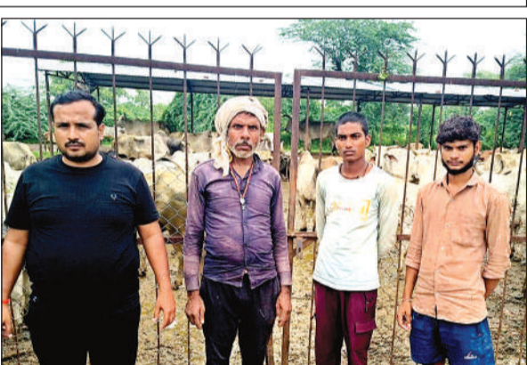
गौशाला में मवेशी बंद किए गए।