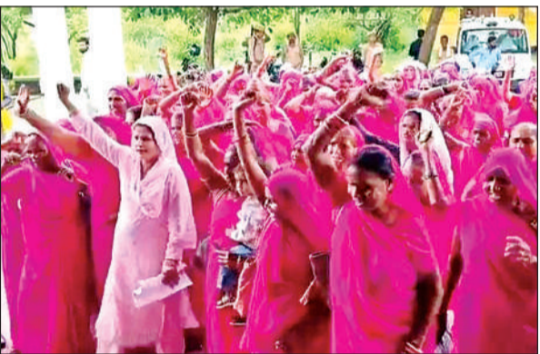
सड़कों पर प्रदर्शन करती गुलाबी गैंग।