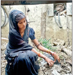
गिरे घरों को दिखाती महिला।