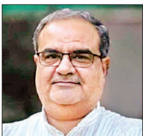
भूपेंद्र सिंह चौधरी, प्रदेश अध्यक्ष, भाजपा

मानसिकता के खिलाफ हर मंच पर लड़ाई लड़ी जाएगी। उन्होंने कहा कि समाजवादी पार्टी जब सत्ता में थी, तब भी उसने बच्चों के भविष्य के साथ खिलवाड़ किया और आज भी कर रही है। पाठशाला में भी उनकी सोच