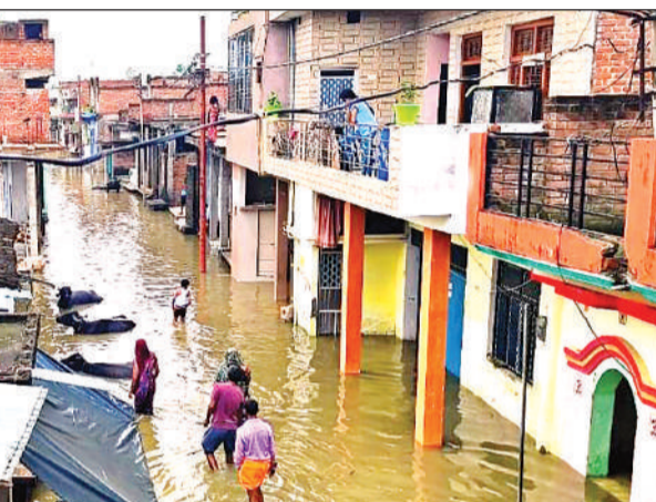
डिग्गी मोहल्ले में लोगों के घरों में भरा पानी।