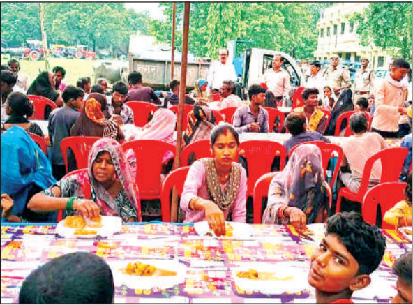
बाढ़ राहत शिविर में भोजन करते बाढ़ पीड़ित।

चुस गया है। लोग अपना सामान व मवेशी लेकर राहत शिविरों में पहुंच गए हैं।