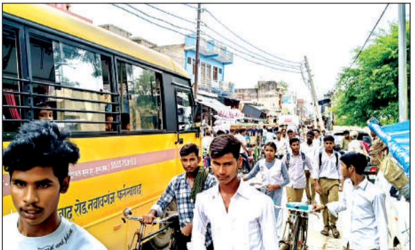
मुख्य बाजार से बस निकलती हुई।