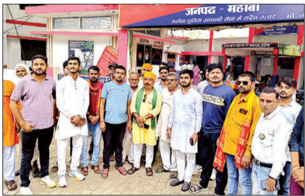
कोतवाली में विरोध जताते क्षत्रिय।

●यूट्यूब पर प्रसारित एक गीत से खड़ा हुआ विवाद