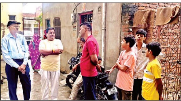
हादसे की जानकारी पर घर के बाहर मौजूद मोहल्ले के लोग।