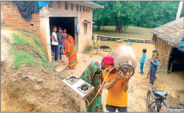
बाढ़ की आशंका से घर से सामान लेकर सुरक्षित स्थान पर जाते ग्रामीण।