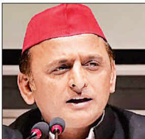
अखिलेश यादव, राष्ट्रीय अध्यक्ष, सपा

अमृत विचार : भाजपा के प्रदेश अध्यक्ष भूपेंद्र सिंह चौधरी ने सहारनपुर में समाजवादी पार्टी द्वारा शुरू की गई ‘पीडीए पाठशाला’ में बच्चों को ‘ए फॉर अखिलेश यादव’ और ‘डी फॉर डिंपल यादव’ जैसे पाठ पढ़ाए जाने की कड़ी निंदा की है। उन्होंने इसे बच्चों की कोमल मन में राजनीतिक विष घोलने की साजिश करार देते हुए कहा कि यह शिक्षा नहीं, समाजवादी ब्रेनवॉश है। चौधरी ने शुक्रवार को स्पष्ट किया कि बच्चों की शिक्षा को राजनीति की प्रयोगशाला नहीं बनने दिया जाएगा और इस विकृत