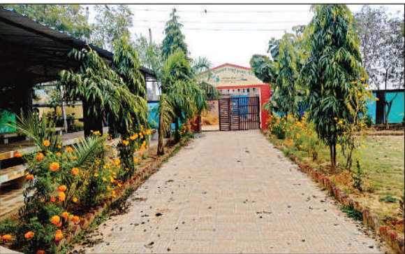
पूर्व माध्यमिक विद्यालय चंदई का हाल।

गया है। आयेंदितन तारों के शार्ट सर्किट होने से चिंगारियां निकलती हैं, जिससे बच्चे सहम जाते हैं। बताया कि बिजली विभाग, शिक्षा विभाग के अधिकारियों को मामले से अवगत कराया जा चुका है पर अब तक निदान नहीं मिला। इसी