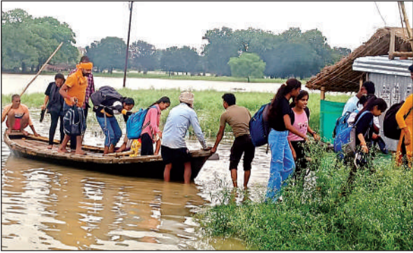
सड़क पर भरा पानी तो चलने लगी नाव।

गुरुवार की रात से अचानक यमुना और पयस्वनी नदियों का जलस्तर 10 सेमी प्रति घंटे की रफ्तार से बढ़ने लगा। इससे घाटों और तलहटी पर बसे गांव-मजरों के लोगों के माथे पर चिंता की लकीरें दिखने लगी हैं। सरधुआ-अर्की मार्ग जो तिरहार क्षेत्र का प्रमुख मार्ग है, पर अतैरौली, नैनी, धौरहरा, बरद्वारा, चांदी, धुमाई, बक्टा, हस्ता, बेलास, चिल्लीमल गांव-मजरों के लोगों का आवागमन होता है। इस पर दस बारह फिट पानी सड़क के ऊपर से बह रहा है। मैदानी क्षेत्र में बोई हुई खरीफ की फसल बाढ़ के चलते जलमग्न हो गई है। राजापुर-कमासिन मार्ग पर भी डेढ़ से दो फिट पानी सड़क के ऊपर बह रहा है। इससे छोटे बड़े वाहनों के साथ पंदेल निकलना